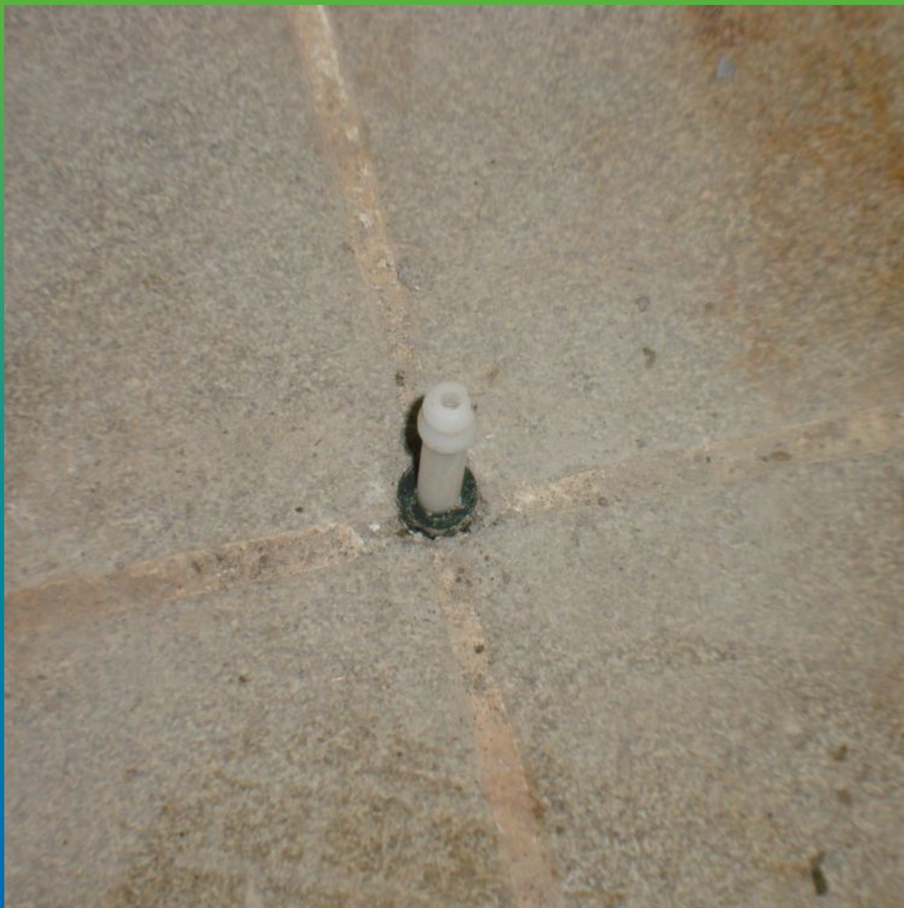
Монтаж пакеров высокого давления в пол