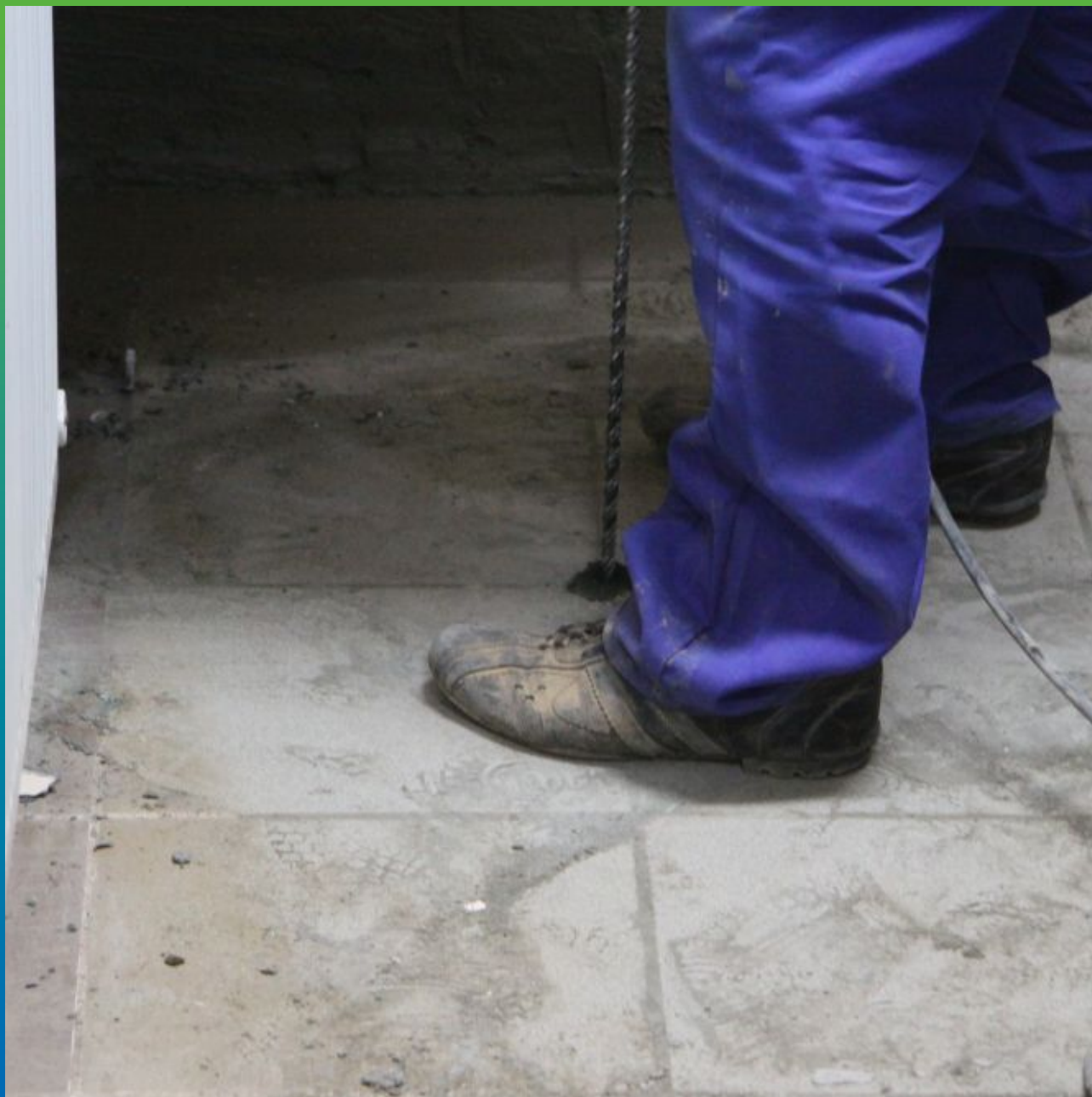
Устройство шпуров под пакера в полу