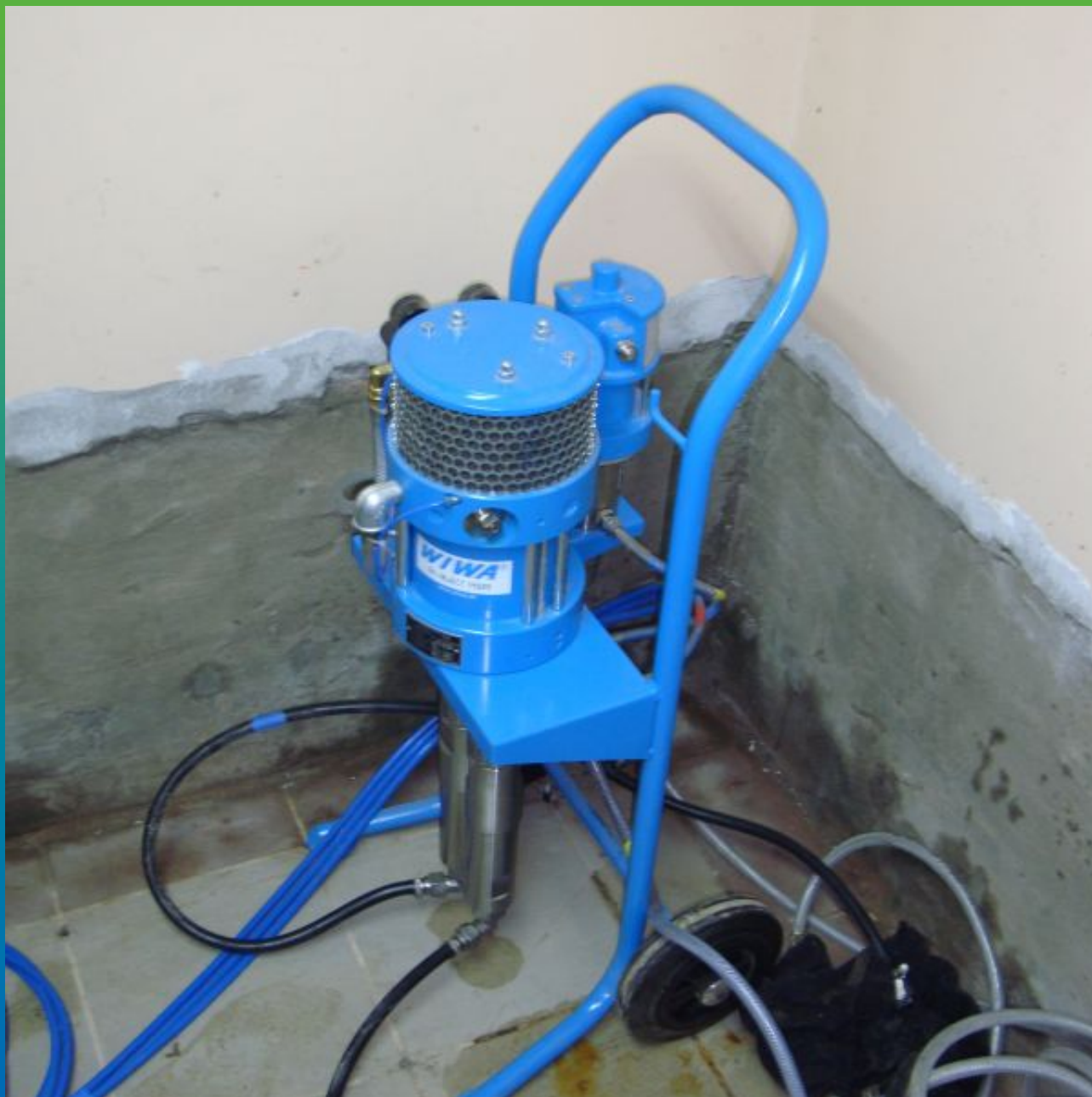
Инъектирование акрилатного геля Манокрил Гель В, насос БМ 1425