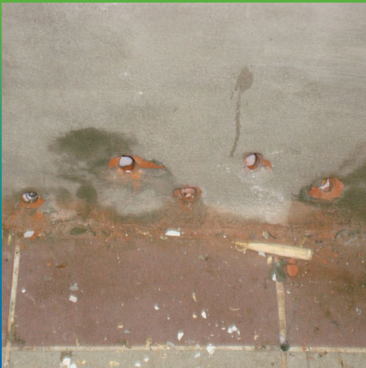
Вид после инъектирование акрилатного геля, удаление пакеров