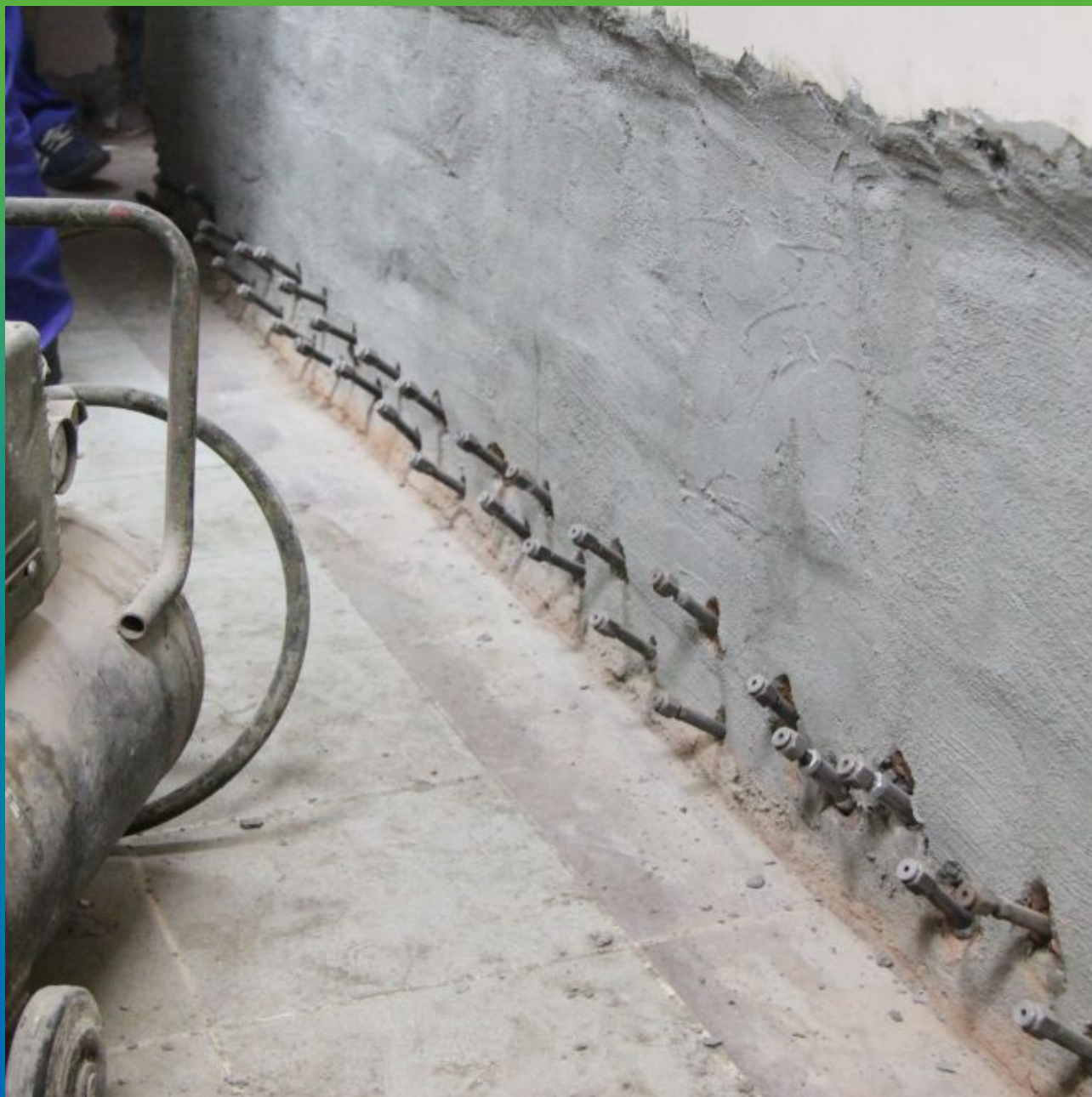
Монтаж пакеров для отсечной гидроизоляции