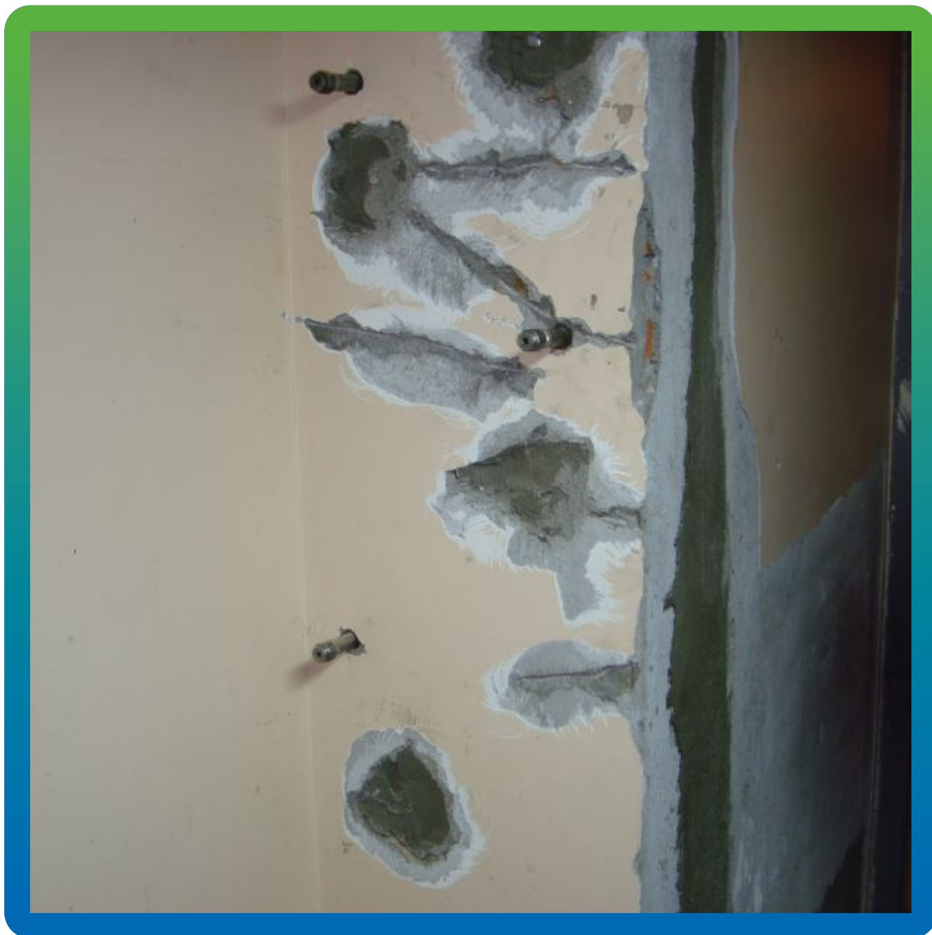
Инъектирование стены акрилатным гелем Манокрил Гель В