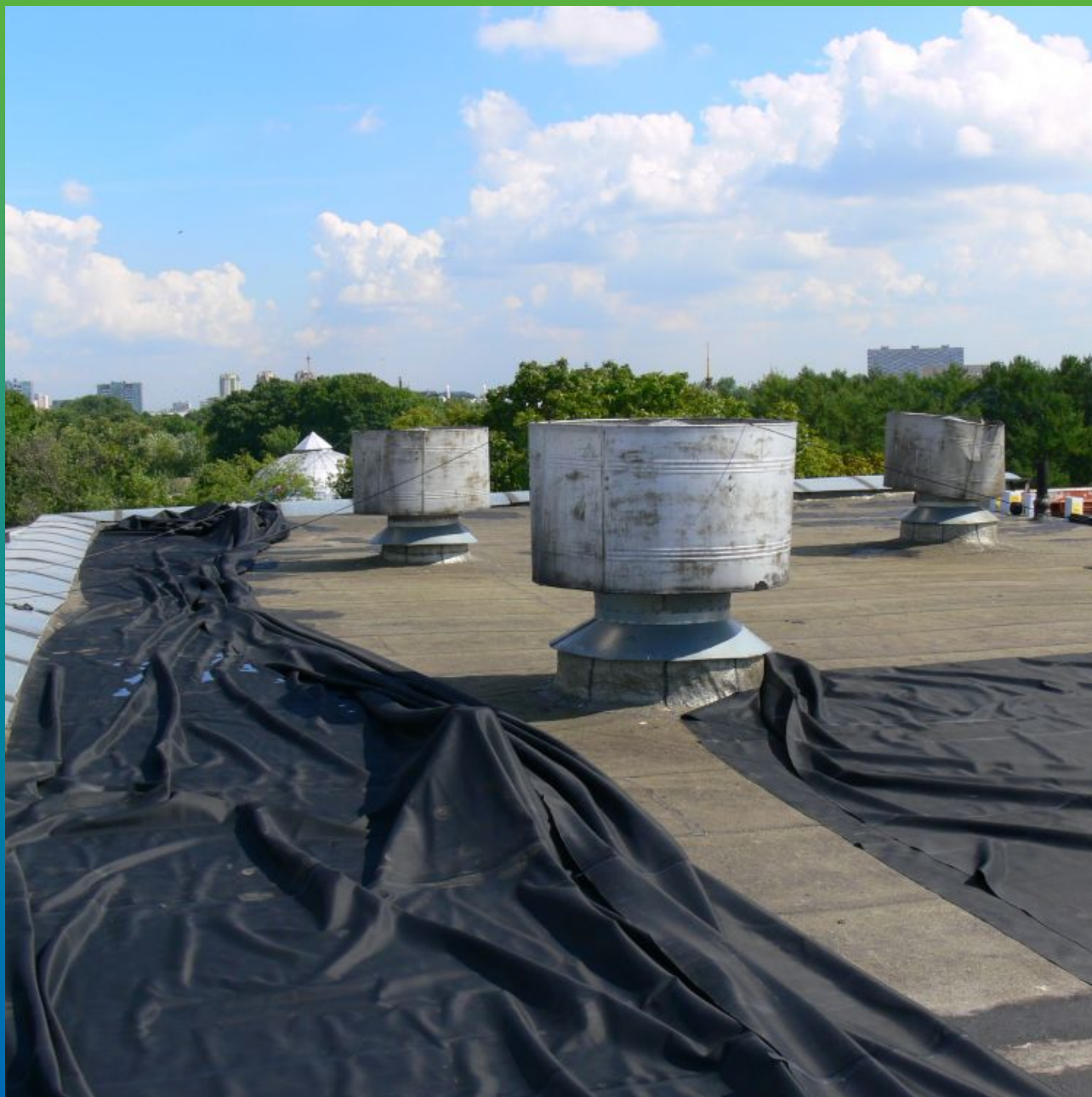
Распределение мембраны по кровле