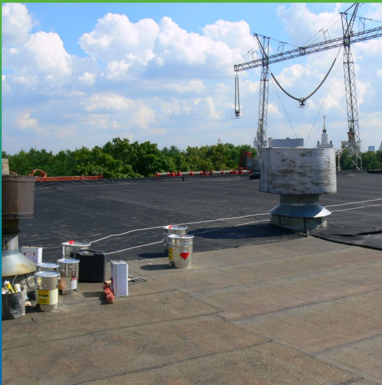
Адгезивы и сопутствующие инструменты на объекте