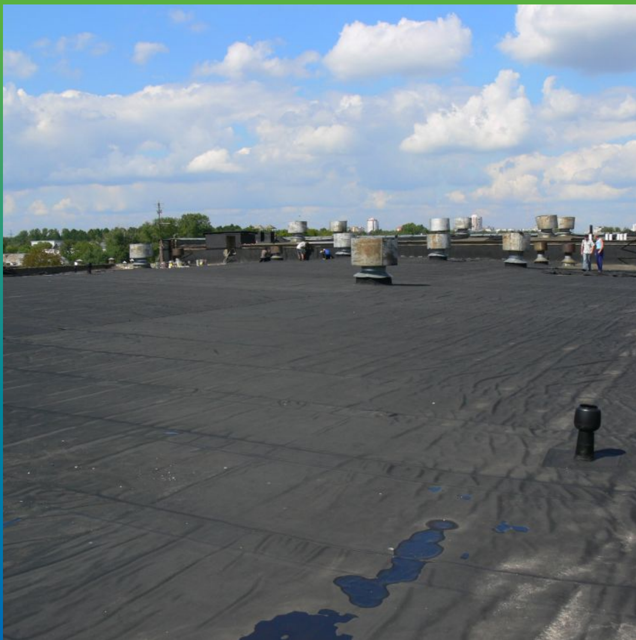
Вид на гидроизолированную кровлю