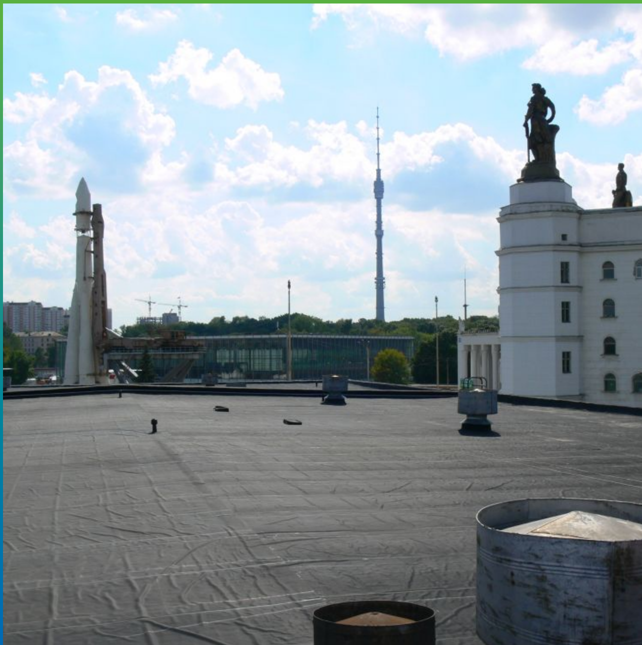
Вид на гидроизолированную кровлю