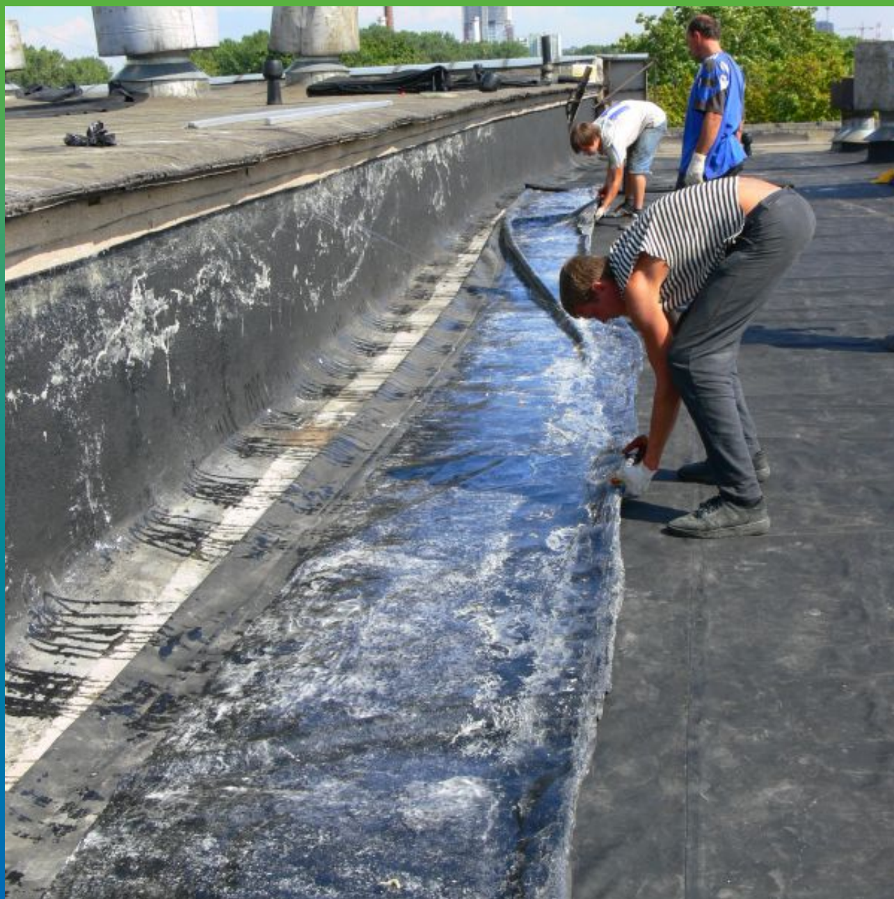
Нанесение адгезива на участок мембраны для монтажа на парапеты