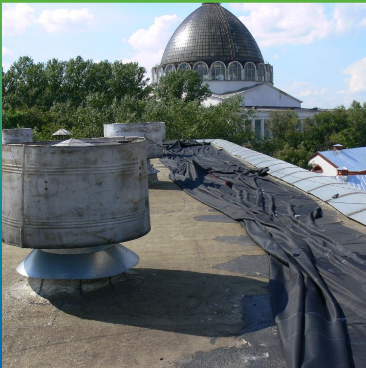
Распределение мембраны по кровле