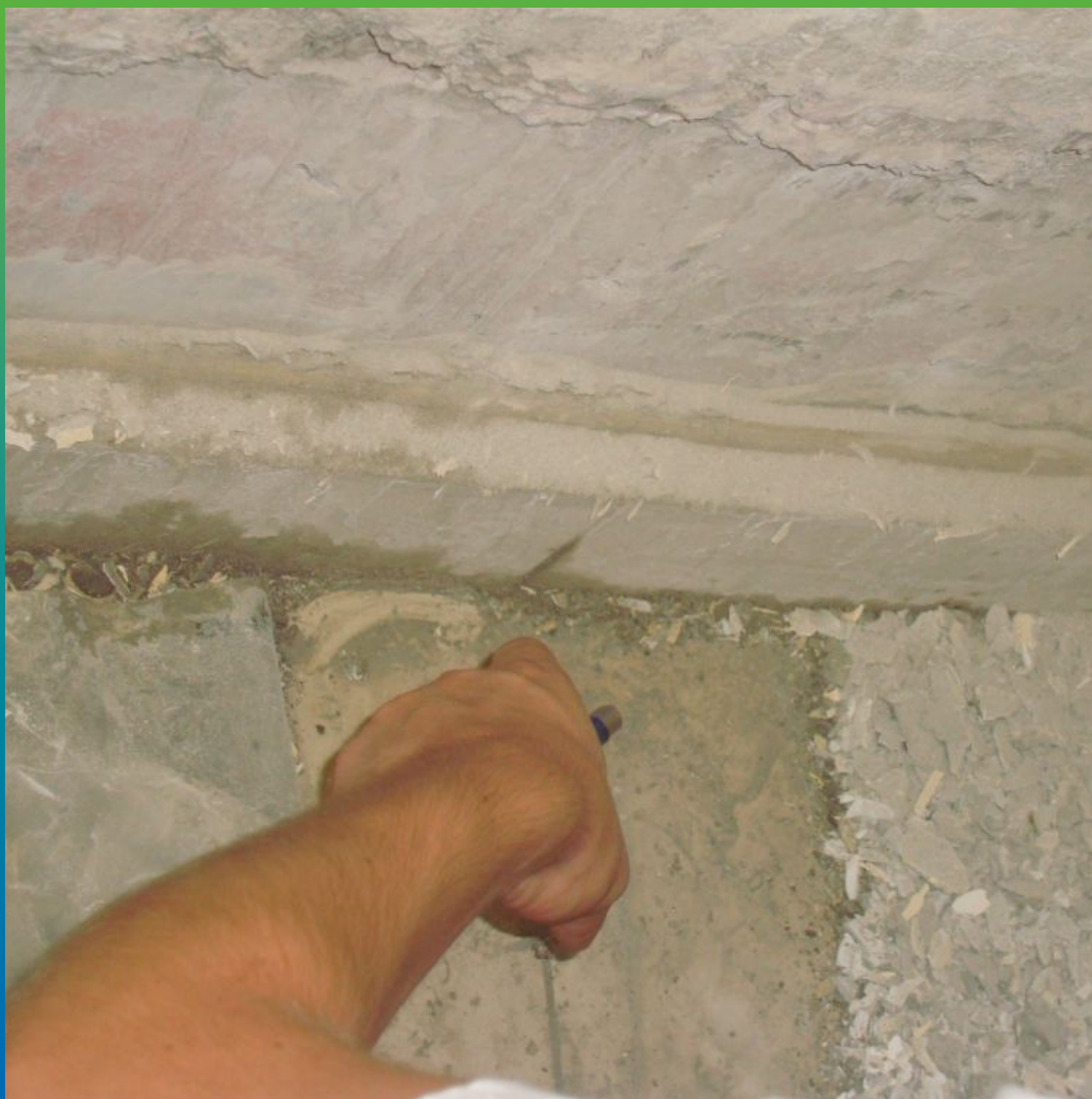
Протечки на стыках пол-стена