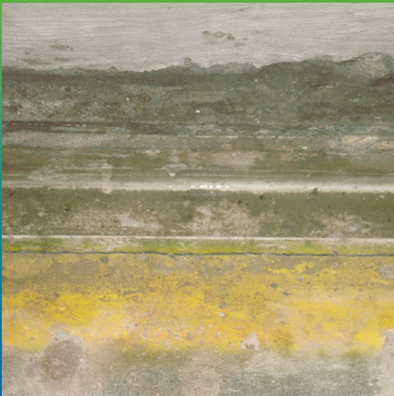
Протечки на стыках пол-стена