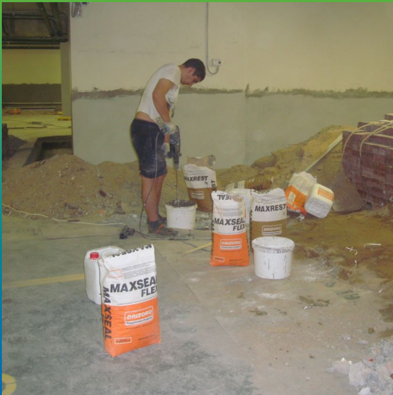
Смешивание гидроизоляционного состава