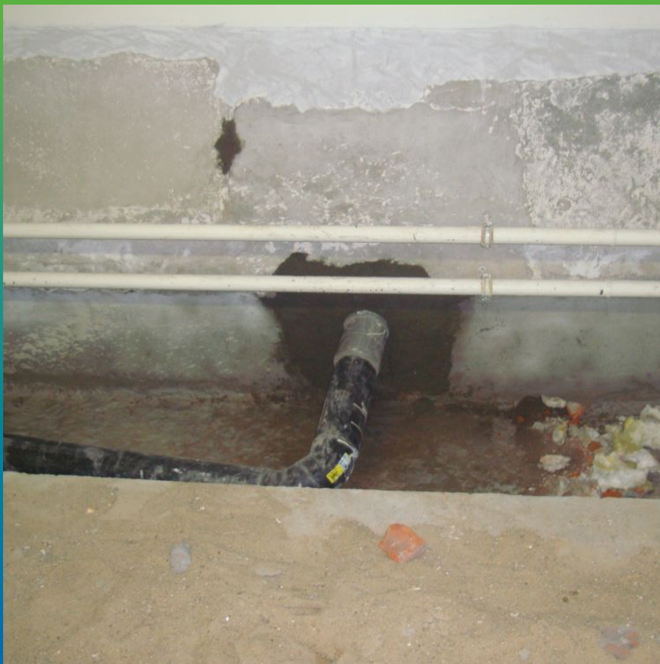
Зачеканка гидрофильного профиля вокруг трубы ремонтным составом Макрест