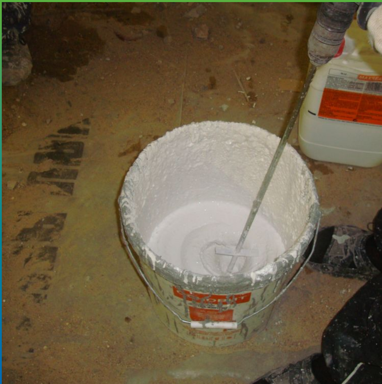
Приготовление гидроизоляционного состава Максил Флекс для нанесения вторым слоем