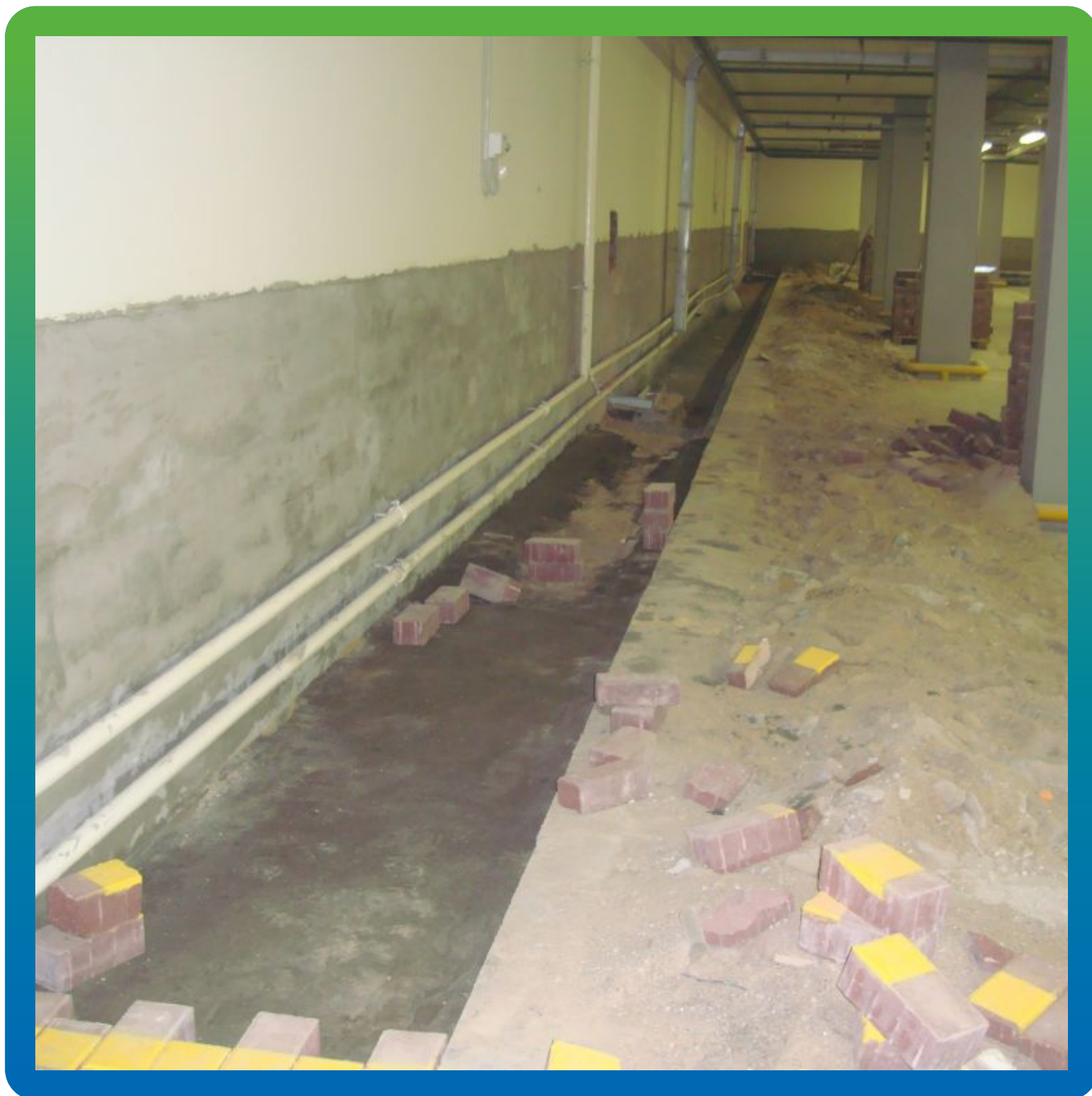
Нанесение первого слоя гидроизоляции