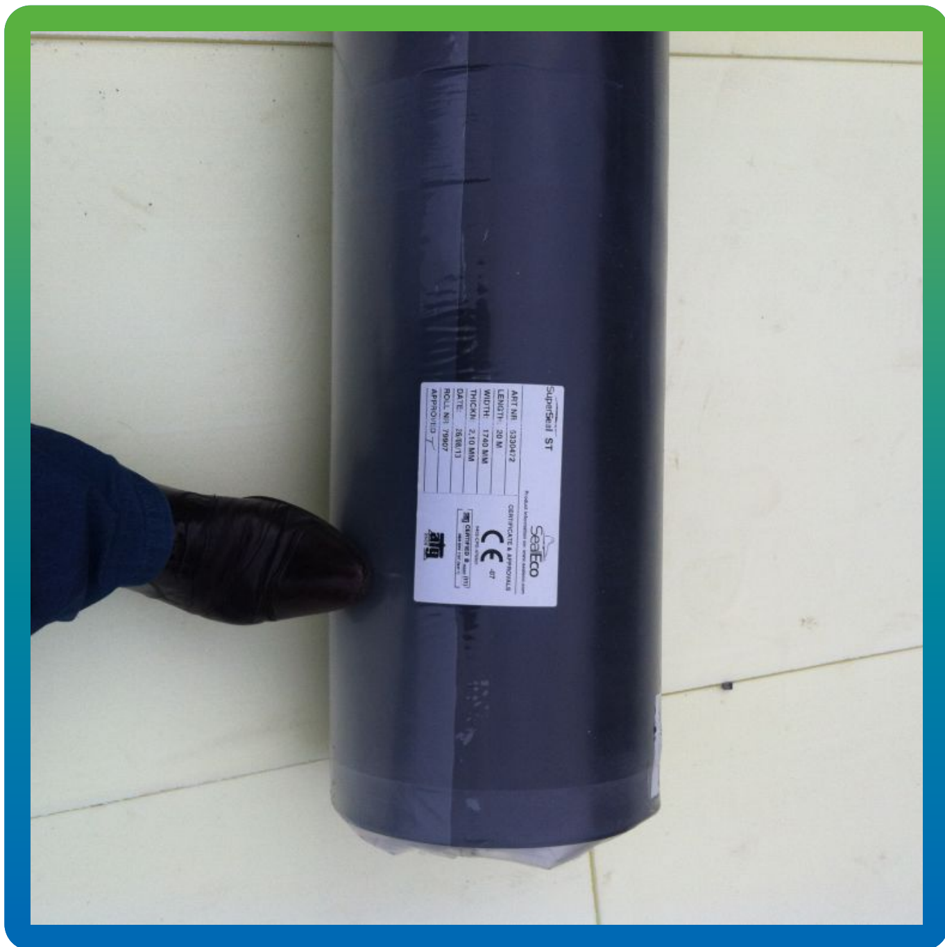
Рулон Суперсил СТ

Экспоцентр, Краснопресненская набережная, д. 14