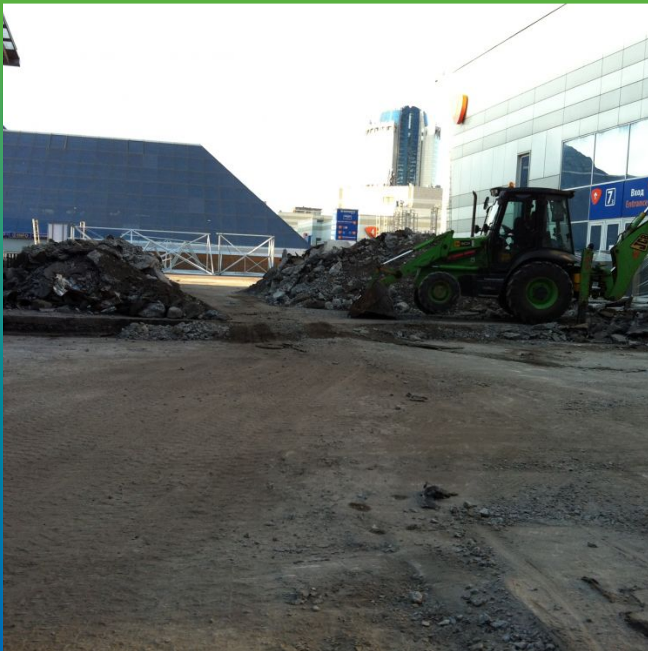
Расчистка для подготовки реконструируемого участка

Экспоцентр, Краснопресненская набережная, д. 14