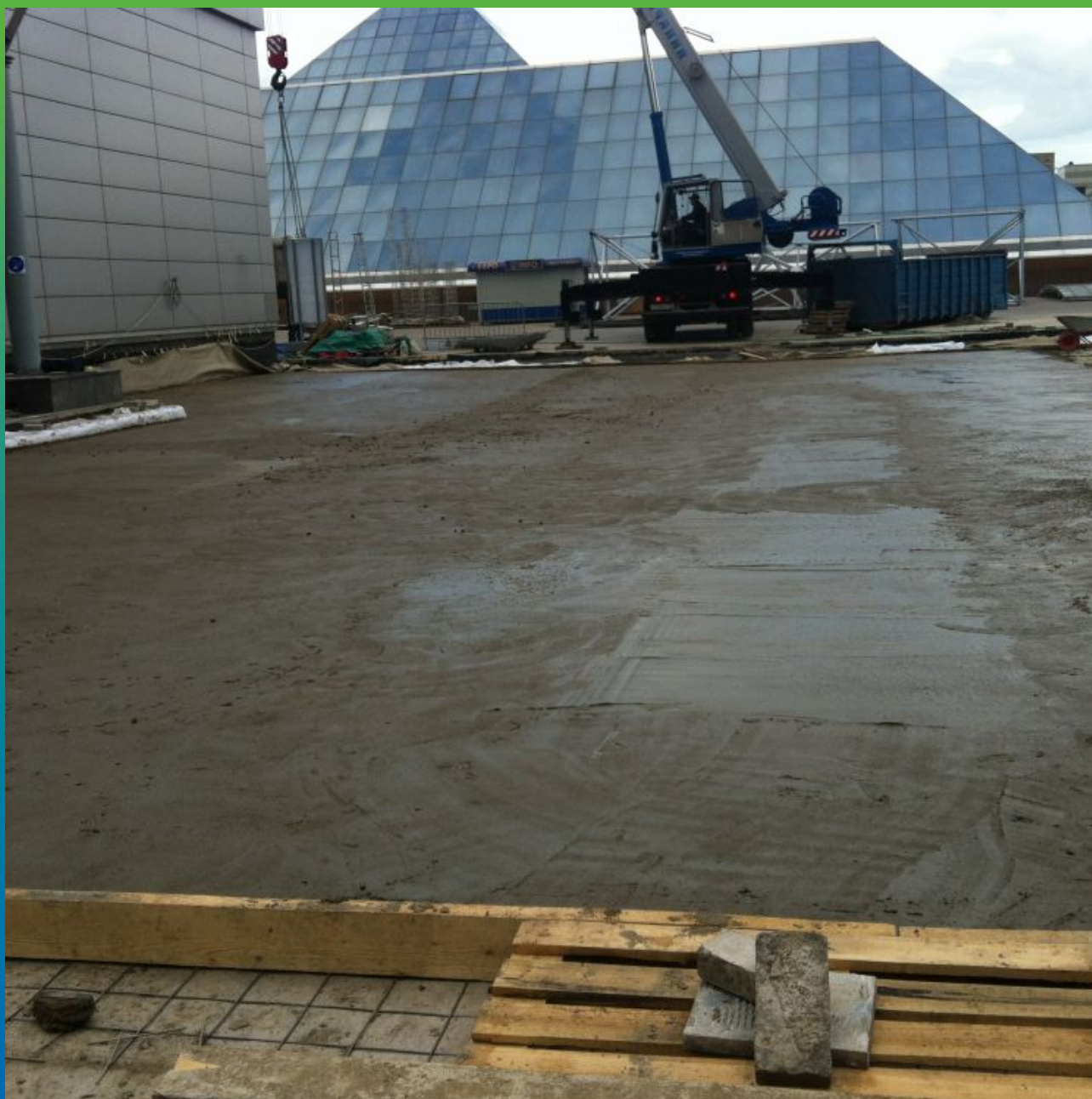
Устройство защитной стяжки с применением Максдрейн 8 ГТ

Экспоцентр, Краснопресненская набережная, д. 14