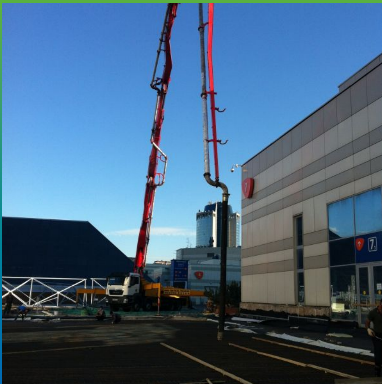
Заливка бетонного состава

Экспоцентр, Краснопресненская набережная, д. 14