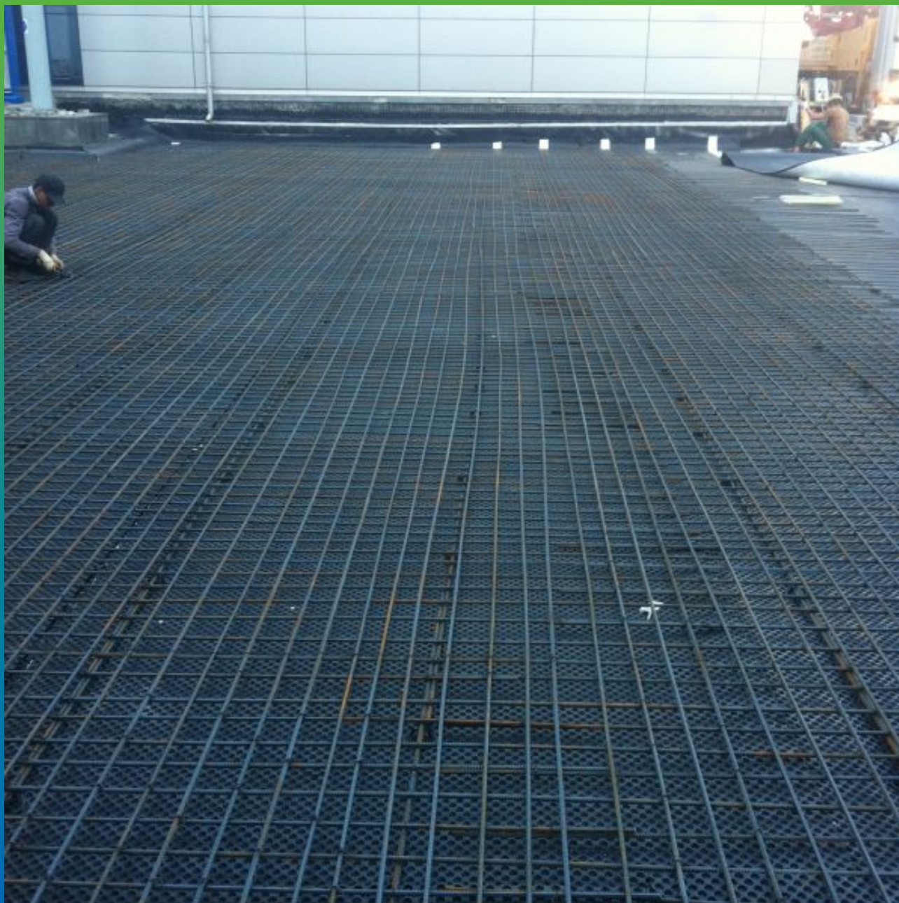
Армирование бетонного слоя под финишное асфальтовое покрытие

Экспоцентр, Краснопресненская набережная, д. 14