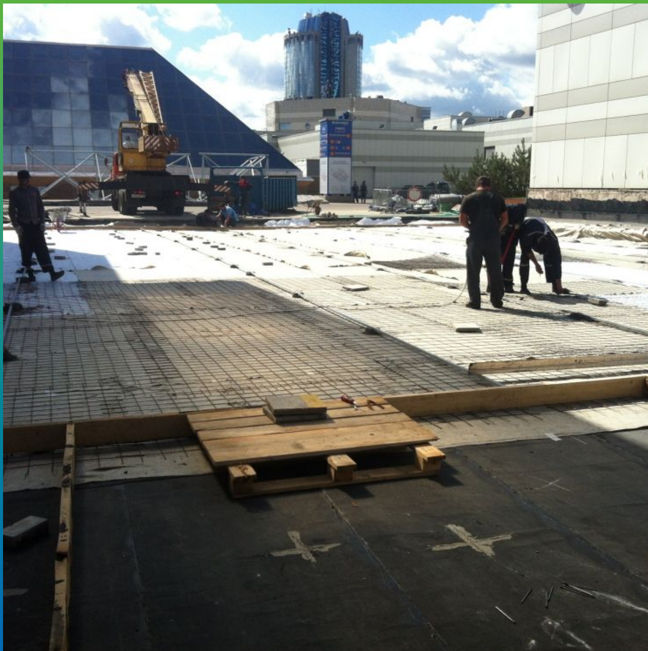
Заливка защитной бетонной стяжки

Экспоцентр, Краснопресненская набережная, д. 14