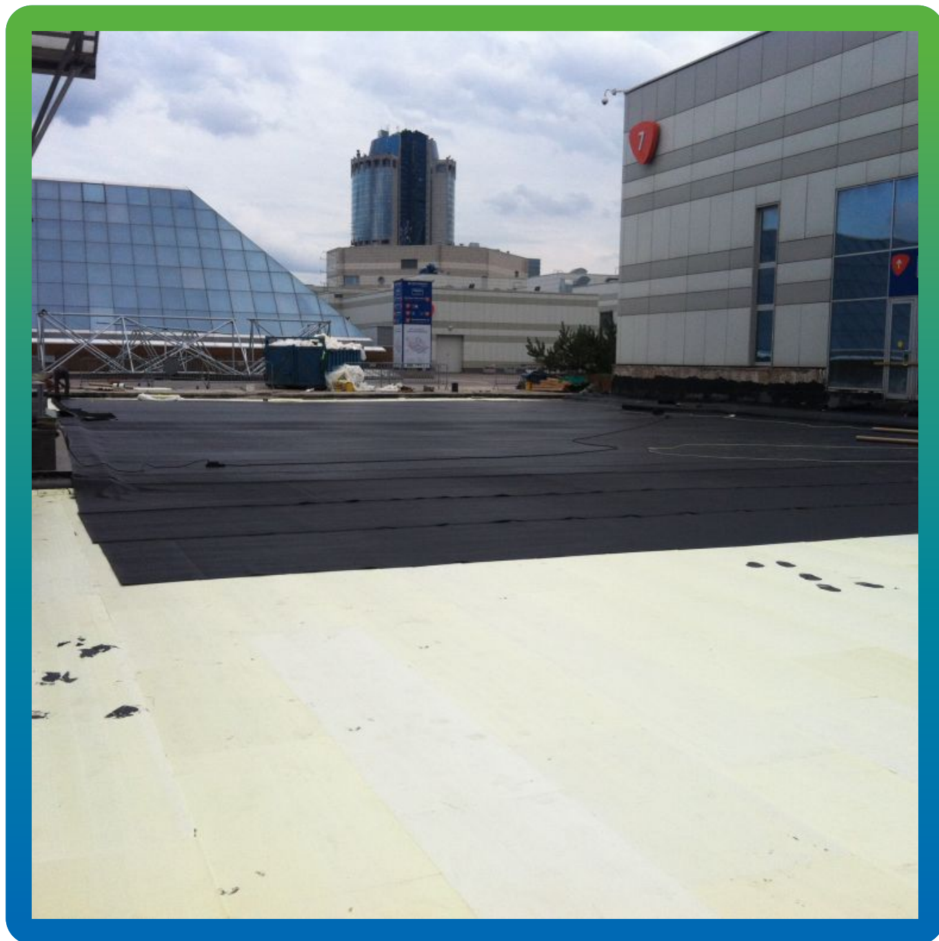
Сваренный участок ЭПДМ мембраны

Экспоцентр, Краснопресненская набережная, д. 14