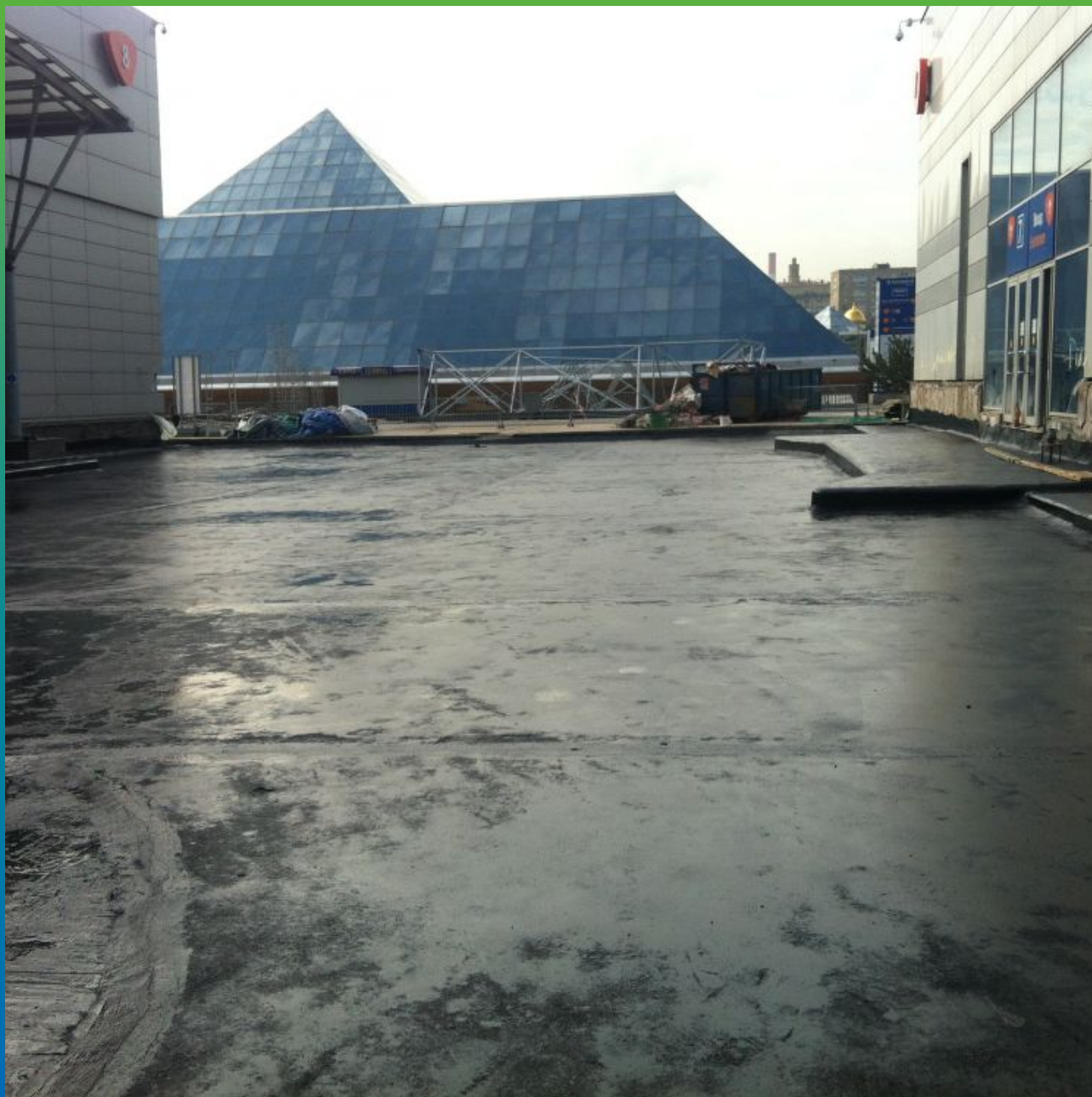
Подготовленная площадка для укладки битумного слоя кровли

Экспоцентр, Краснопресненская набережная, д. 14