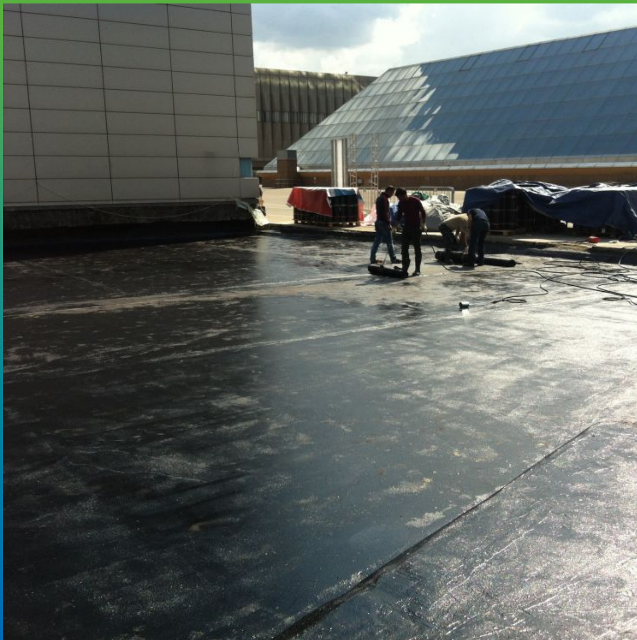
Монтаж битумного слоя эксплуатируемой кровли

Экспоцентр, Краснопресненская набережная, д. 14