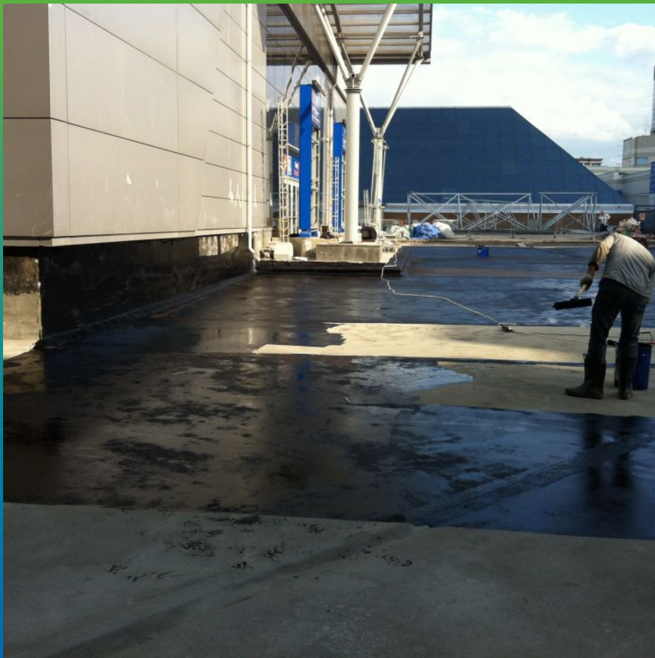
Нанесение битумного праймера

Экспоцентр, Краснопресненская набережная, д. 14