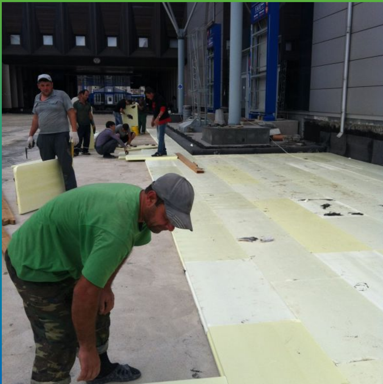
Монтаж подложки из пеноплекса по Суперсил СТ

Экспоцентр, Краснопресненская набережная, д. 14