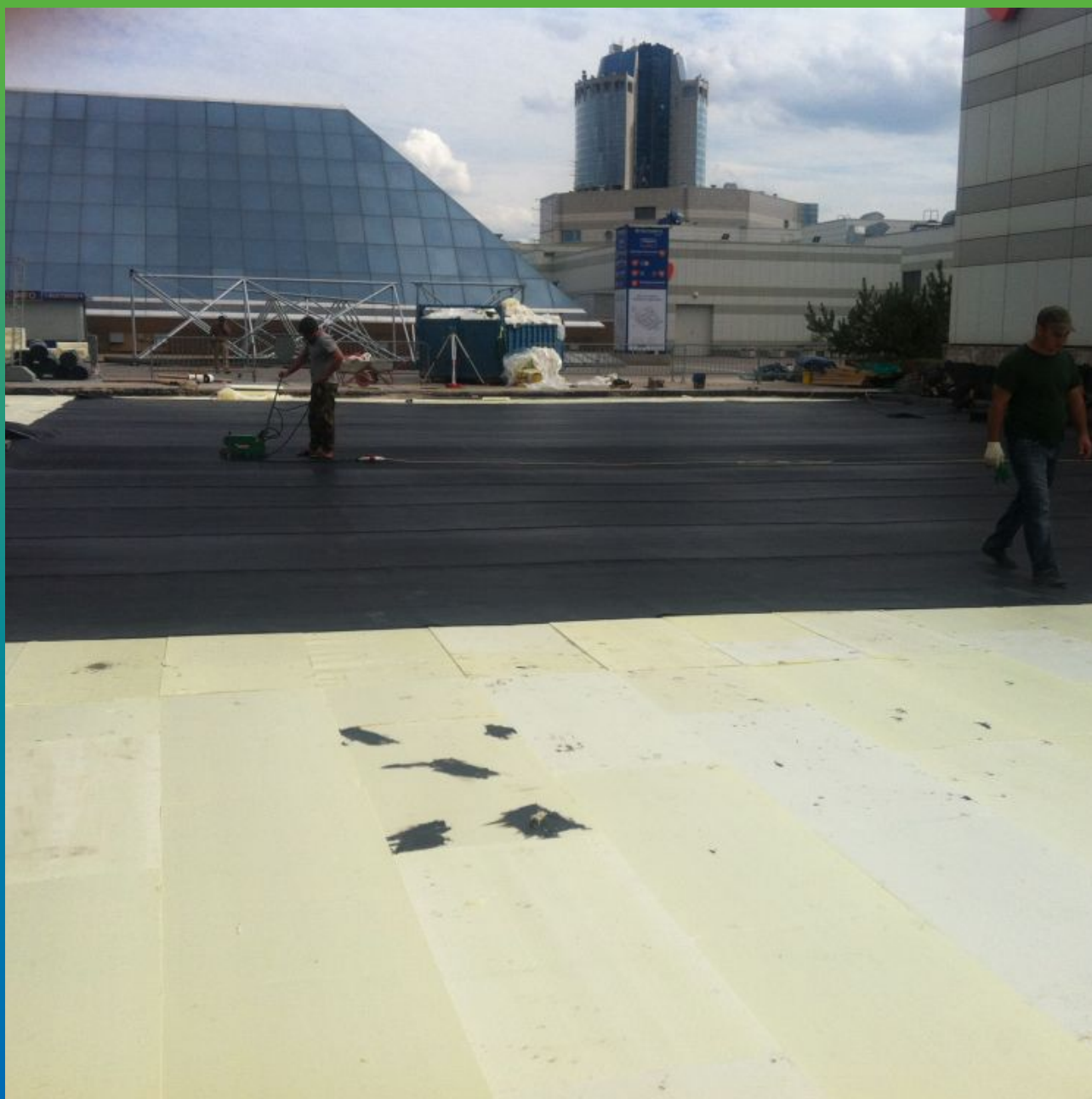
Монтаж полотен - вулканизация Суперсил СТ

Экспоцентр, Краснопресненская набережная, д. 14