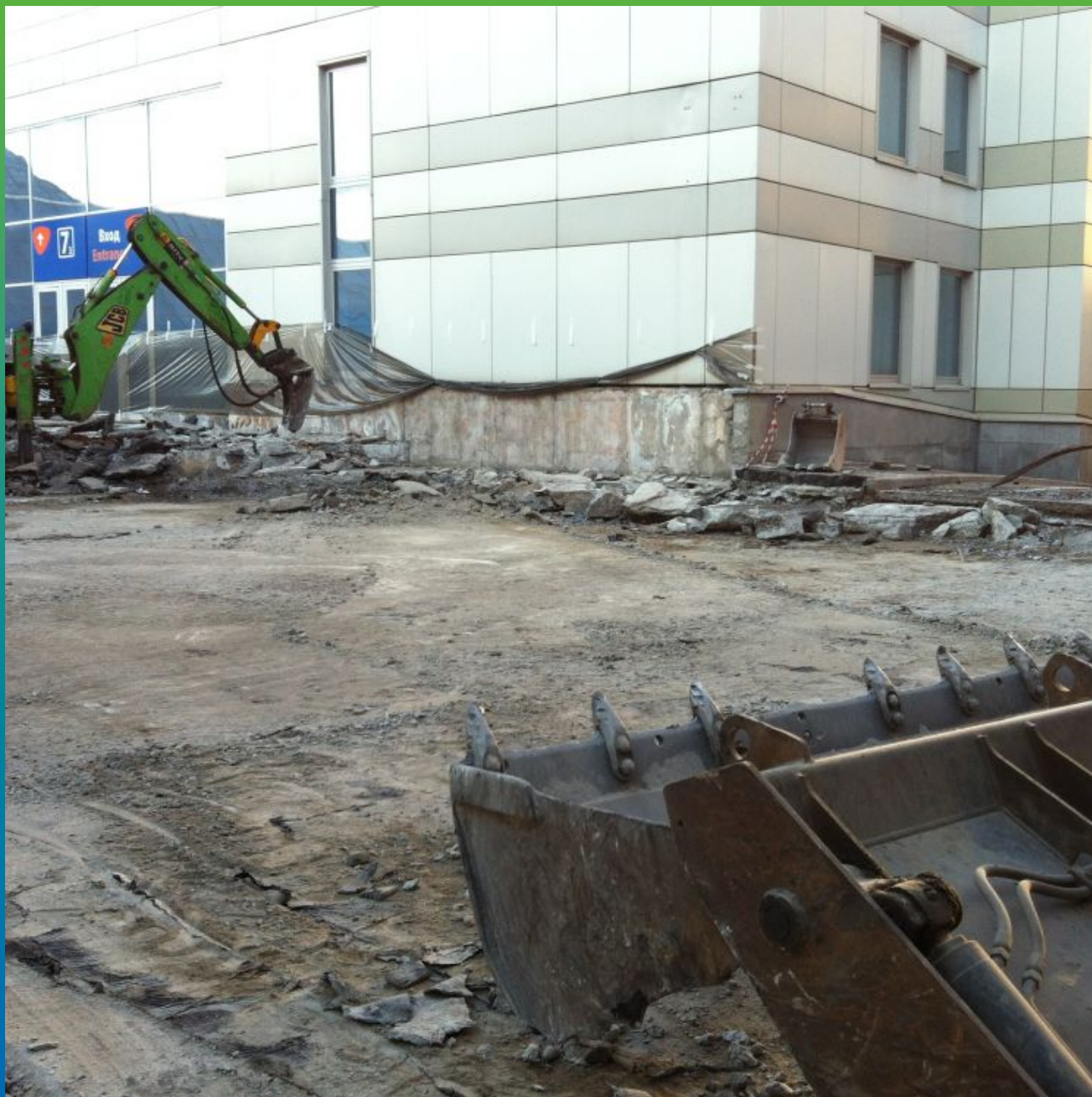
Демонтаж существующего пирога

Экспоцентр, Краснопресненская набережная, д. 14