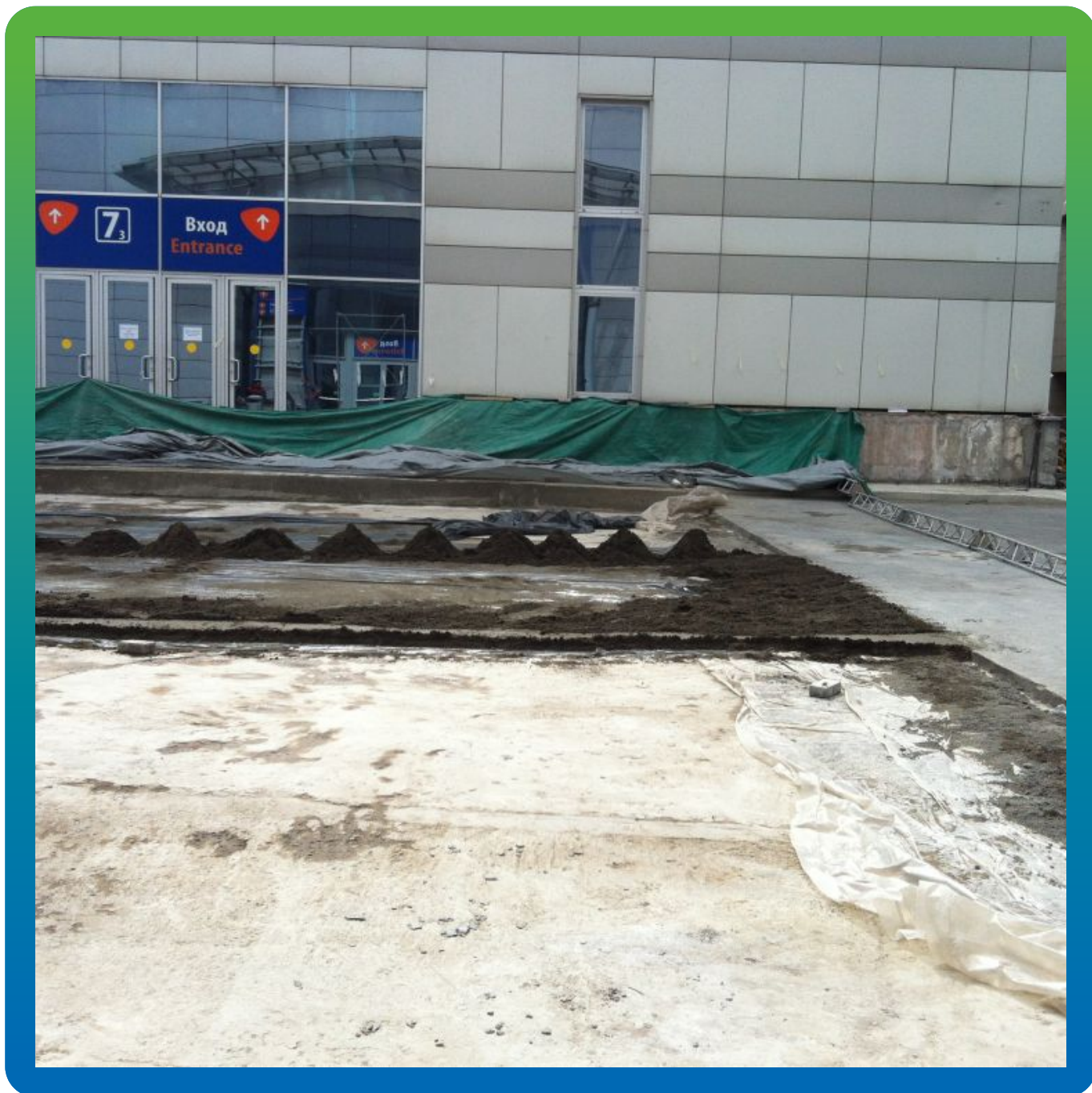
Устройство защитной стяжки

Экспоцентр, Краснопресненская набережная, д. 14