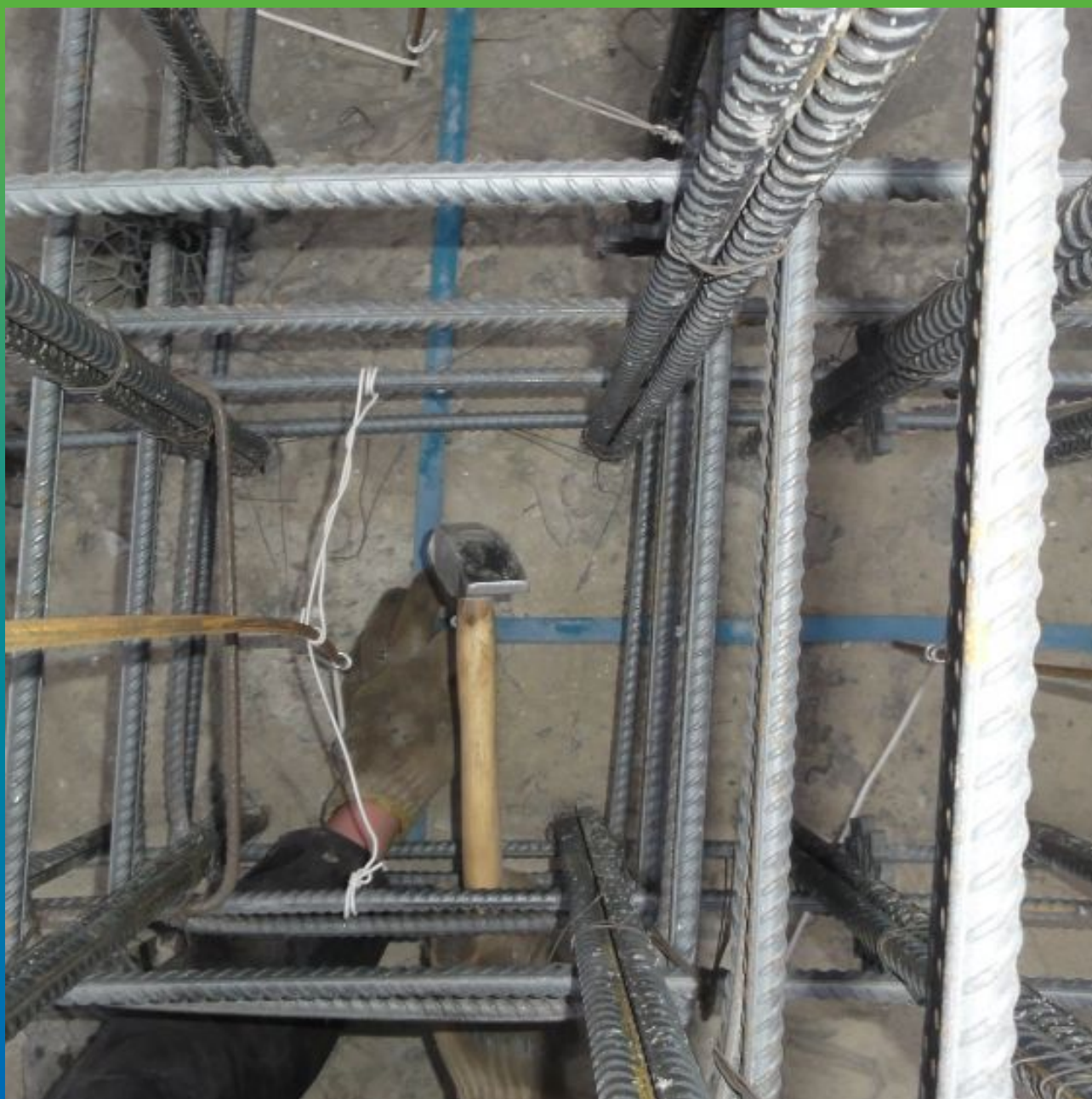
Укладка профиля Манодил Свелл 2003