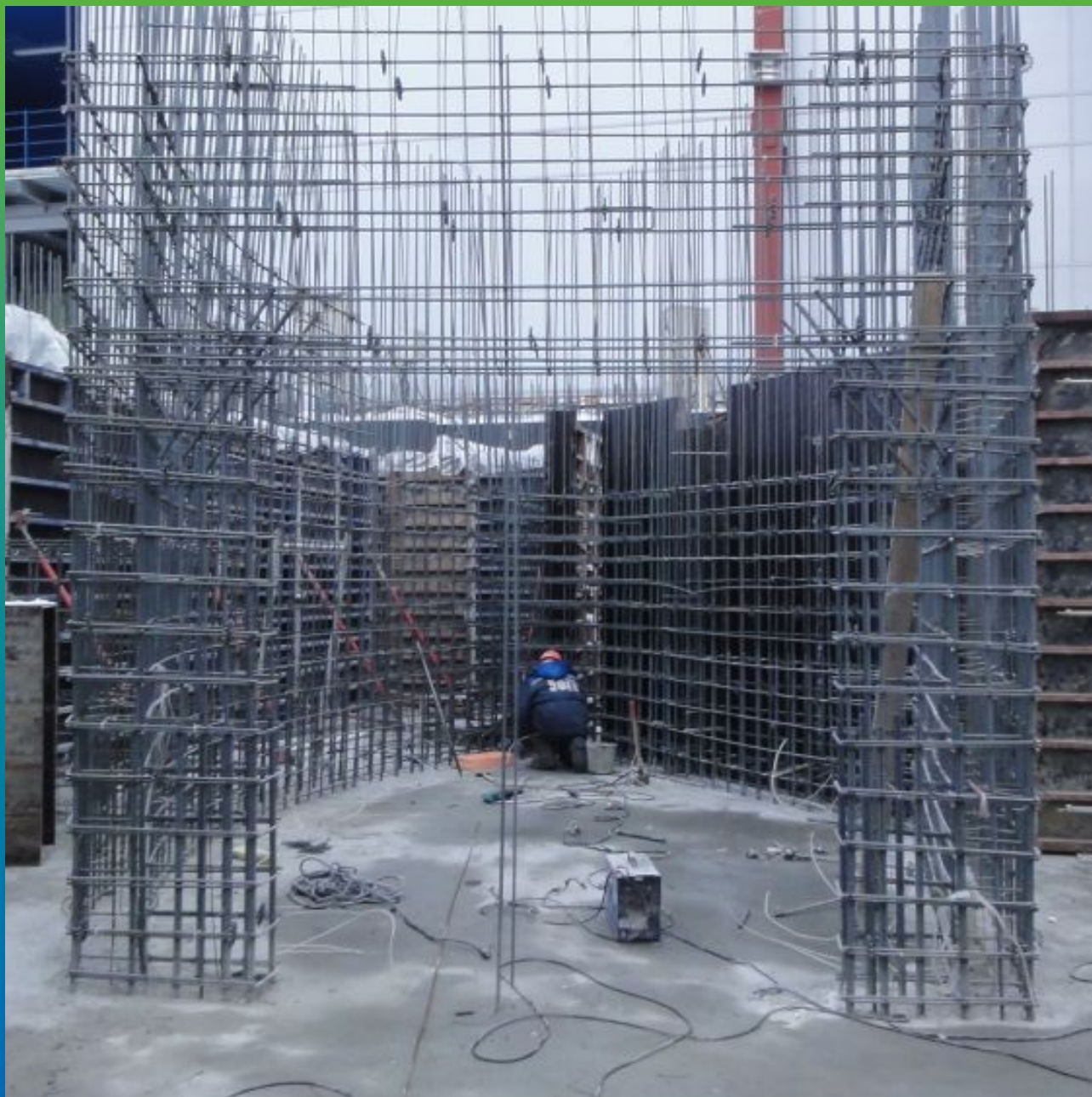
Вид швов перед укладкой профиля