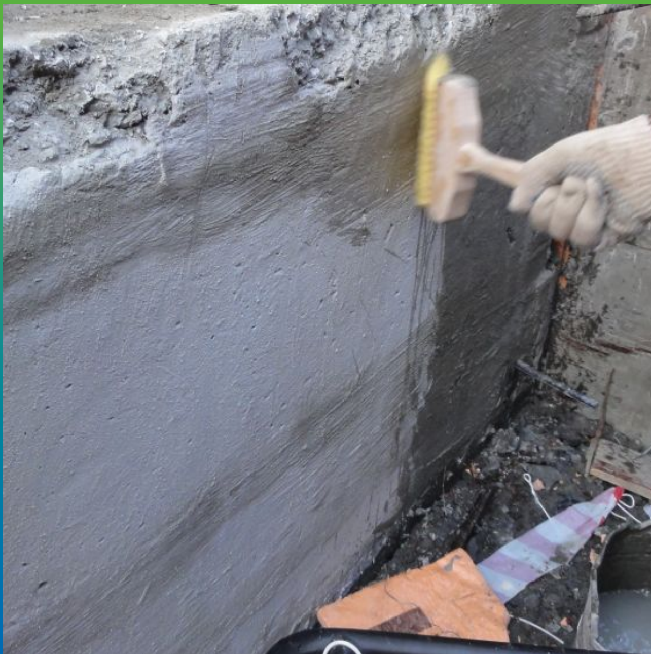
Увлажнение поверхности перед нанесением второго слоя материала Максил + Макскрил