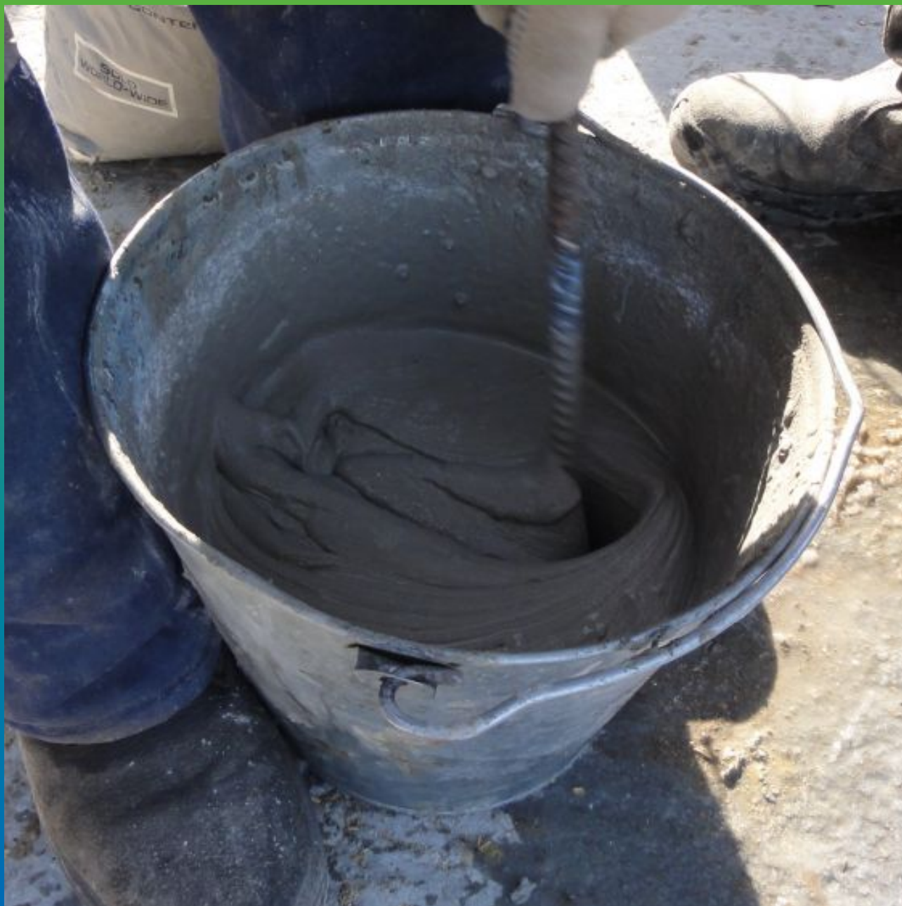
Затворение материала Макссил + Макскрил