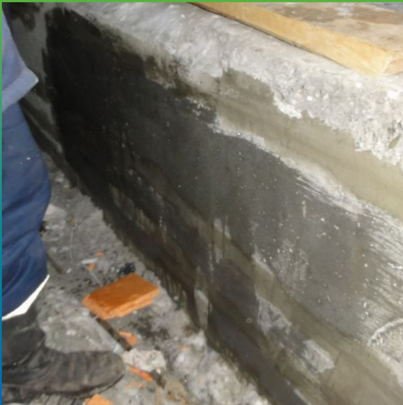
Увлажнение поверхности перед нанесением гидроизоляционного состава Максил