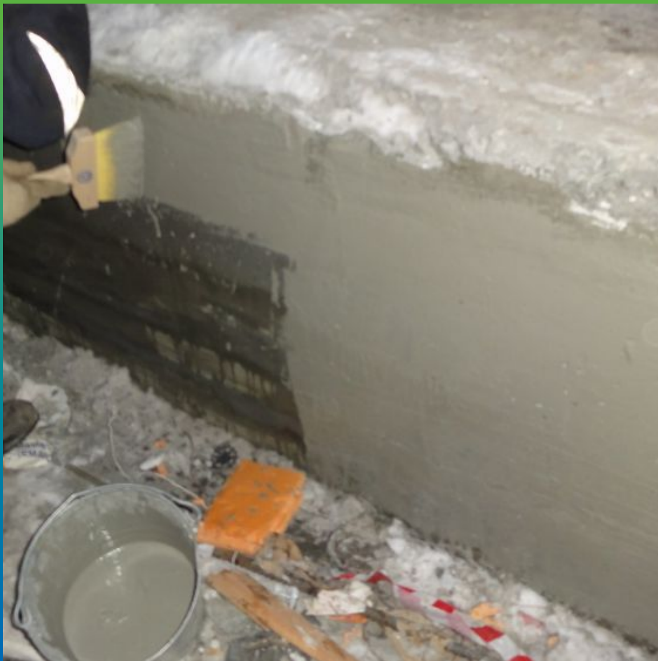
Нанесение первого слоя материала Макссил + Макскрил