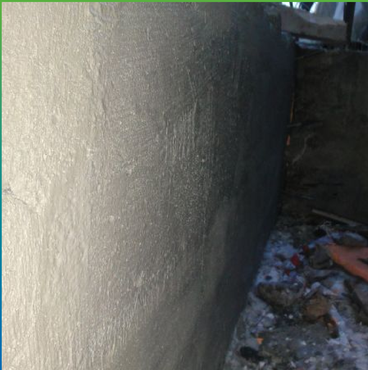
Общий вид нанесенного первого слоя