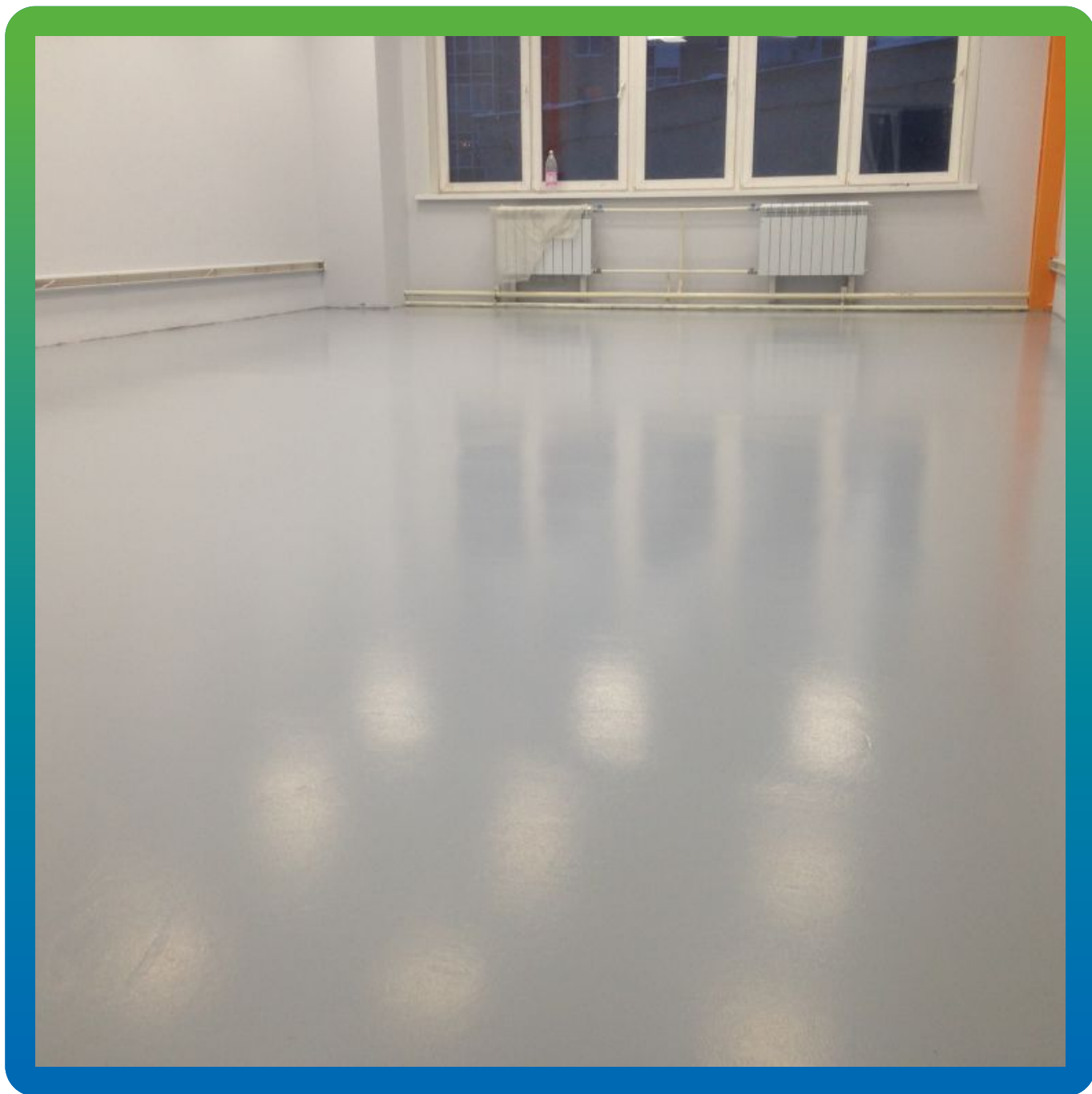
Конечный результат. Общий вид.