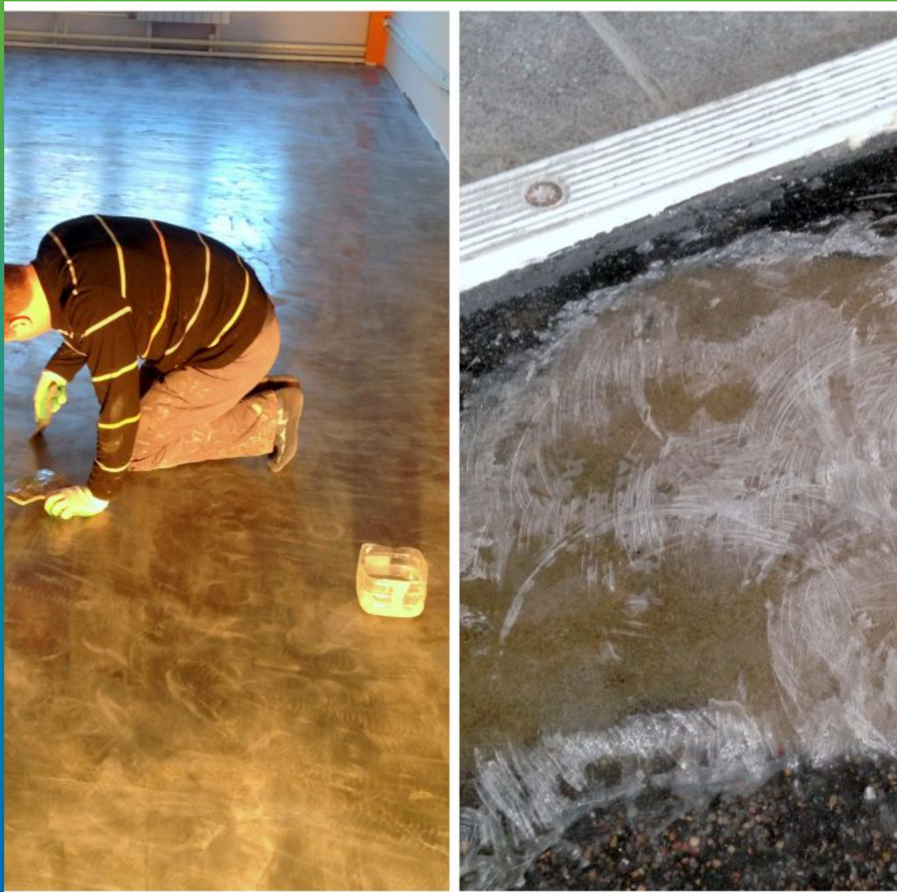
Подготовка основания. Локальный ремонт дефектов.