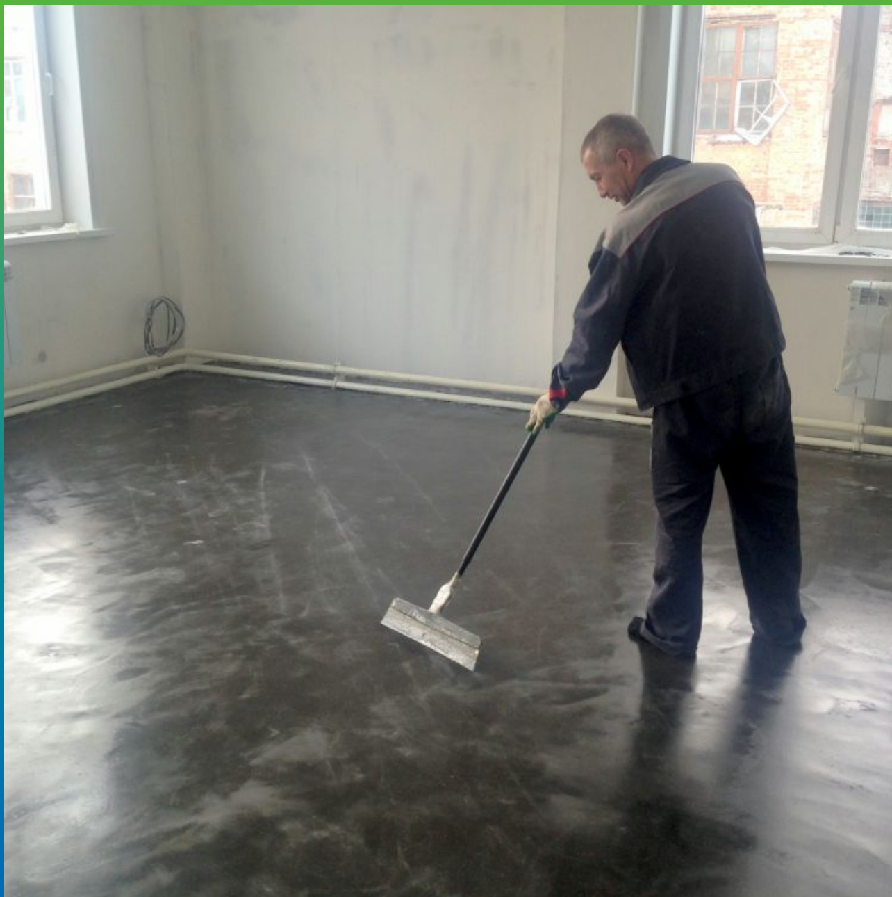
Грунтование основания материалом Денстоп ЭП 106.