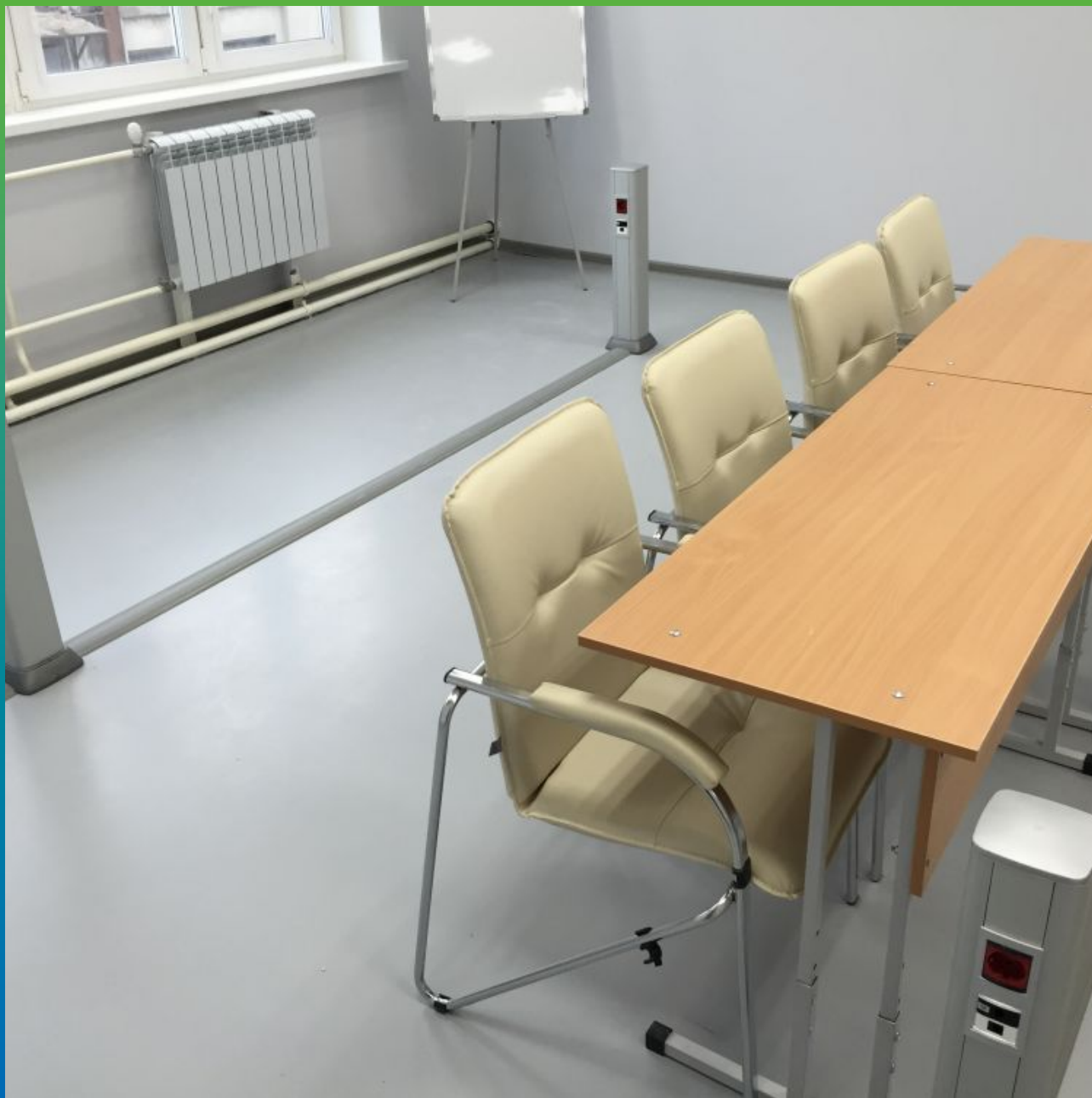
Общий вид мебелированной комнаты объекта.