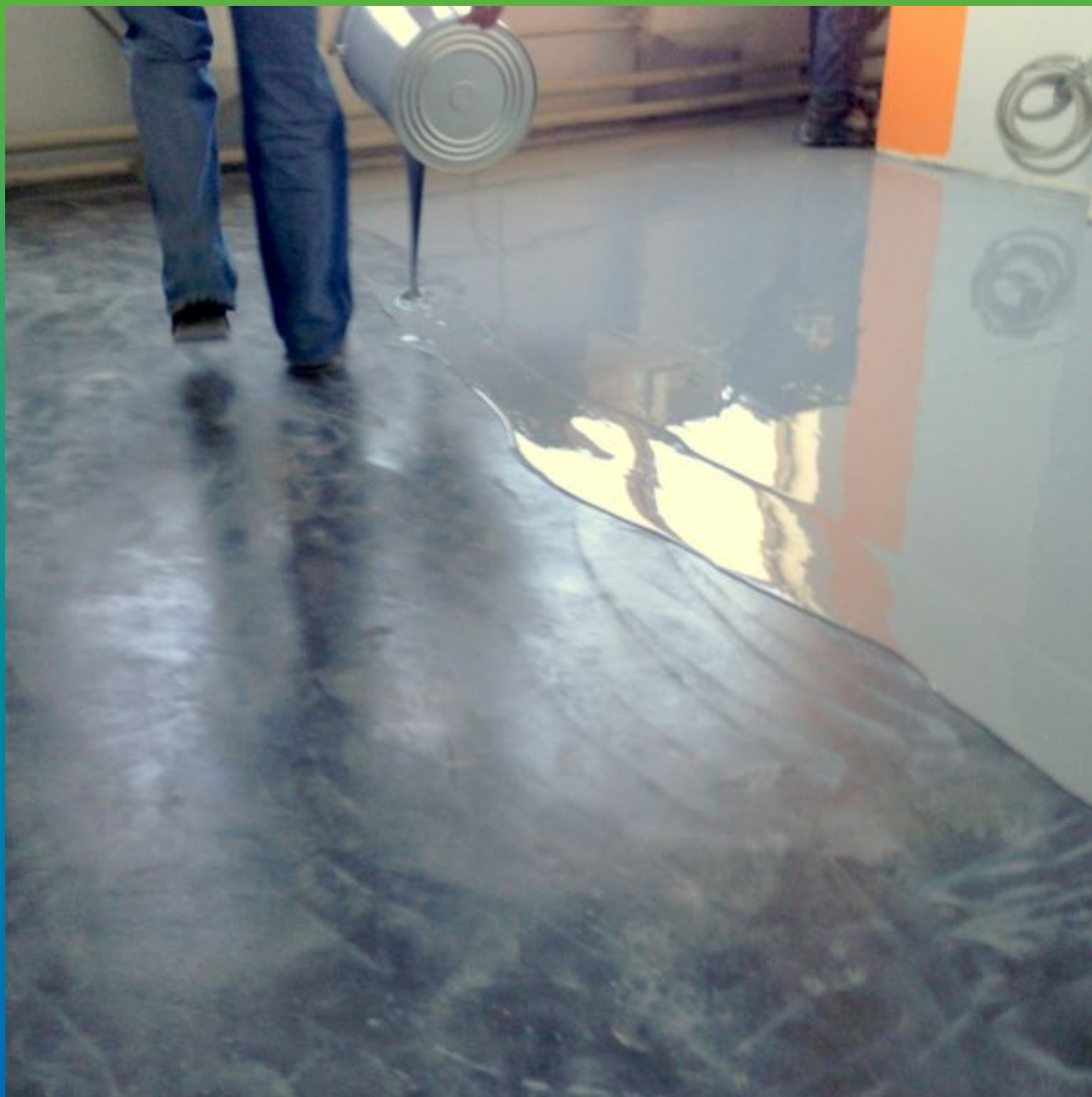
Розлив материала на подготовленное основание.