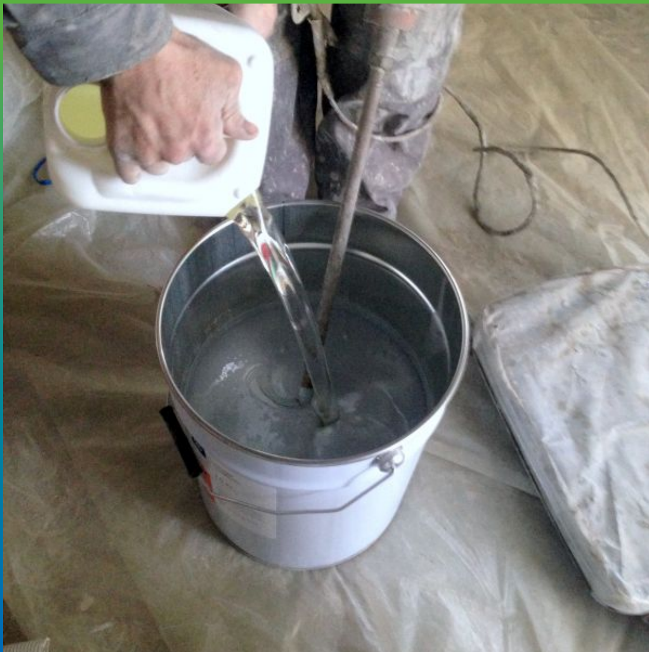
Смешивание компонентов А+Б Денстоп ЭП 500.