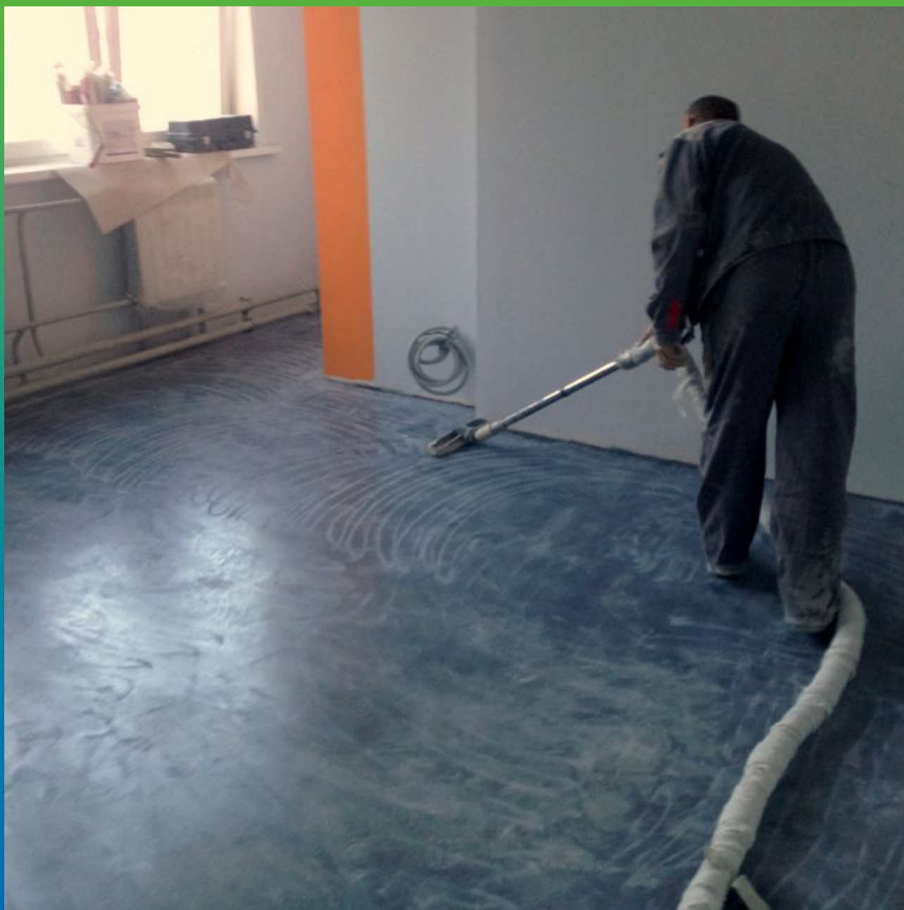
Подготовка основания. Окончательное обеспыливание.