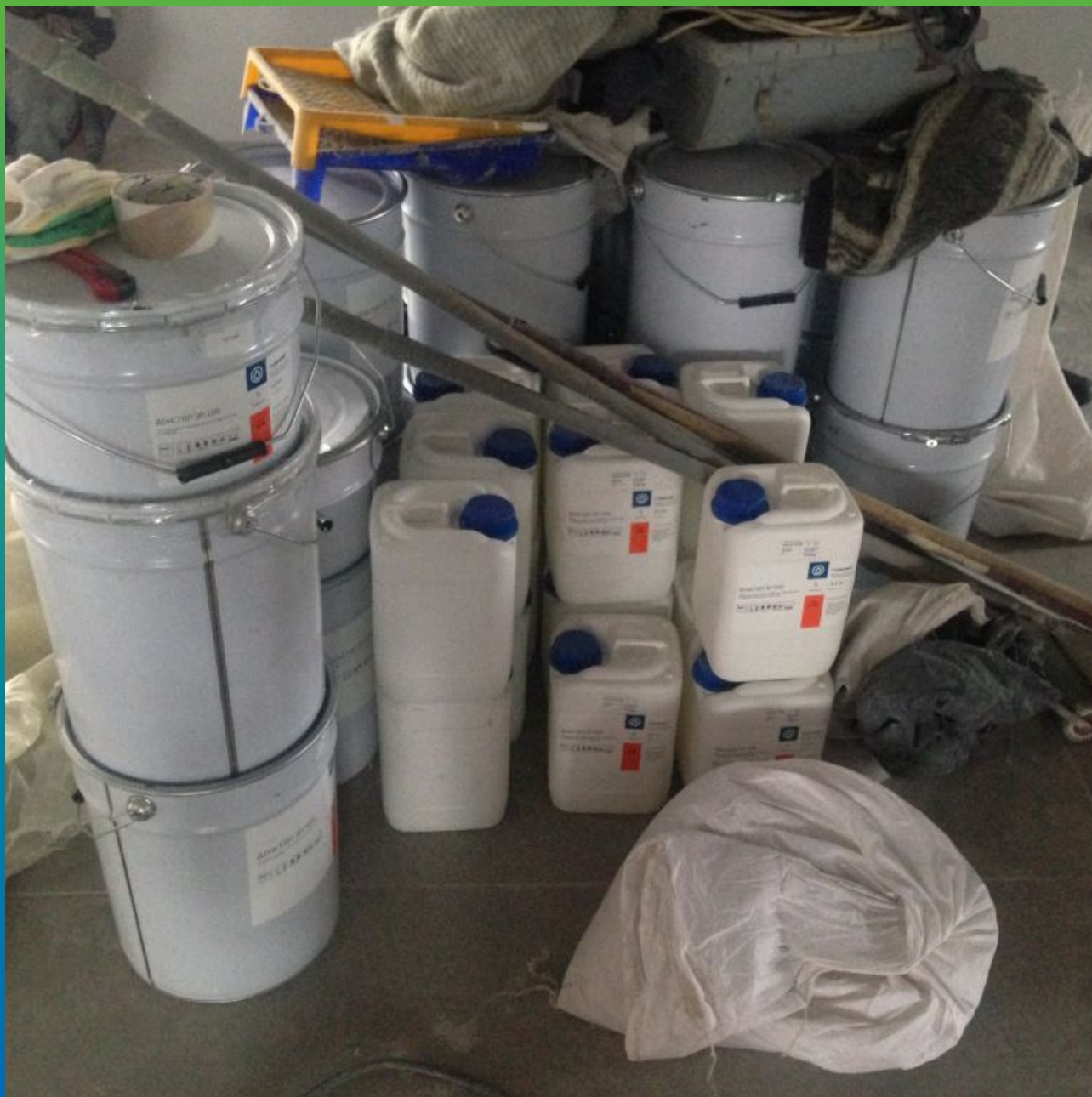
Материалы Гидрозо на объекте.