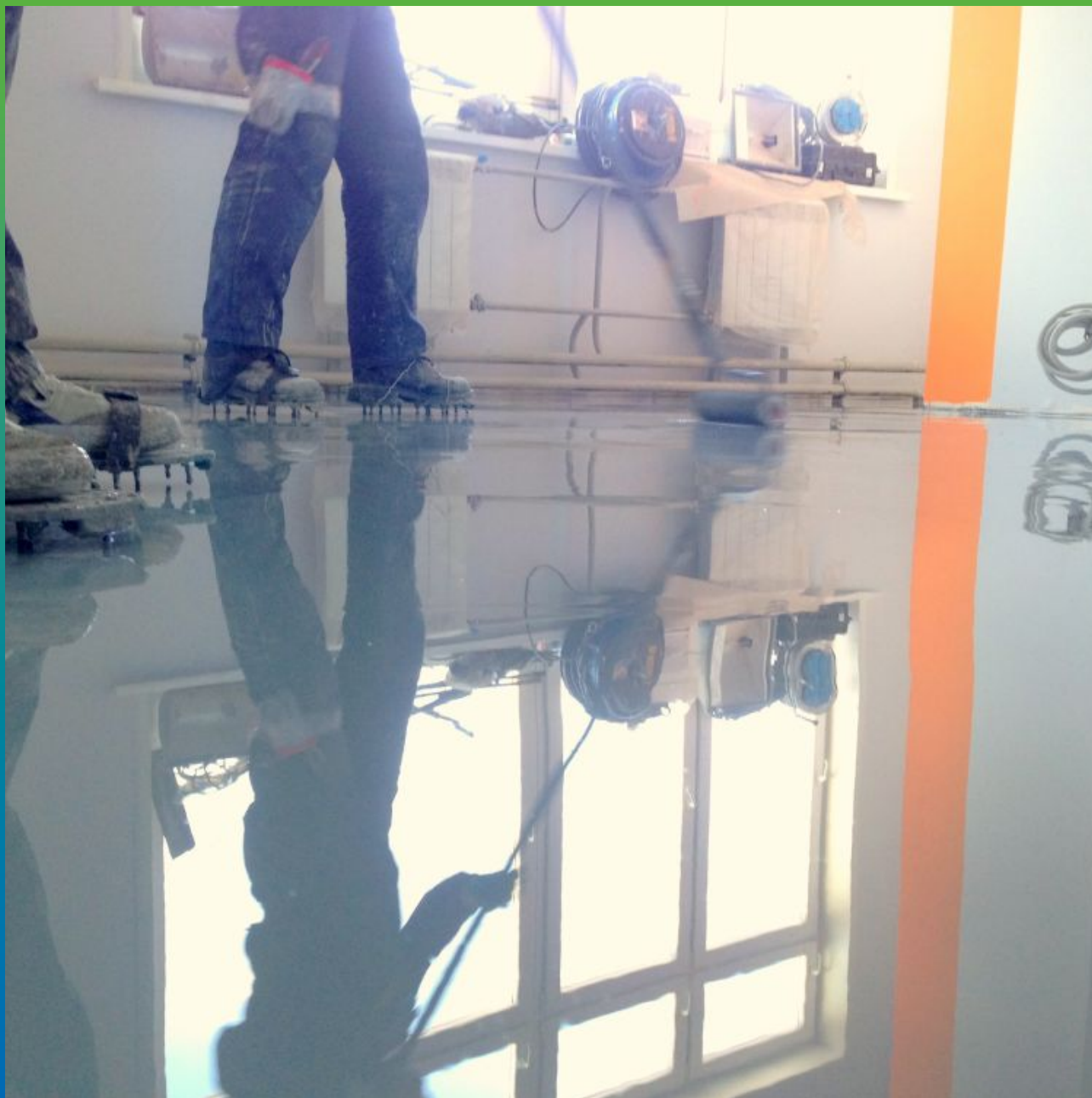
Удаление воздуха из материала игольчатым валиком.