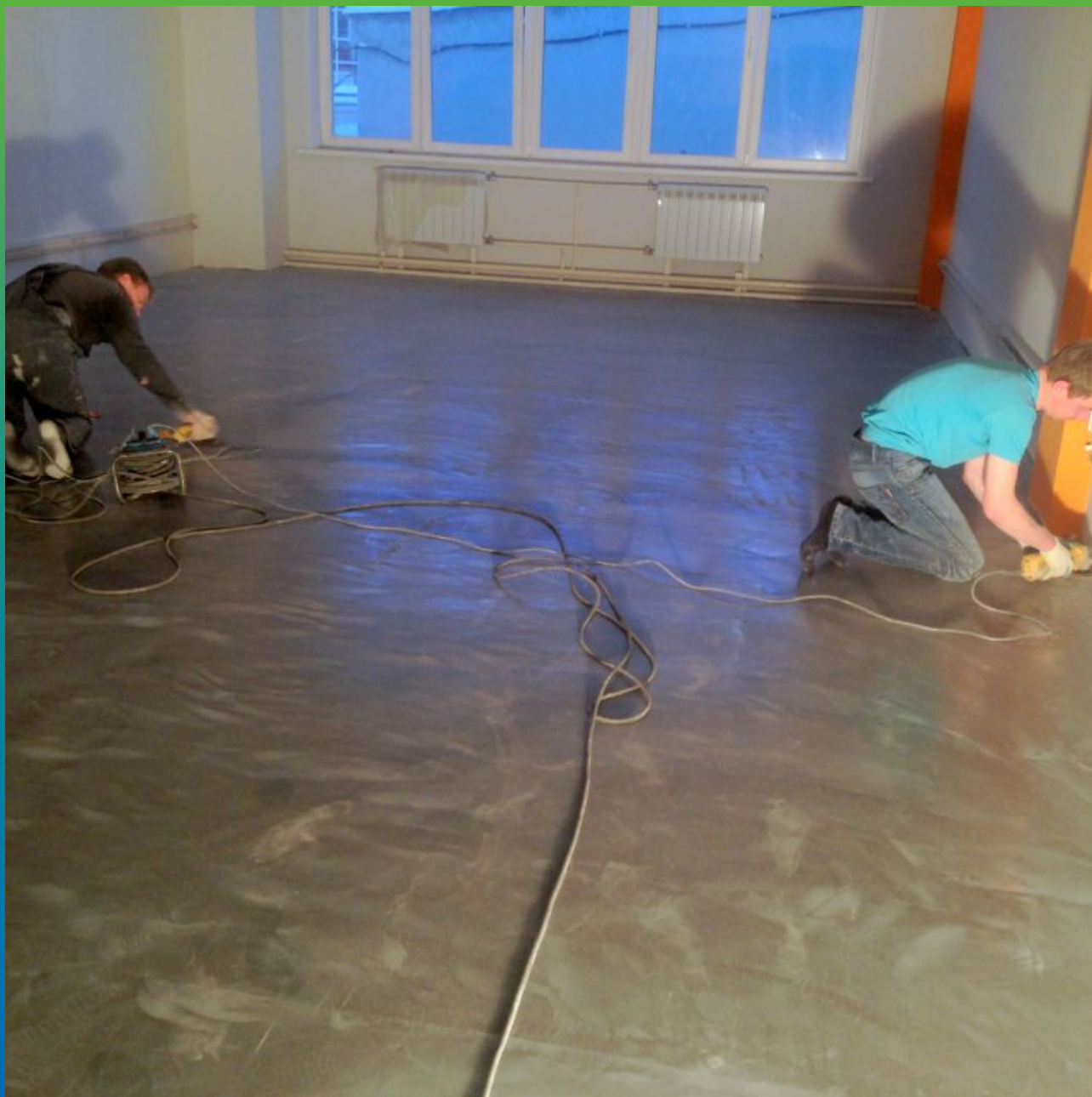
Подготовка основания. Шлифовка + обеспыливание.