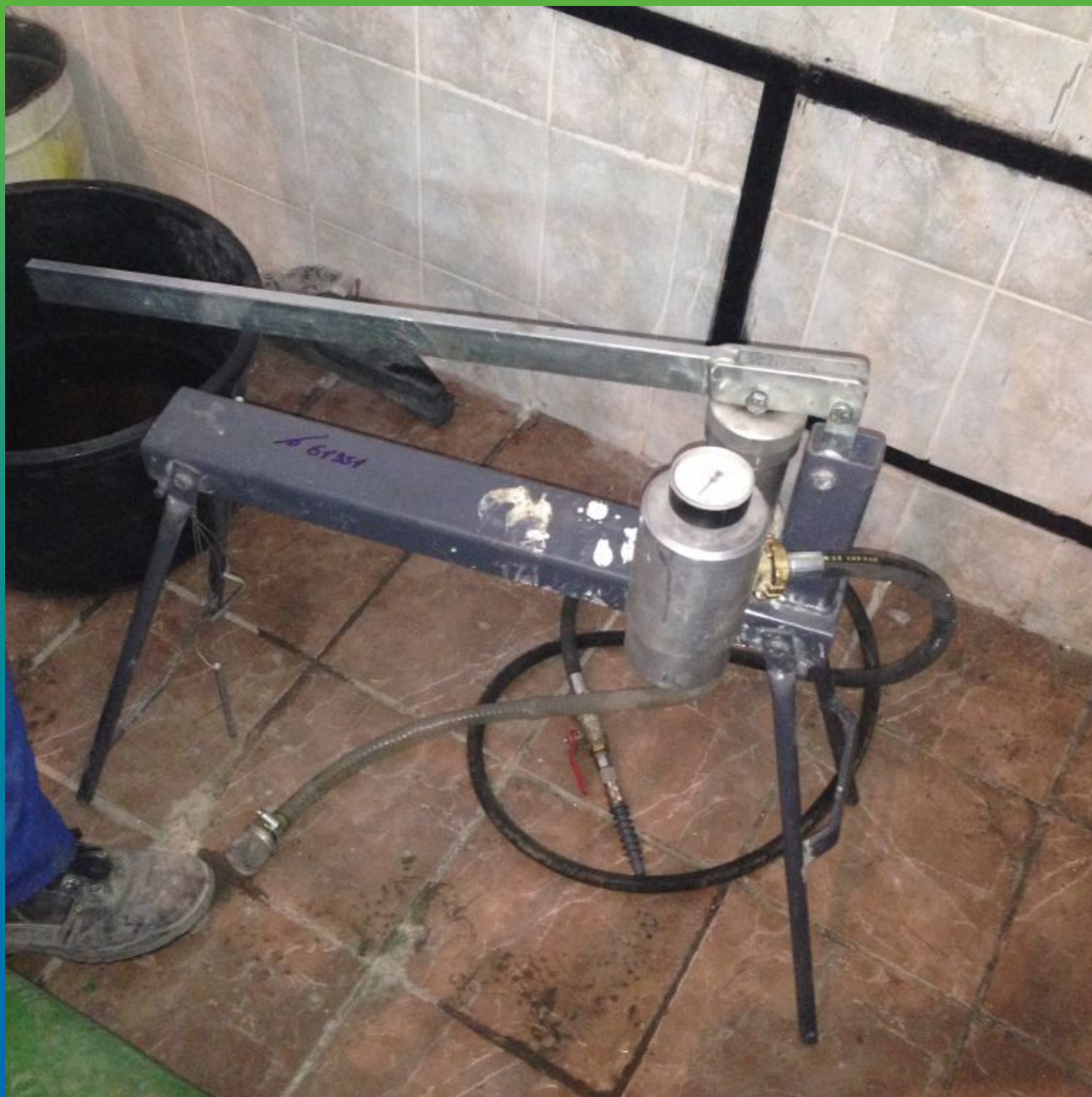
Подготовка оборудования БМ 0220 насос для микроцементов.