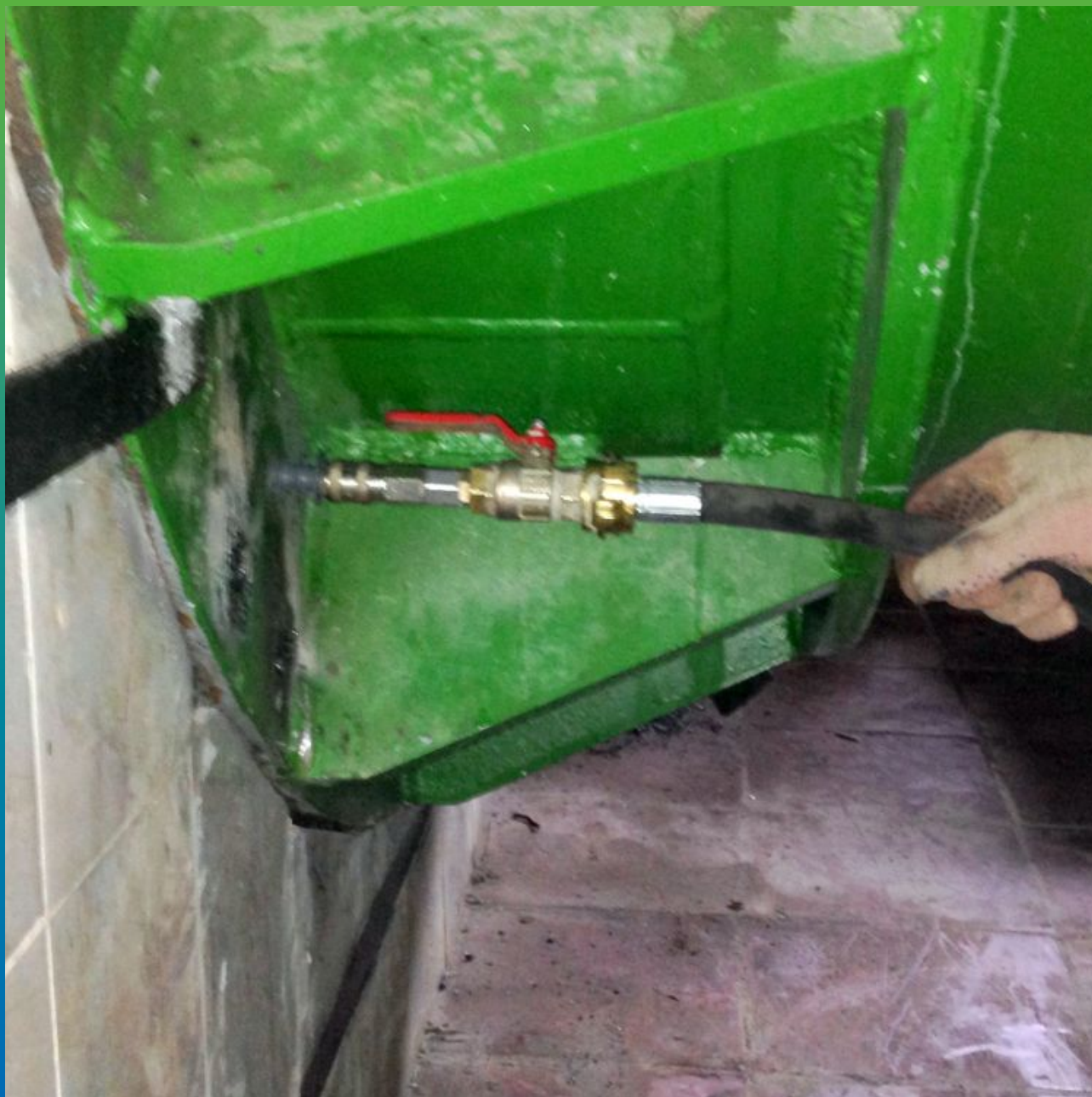
Подключение насоса к пакеру.