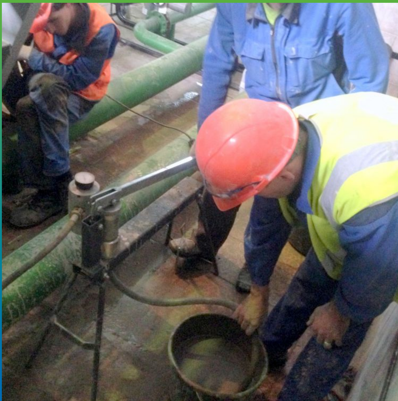
Процесс проведения работ. Общий вид.