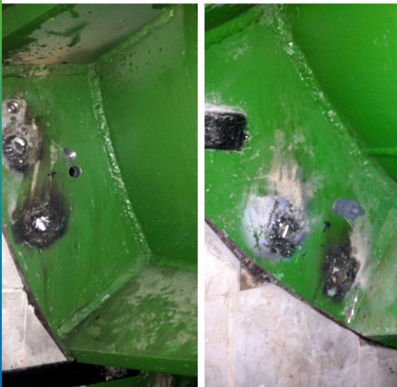
Сверление отверстий + установка пластиковых пакеров БМ 2830