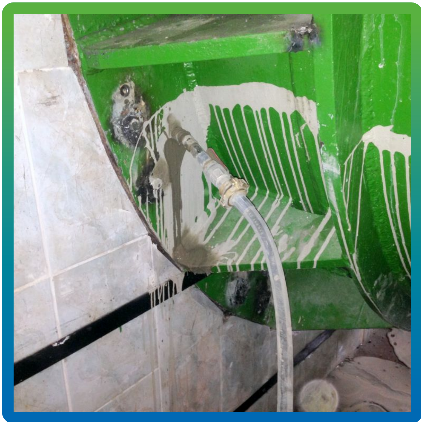
Процесс проведения работ. Детализация.