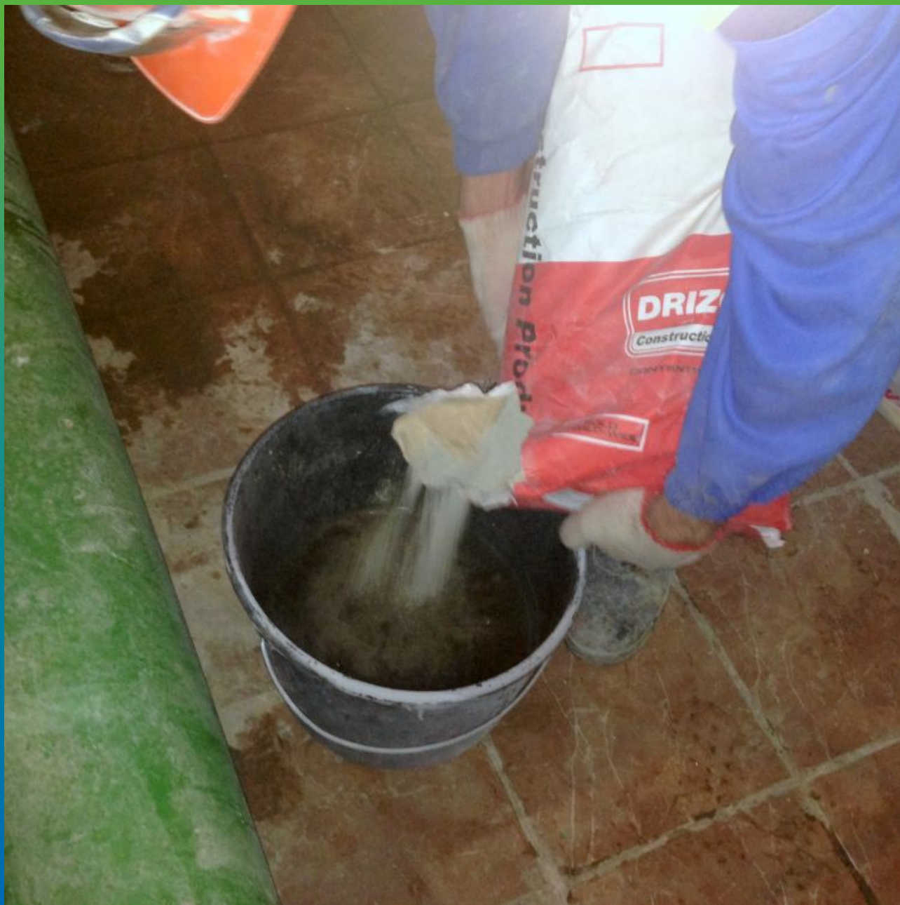
Затворение микроцементного состава с водой.