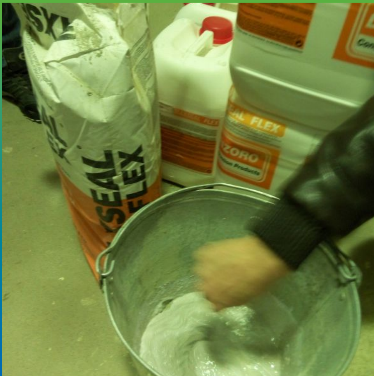
Затворение 2-х компонентов эластичной гидроизоляции Максил Флекс