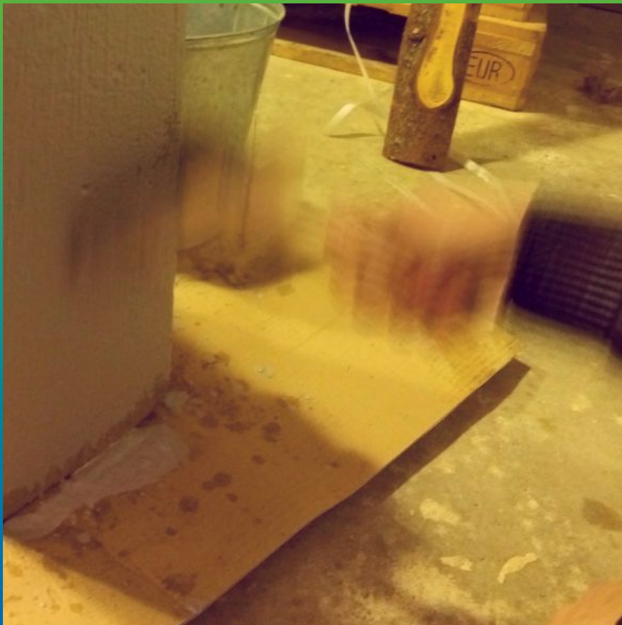
Нанесение на смоченную поверхность Максил Флекс