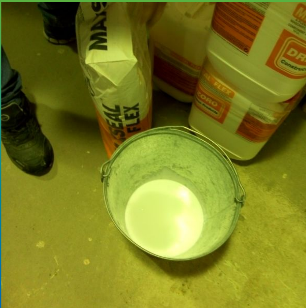
Затворение 2-х компонентов эластичной гидроизоляции Максил Флекс