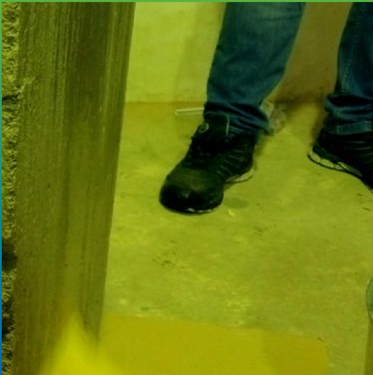
Смачивание водой поверхности перед нанесением Максил Флекс