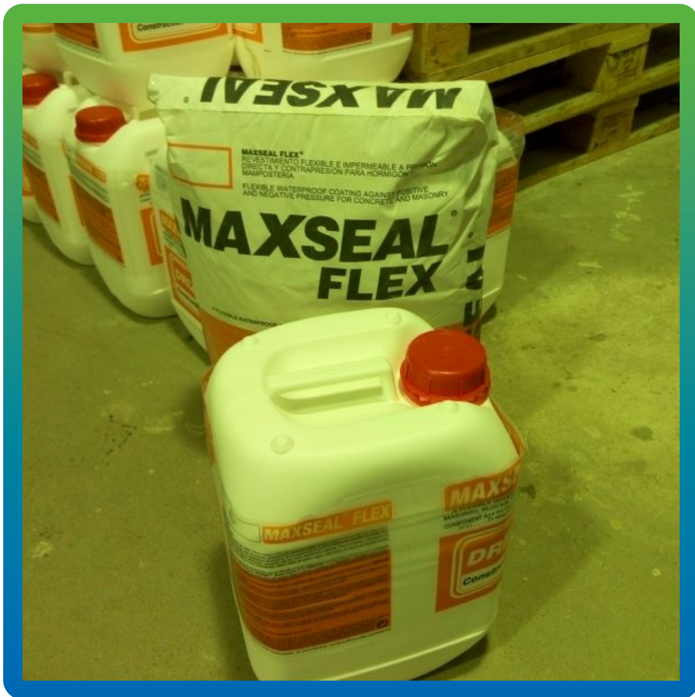
Затворение 2-х компонентов эластичной гидроизоляции Максил Флекс