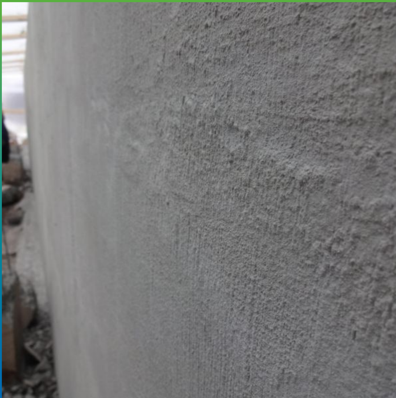
Вид готовой поверхности с нанесенной гидроизоляцией Максил Флекс