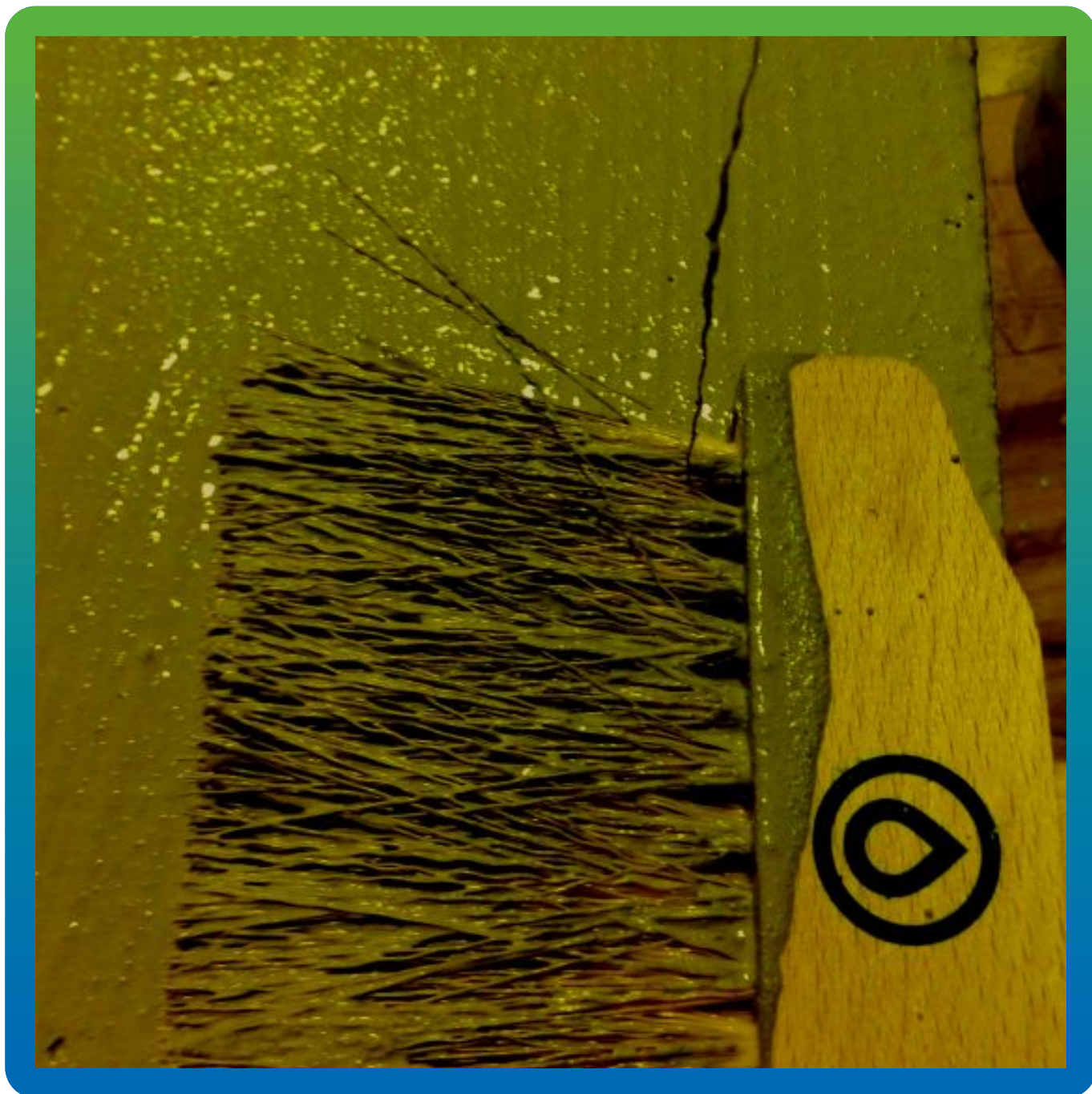
Нанесение на смоченную поверхность Максил Флекс