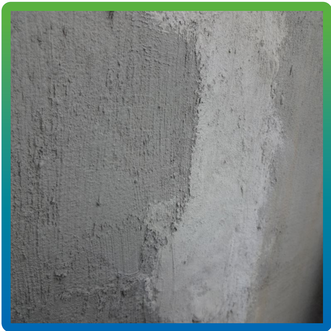
Вид готовой поверхности с нанесенной гидроизоляцией Максил Флекс