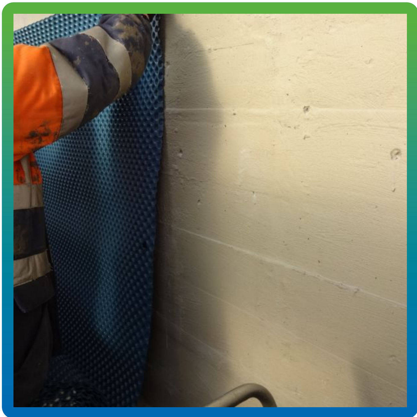
Монтаж ПВХ-Мембраны Максдрейн 8