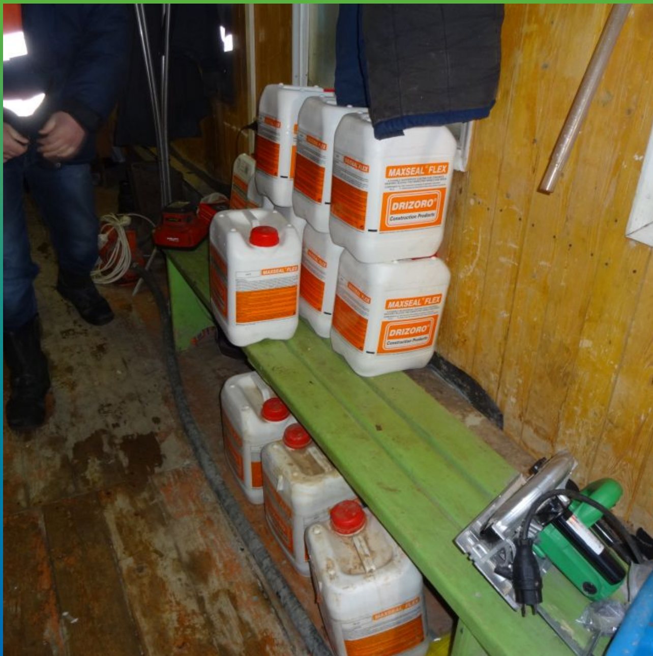
Материалы "Дризоро" на объекте