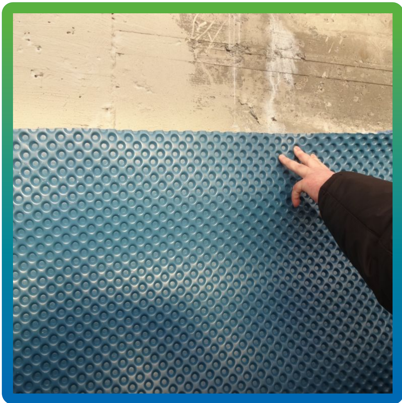
Склейка ПВХ-Мембраны Максдрейн 8 скотчем Бутилбанд