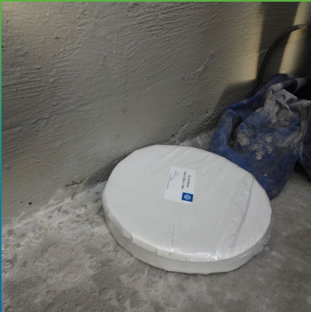
Склейка ПВХ-Мембраны Максдрейн 8 скотчем Бутилбанд