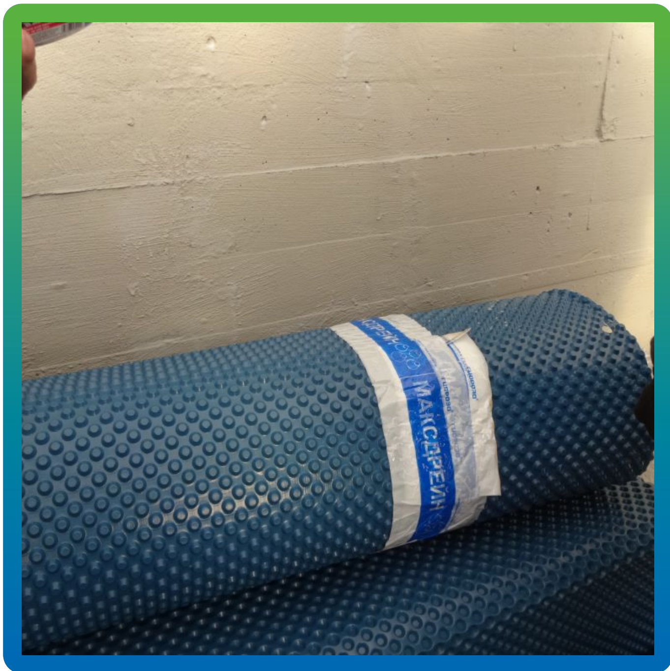
Материалы "Гидрозо" на объекте