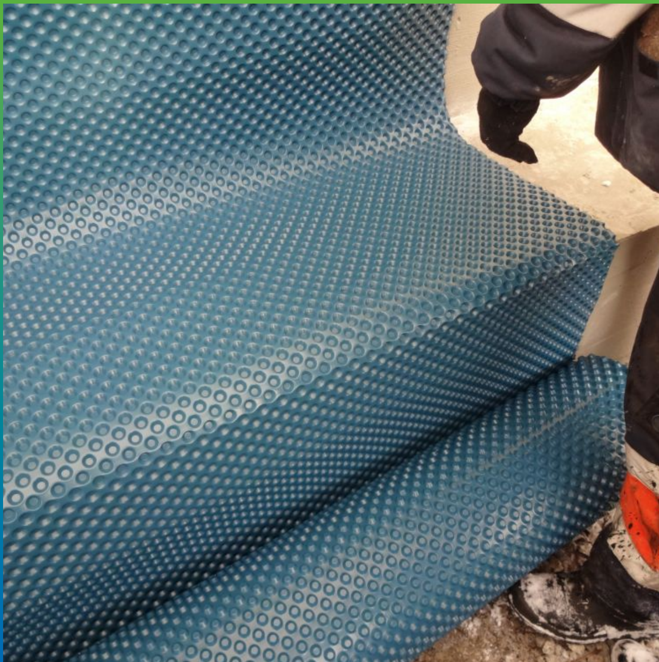
Монтаж ПВХ-Мембраны Максдрейн 8