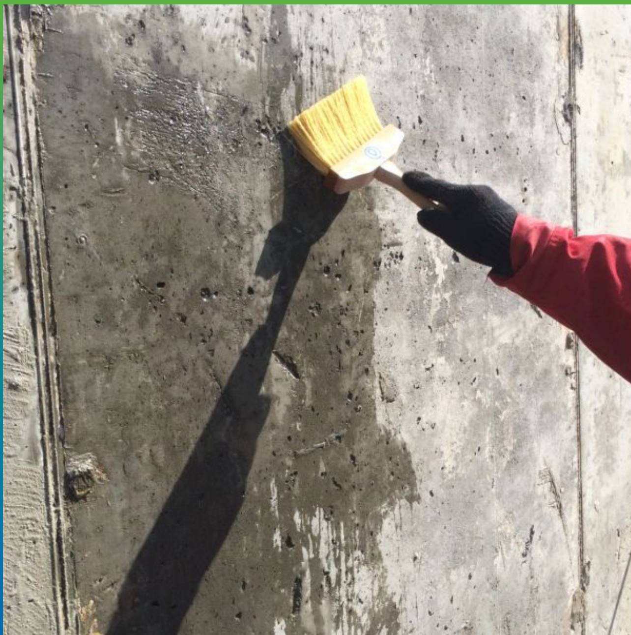
Увлажнение стены перед нанесением