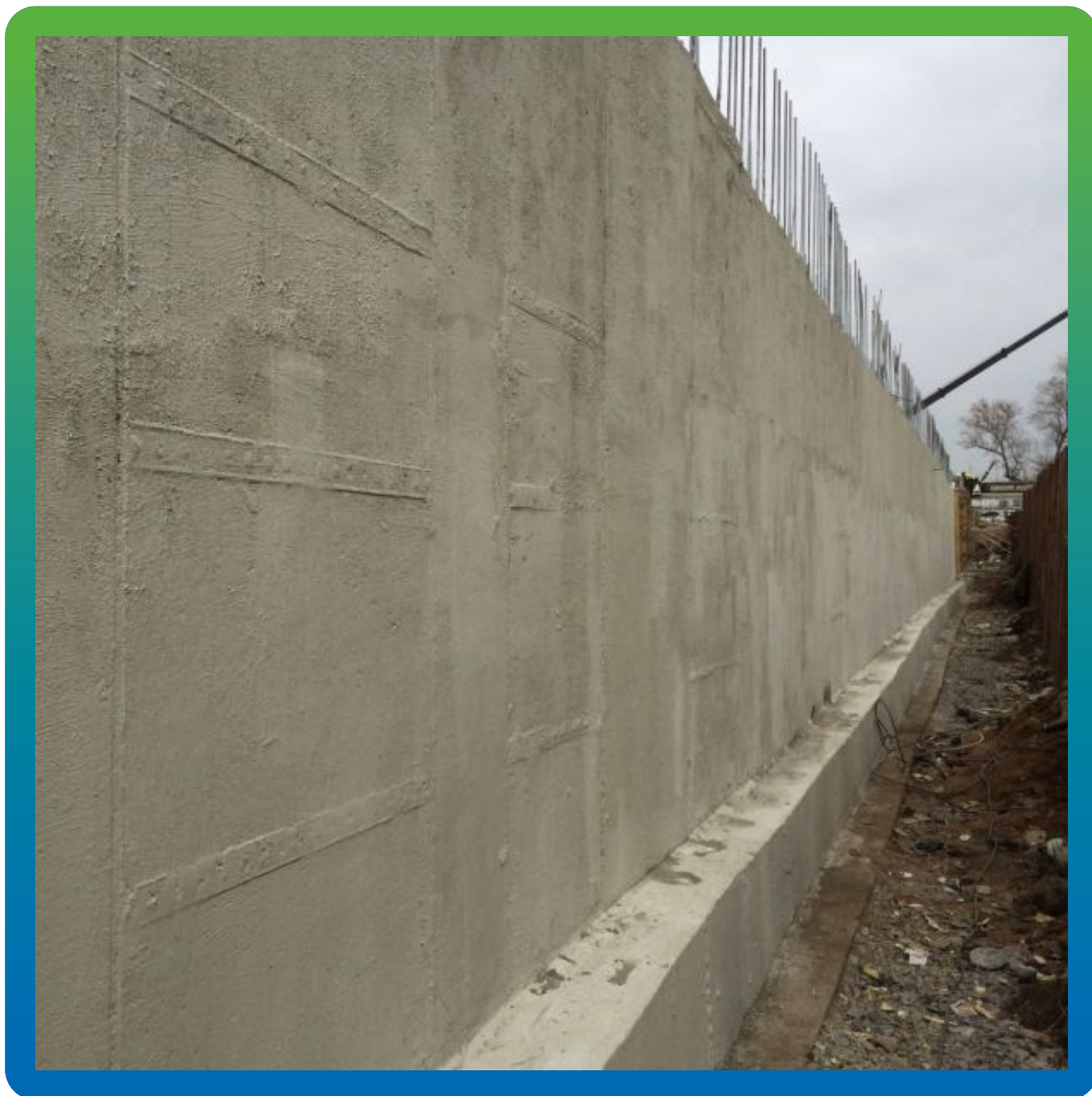
Вид стены, обмазанной Макссил Супер в два слоя