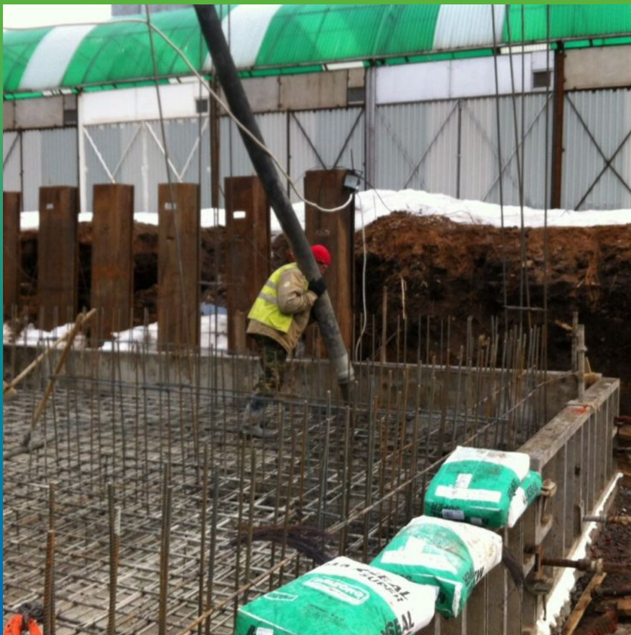
Начало бетонирования плиты