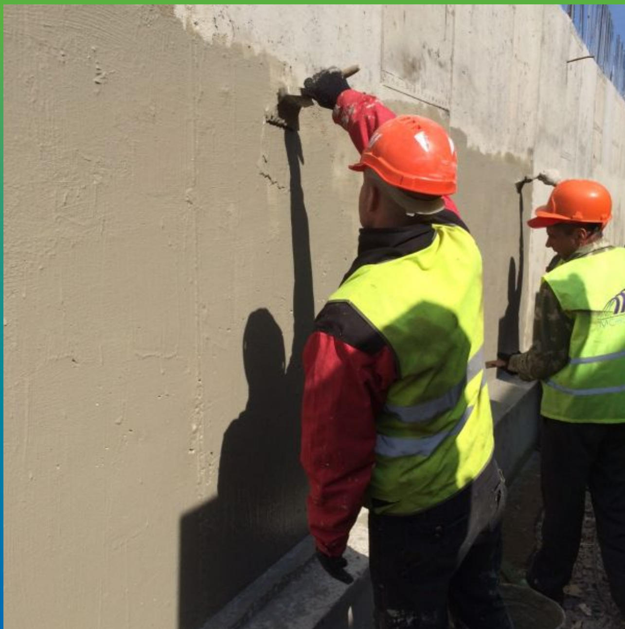
Нанесение первого слоя гидроизоляции Максил Супер