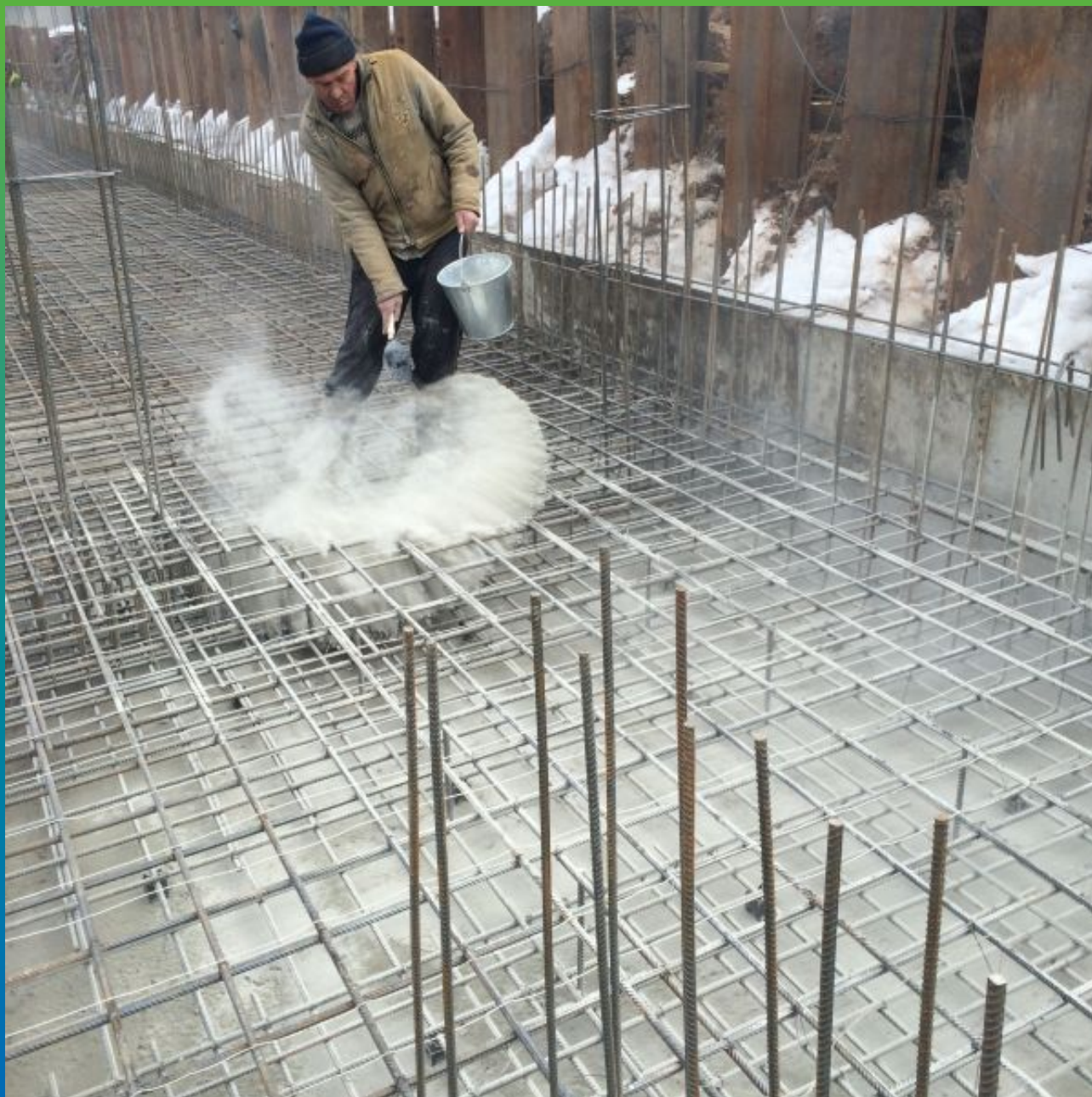
Просыпка материала по бетонной подготовке с расходом 3 кг/м 2