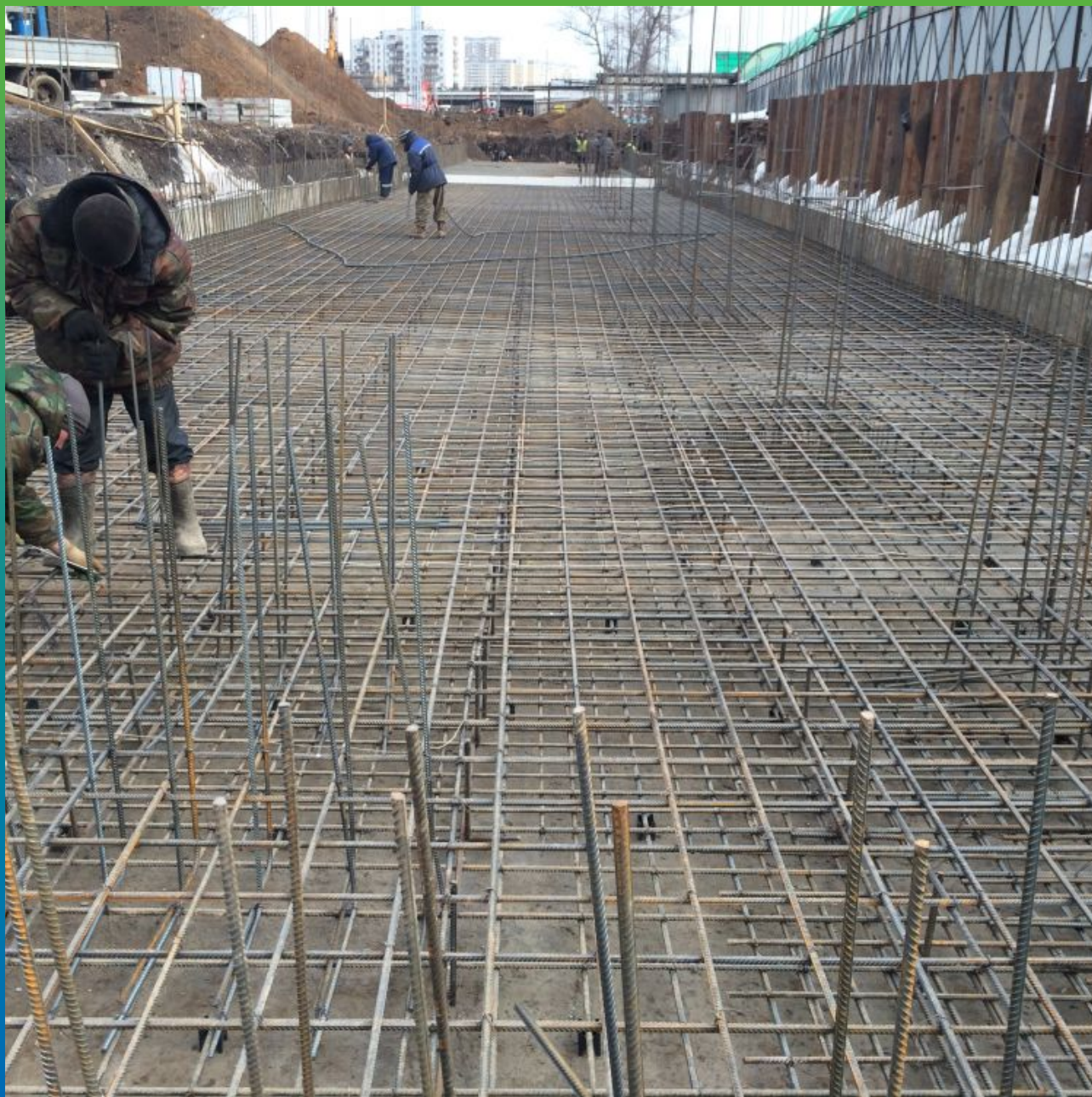
Вид смонтированного каркаса фундаментной плиты до начала работ