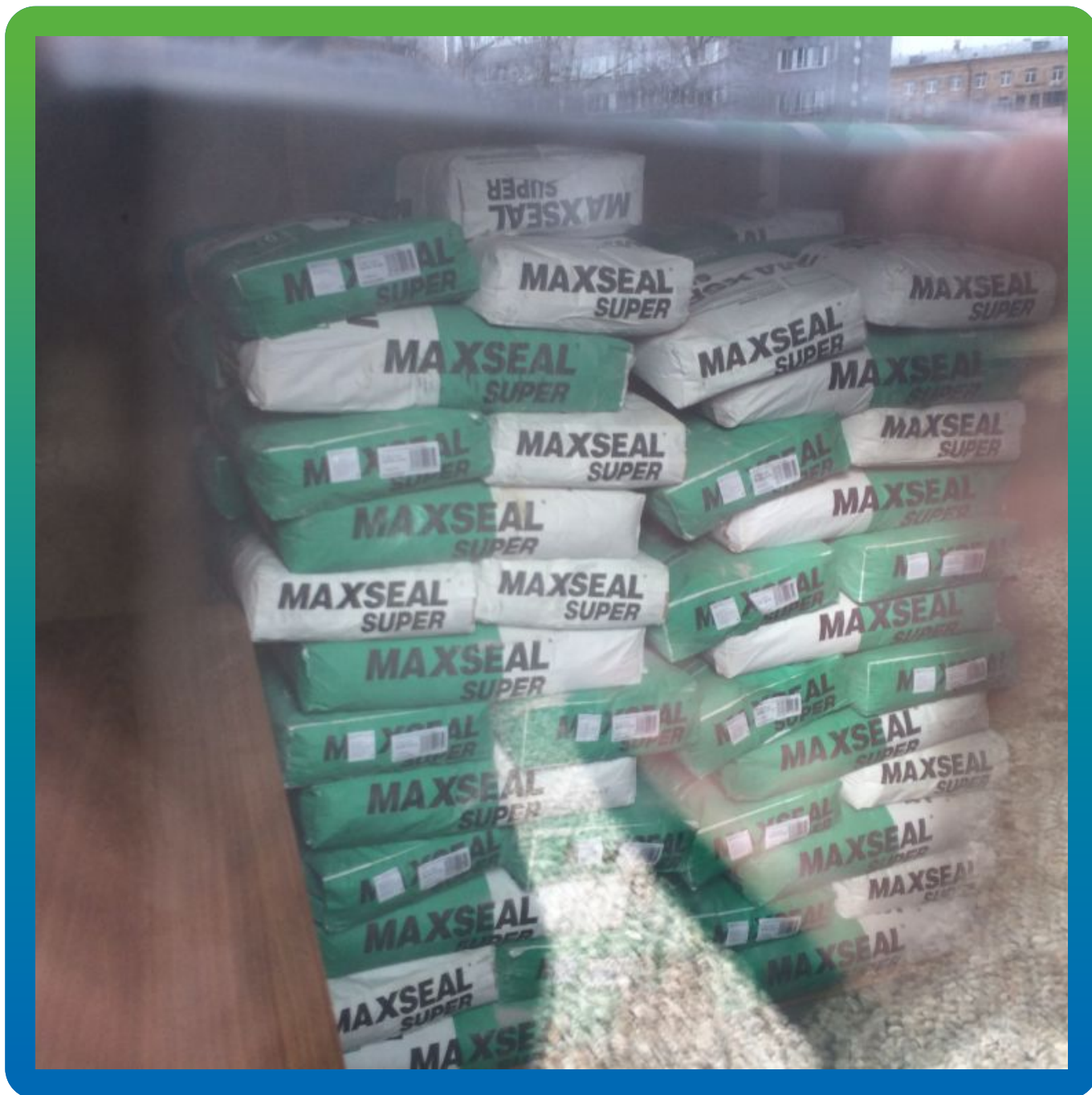
Хранение материала на объекте