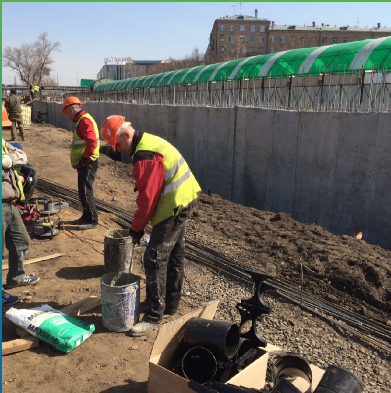
Приготовление смеси Максил Супер для вертикального нанесения