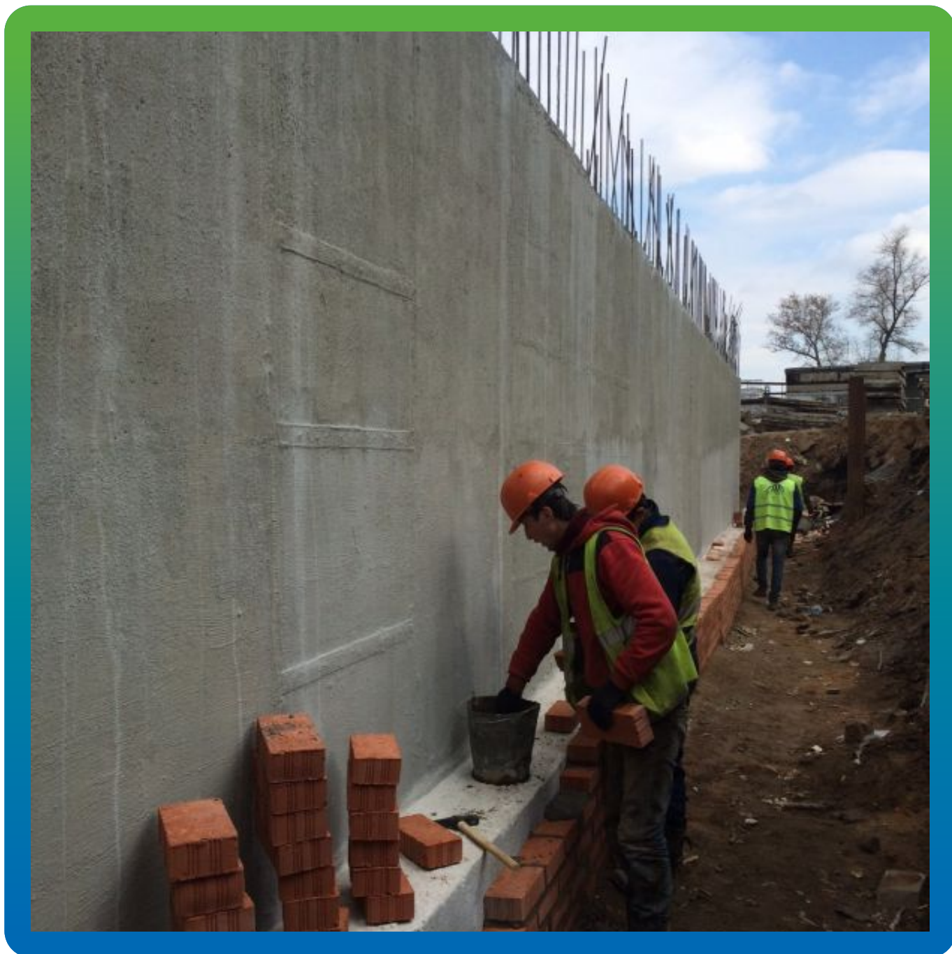
Выполнение защитной кирпичной стенки