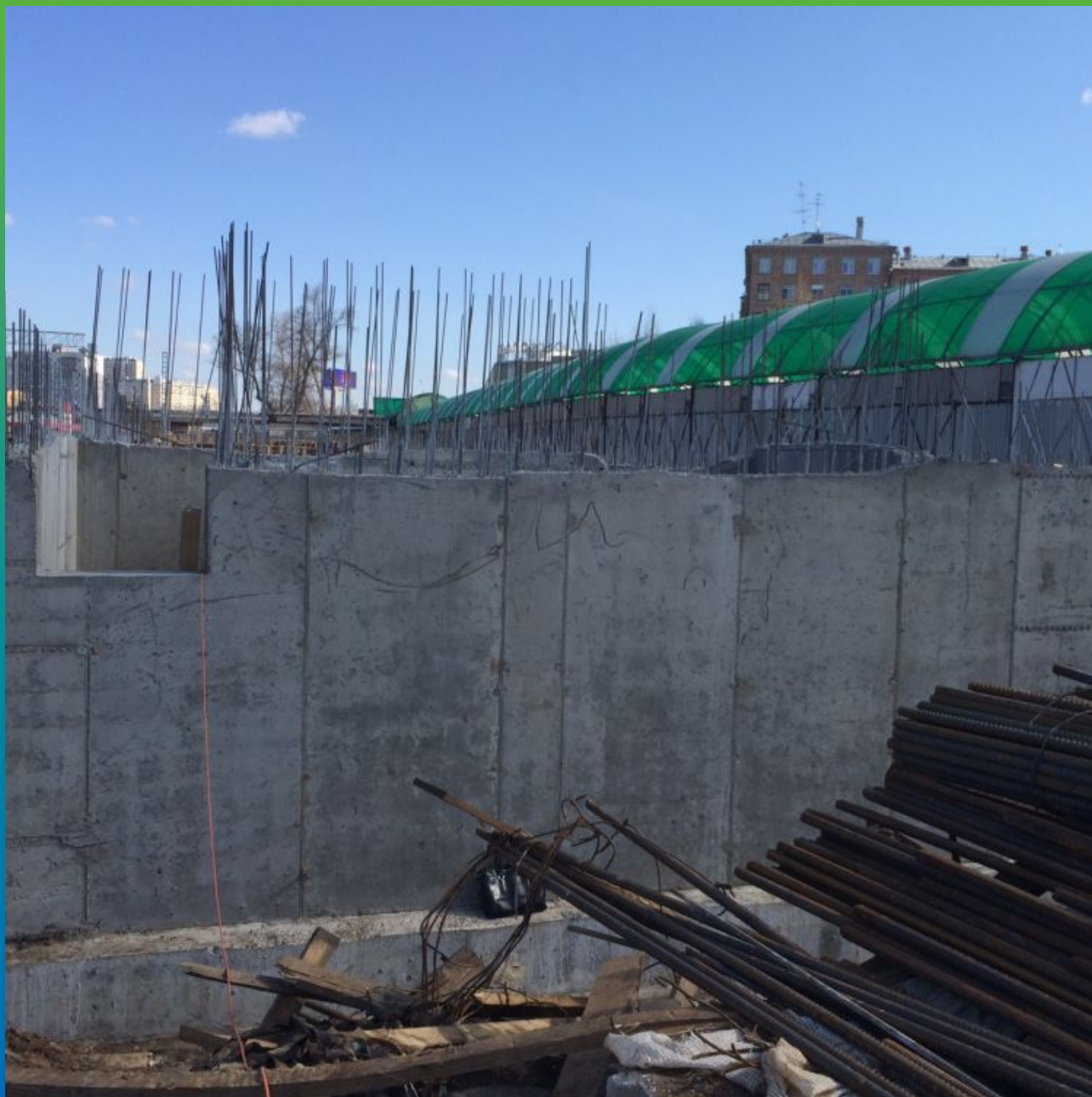
Стены подземной части здания