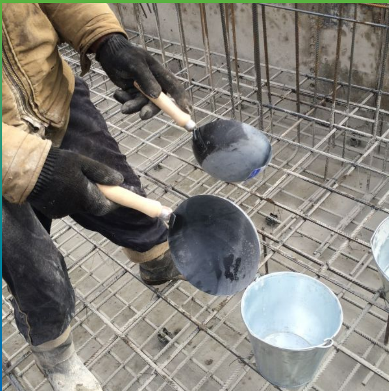
Инструмент для выполнения работ