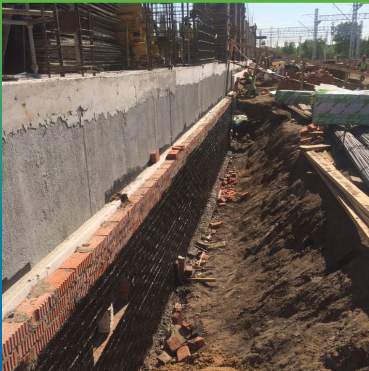
Выполненная прижимная защитная стенка