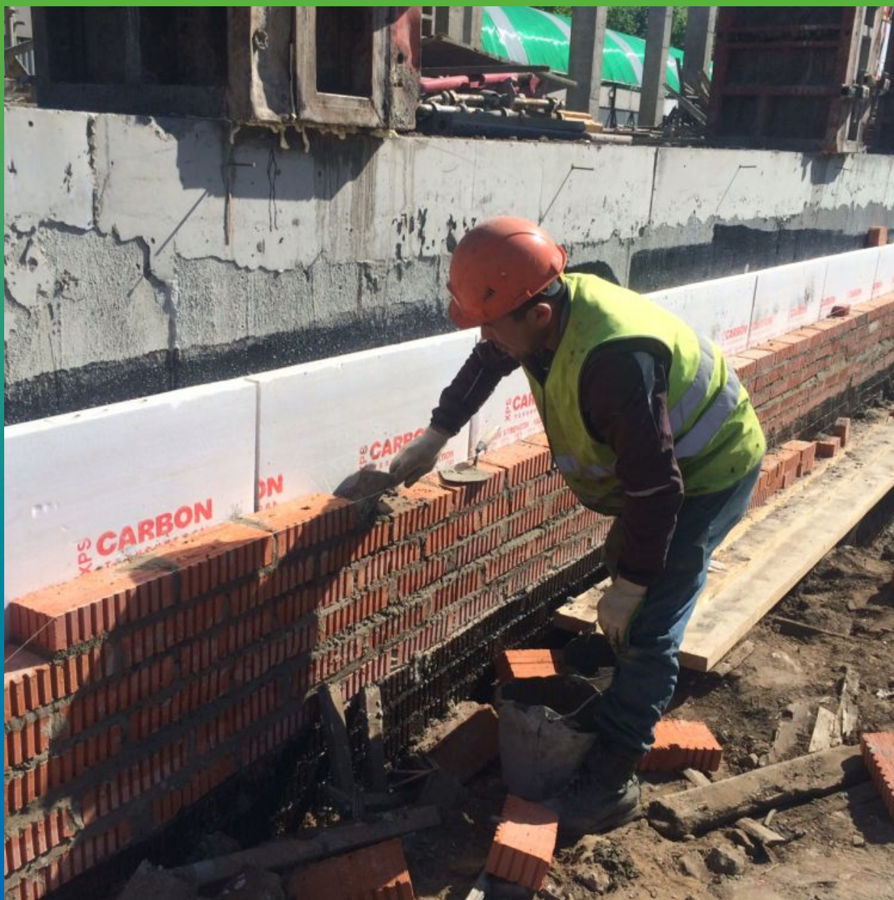
Выполненная прижимная защитная стенка