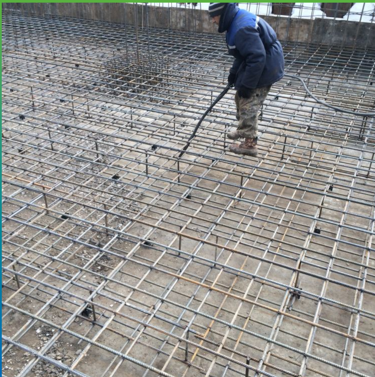
Очистка бетонной подготовки от пыли и грязи струей воздуха