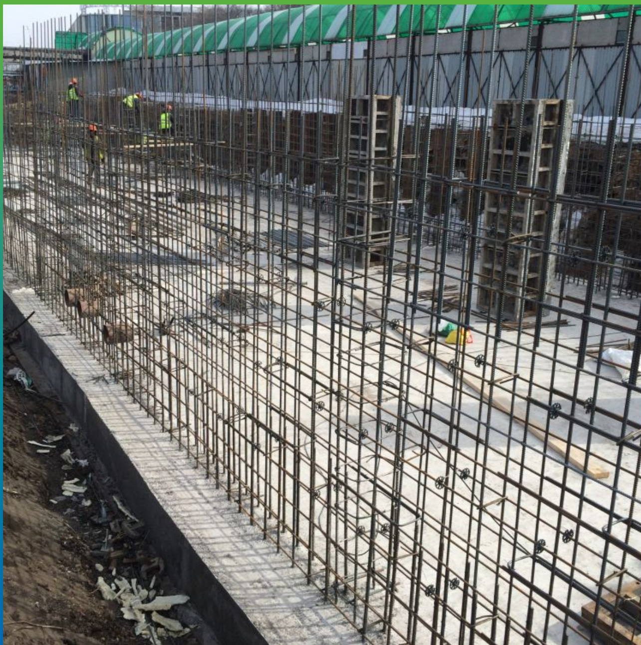
Готовая фундаментная плита