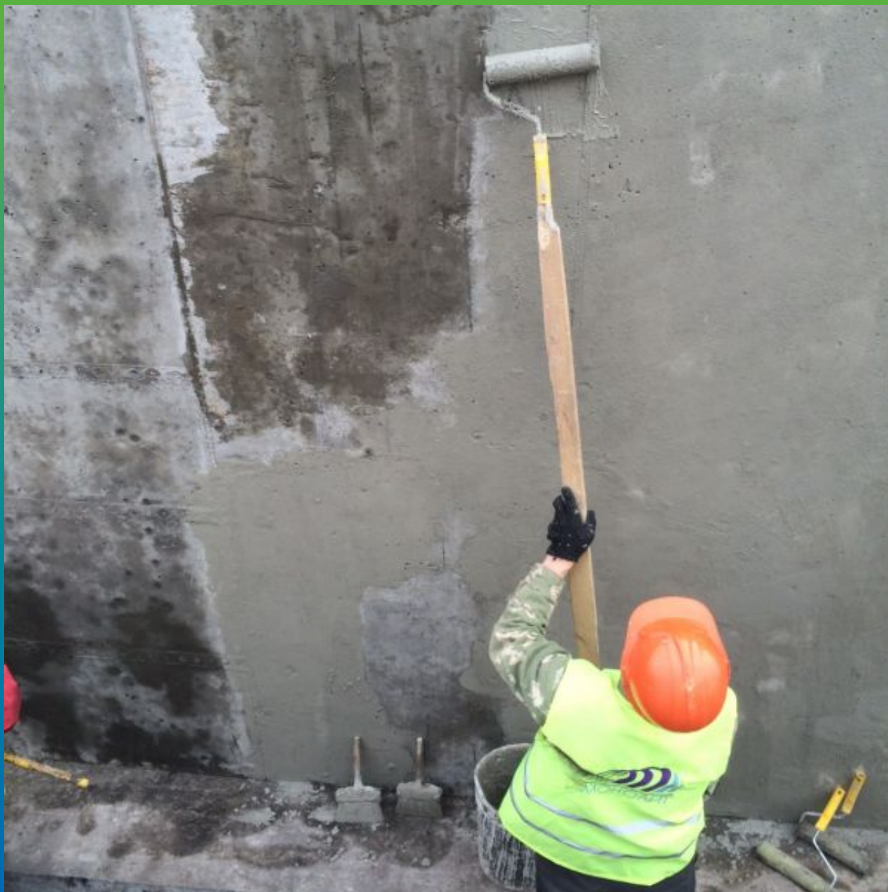
Нанесение первого слоя гидроизоляции Максил Супер