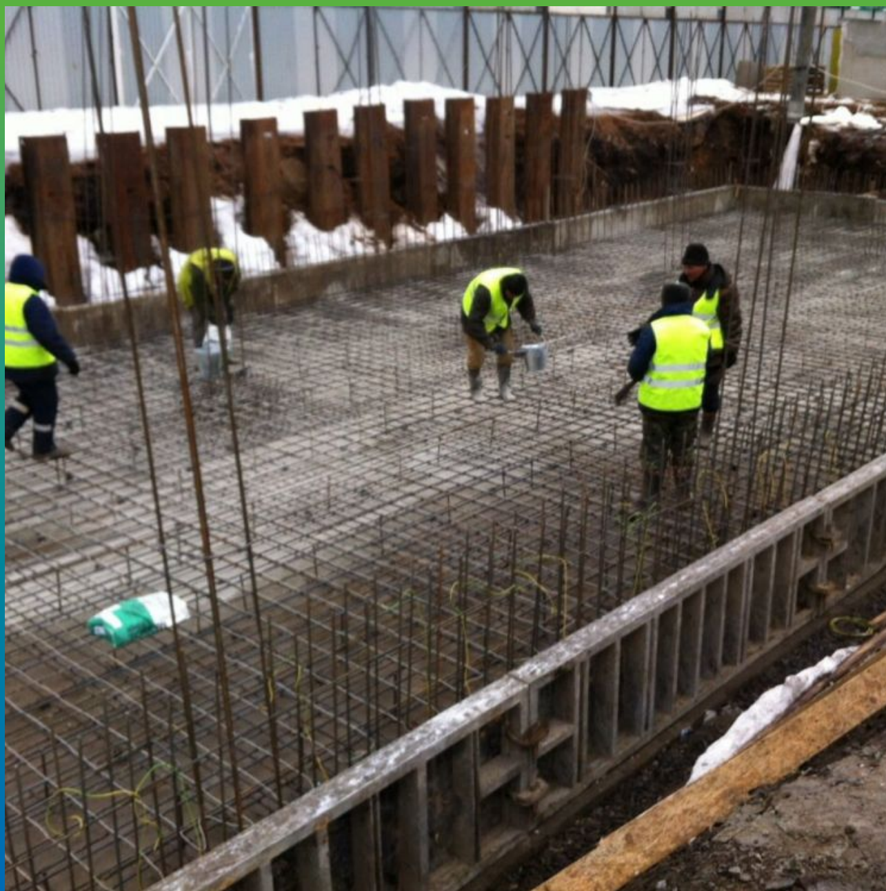
Просыпка материала по бетонной подготовке расходом 3 кг/м 2