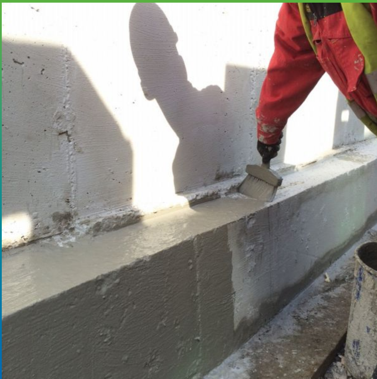
Нанесение второго слоя гидроизоляции Максил Супер