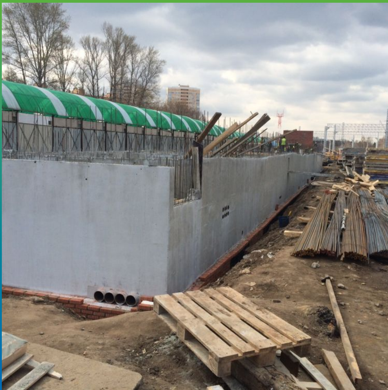
Выполнение защитной кирпичной стенки