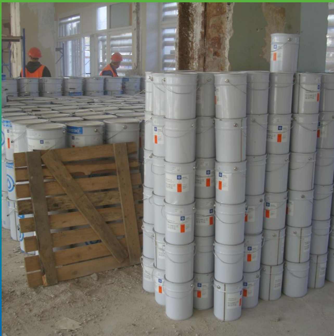
Хранение материалов на объекте