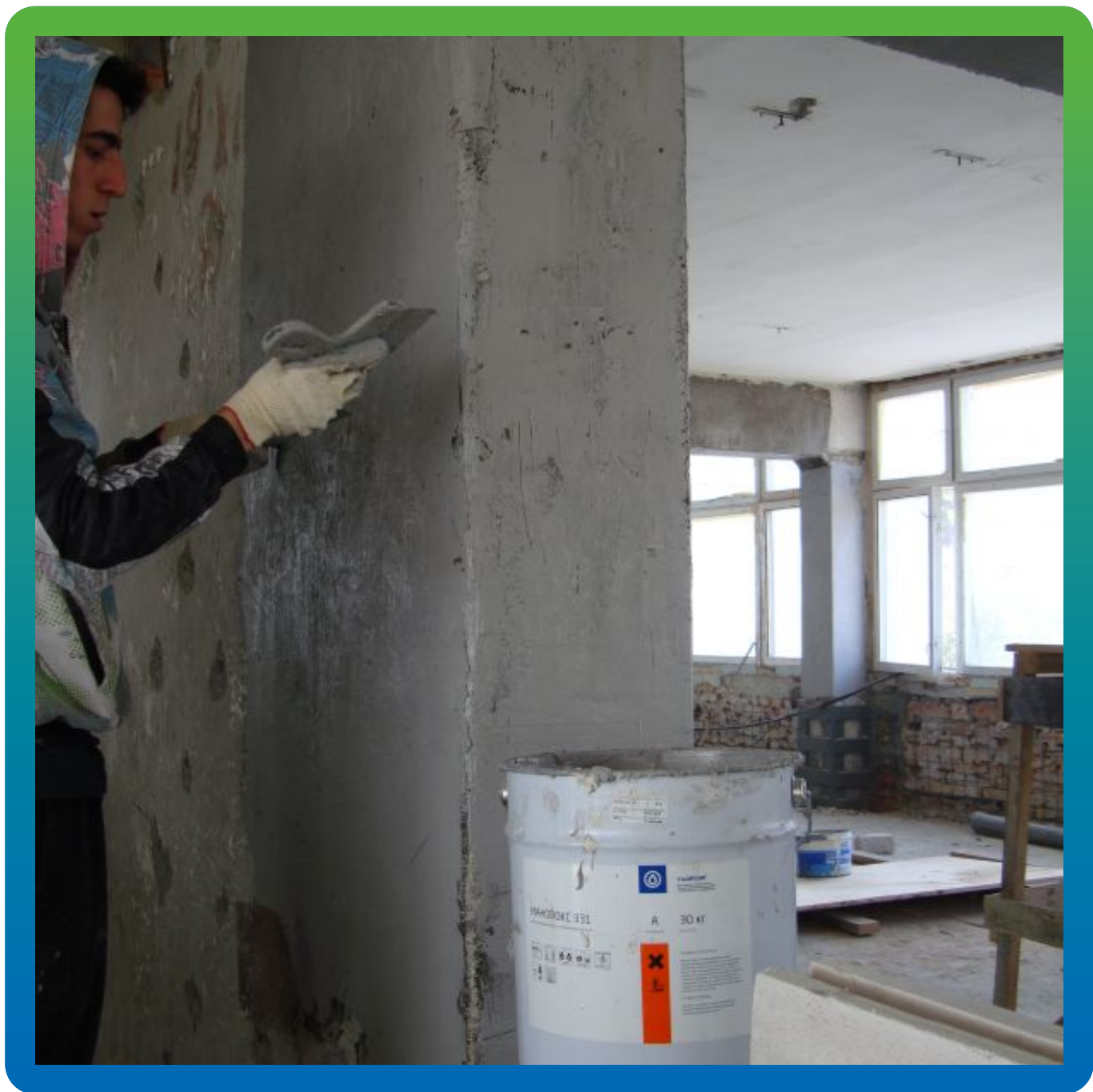
Нанесение Манопокс 331