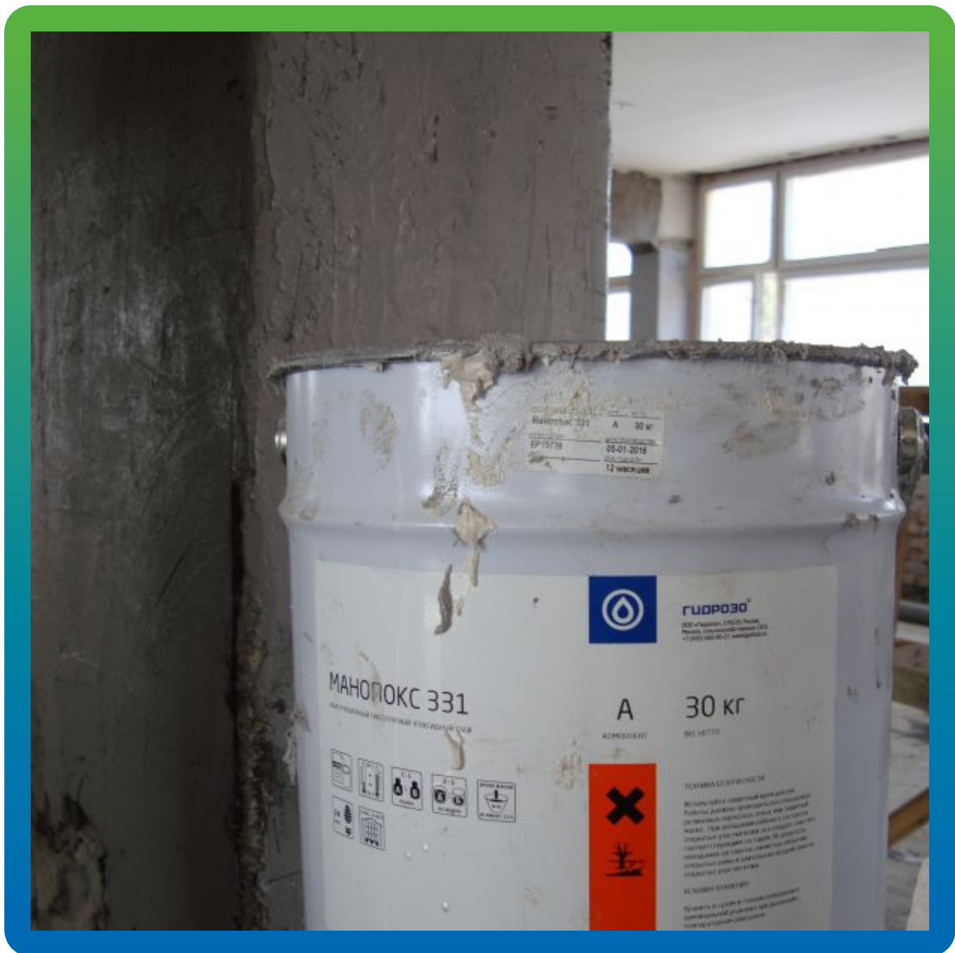
Манопокс 331 на объекте