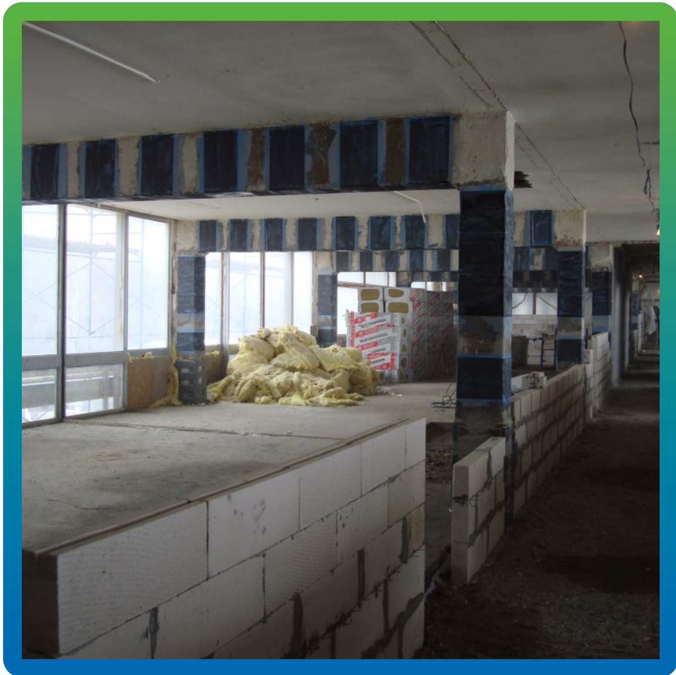
Корпус, элементы которого усилены с применением материалов Гидрозо