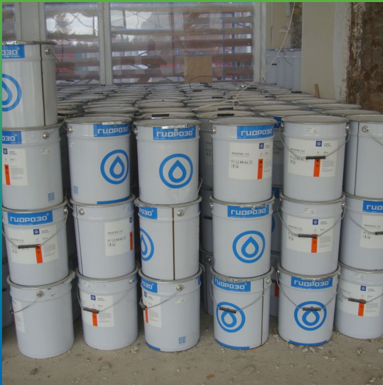
Манопокс 183 эпоксидный клей для углепластика