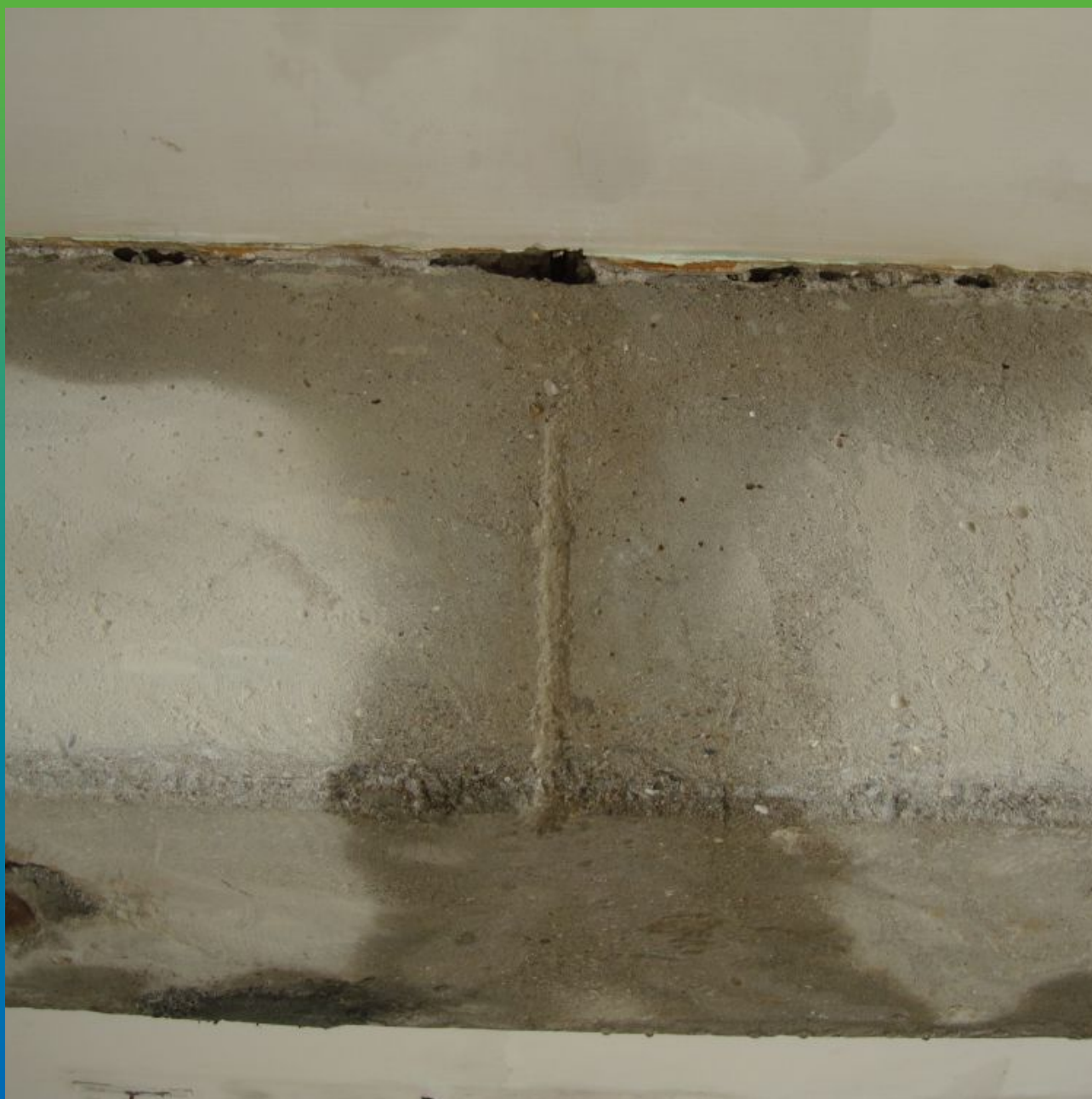
Дефекты несущих элементов