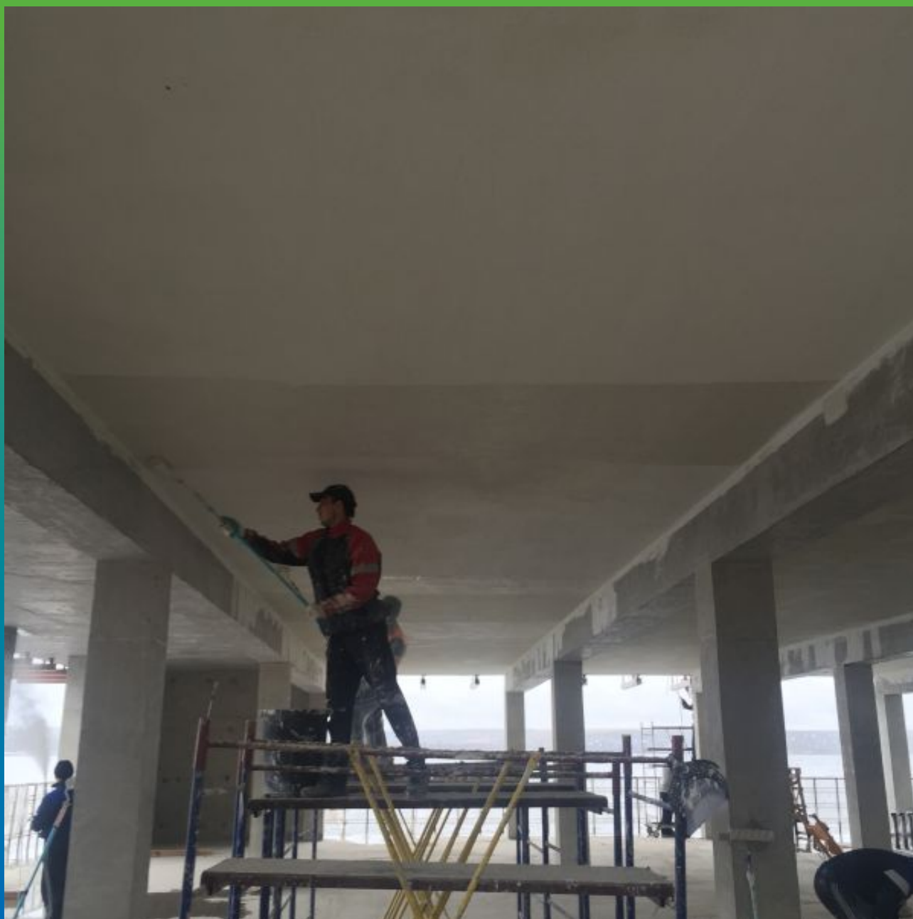
Нанесение второго слоя Максил Супер