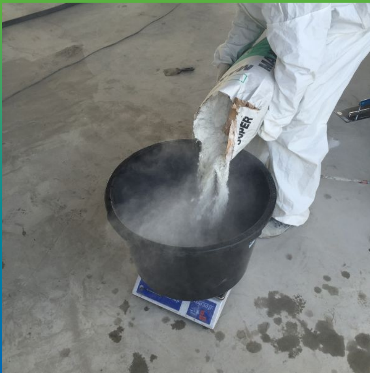
Приготовление состава Максил Супер