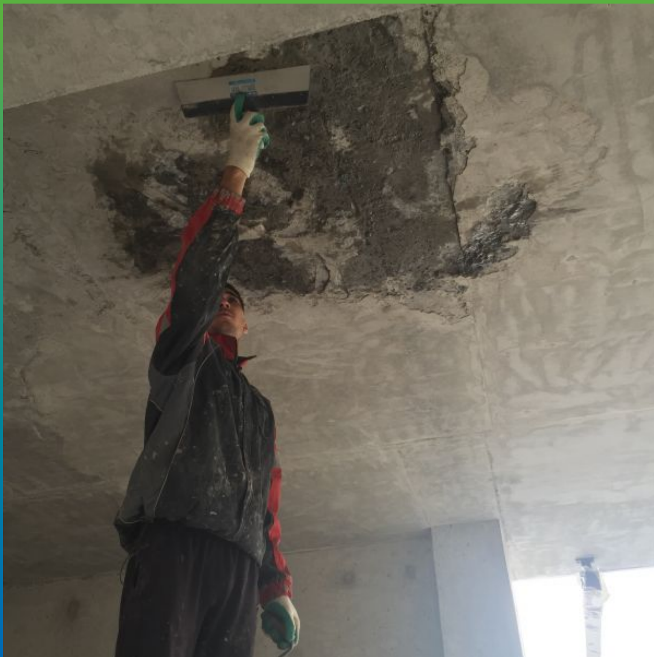
Выравнивание дефектов ж/б поверхности