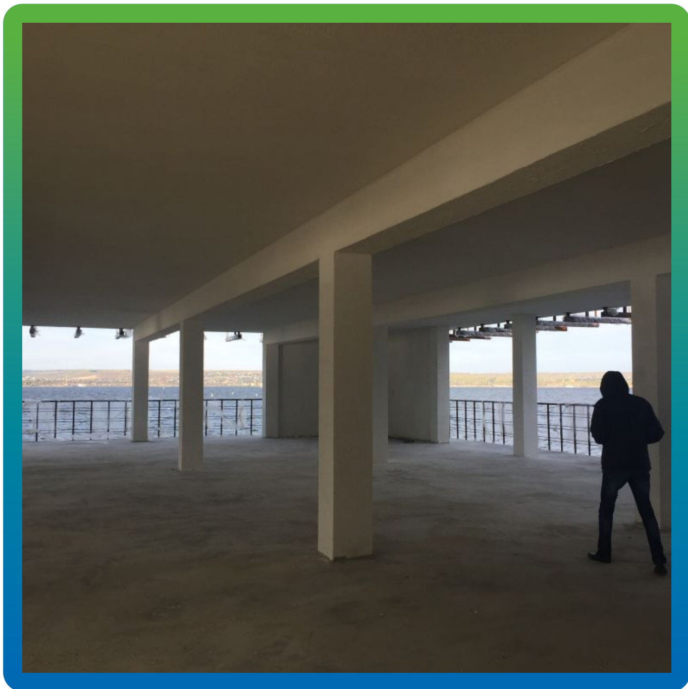
Окончательный вид нижней части вертолетной площадки