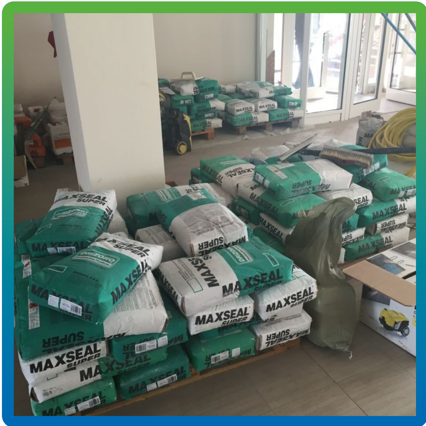
Материал на объекте