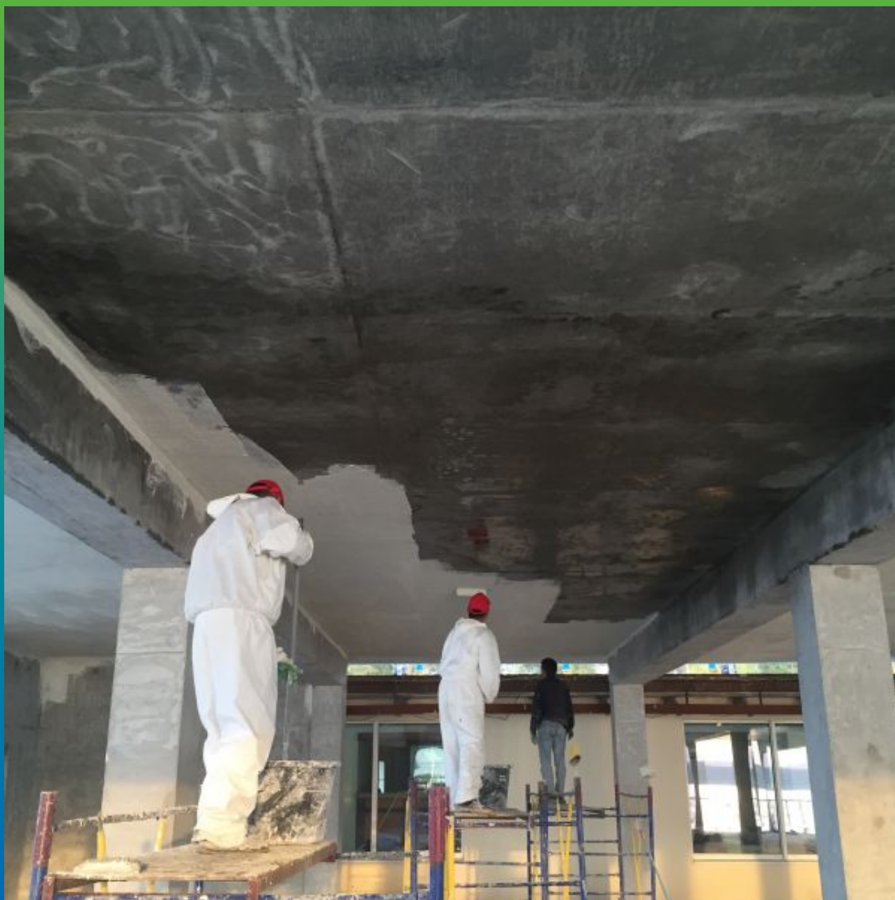
Нанесение первого слоя Максил Супер