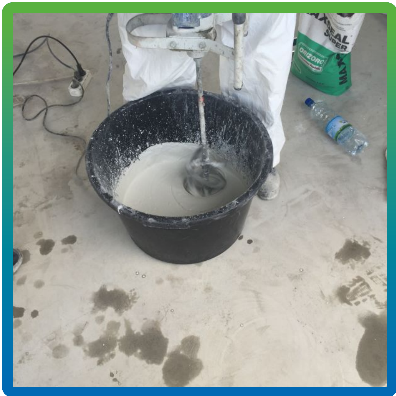
Приготовление состава Макссил Супер