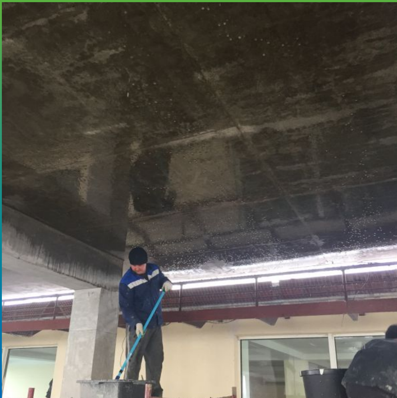
Подготовленная поверхность под нанесение состава Максил Супер