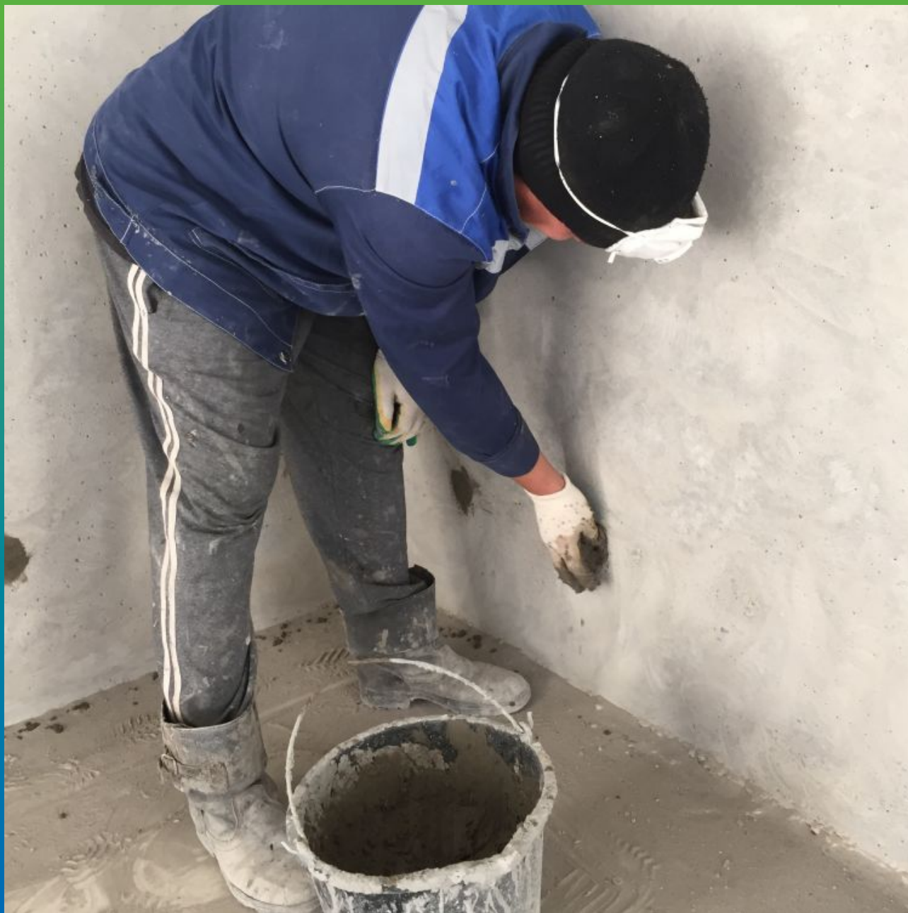
Зачеканка опалубочных отверстий составом Стармекс РМЗ