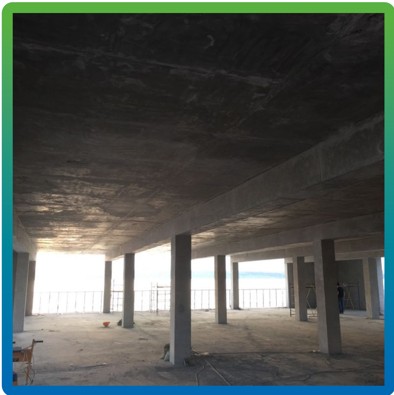
Вид объекта до устройства защитного покрытия Макссил Супер