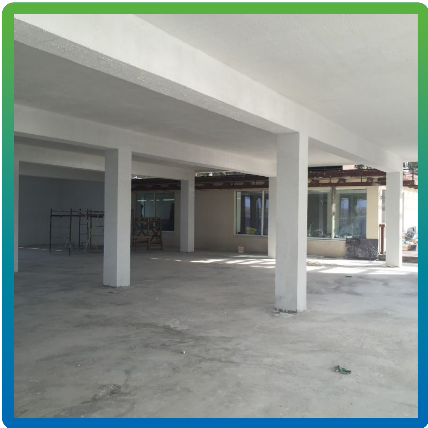
Окончательный вид нижней части вертолетной площадки