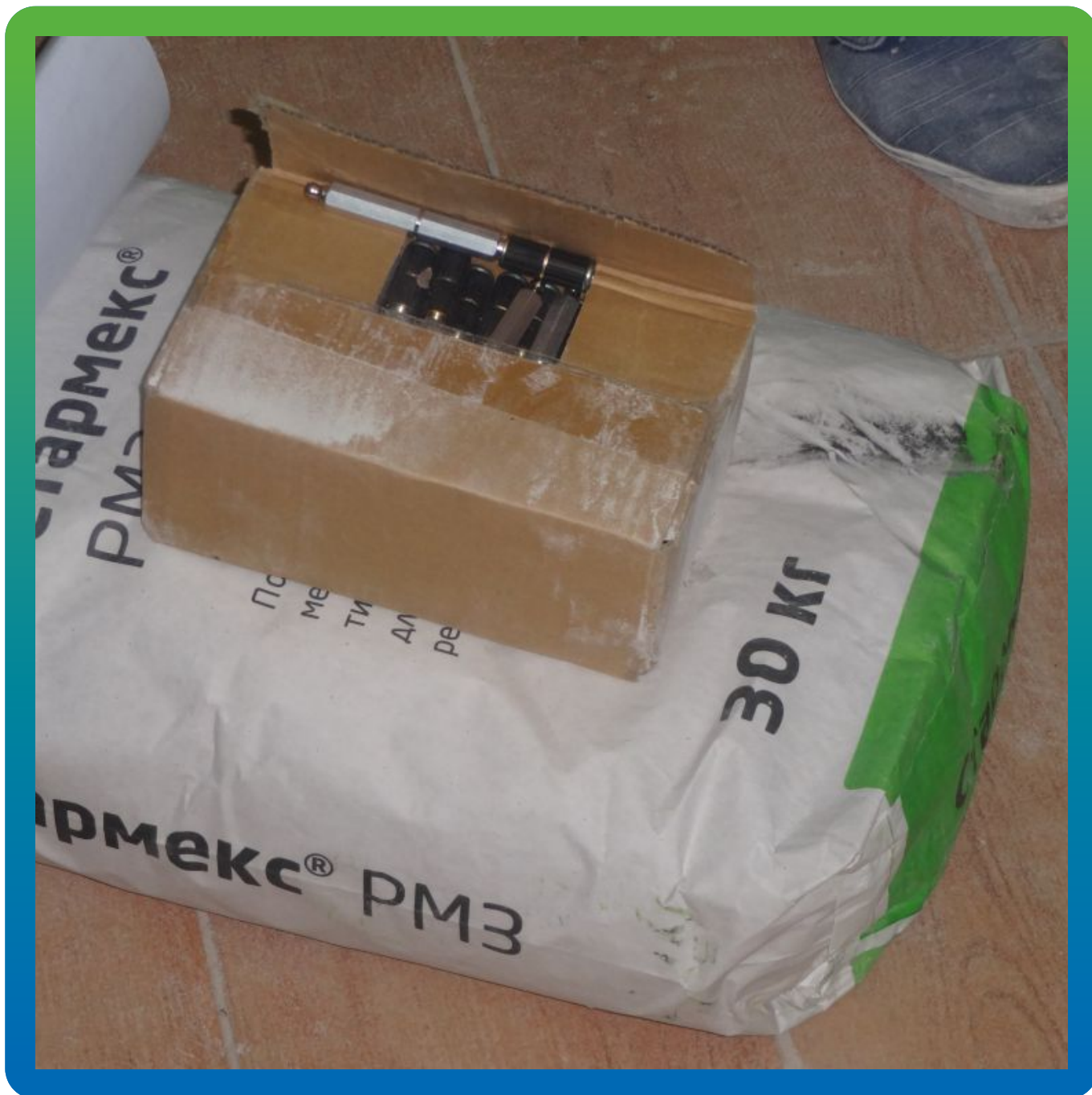
Материалы "Гидрозо" на объекте