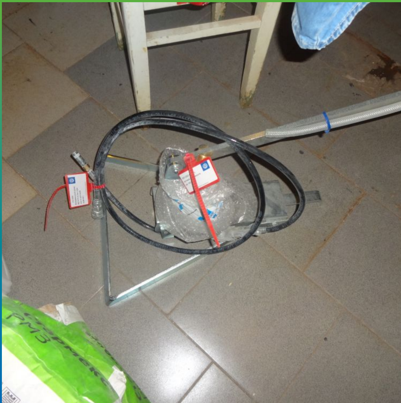
Материалы "Гидрозо" на объекте