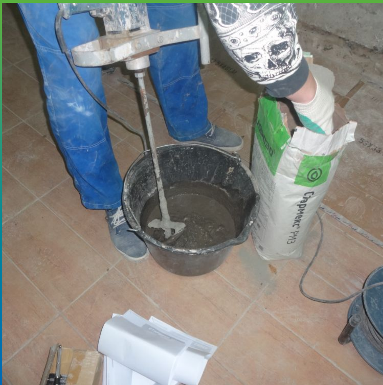
Затворение с водой ремонтного состава Стармекс РМЗ