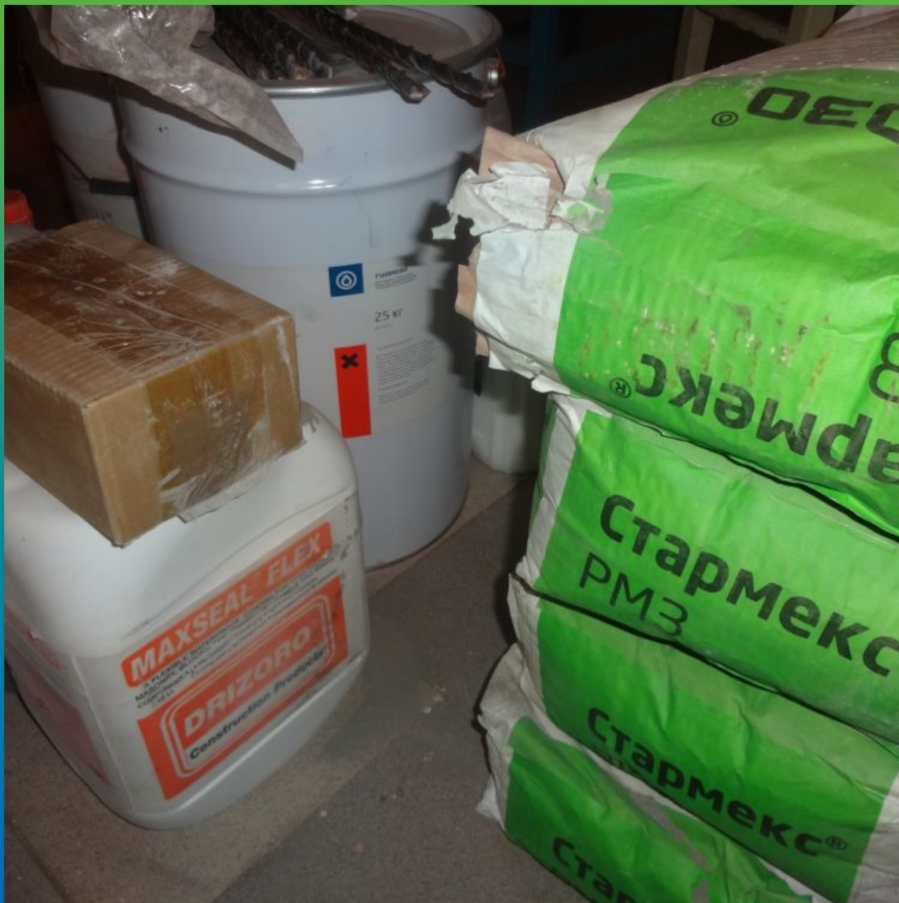
Материалы "Гидрозо" на объекте