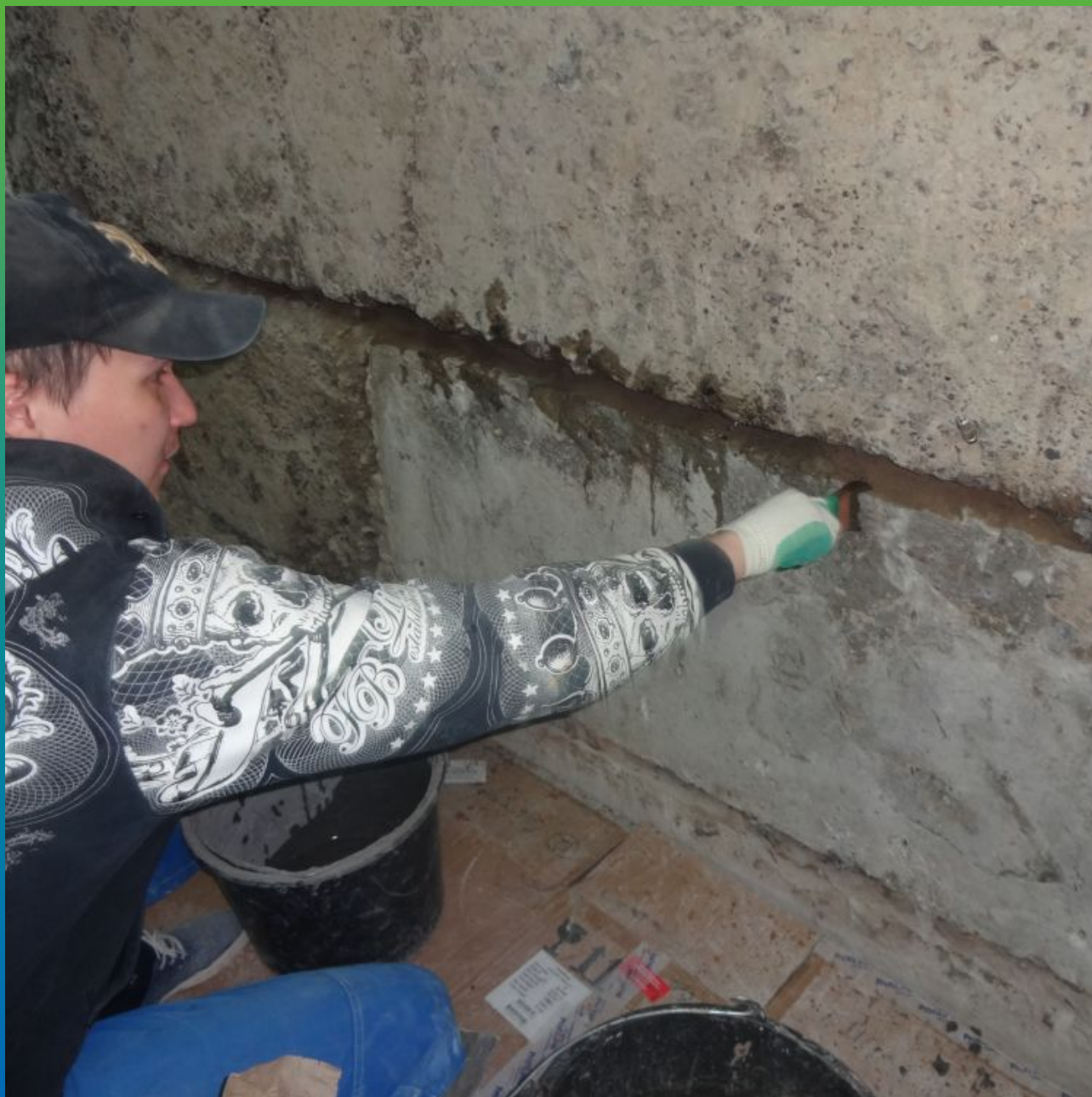
Увлажнение поверхности перед нанесением Стармекс РМЗ