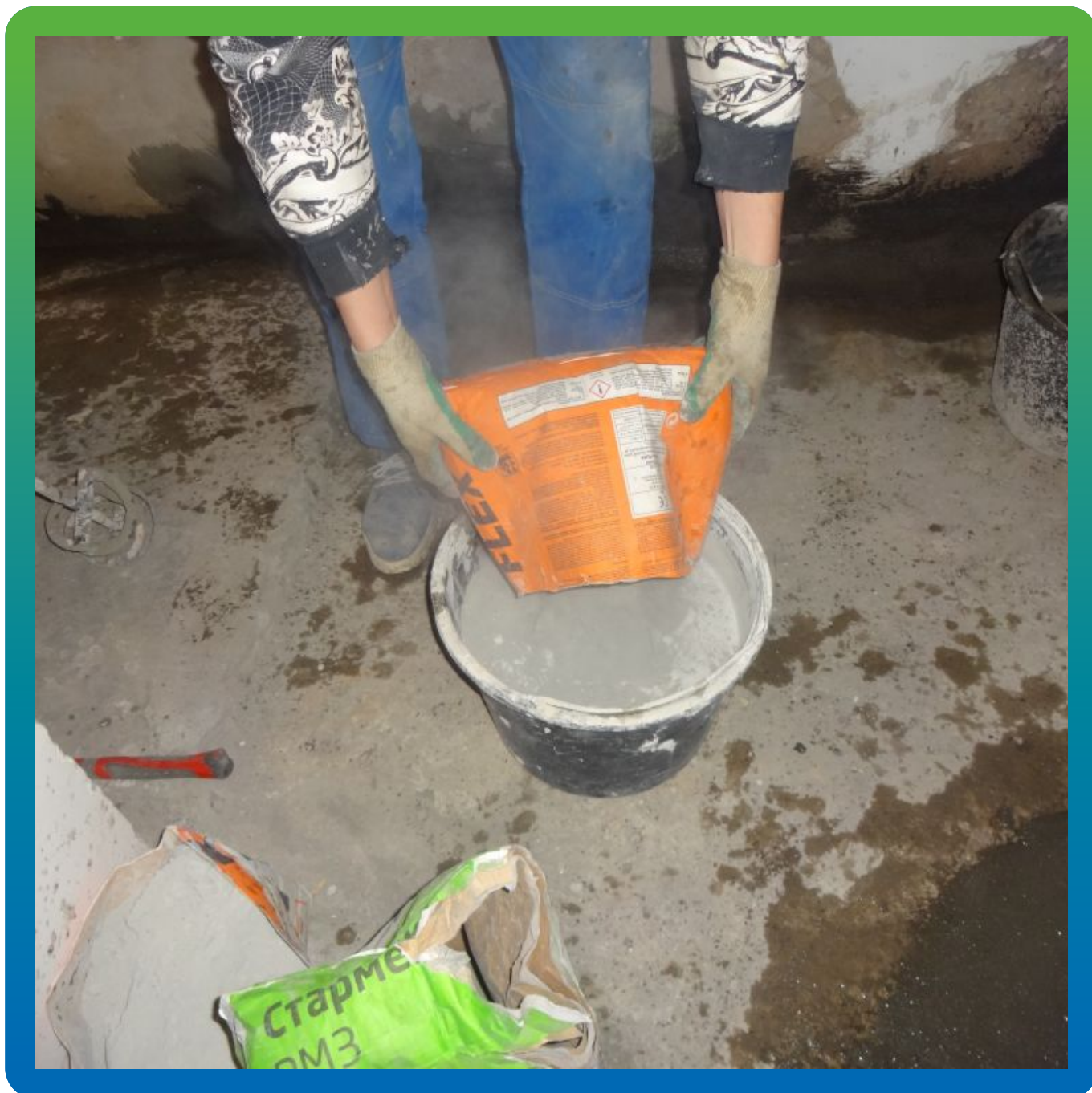
Затворение А+В компонентов эластичной гидроизоляции Максил Флекс