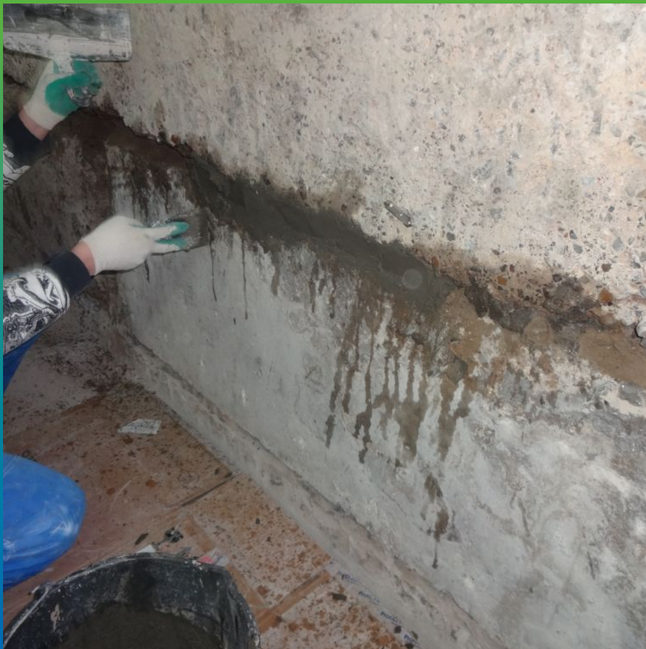
Ремонт швов Стармекс РМЗ