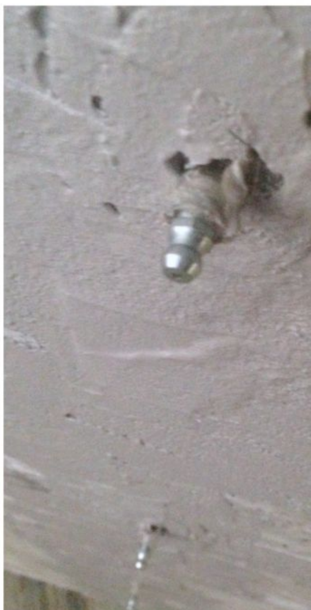
Заделка трещин + установка инъекционных пакеров.