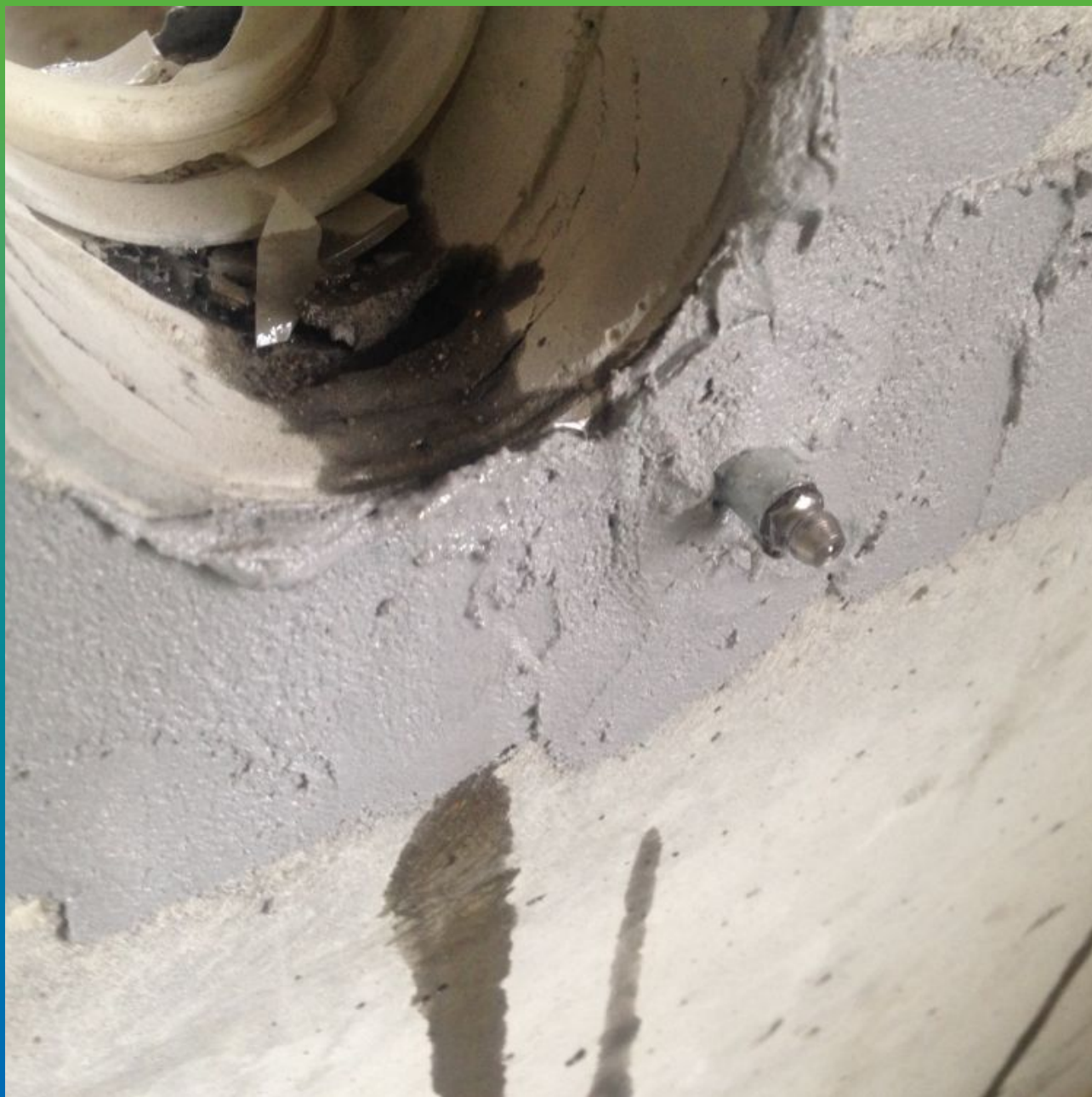
Узел свидетельствующей о распределении эпоксидного состава в трещине.