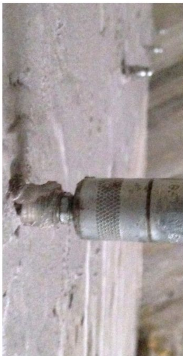
Подключение инъекционного насоса к пакерам.