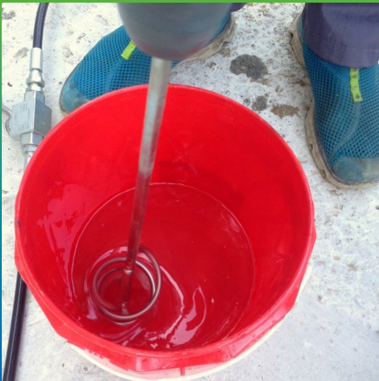
Замешивание эпоксидного состава Манопокс 352.