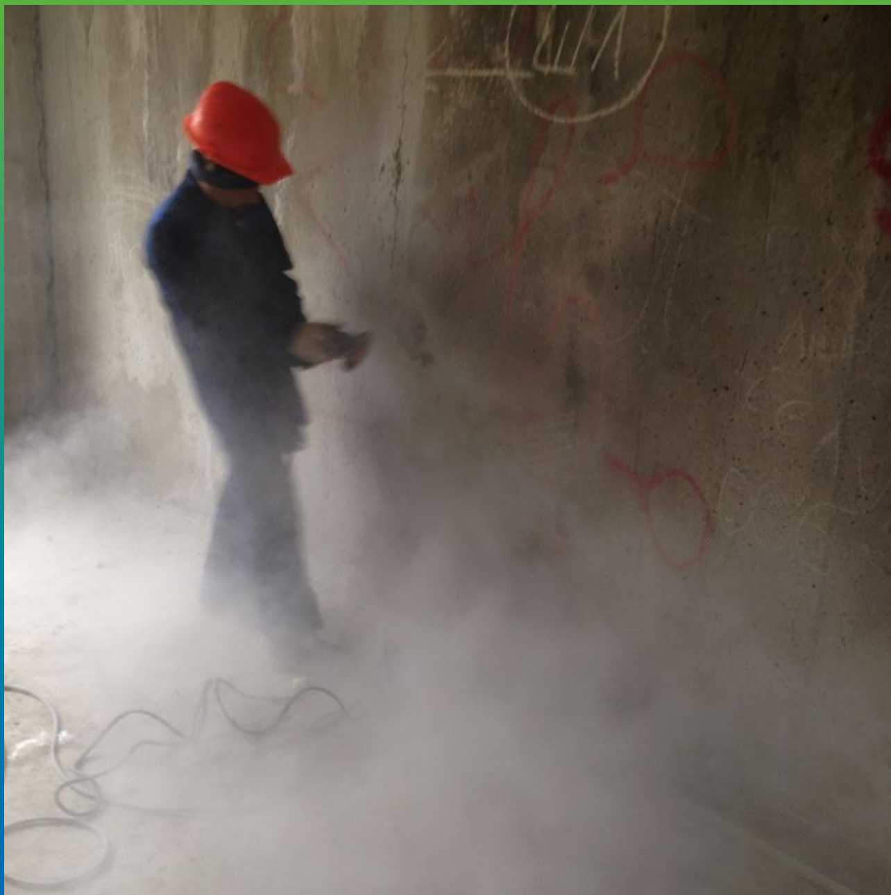
Подготовка трещины. Расшивка и шлифовка.