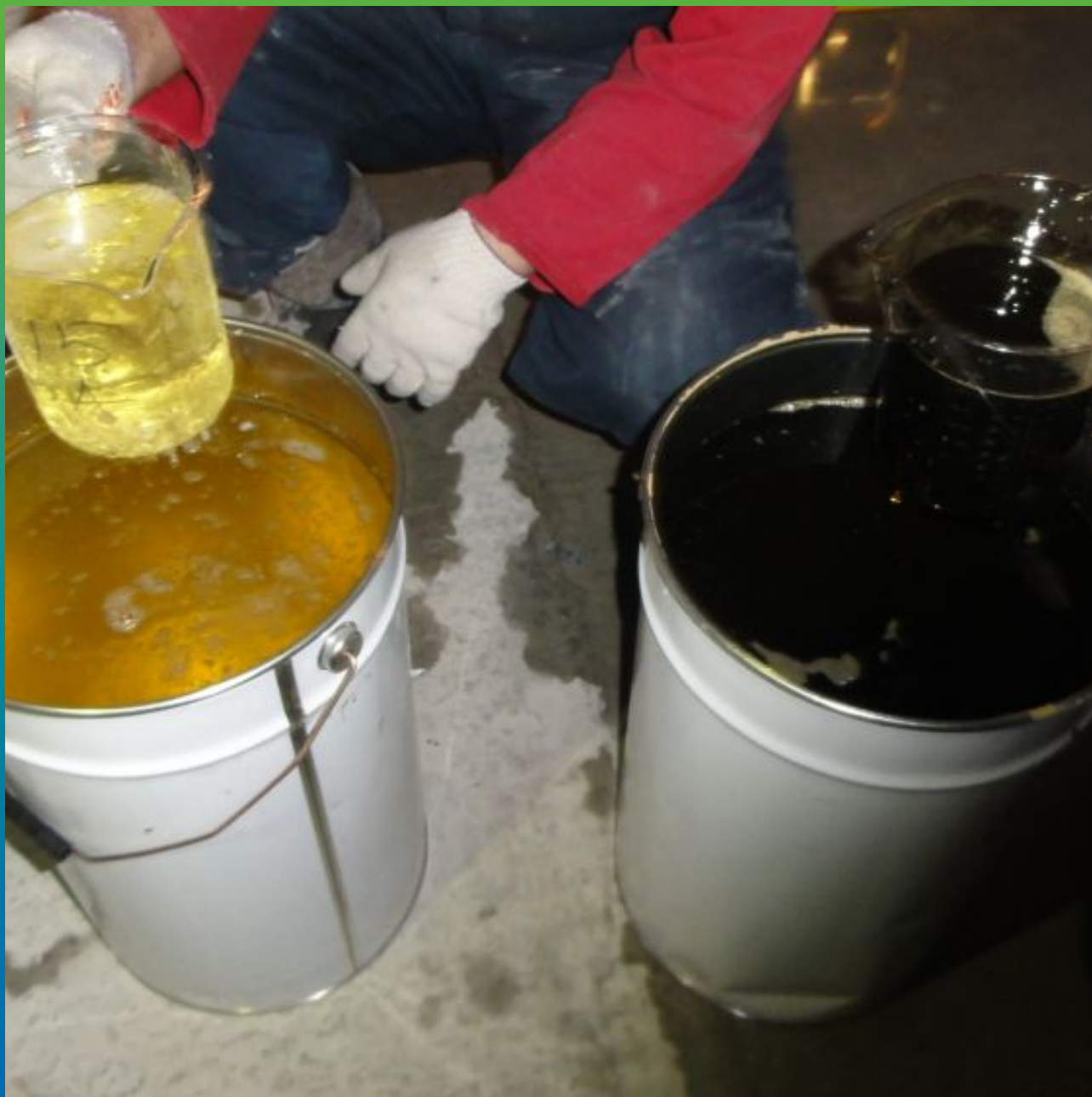
Затворение инъекционного гидроактивного состава Манопур 15