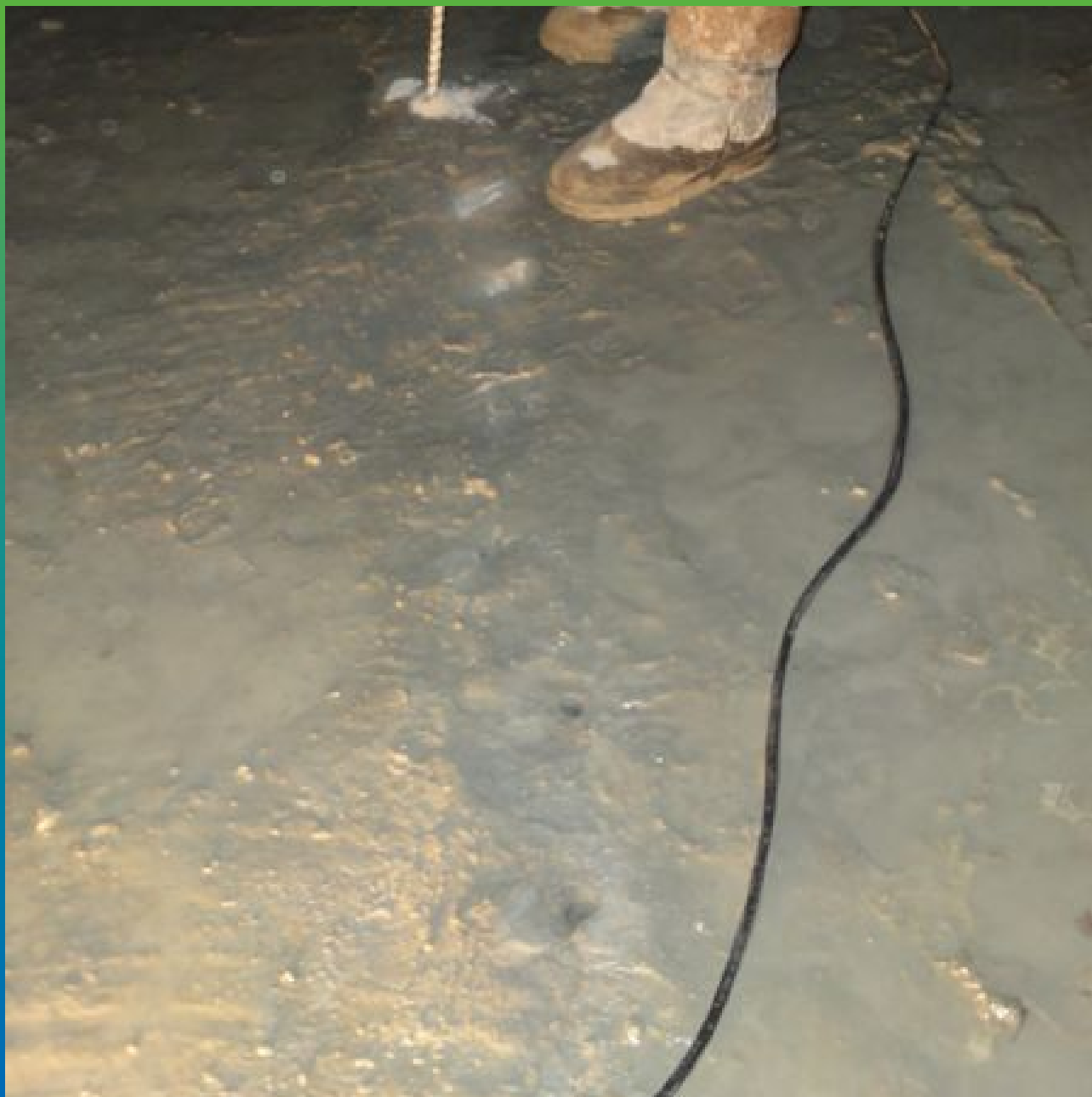
Бурение шпуров под инъекционные пакера