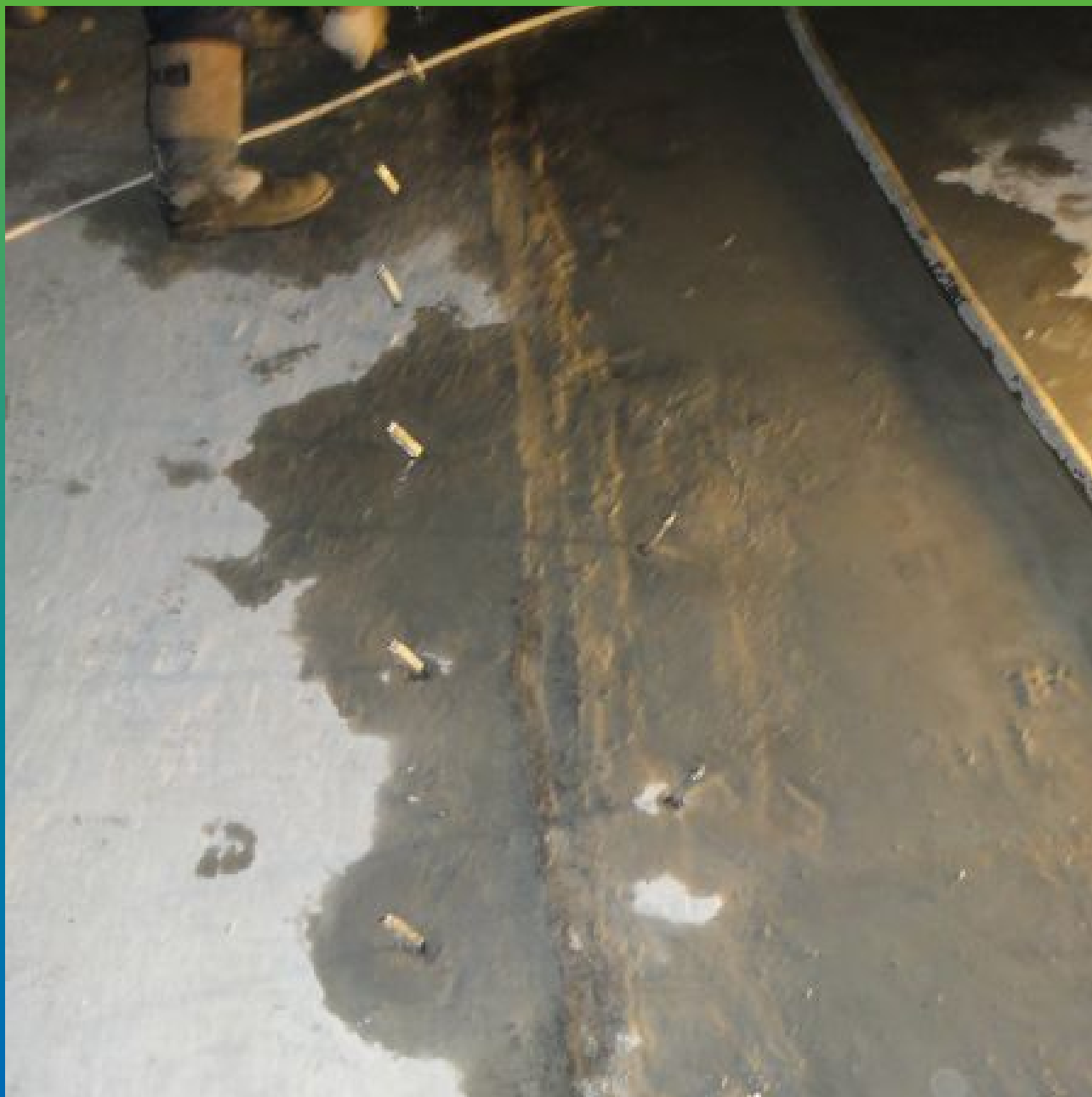
Установка инъекционных пакеров БМ 1171