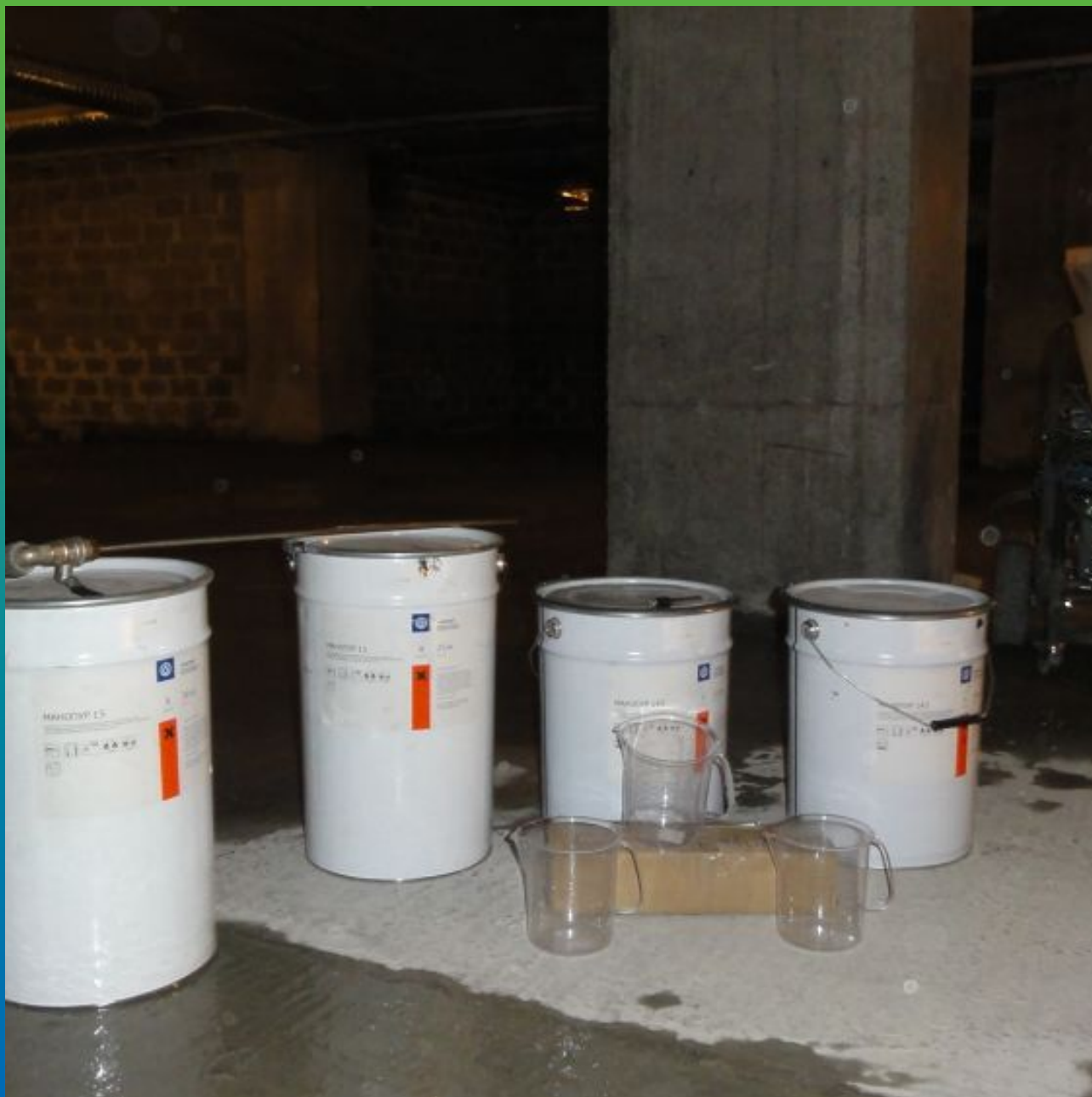
Материалы и оборудование на объекте