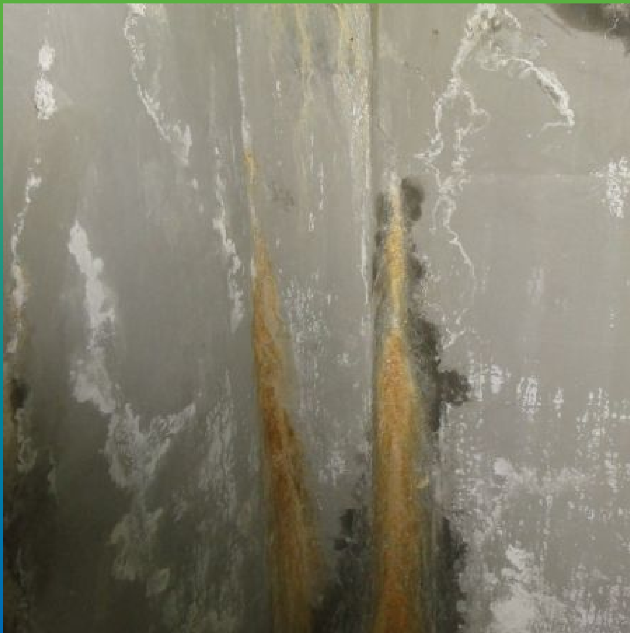
Вид дефектов на объекте