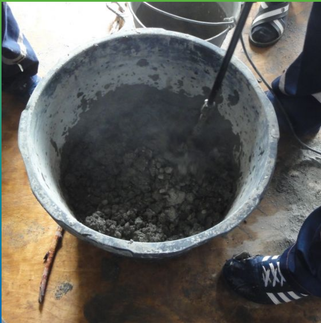
Затворение ремонтного состава Стармекс РМ 3