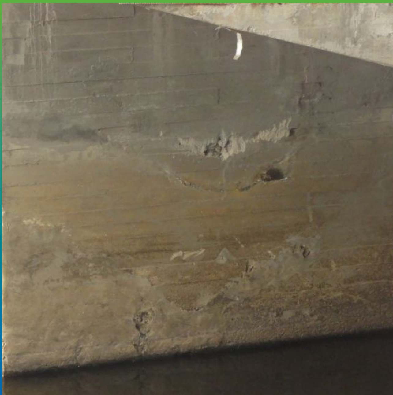
Первоначальный вид поверхности