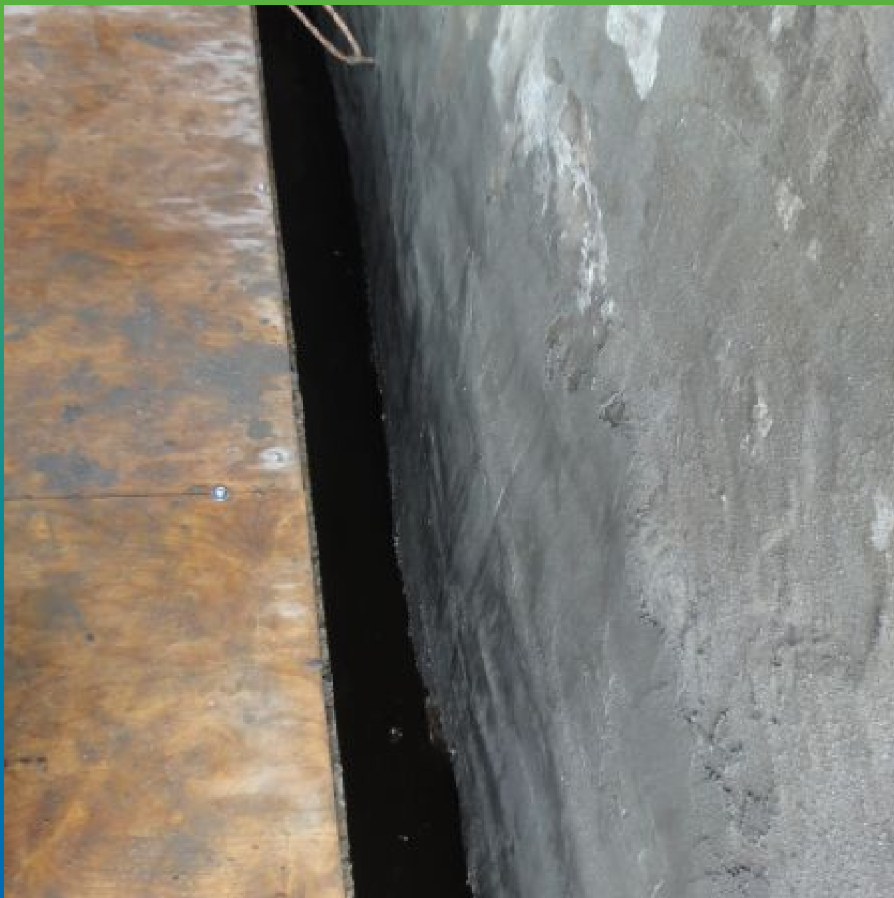
Финальный вид отремонтированной поверхности