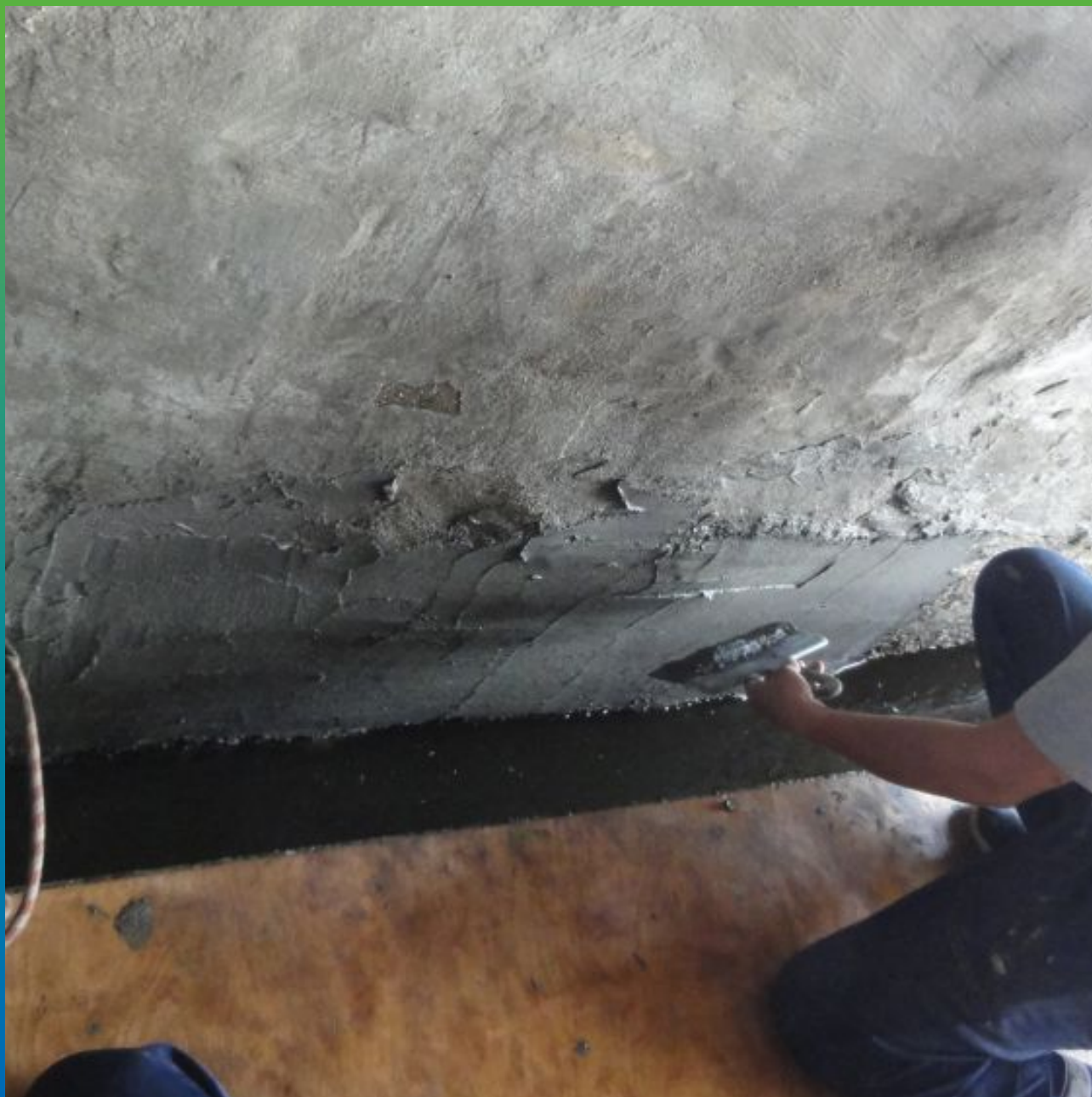
Нанесение ремонтного состава Стармекс РМЗ