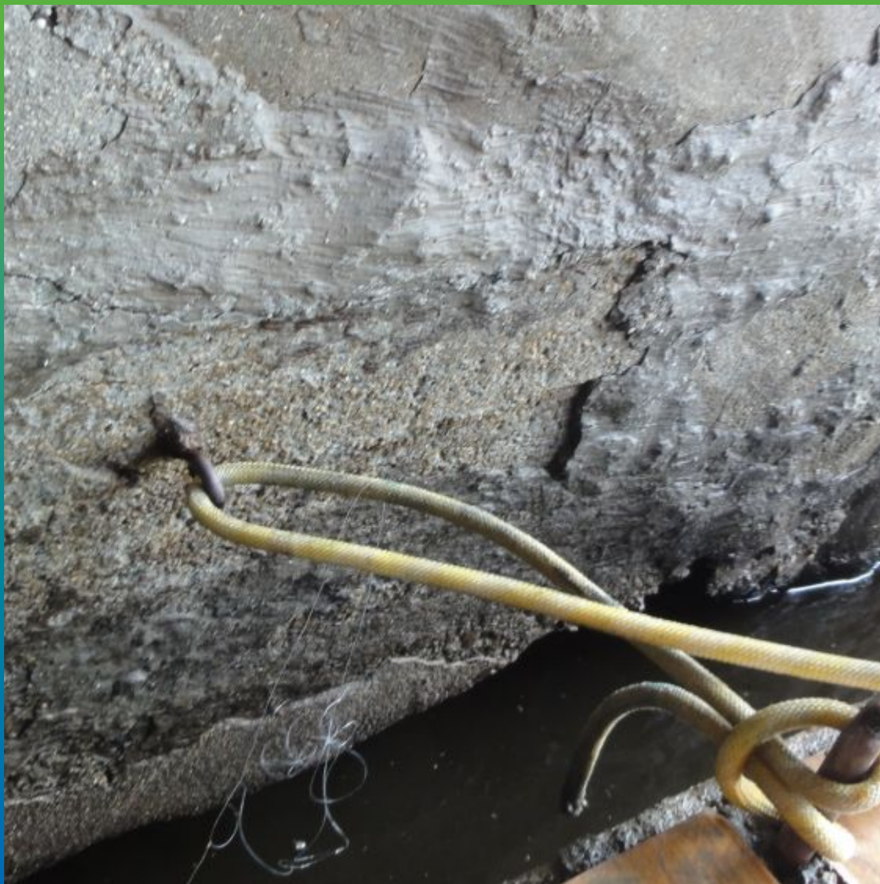
Вид увлажненной поверхности перед нанесением материала Стармекс РМЗ