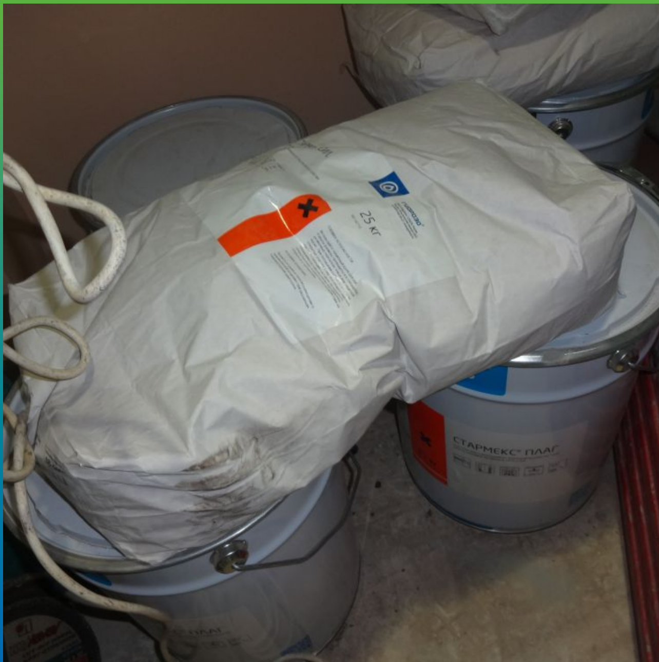
Материалы "Гидрозо" на объекте