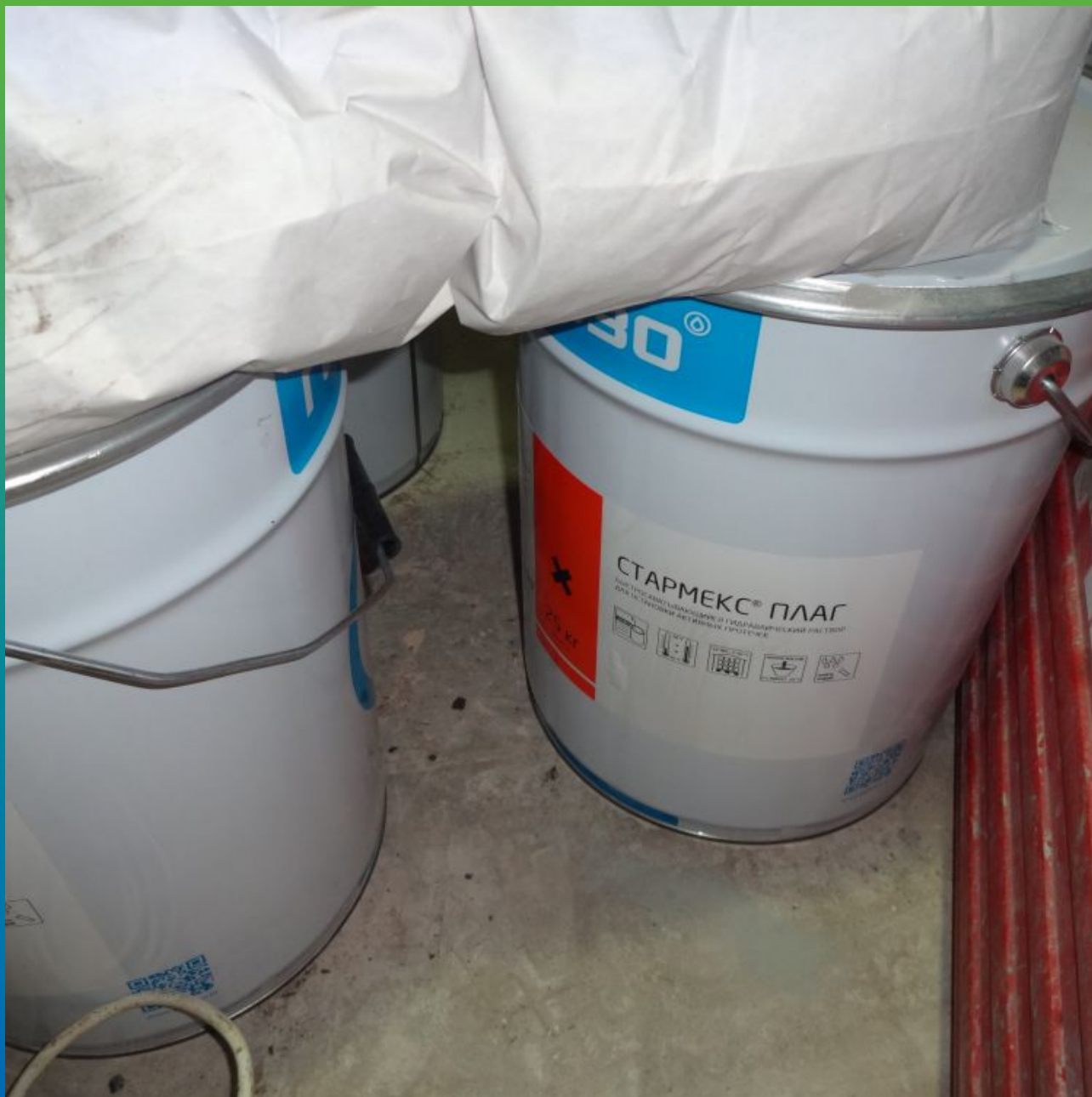
Материалы "Гидрозо" на объекте