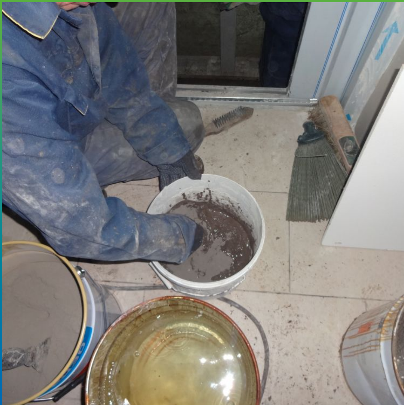
Затворение с водой Стармекс Плаг