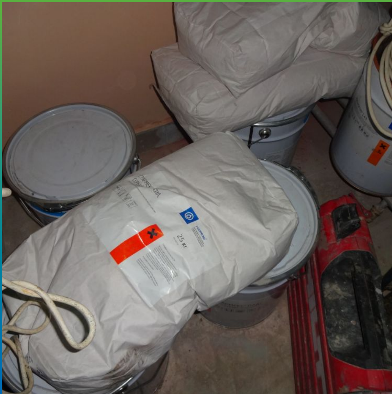
Материалы "Гидрозо" на объекте