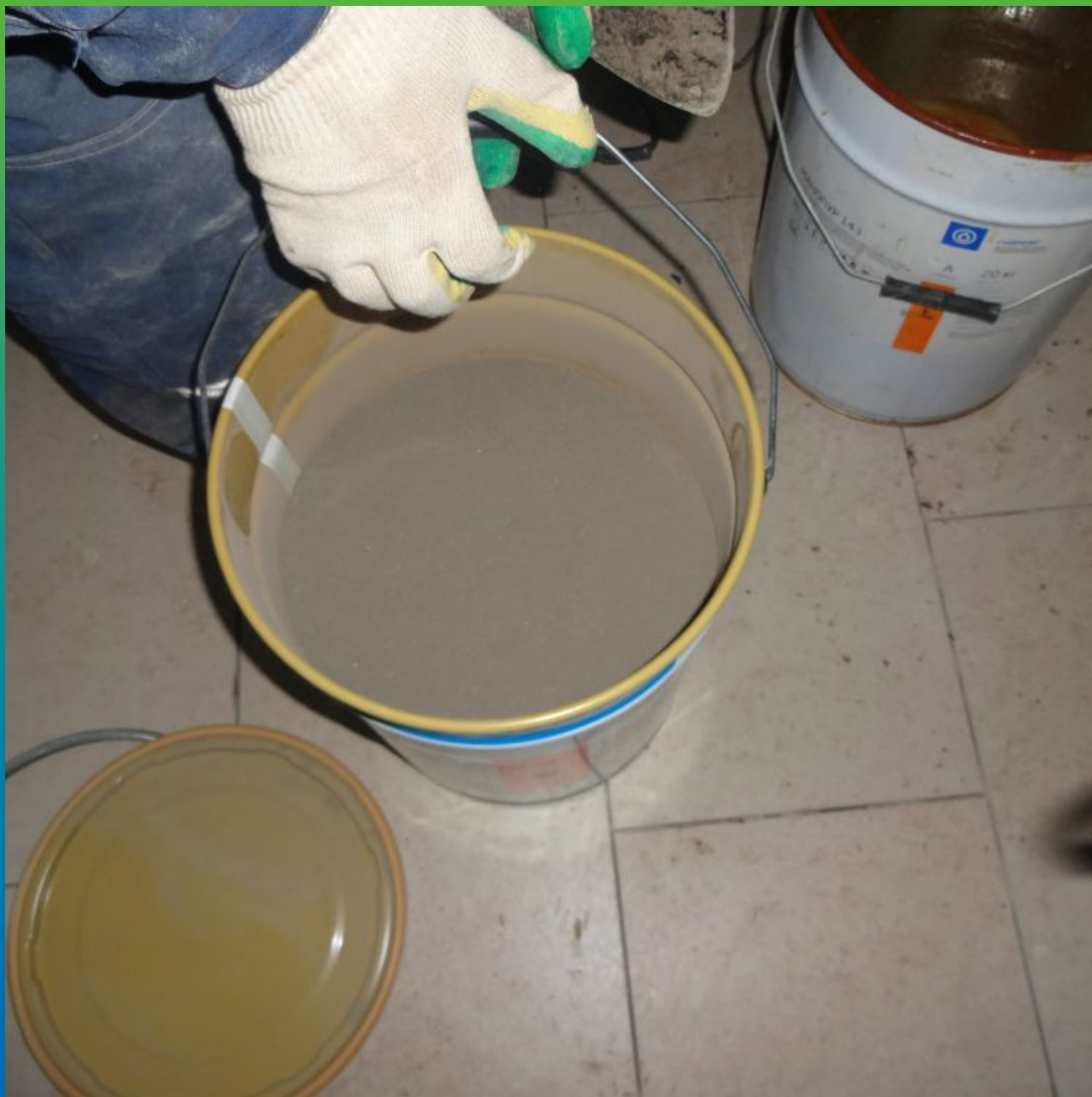
Затворение с водой Стармекс Плаг