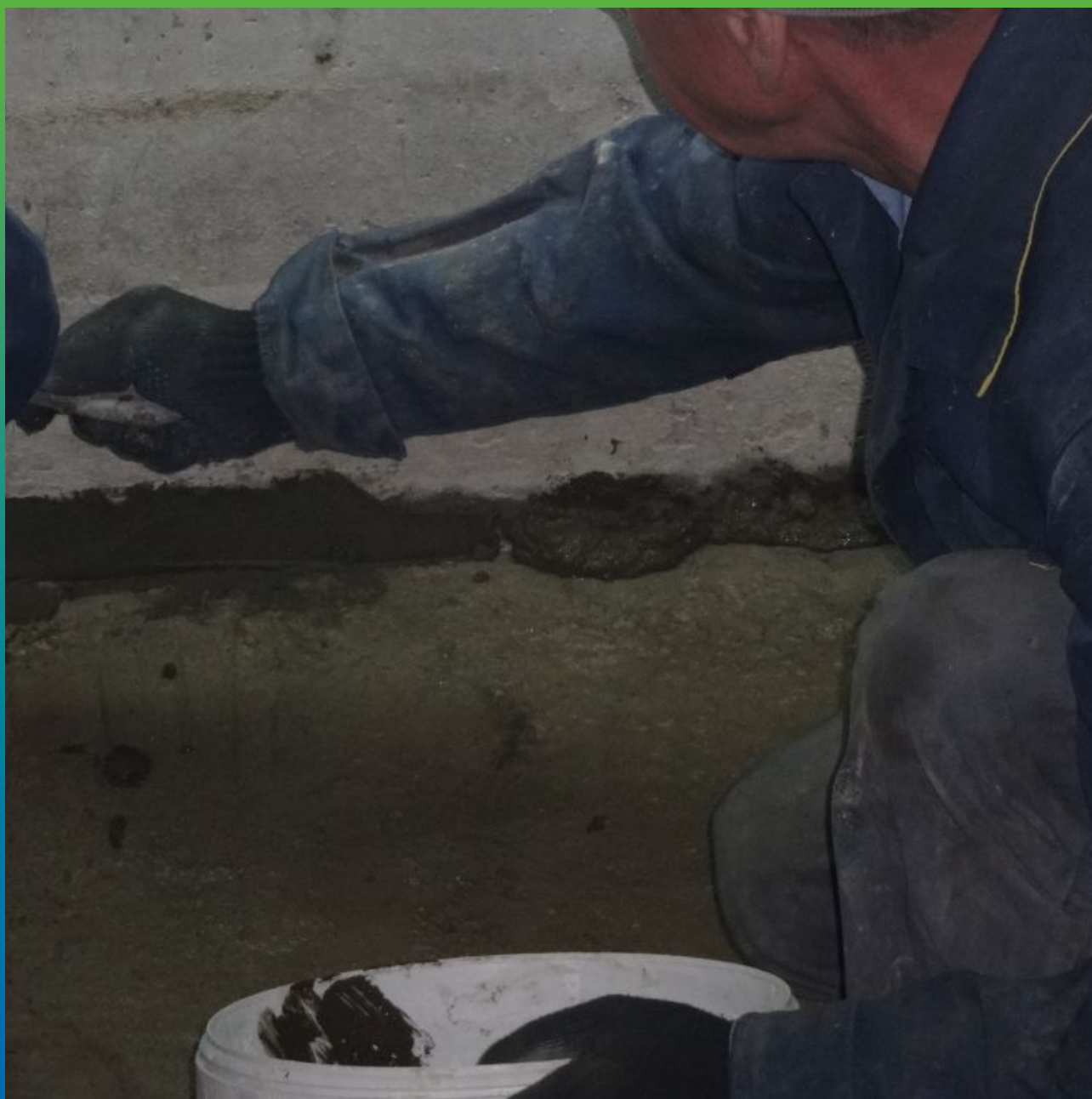
Формирование галтели по примыканиям