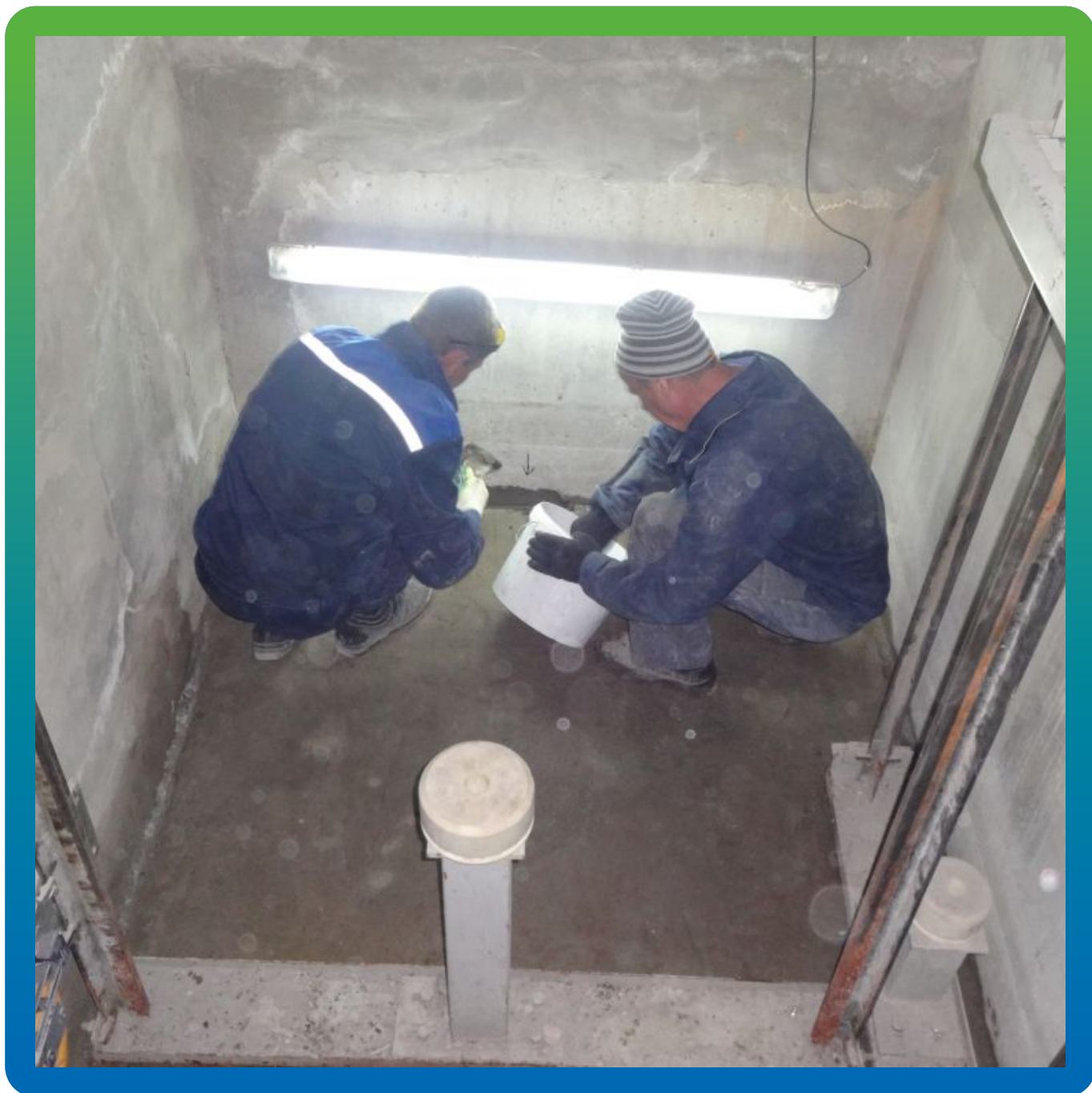
Формирование галтели по примыканиям