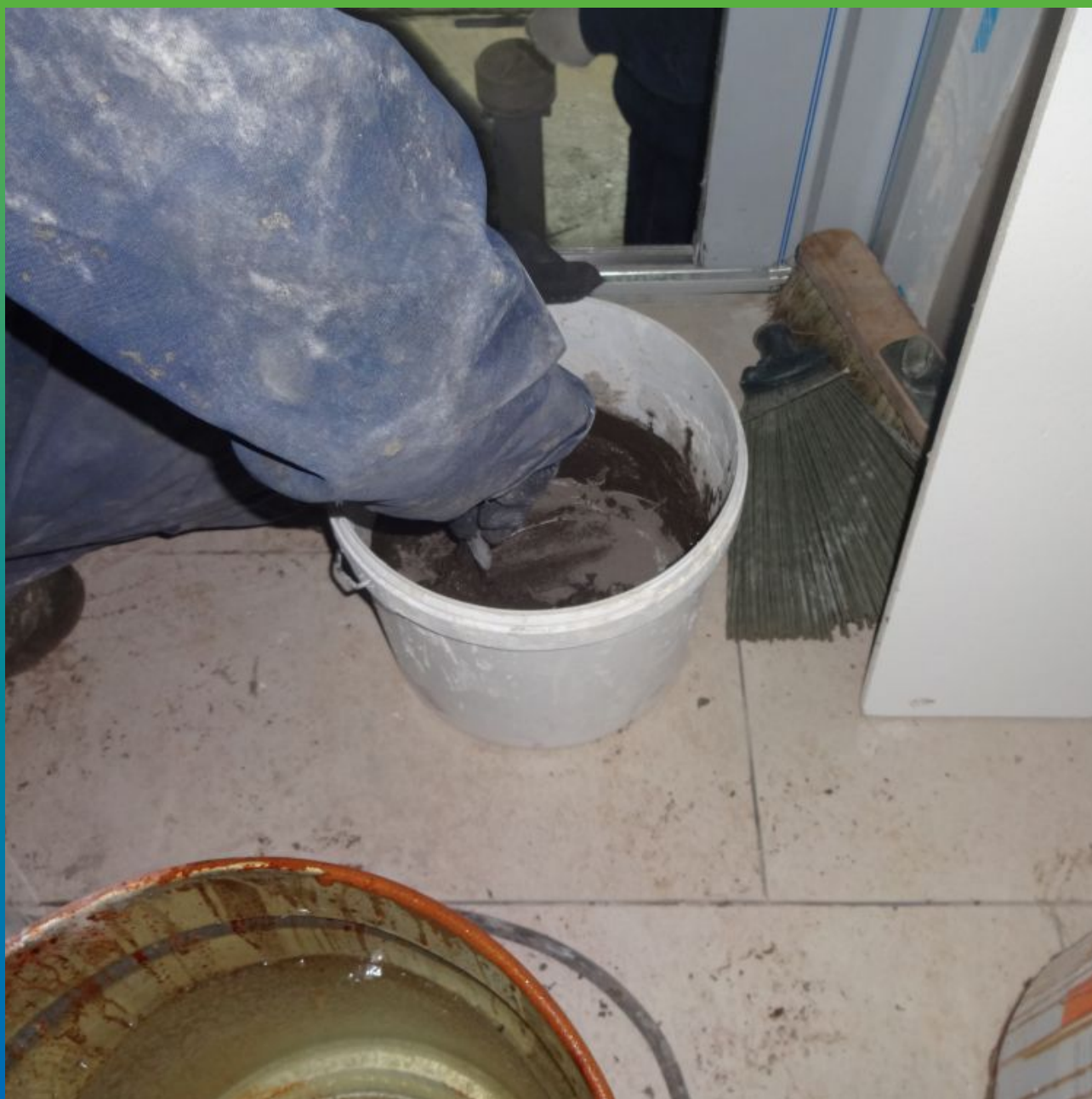
Затворение с водой Стармекс Плаг