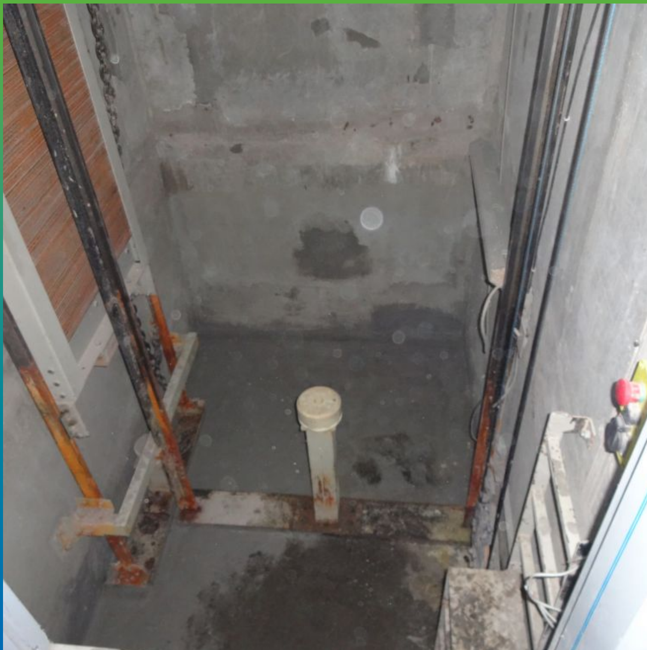
Общий вид приямок после выполнения работ по гидроизоляции