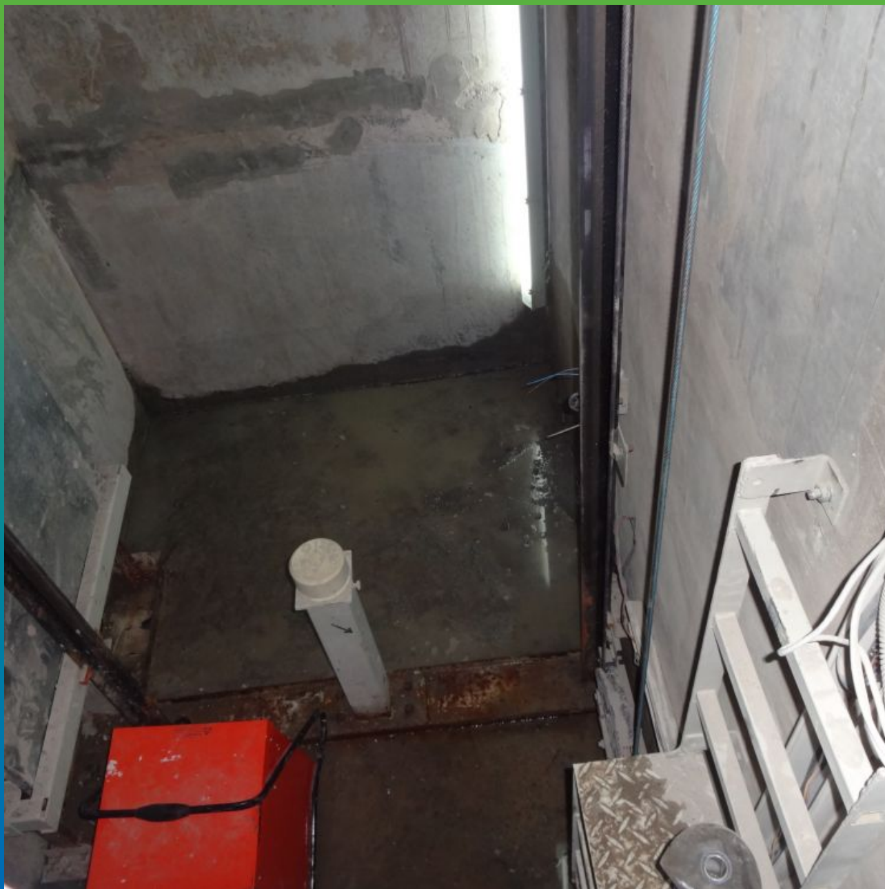
Протечки по примыканию стена+пол