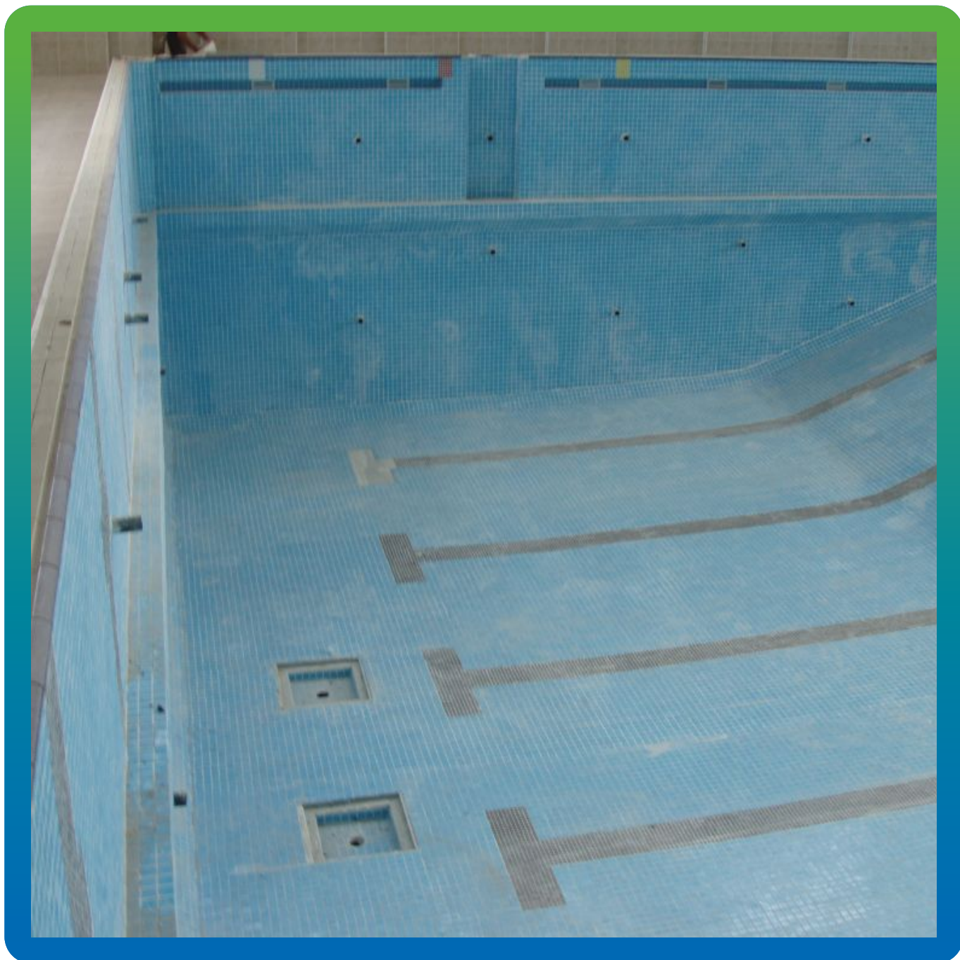
Вид на гидроизолированный бассейн после облицовки плиткой.