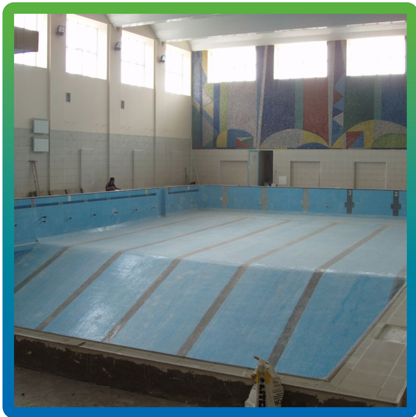
Вид на гидроизолированный бассейн после облицовки плиткой.