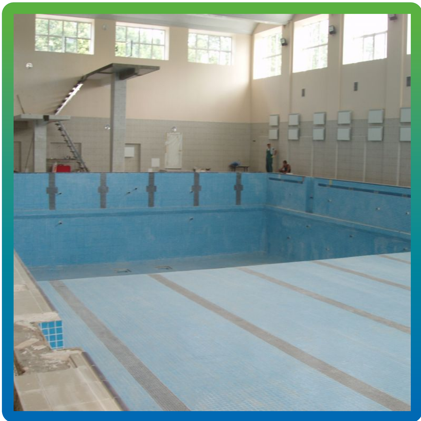
Вид на гидроизолированный бассейн после облицовки плиткой.