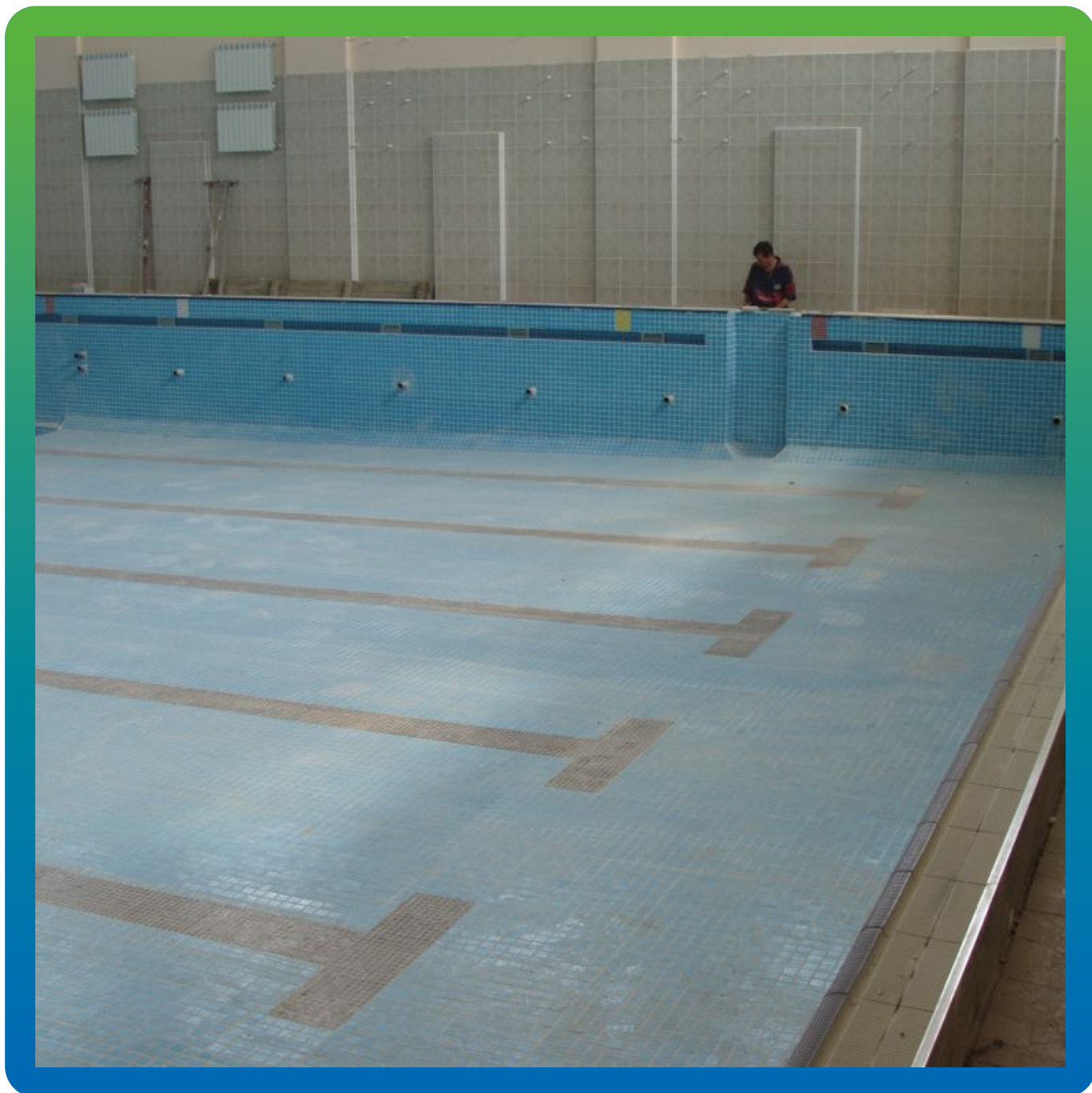
Вид на гидроизолированный бассейн после облицовки плиткой.