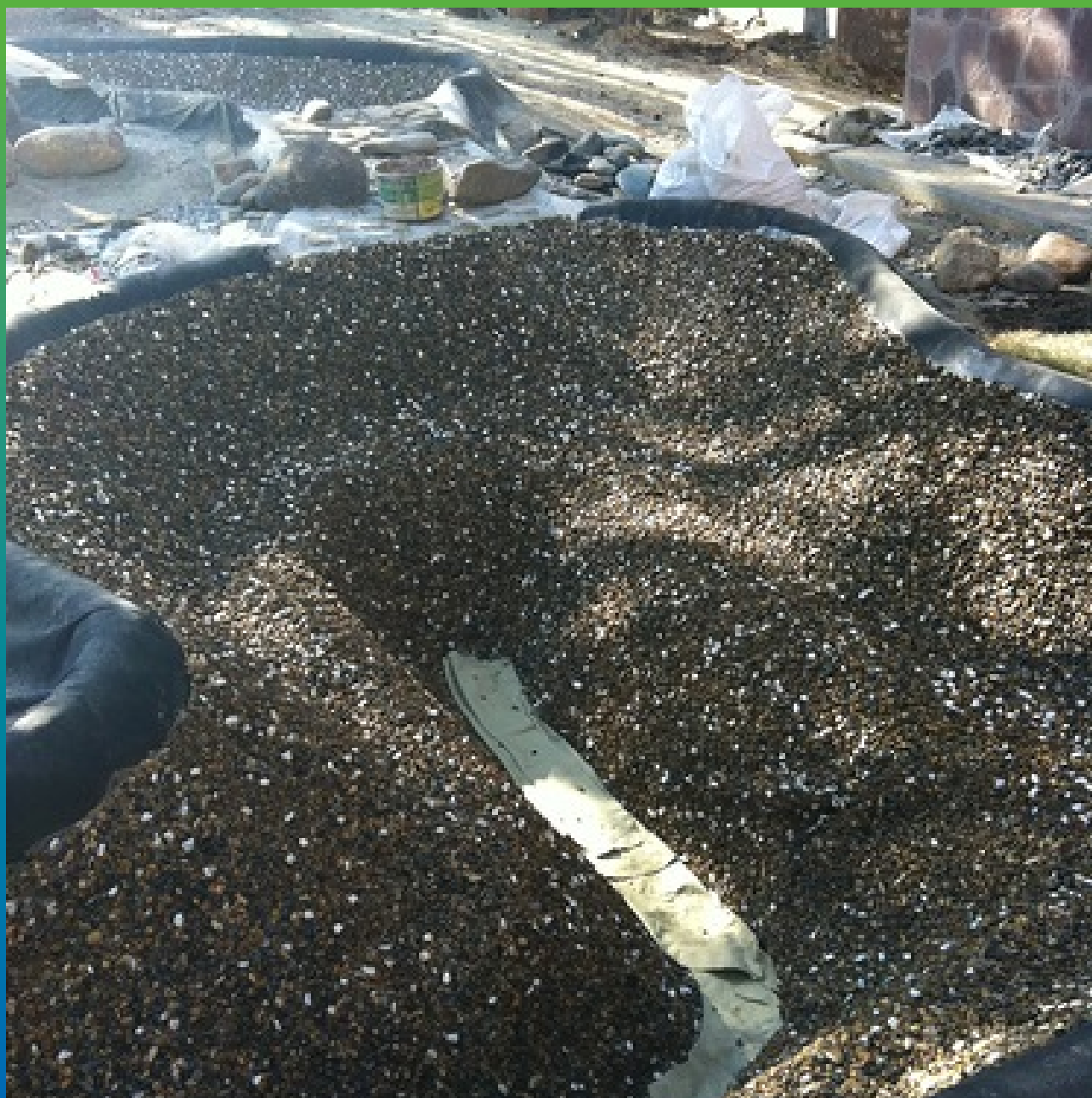
Устройство каменной поверхности водоемов