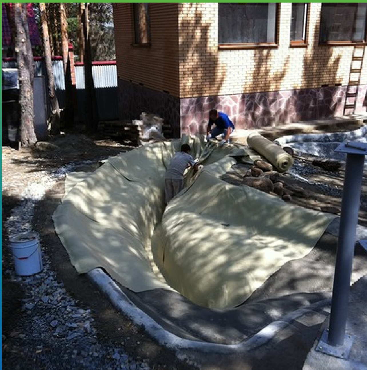
Укладка геотекстиля на первом водоеме