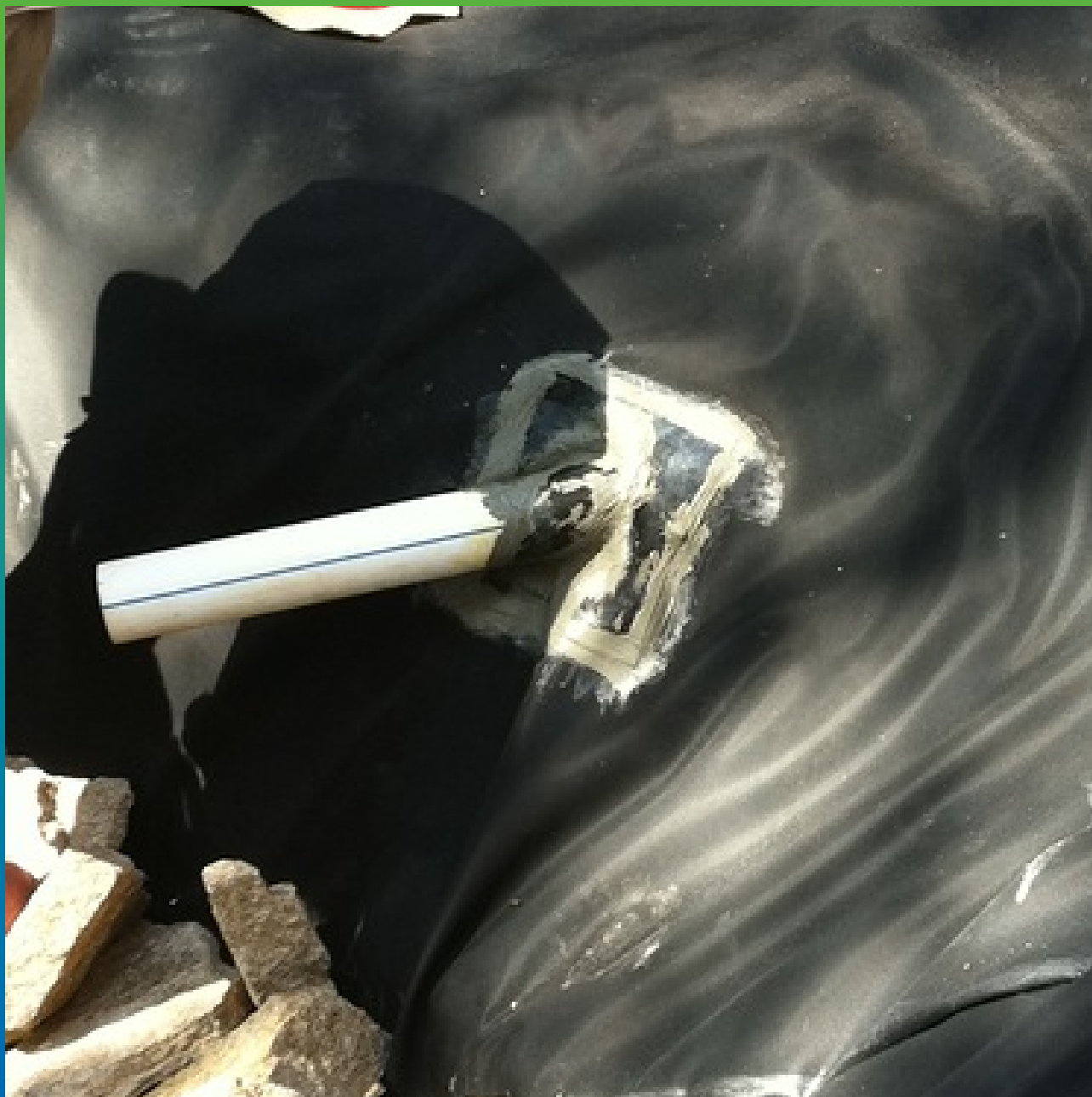
Устройство гидроизоляции ввода