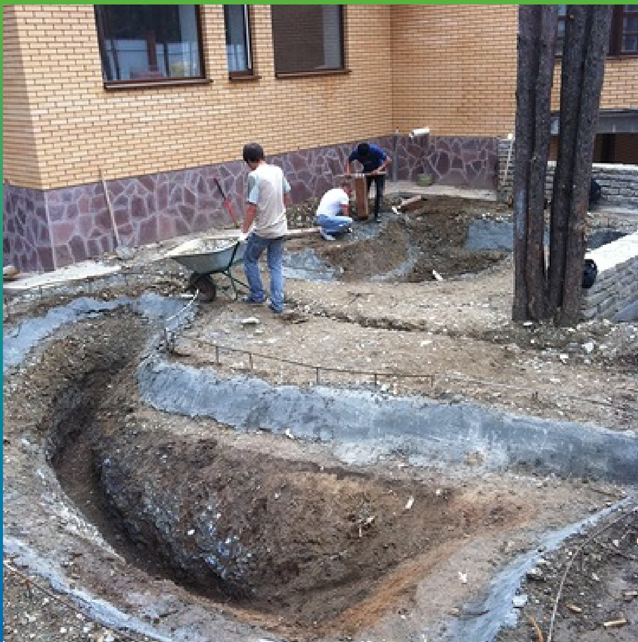
Выравнивание поверхности водоемов цементным раствором