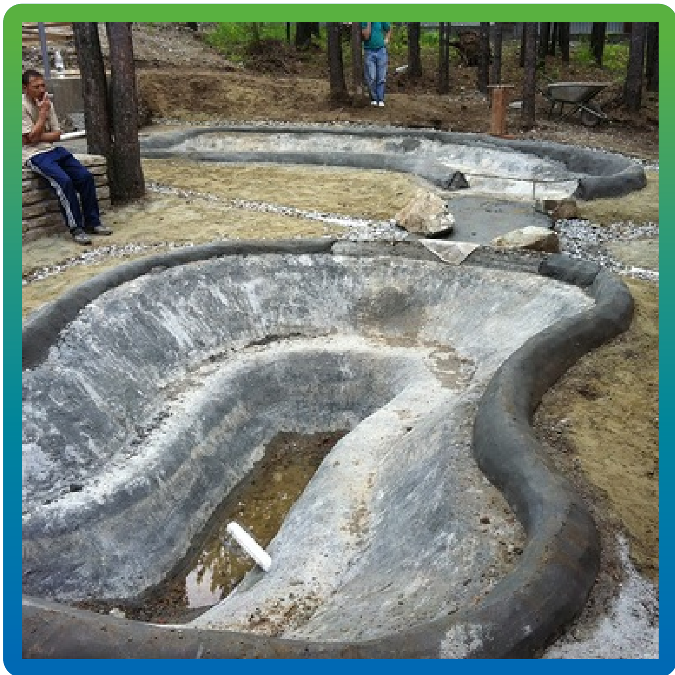
Перелив между водоемами