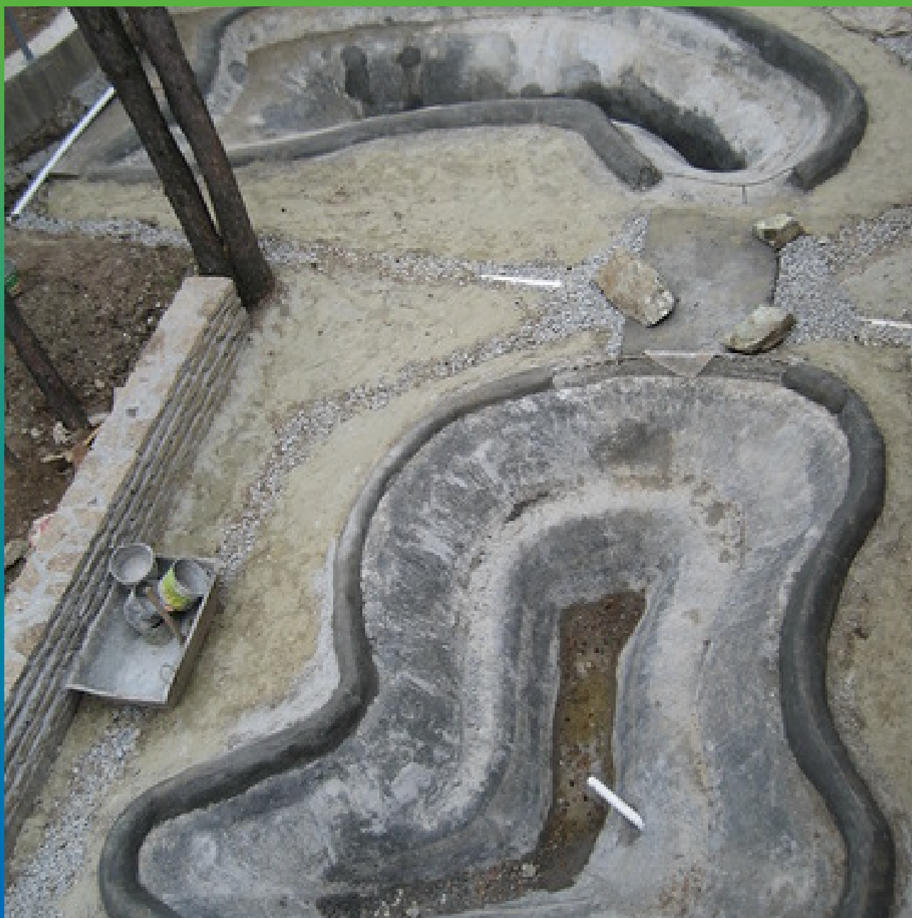
Общий вид до устройства гидроизоляции