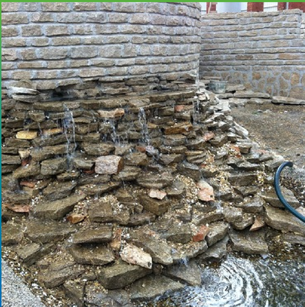
Мини водопад, питающий водоемы