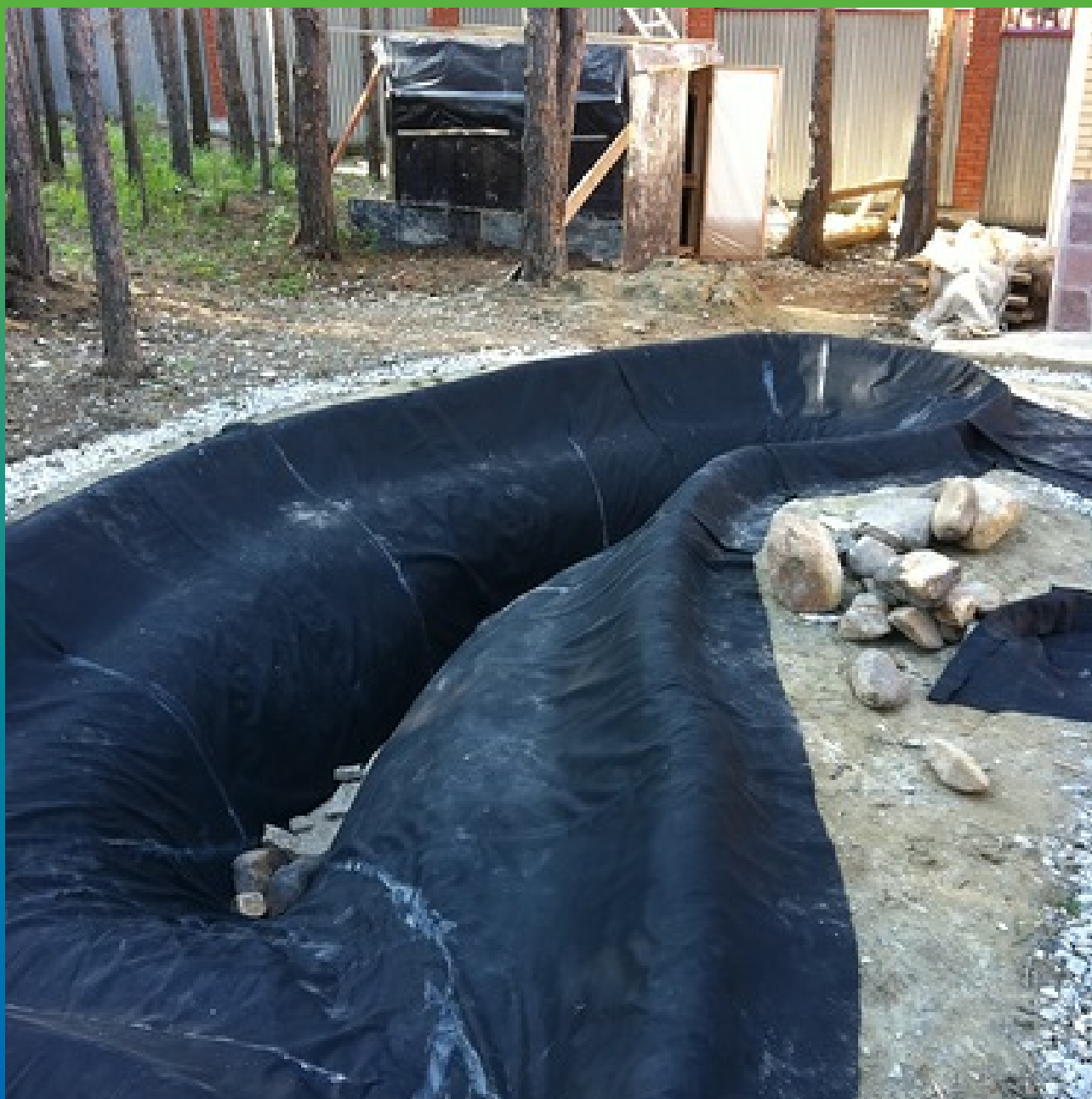
Укладка ЭПДМ мембраны Эластосил Т