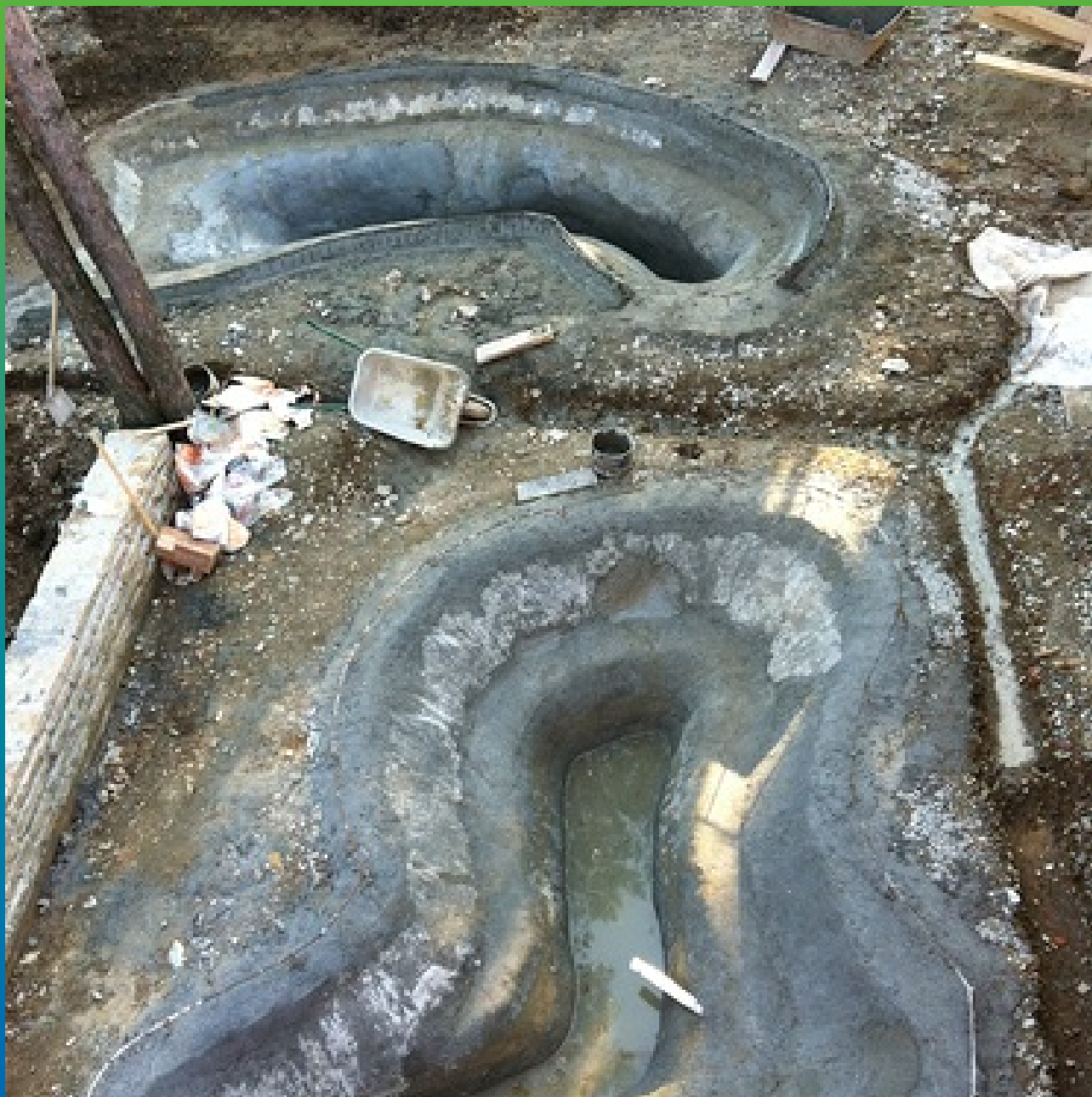
Выравнивание поверхности водоемов цементным раствором