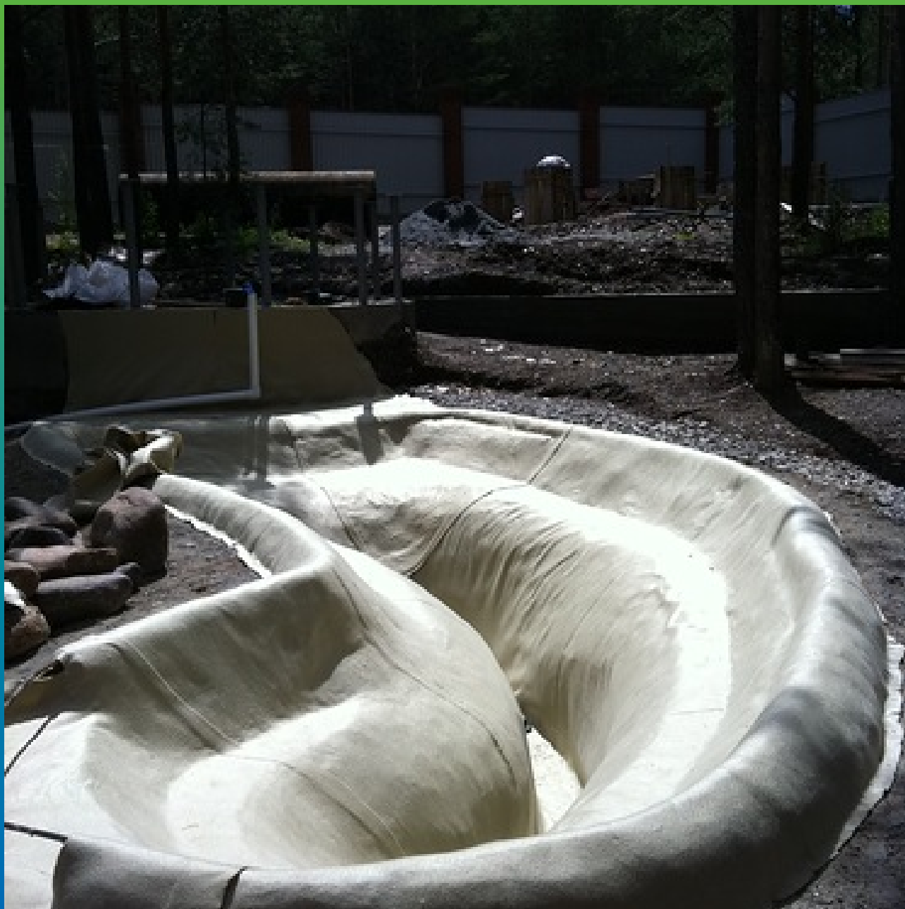
Укладка геотекстиля на втором водоеме