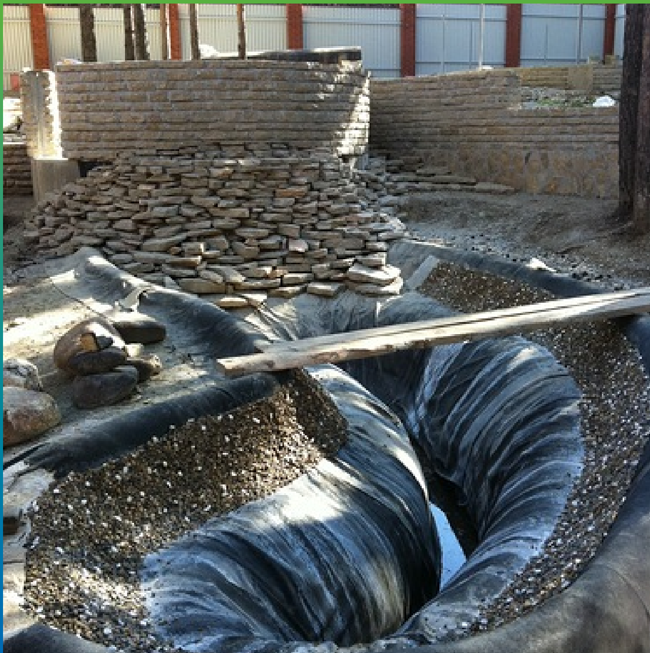
Устройство каменной поверхности первого водоема