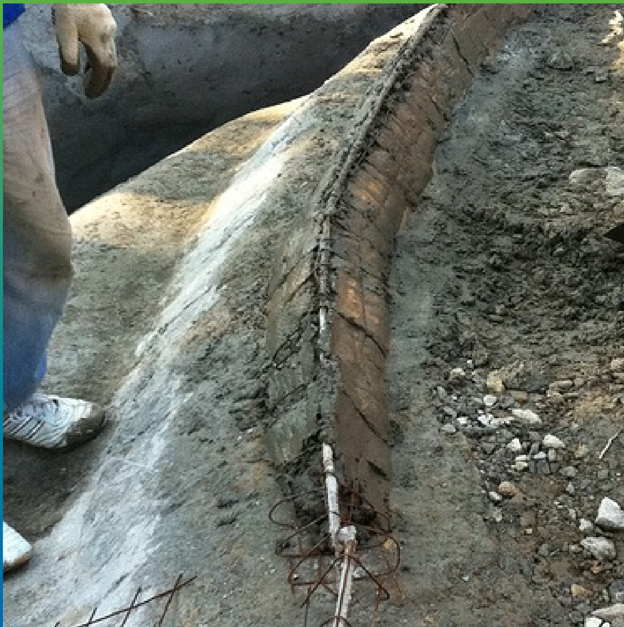
Устройство бортика водоема