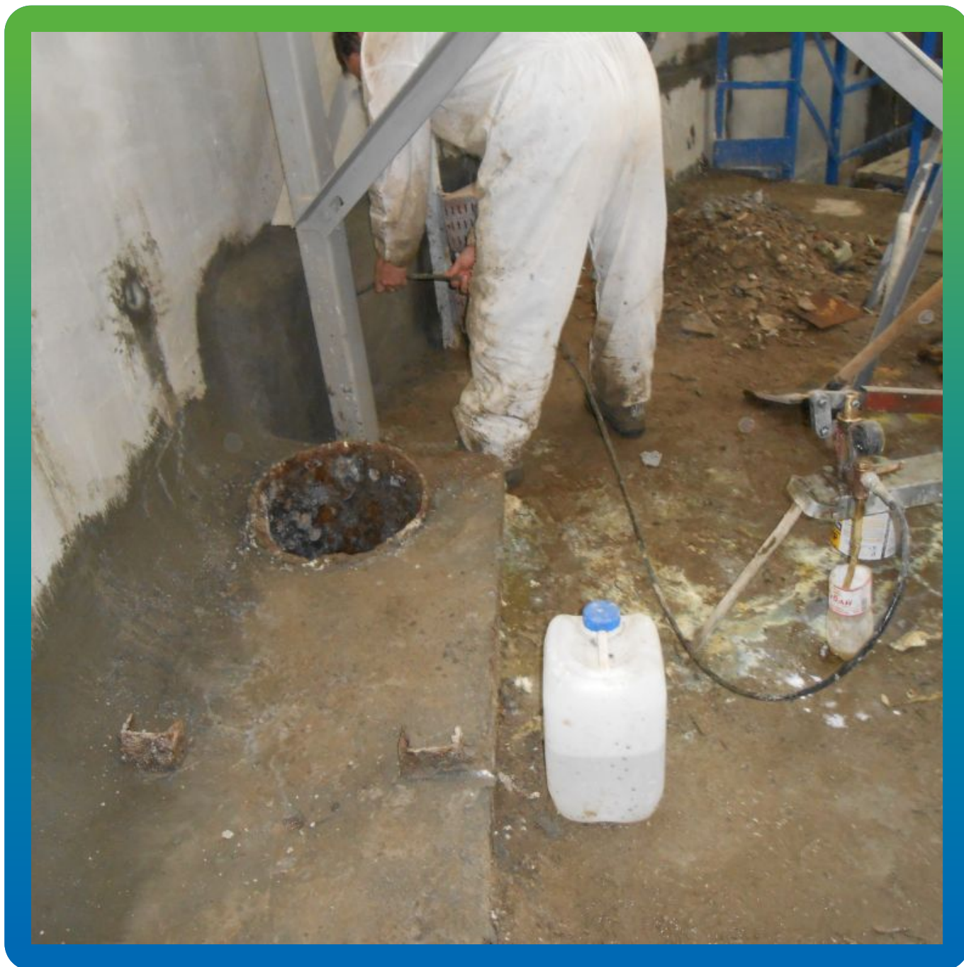
Инъектирование составами "Гидрозо" Манопур У Флекс + Манопур 143