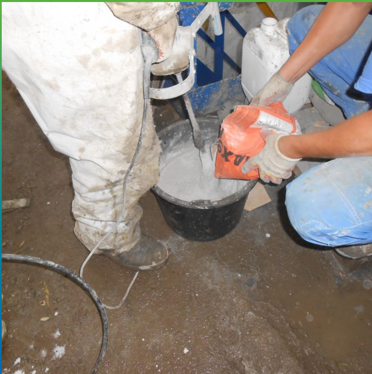
Затворение А+В компонентов эластичной гидроизоляции "Максил Флекс"