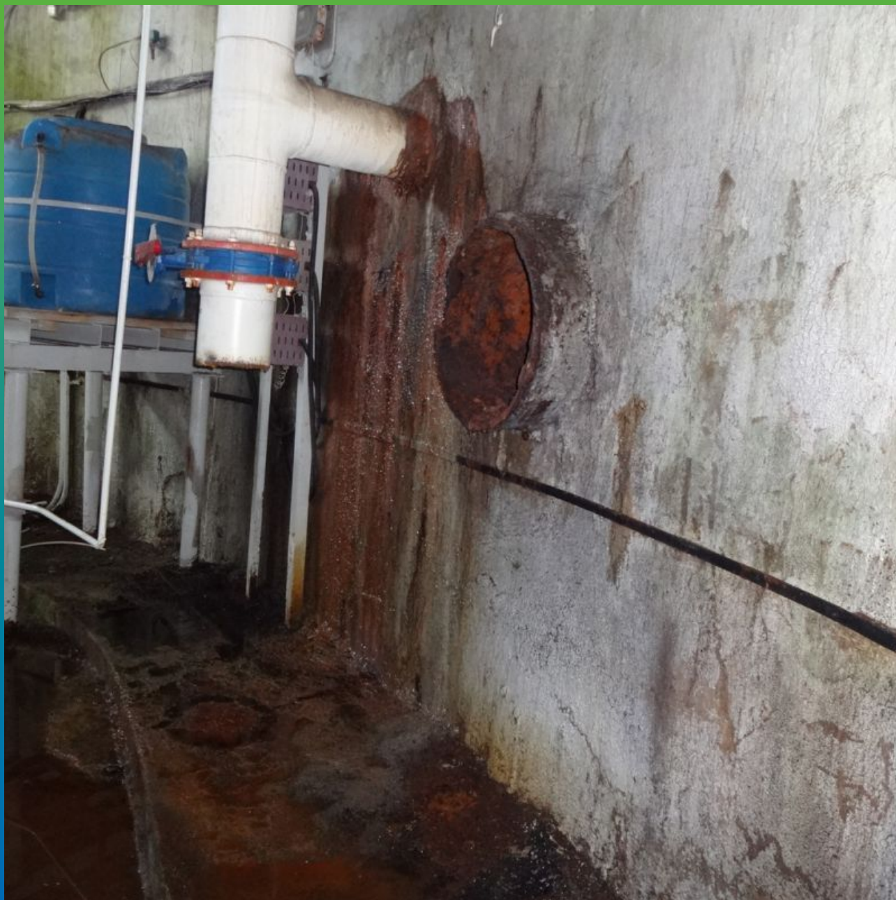
Общий вид протечек на объекте