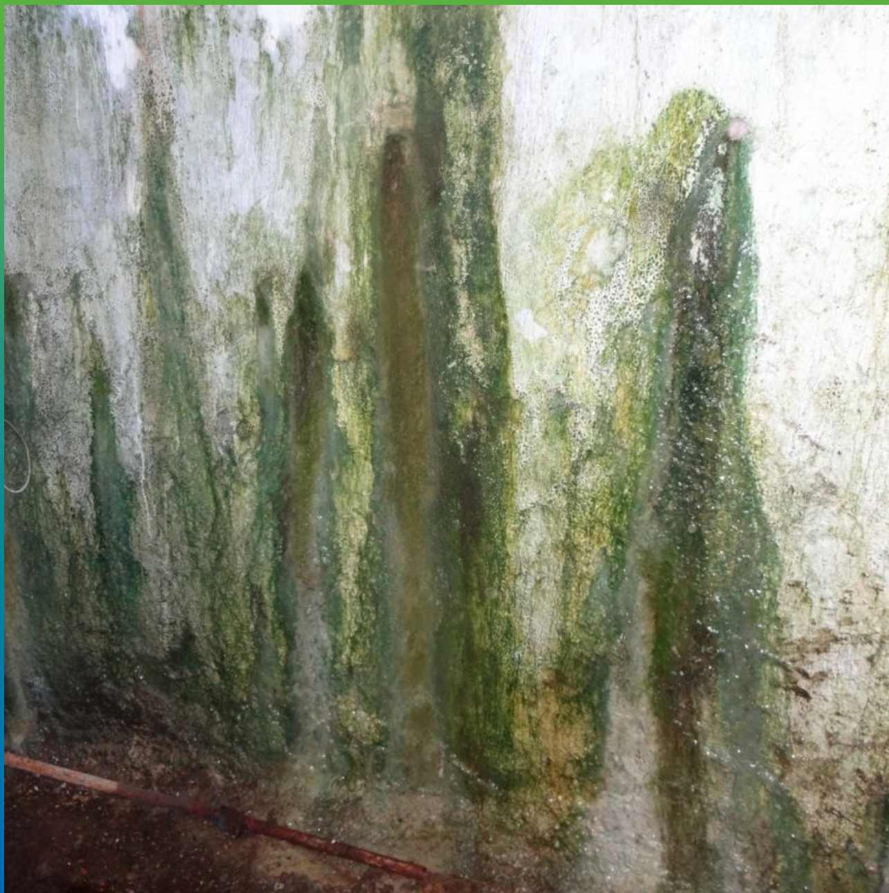
Общий вид протечек на объекте