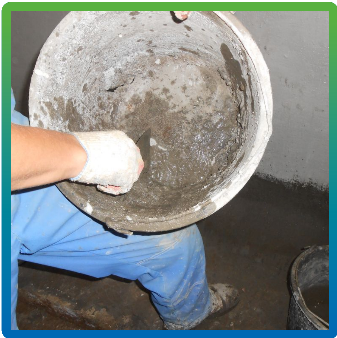
Затворение с водой быстросхватывающего гидравлического раствора "Максплаг"