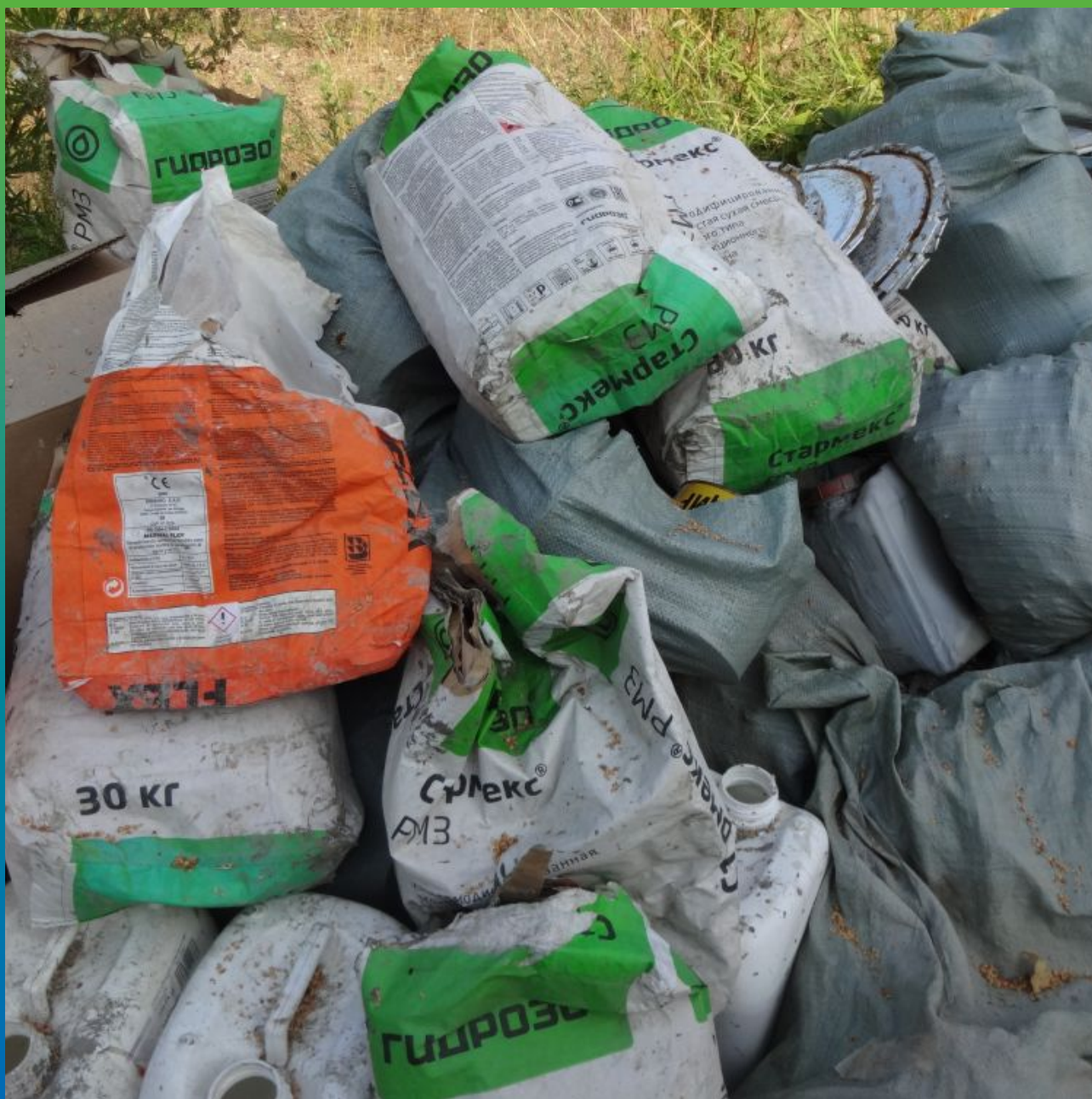
Материалы "Гидрозо" на объекте