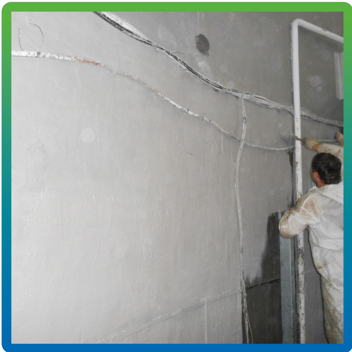
Нанесение по все площади эластичной гидроизоляции "Максил Флекс"