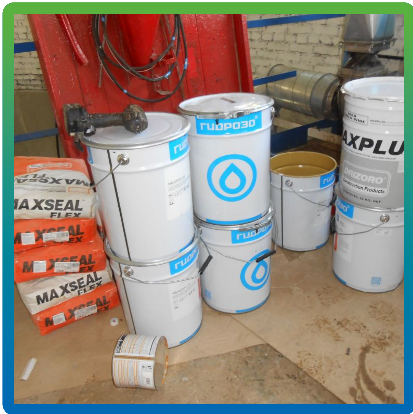
Материалы "Гидрозо" на объекте