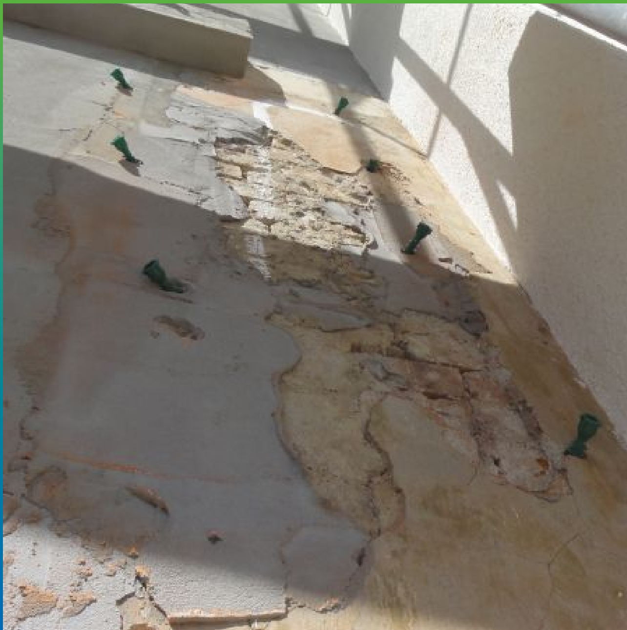
Вид трещины с установленными пакерами