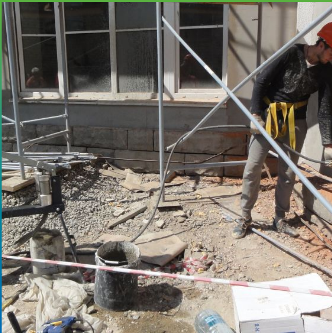
Процесс инъектирования при помощи инъекционного ручного насоса для микроцементов БМ 0220