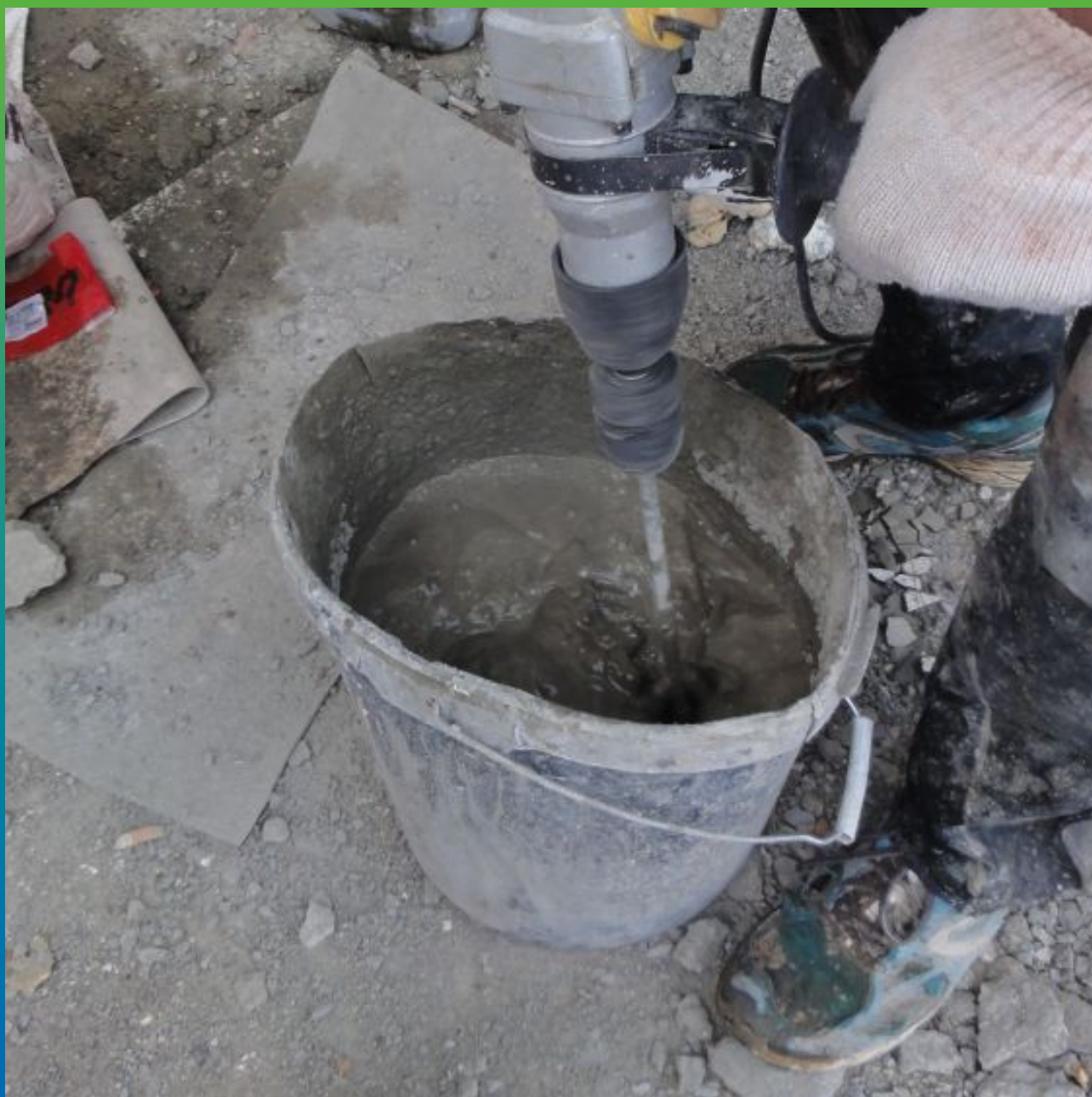
Затворение состава Максгруут Инжекшн