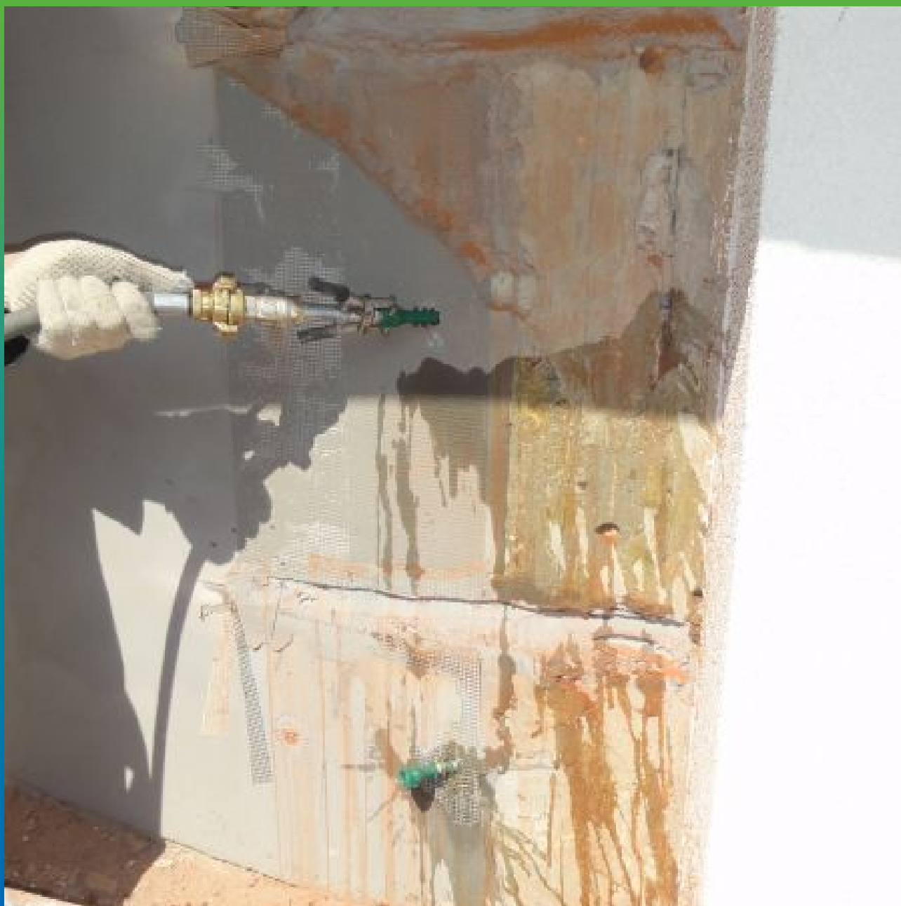
Промывка/увлажнение трещины и шпуров