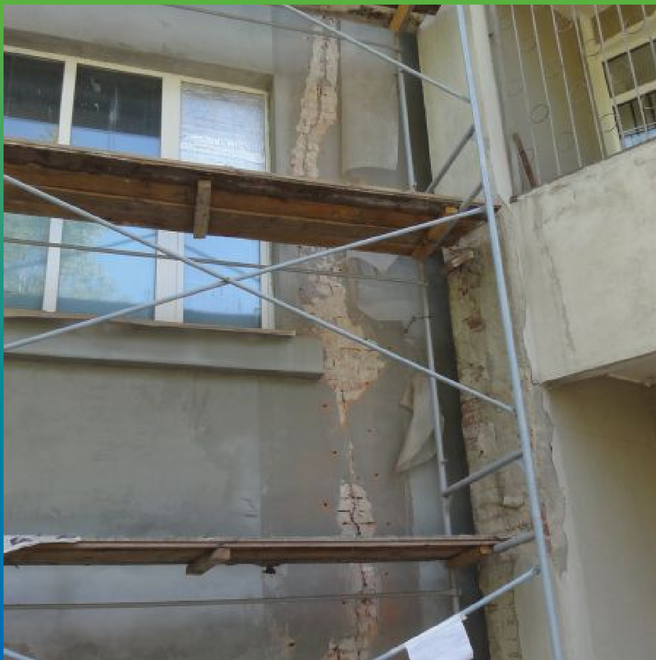
Вид трещины с подготовленными шпурами