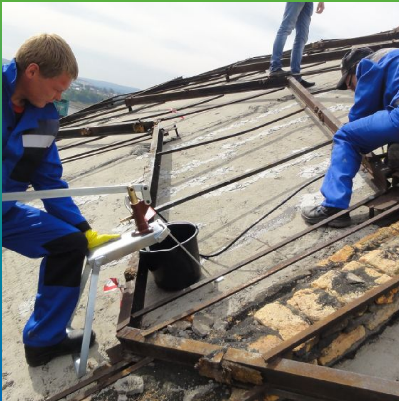
Инъектирование трещин эпоксидным составом через 1К ручной насос БМ 0303