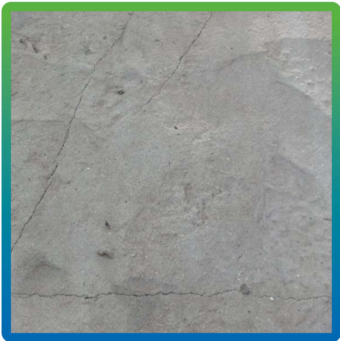
Вид трещин на плитах покрытия