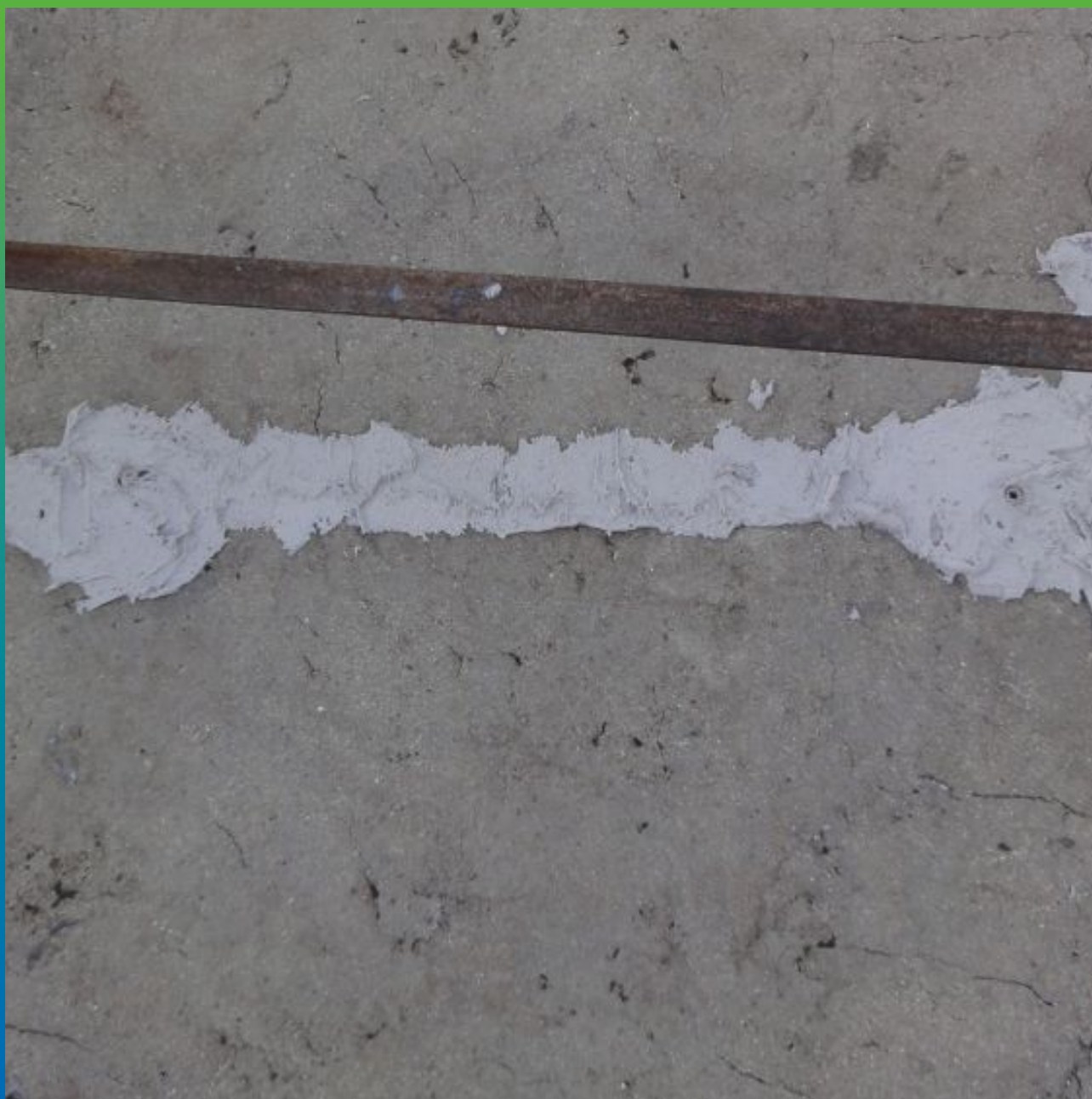
Вид установленных пакеров