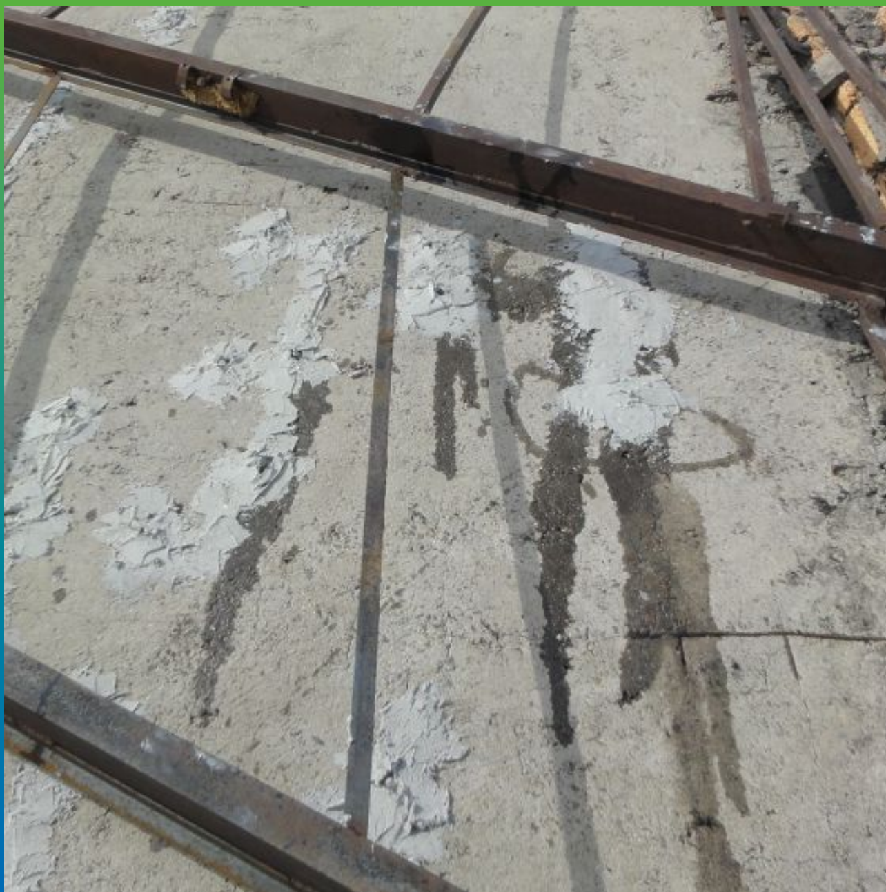
Вид прокачанных трещин