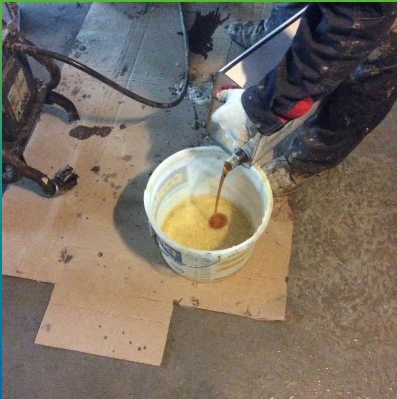
Затворение гидроактивной инъекционной смолы - Витрапур ФР (Манопур 11)