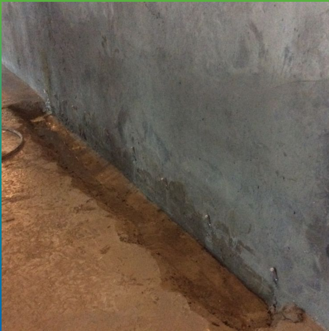
Вид подготовленного рабочего шва