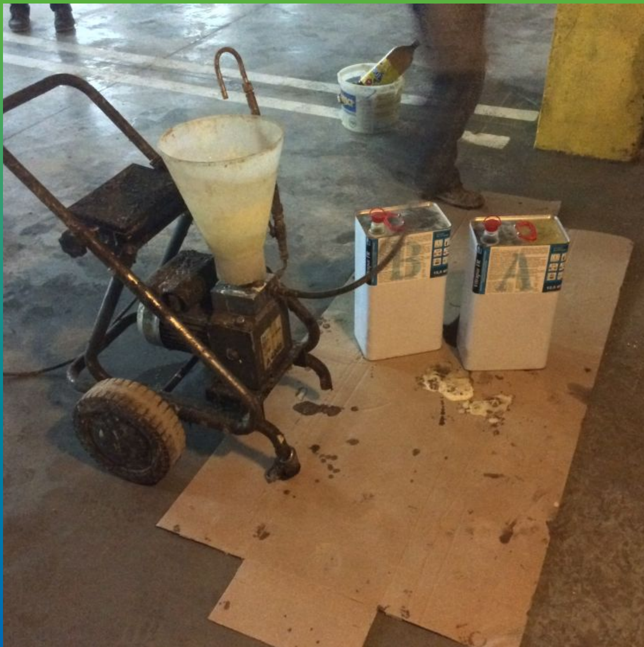
Оборудование и материал на объекте