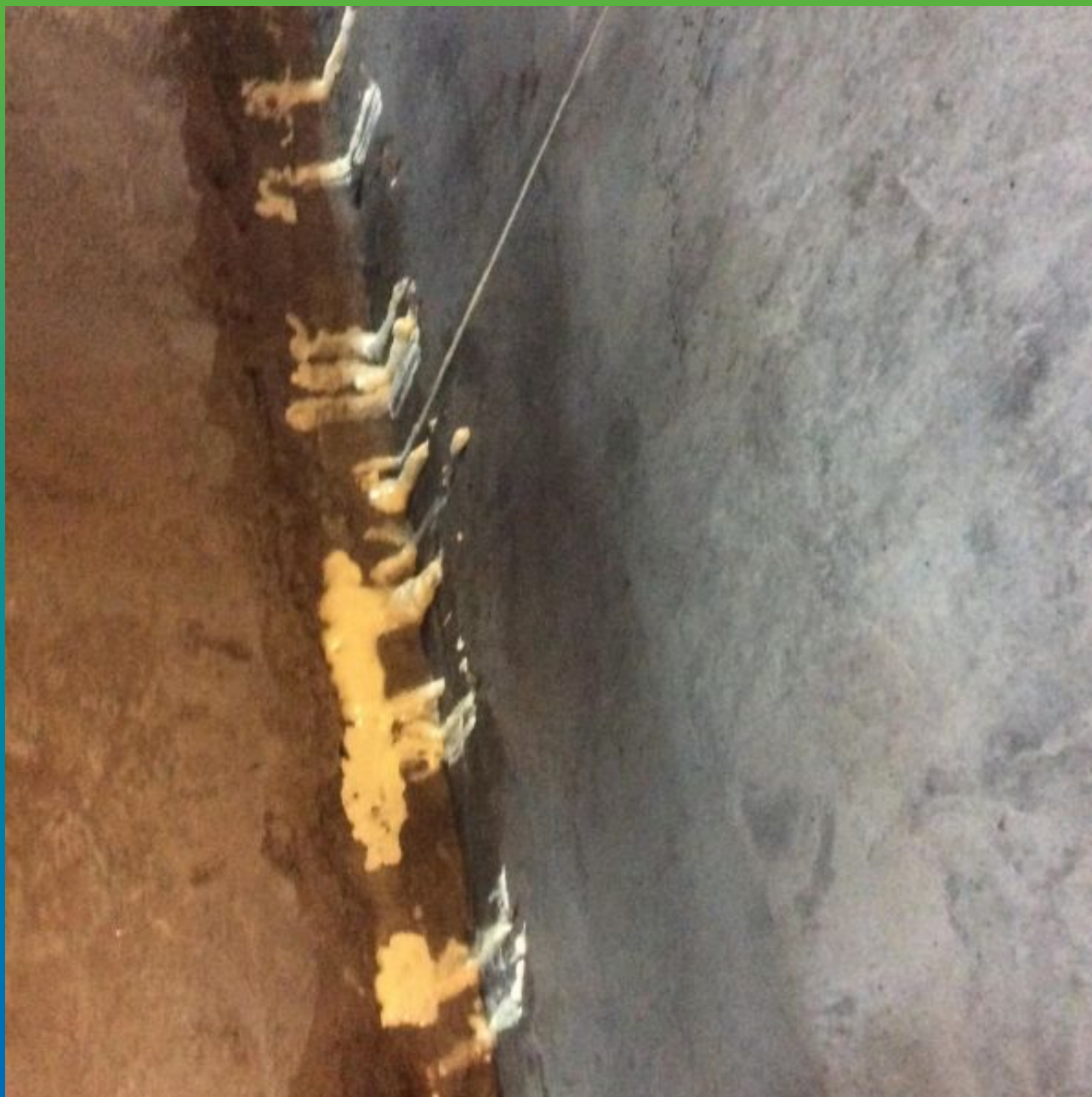
Вид прокачанного участка шва