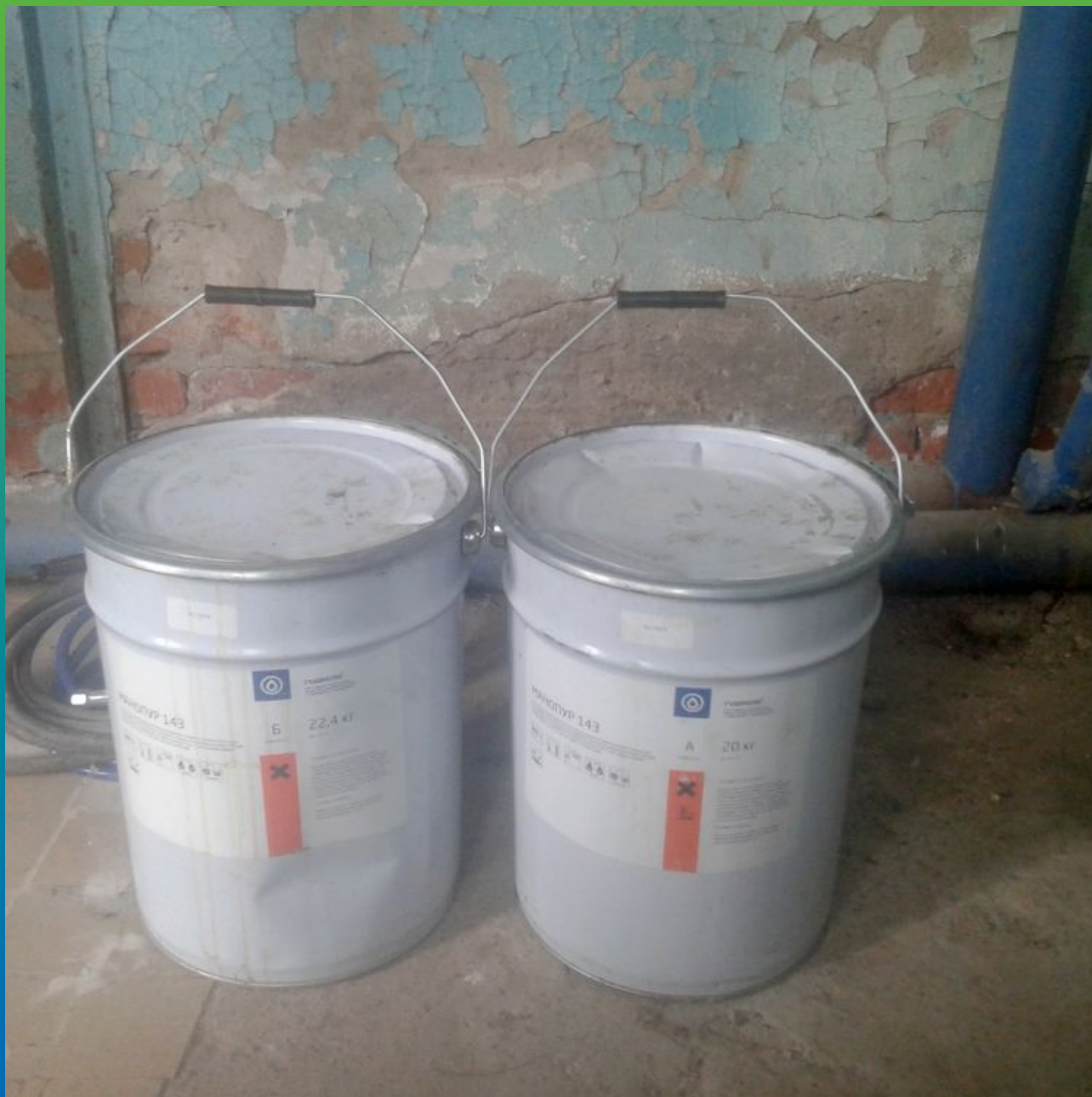
Материалы "Гидрозо" на объекте