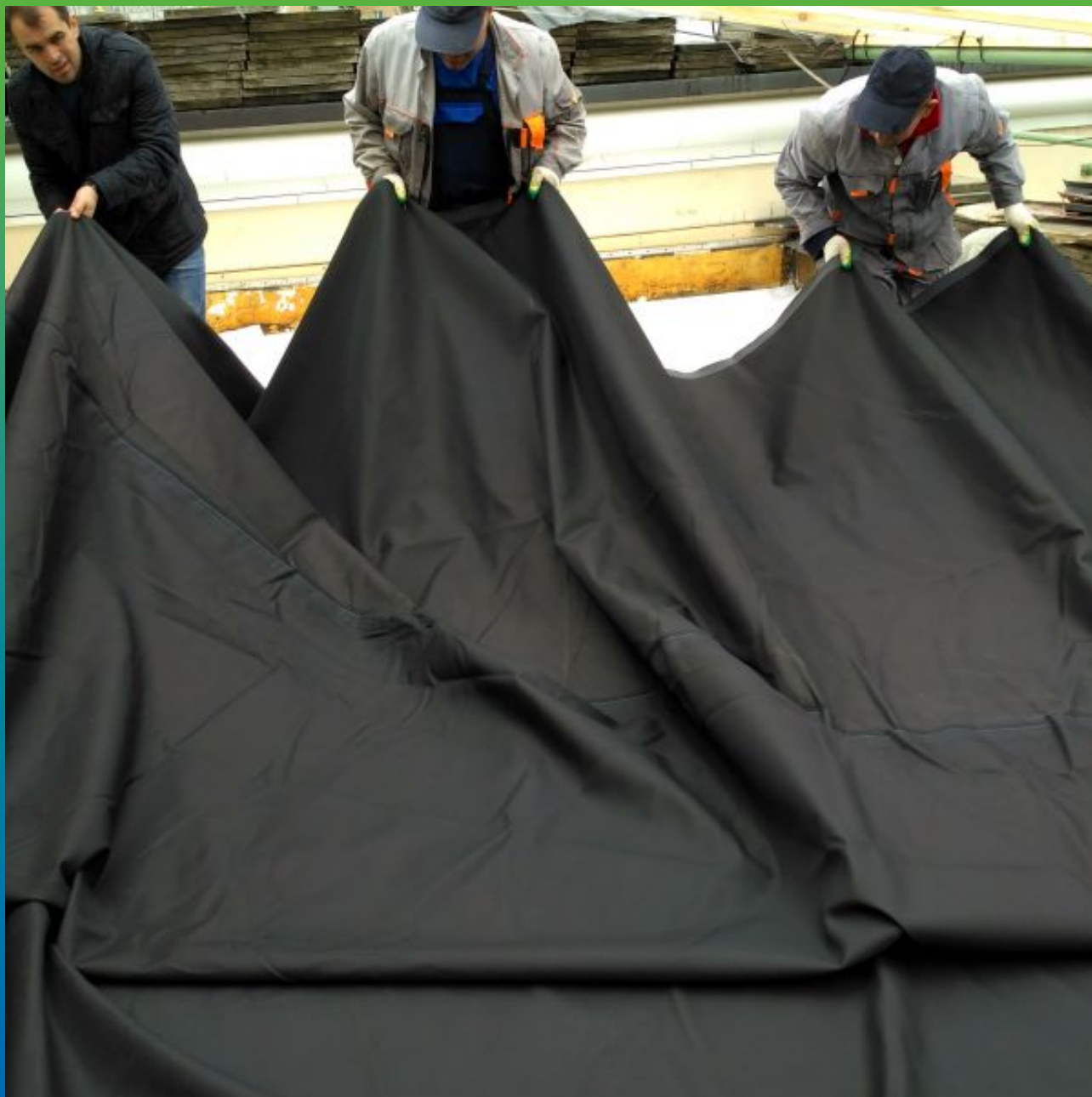
Укладка и монтаж эпдм мембраны Преласты СТ