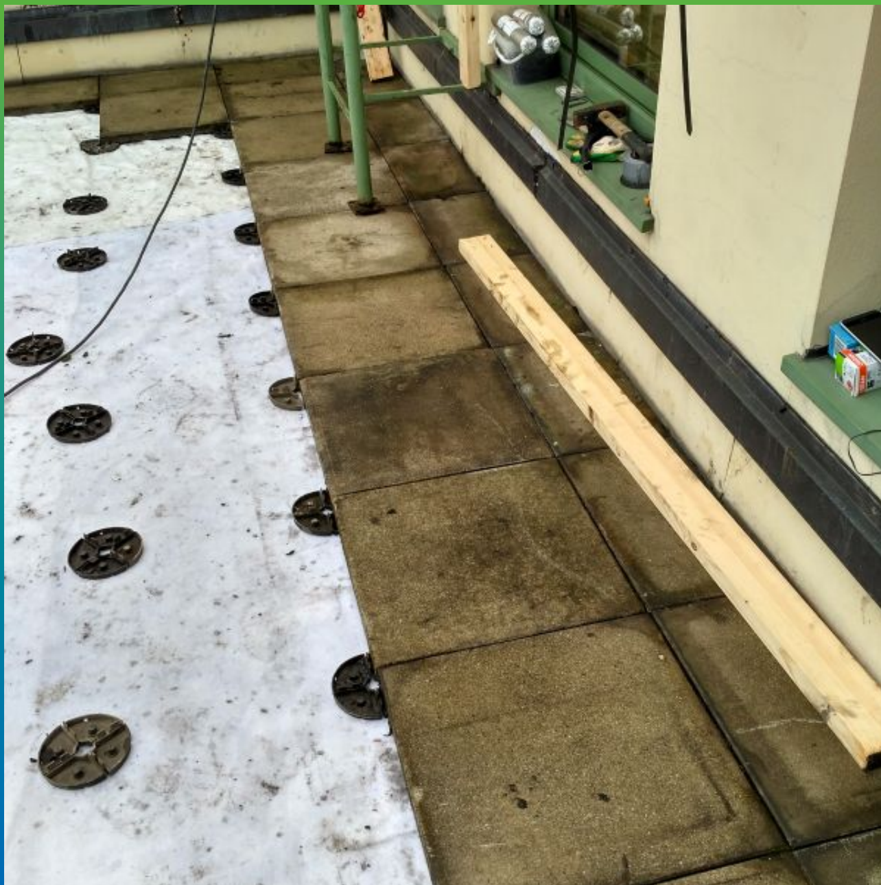
Монтаж тротуарной плитки