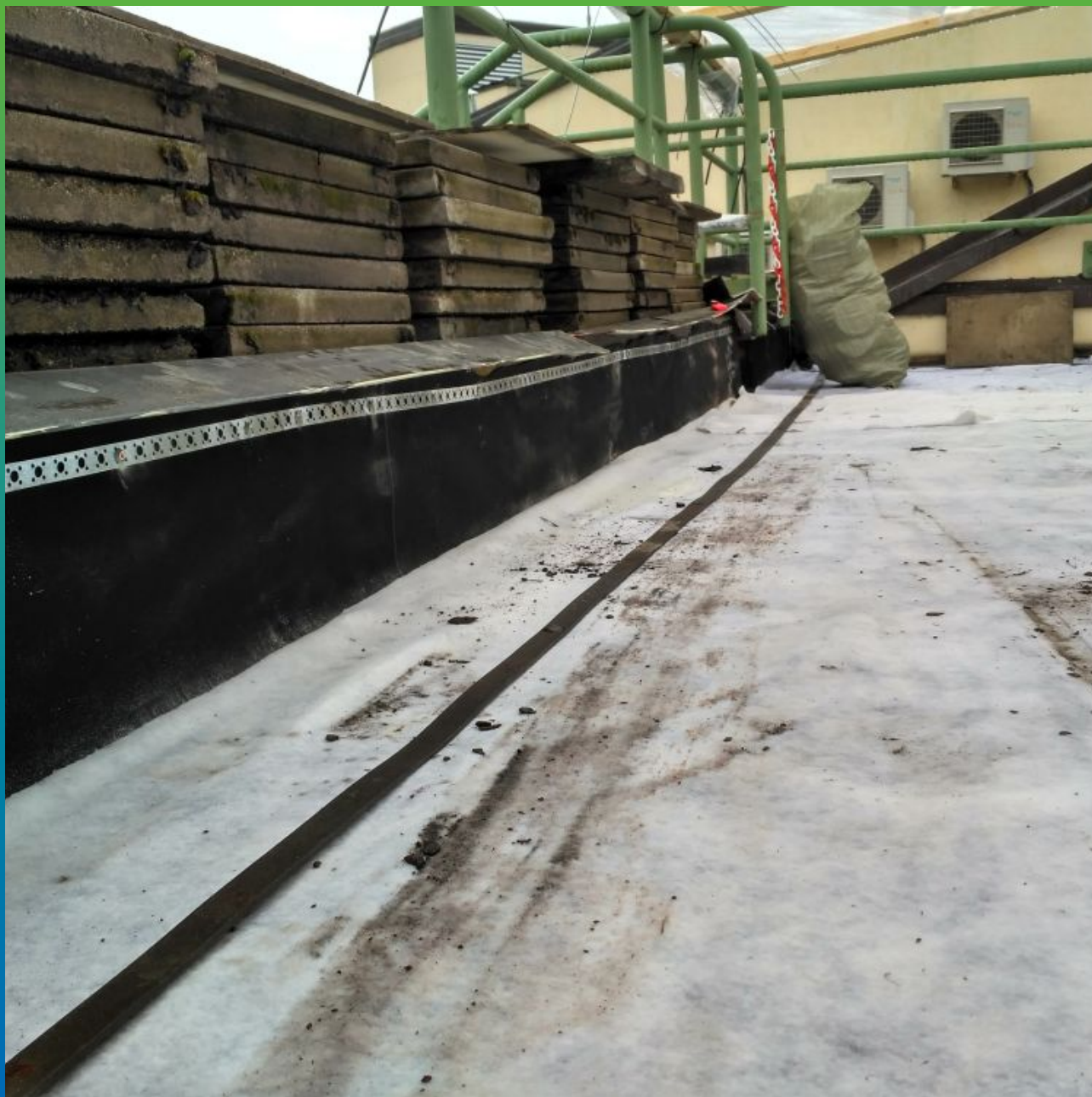
Устройство примыканий с применением герметика Витрафин Бонд Ф