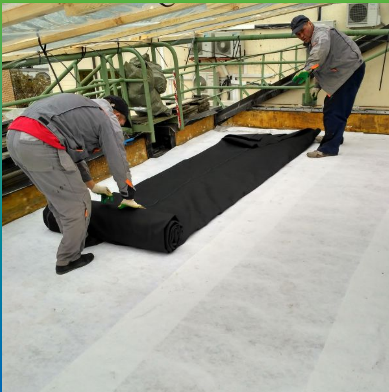
Укладка и монтаж эпдм мембраны Прелести СТ