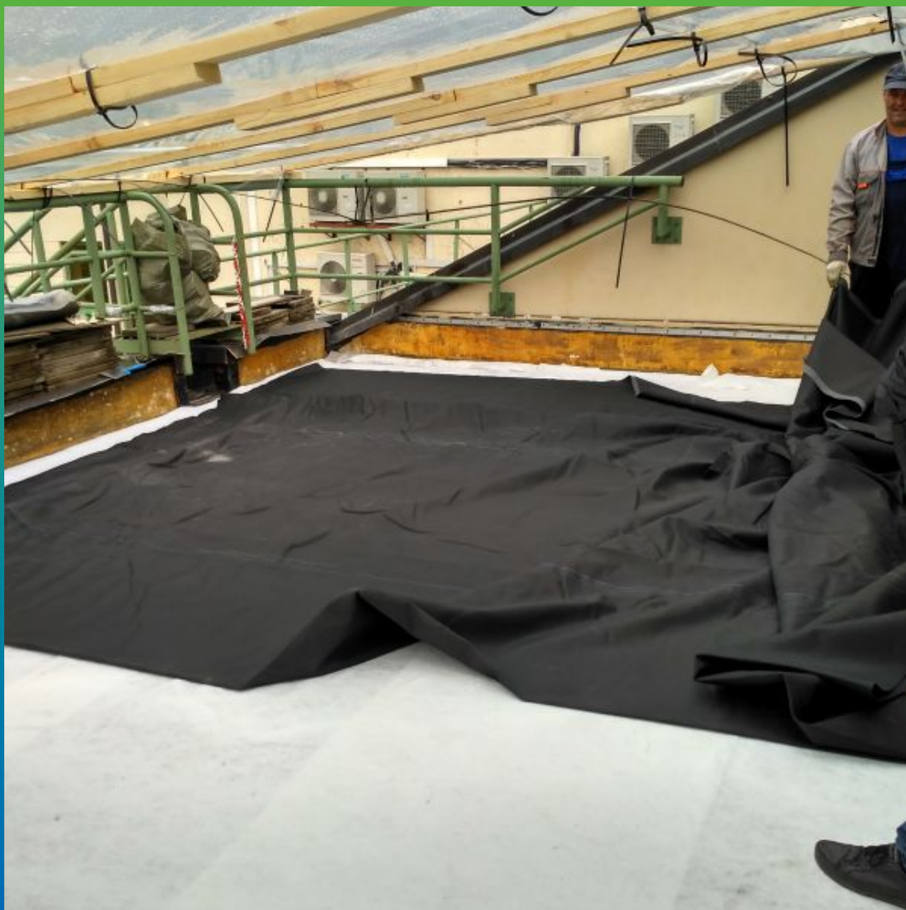
Укладка и монтаж эпдм мембраны Прелести СТ