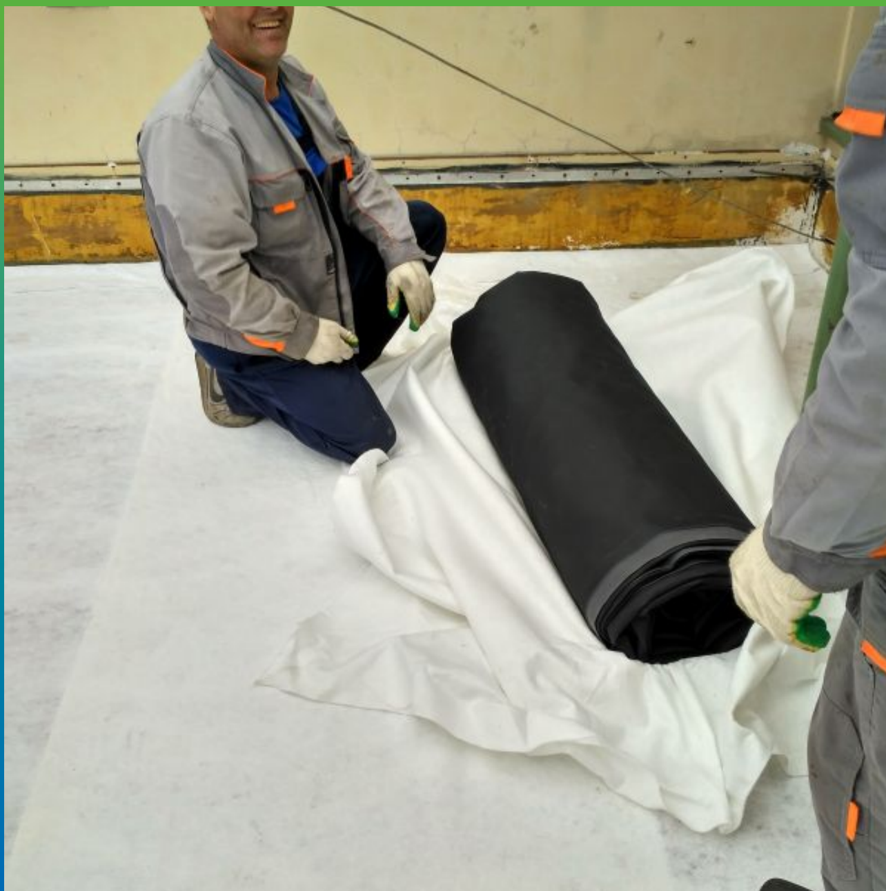
Распаковка ЭПДМ мембраны Преласта СТ