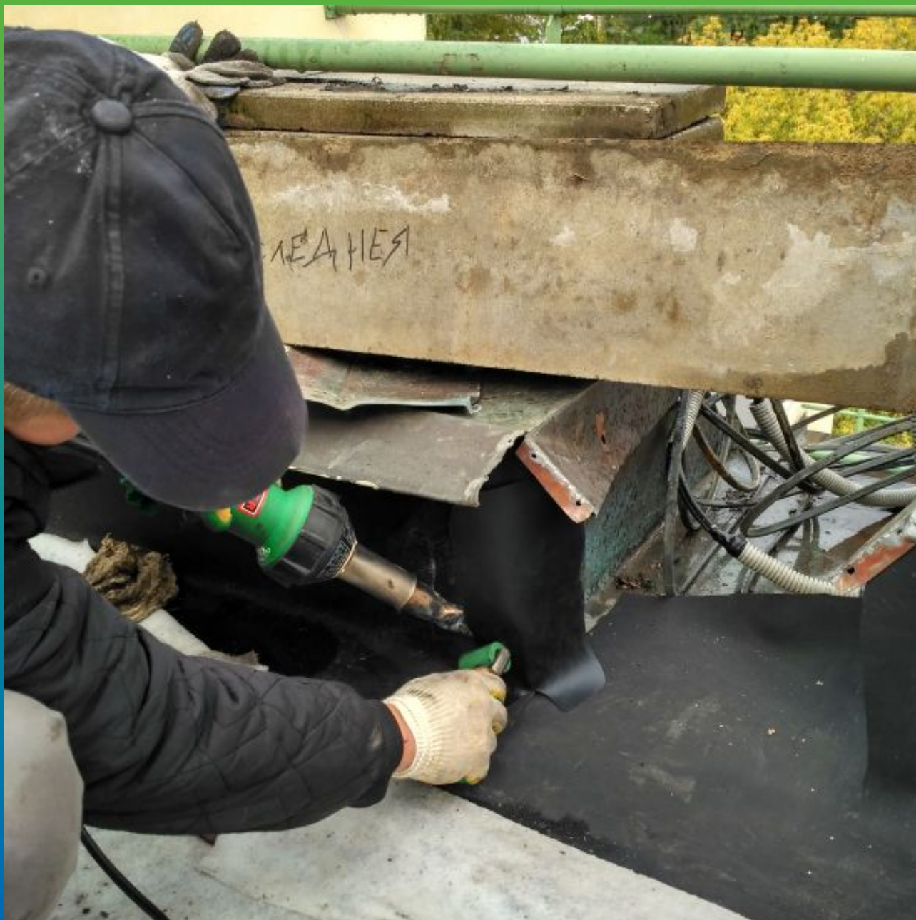
Устройство водослива в парапете с применением системы Термобонд