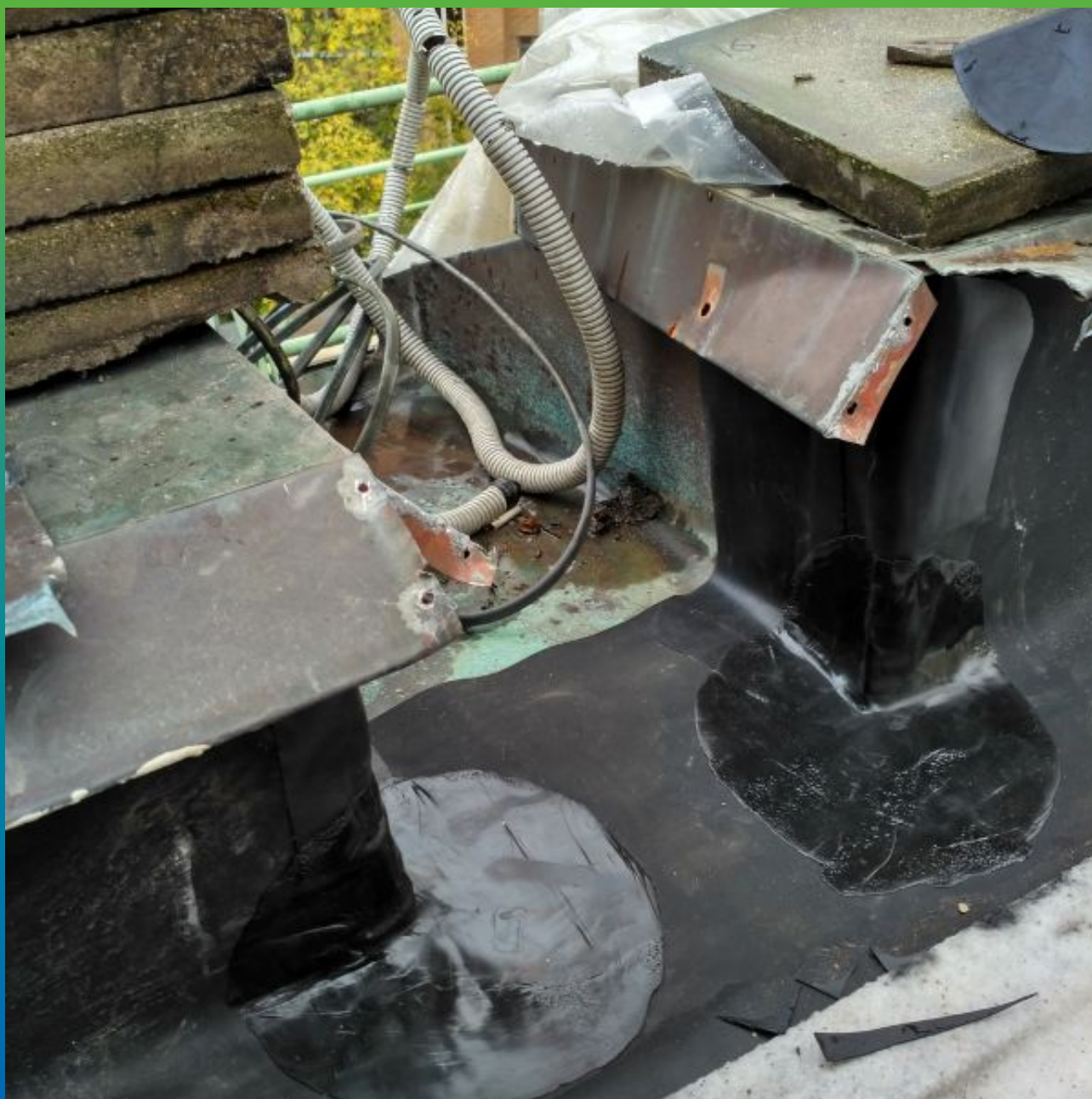
Конечный вид водослива в парапете