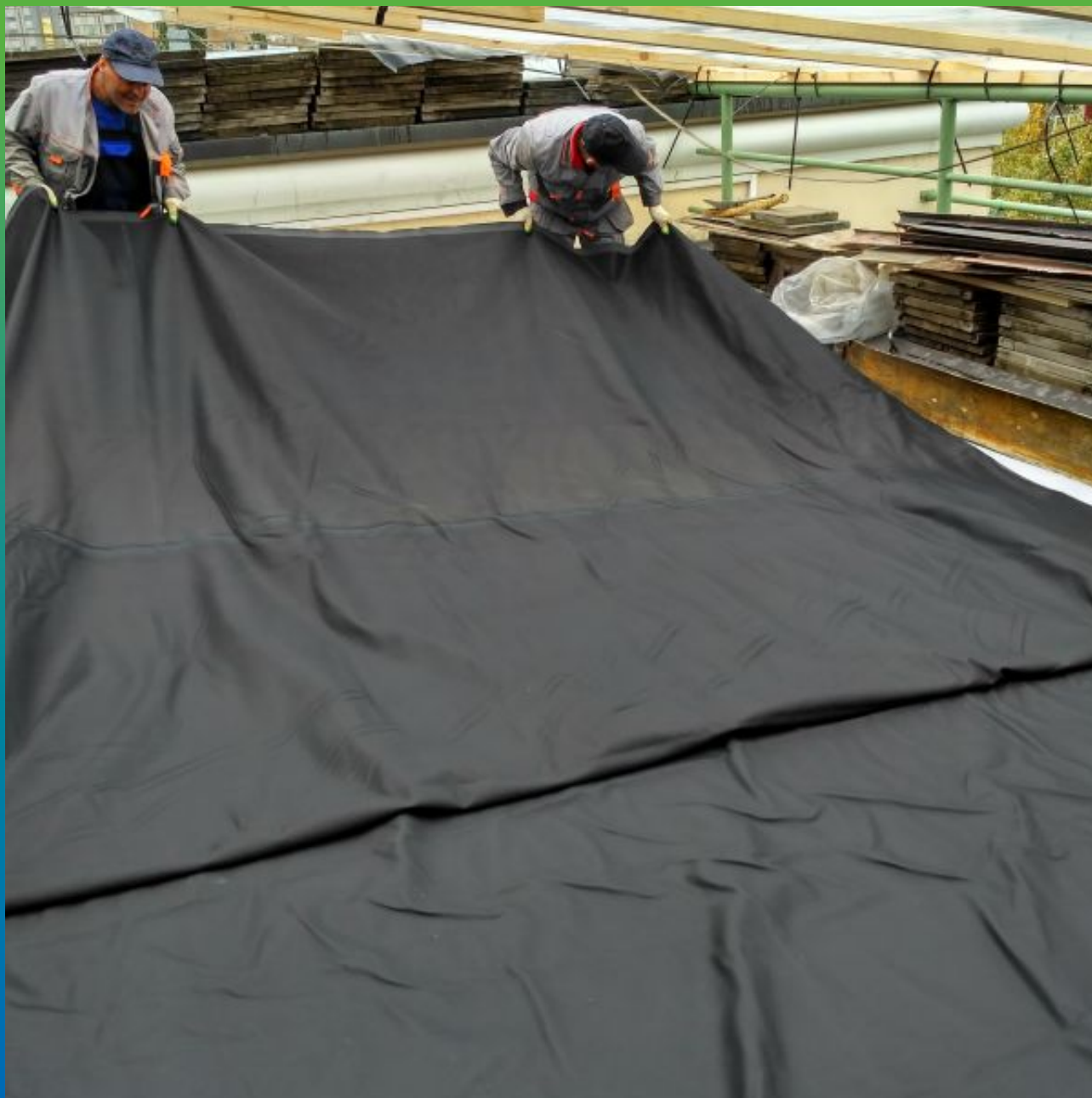
Укладка и монтаж эпдм мембраны Преласты СТ