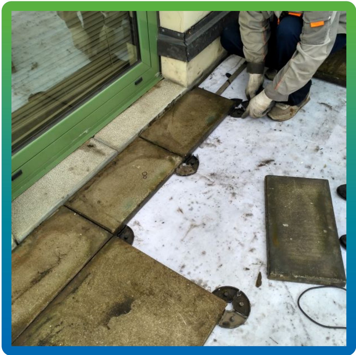
Монтаж тротуарной плитки