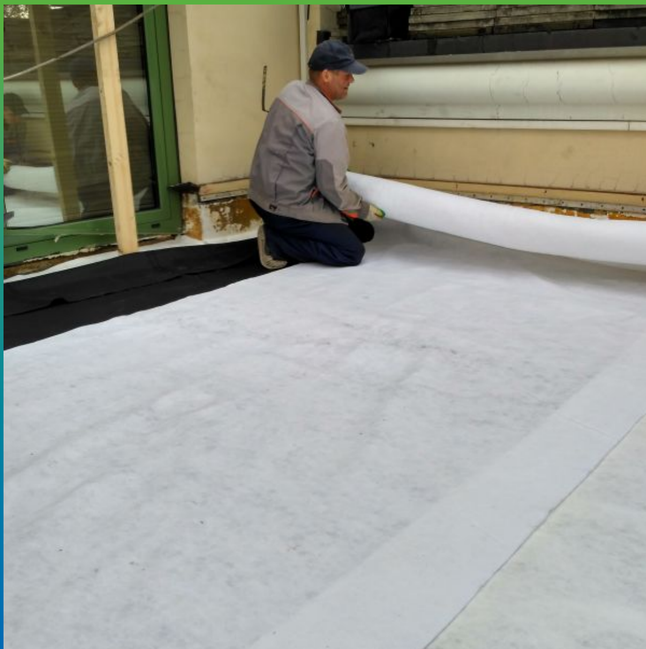
Укладка защитного слоя из геотекстиля