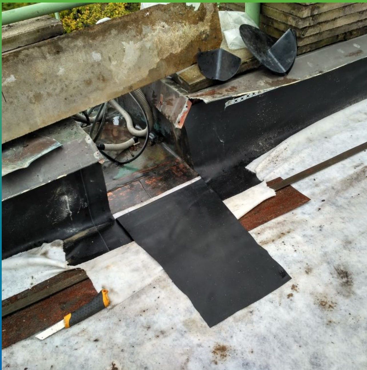
Устройство водослива в парапете