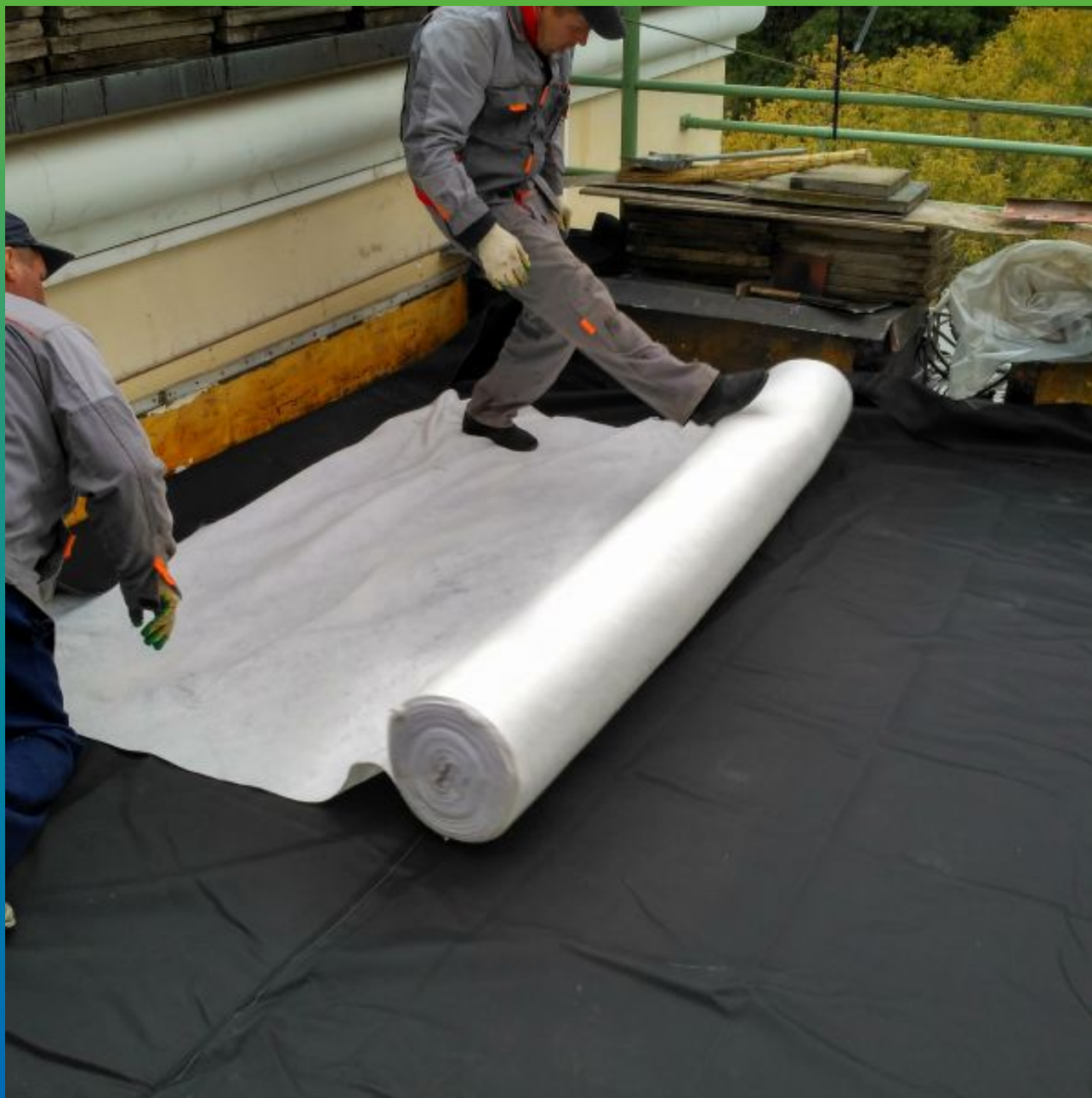
Укладка защитного слоя из геотекстиля