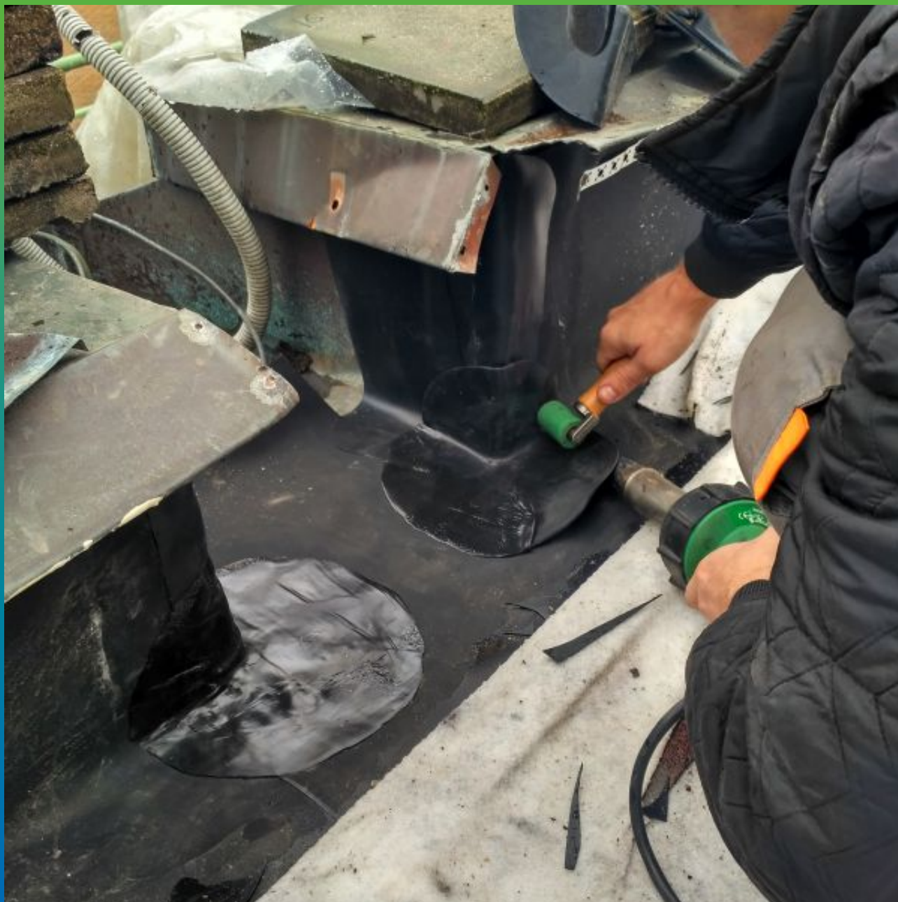
Устройство водослива в парапете с применением системы Термобонд