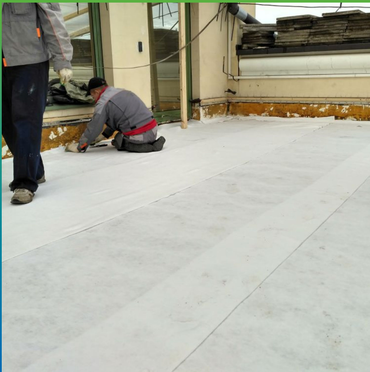
Укладка защитного слоя из геотекстиля