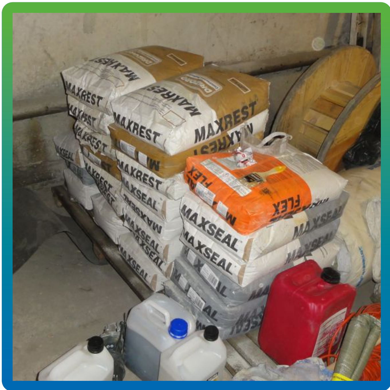
Материалы на объекте