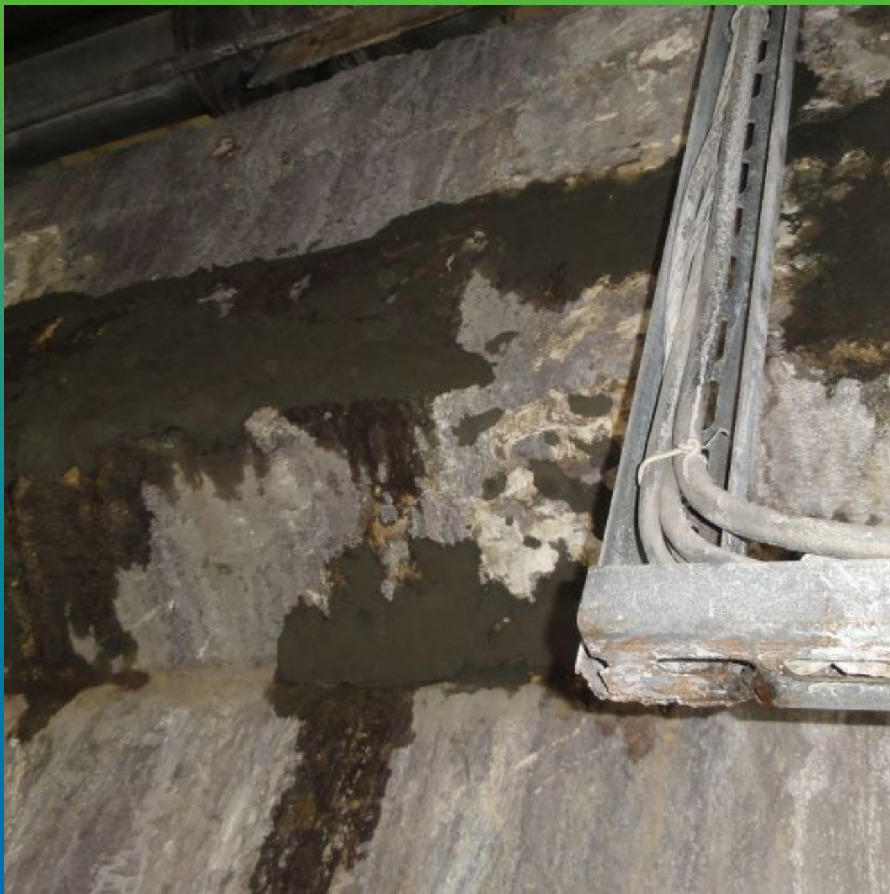
Вид отремонтированной поверхности