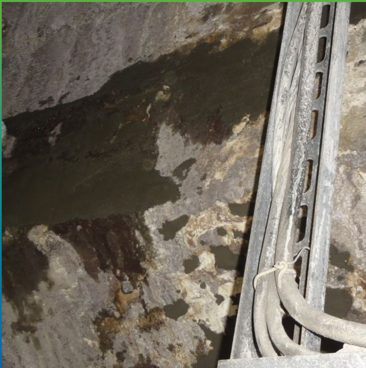
Нанесение ремонтного состава Макрест