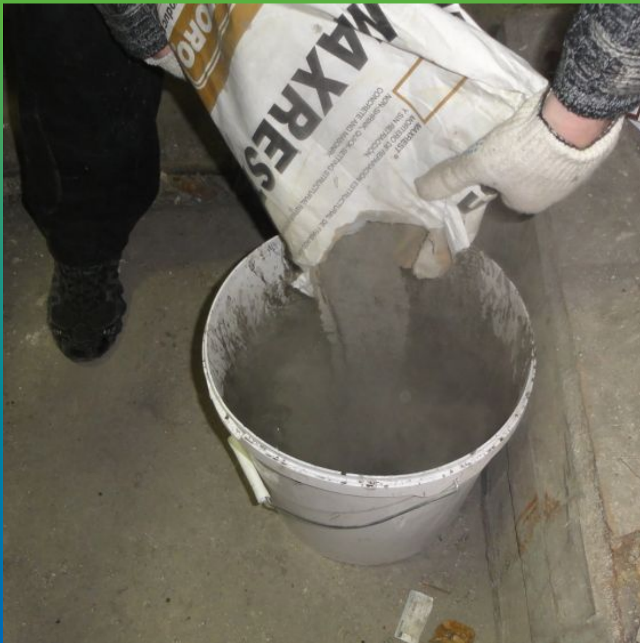
Затворение ремонтного состава Макрест