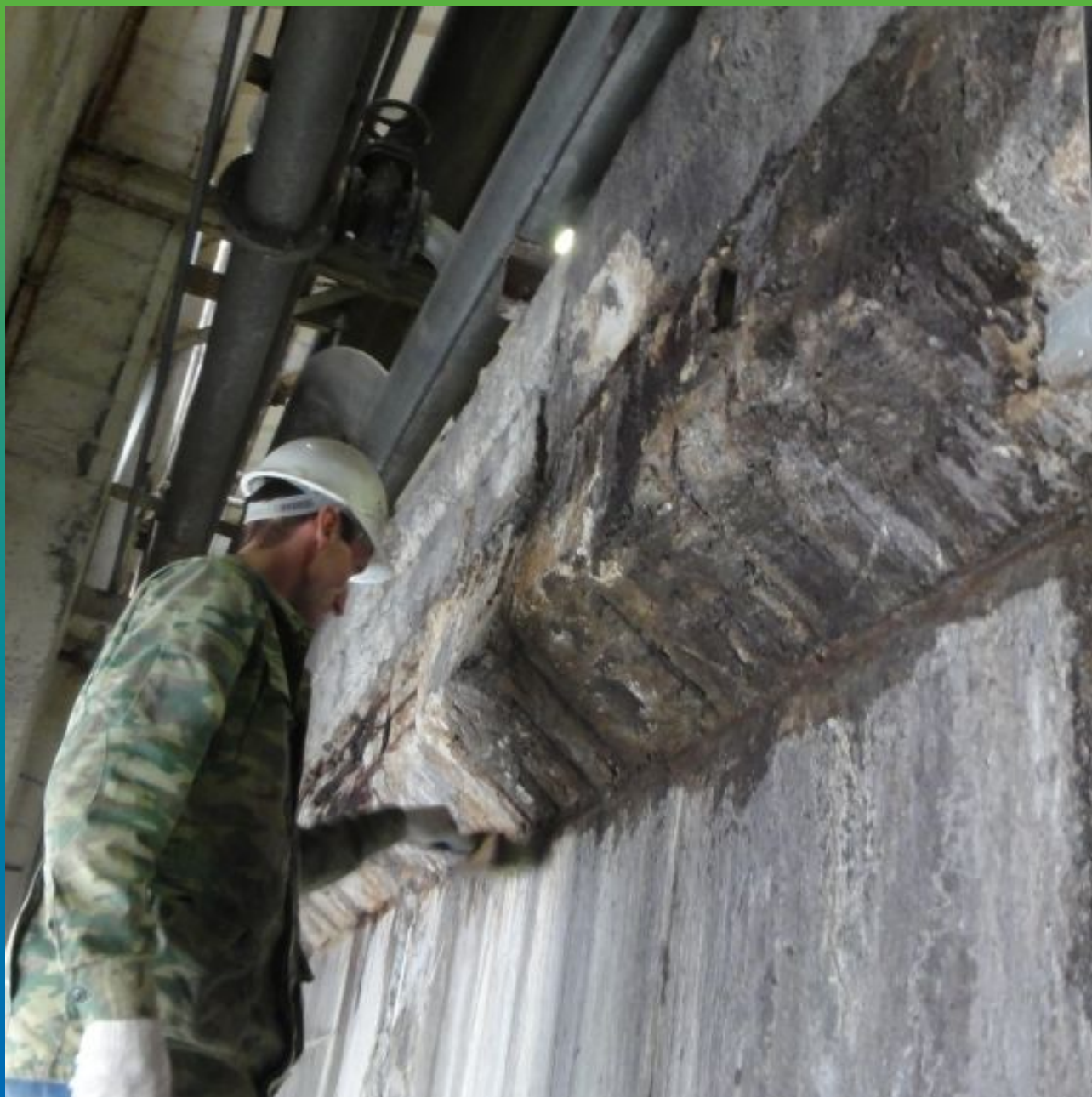
Увлажнение поверхности перед нанесением ремонтного состава Максрест