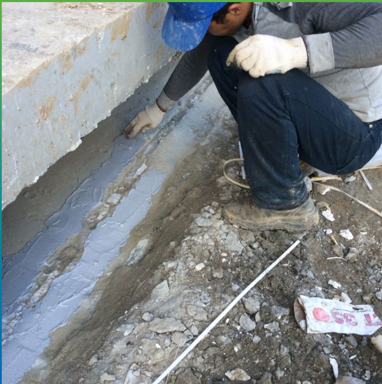
Нанесение манопокс 331 на края шва