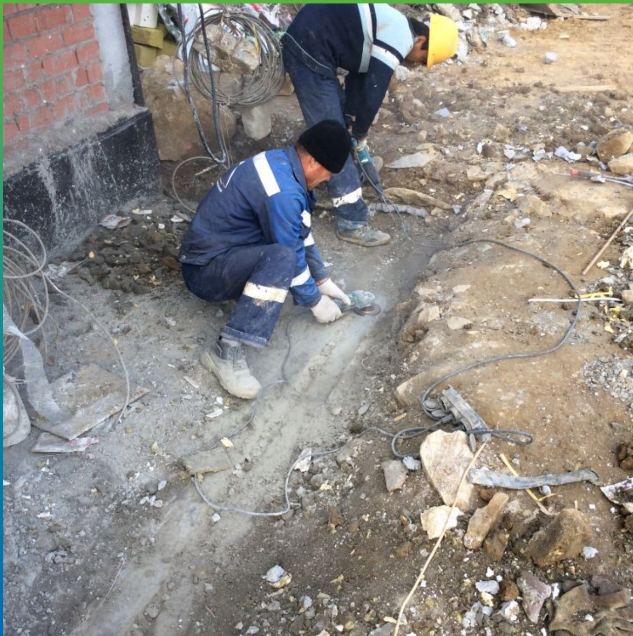
Первоначальный вид деформационного шва