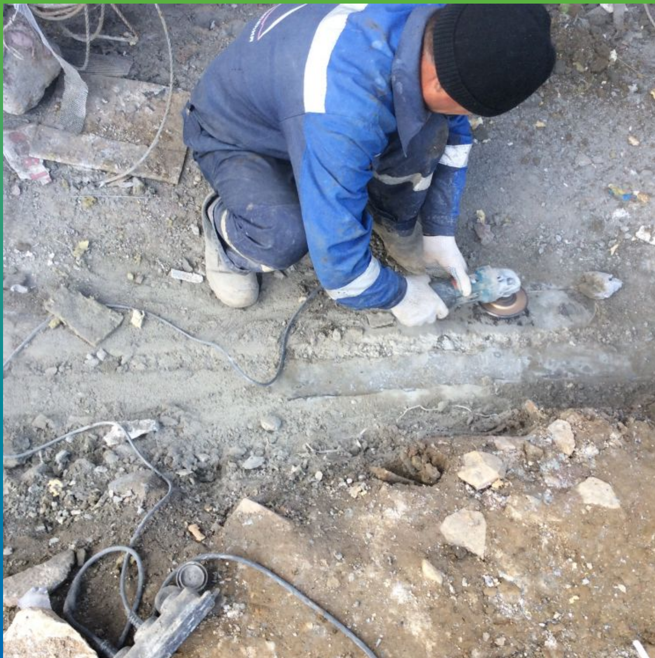
Подготовка поверхности - шлифовка