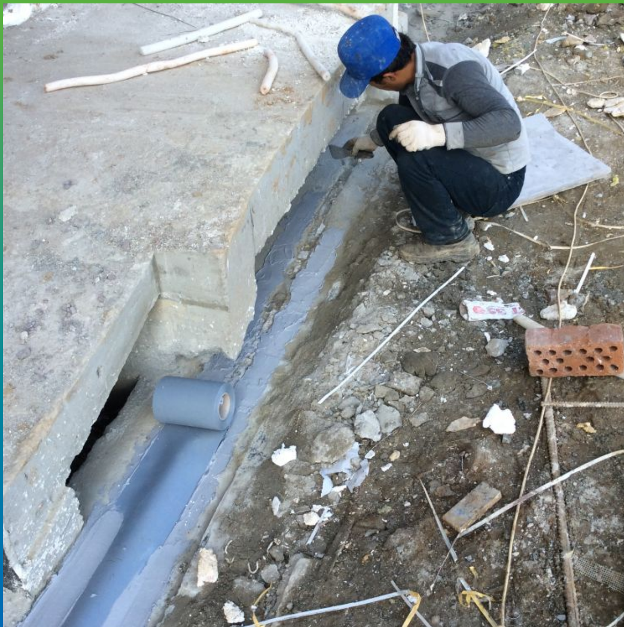
Приклеивание ленты Мандил Про