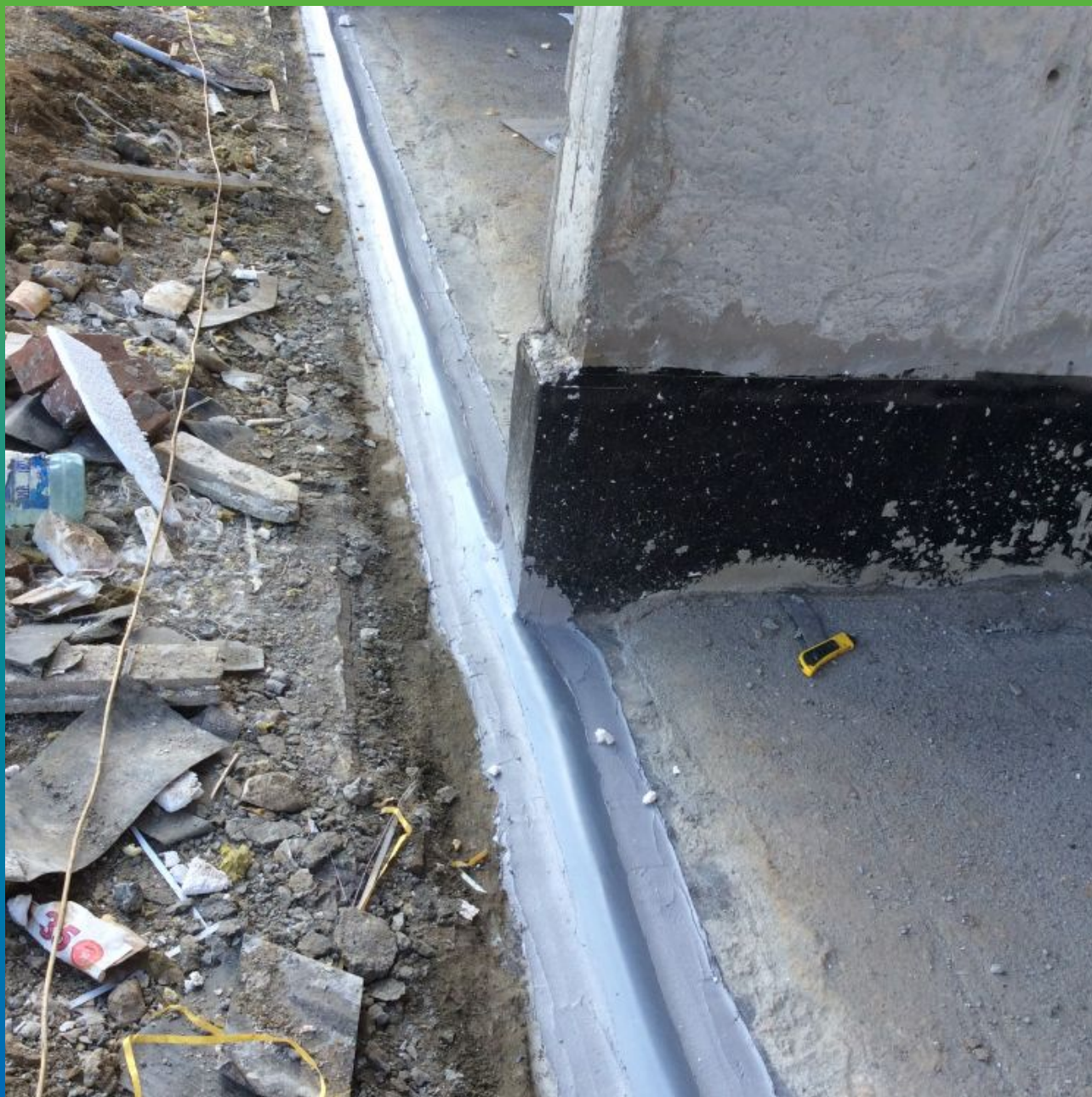
Финальный вид шва