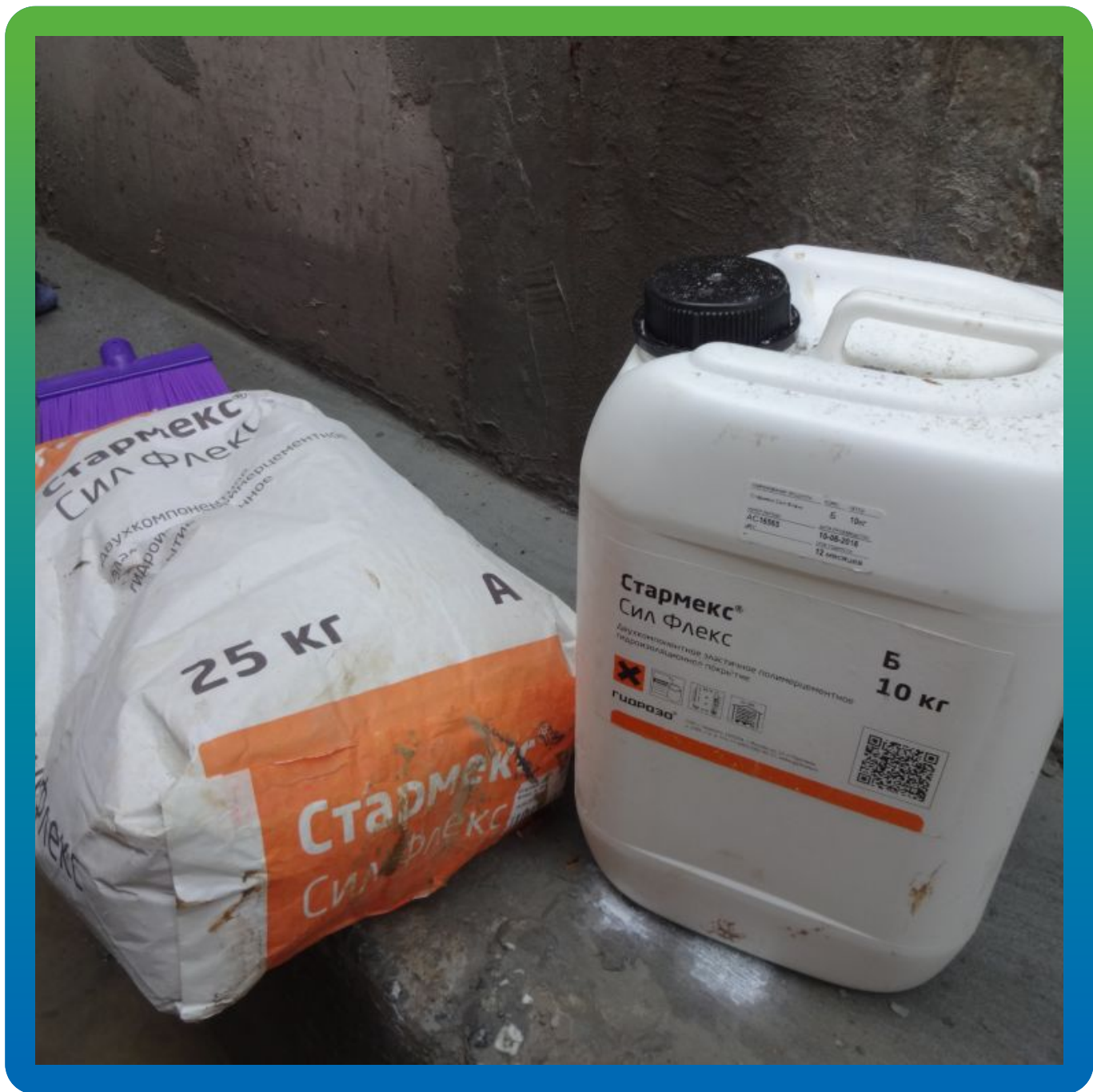
2К эластичное гидроизоляционное покрытие Стармекс Сил Флекс