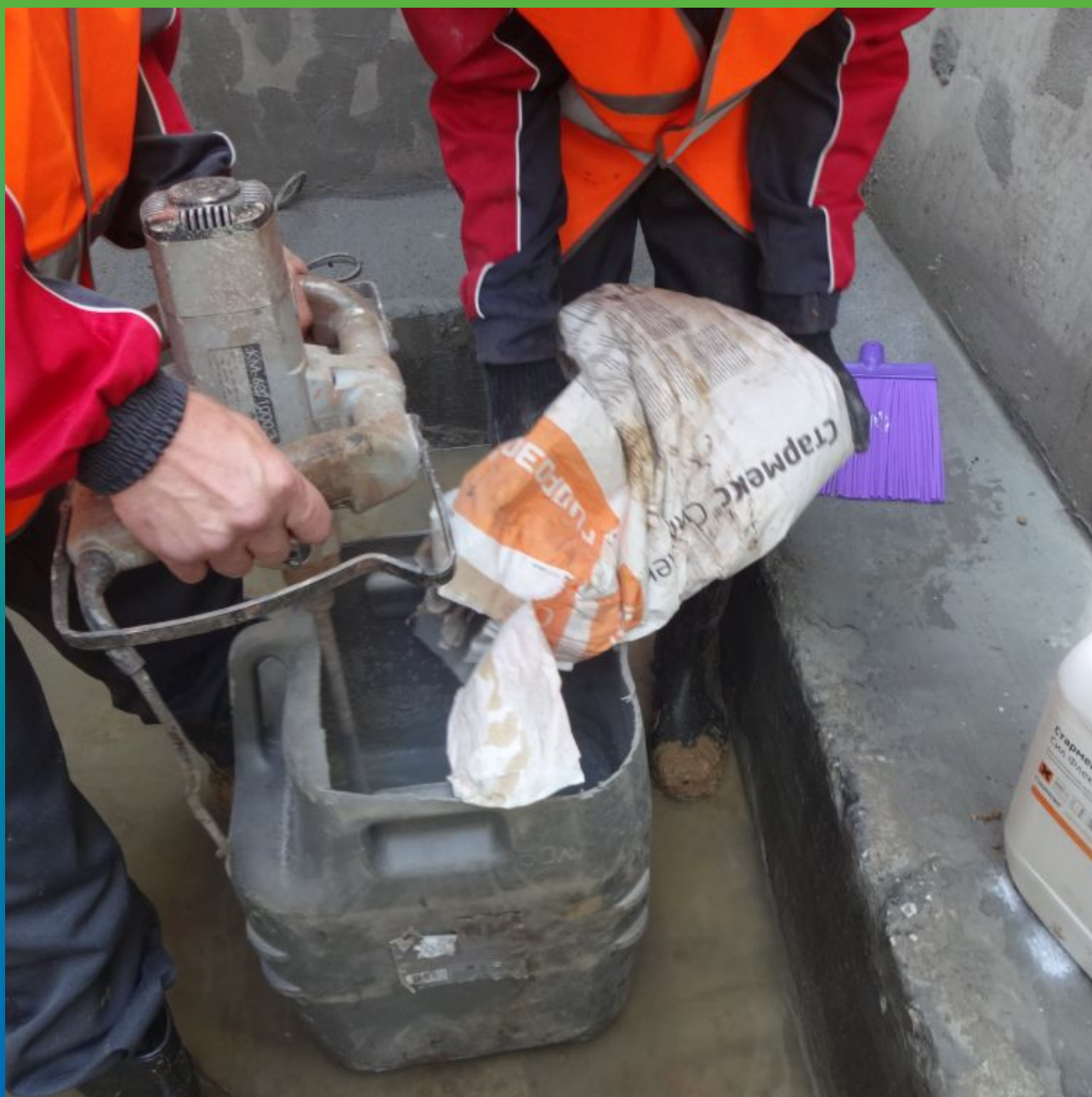
Приготовление эластичного гидроизоляционного состава Стармекс Сил Флекс к нанесению