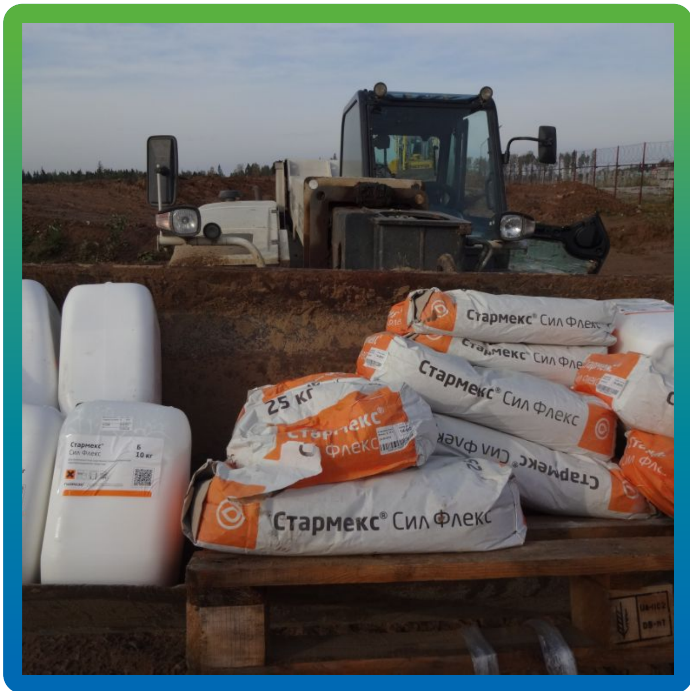
Материалы "Гидрозо" на объекте