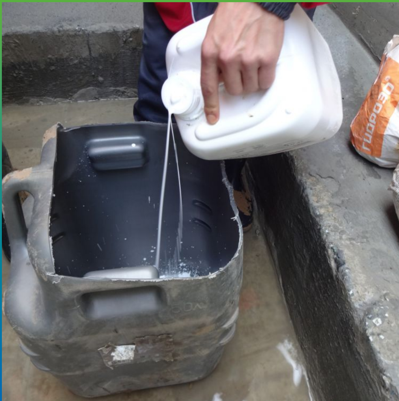
Приготовление эластичного гидроизоляционного состава Стармекс Сил Флекс к нанесению