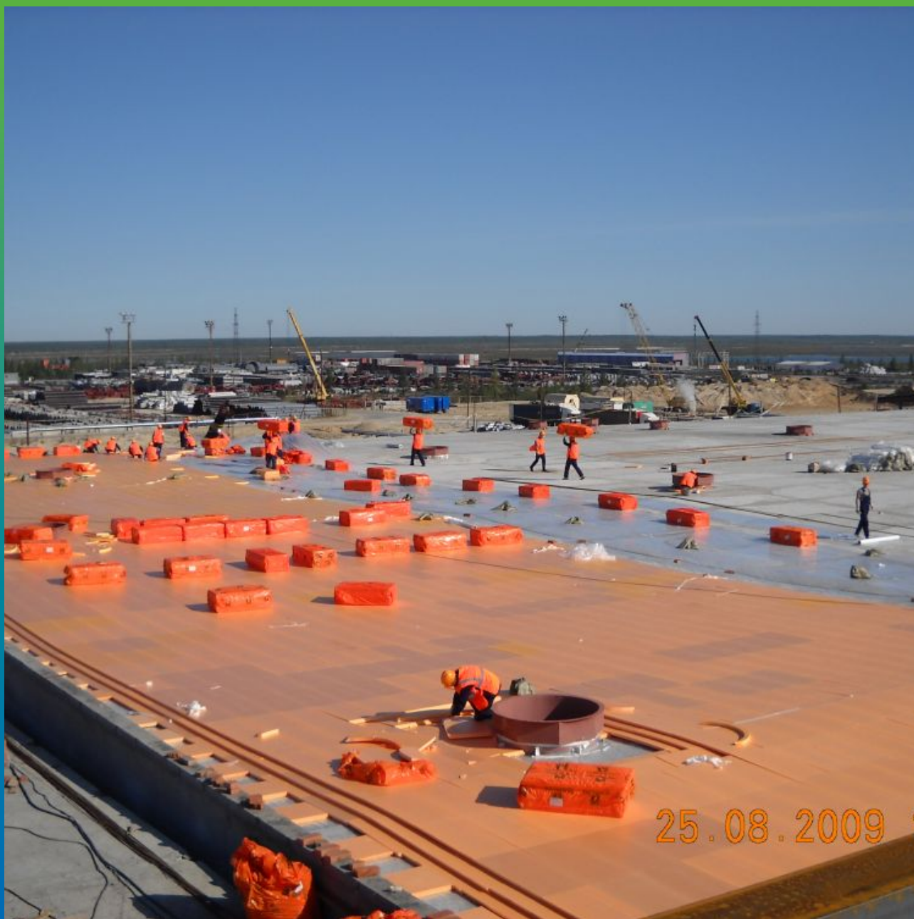
Устройство уклона с помощью экструдированного пенополистирола