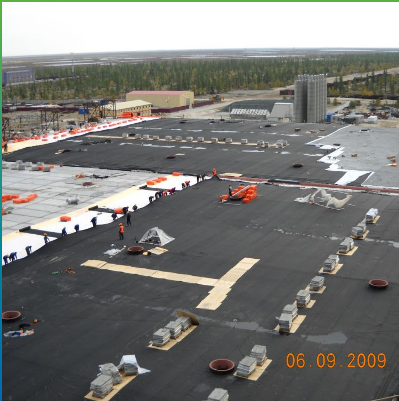
Подготовка полотен для сварки