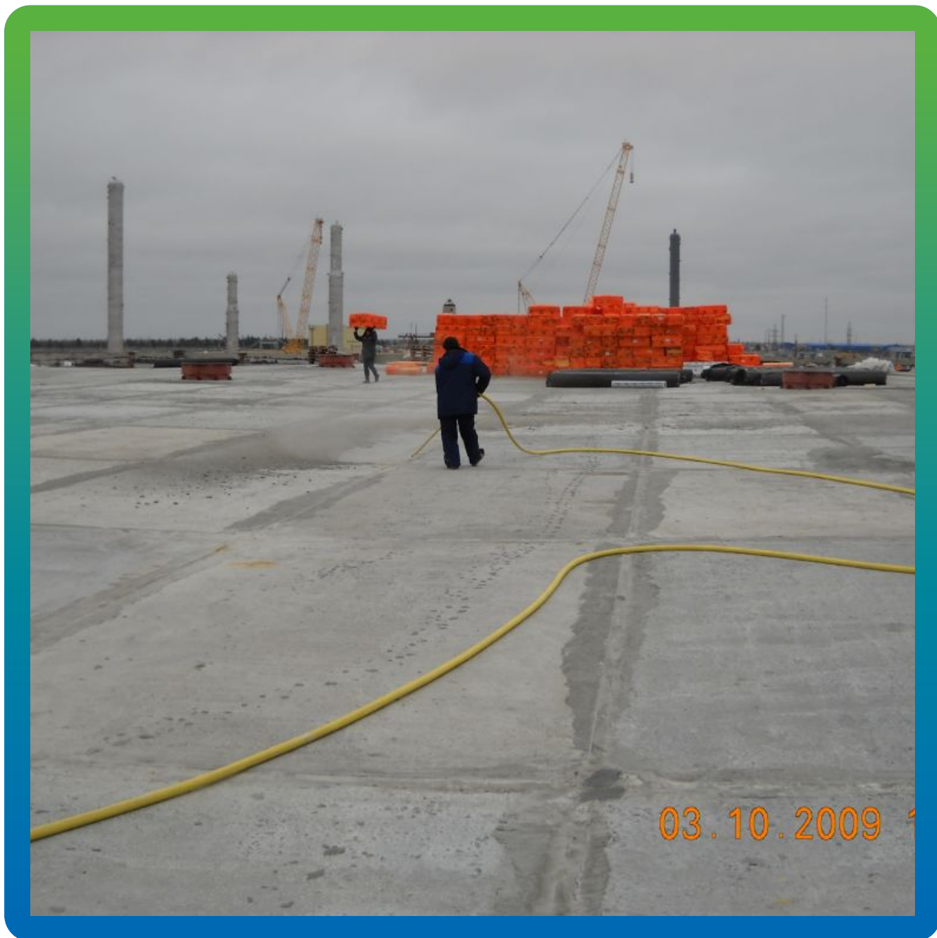
Подготовка основания кровли