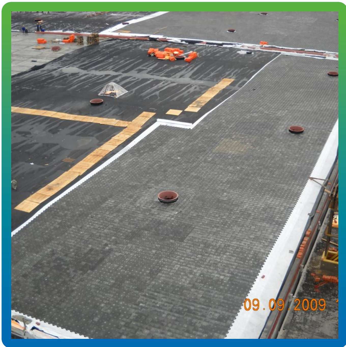
Укладка плитки на подстилающий слой из геотекстиля