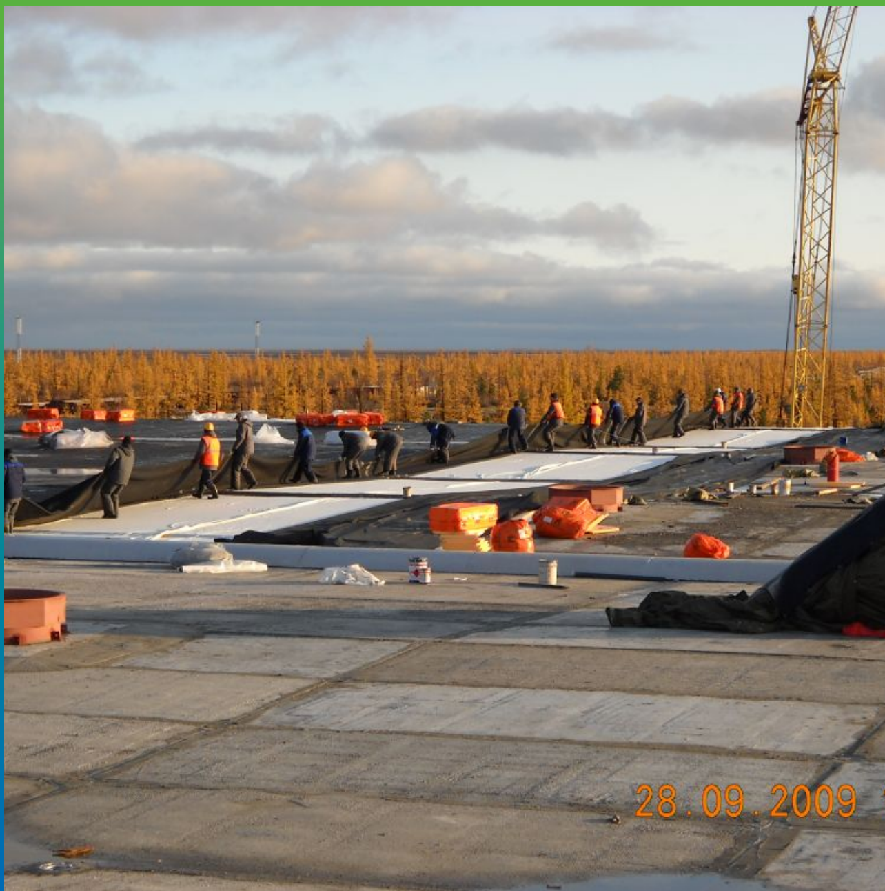
Укладка гидроизоляционного полотна 400 кв. м.