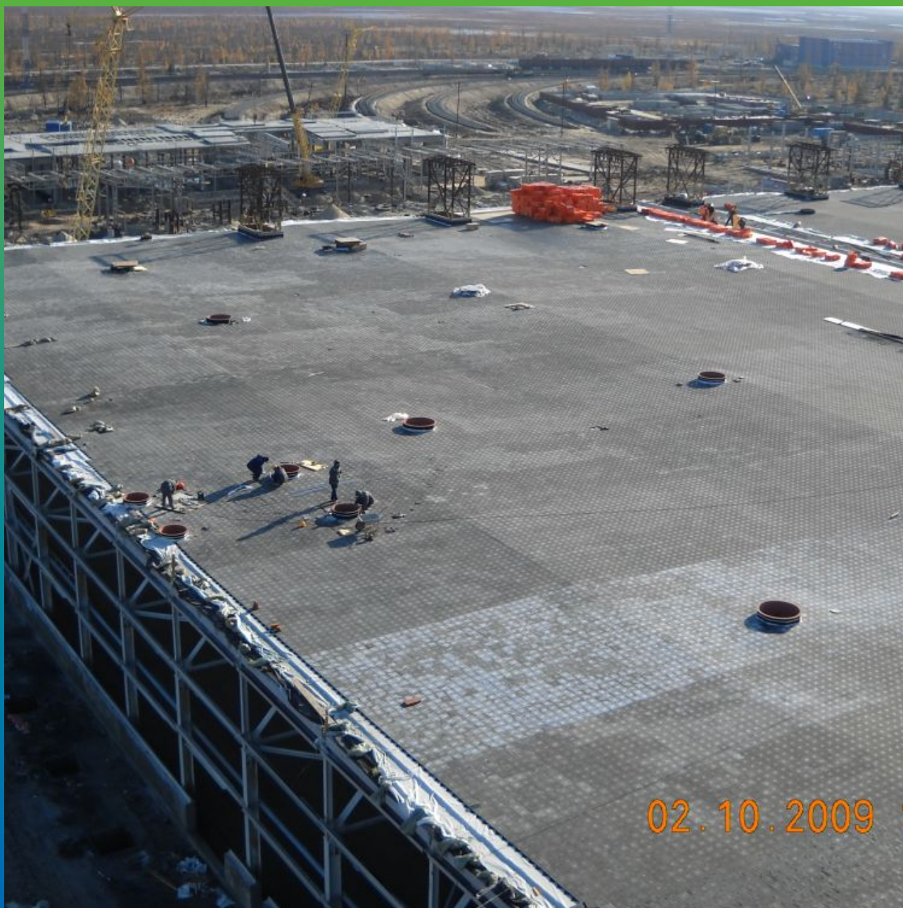
Укладка плитки, финишный слой