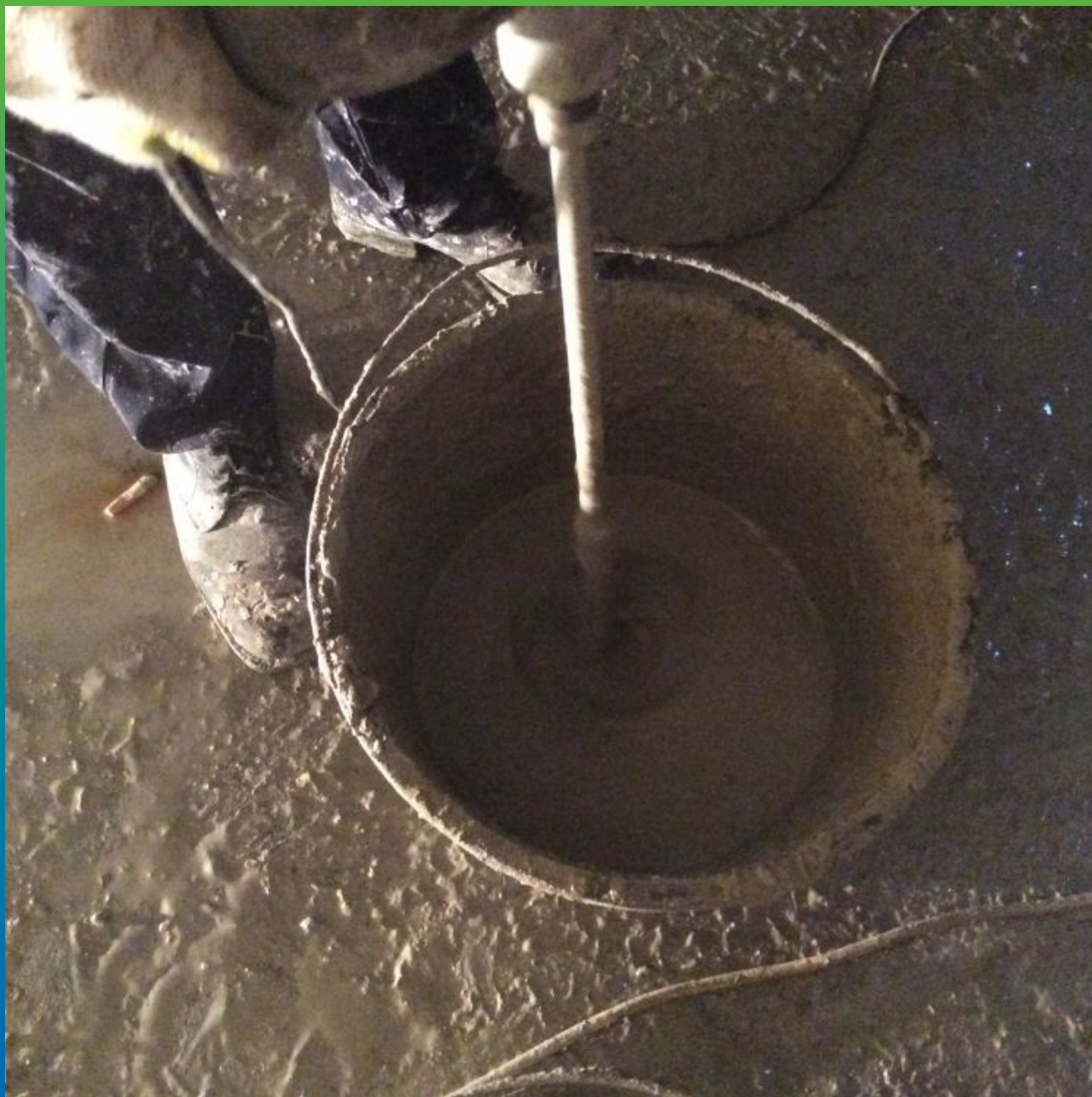
Затворение материала Стармекс Сил Флекс