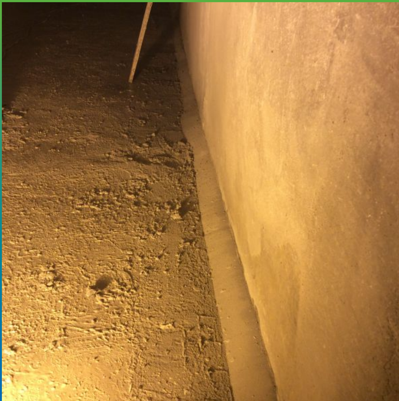
Галтель из Стармекс РМЗ