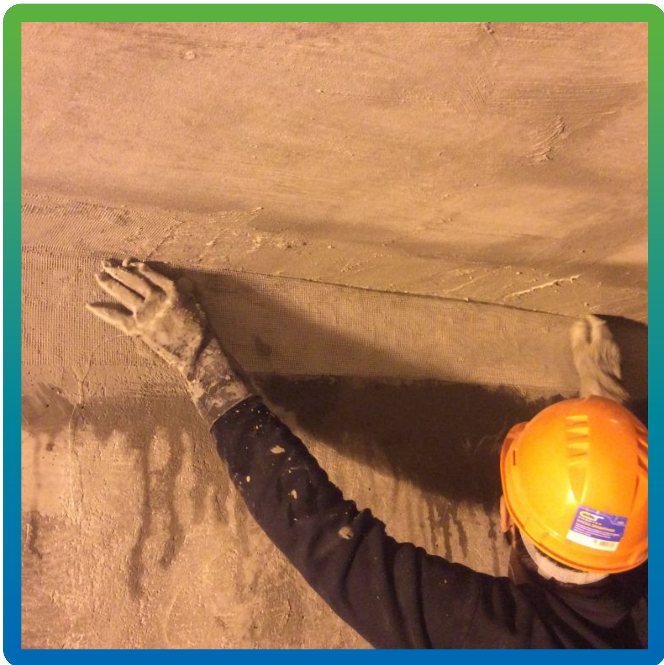
Укладка стеклосетки - армирование примыкания