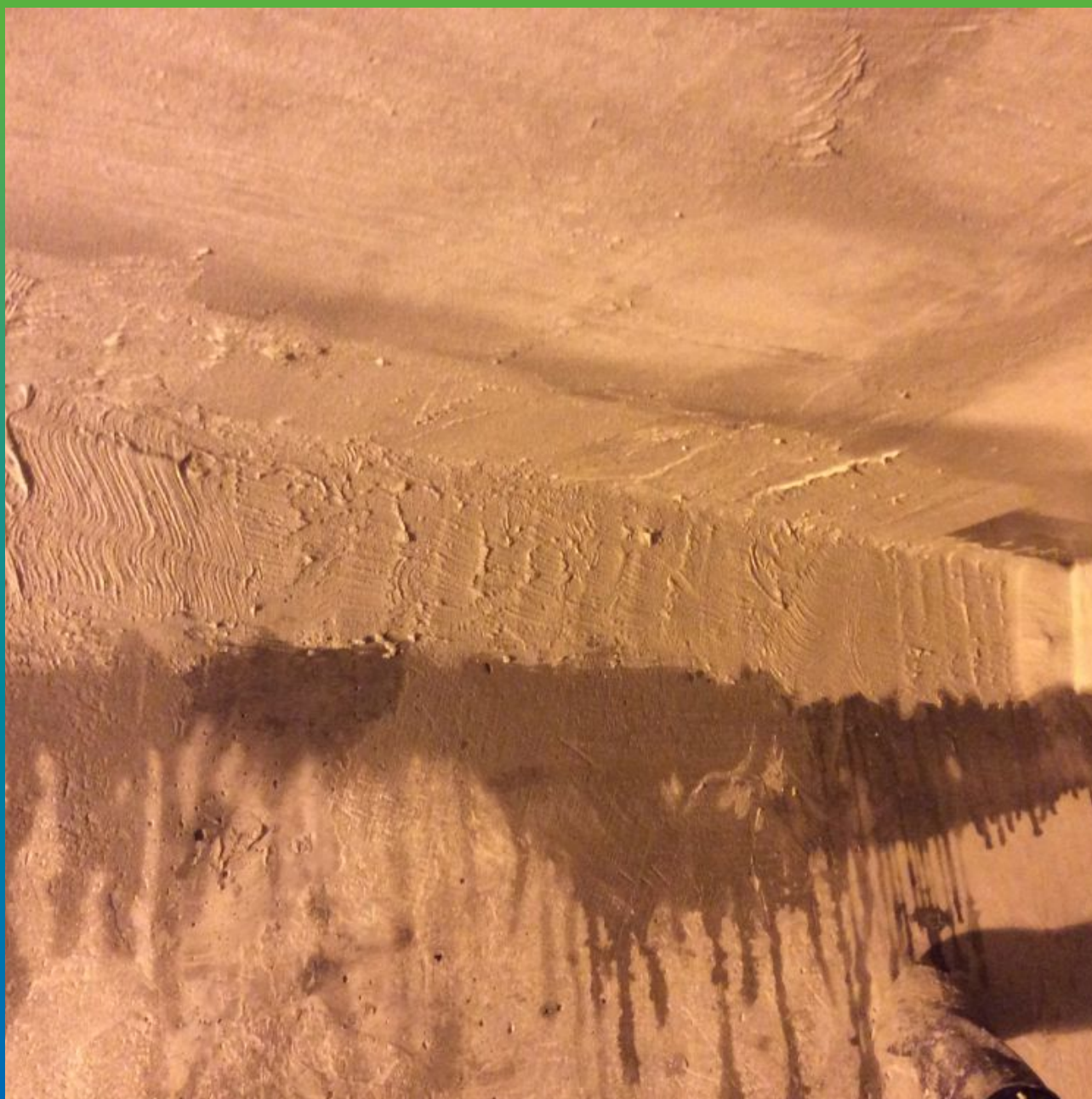
Нанесение материала Стармекс Сил Флекс