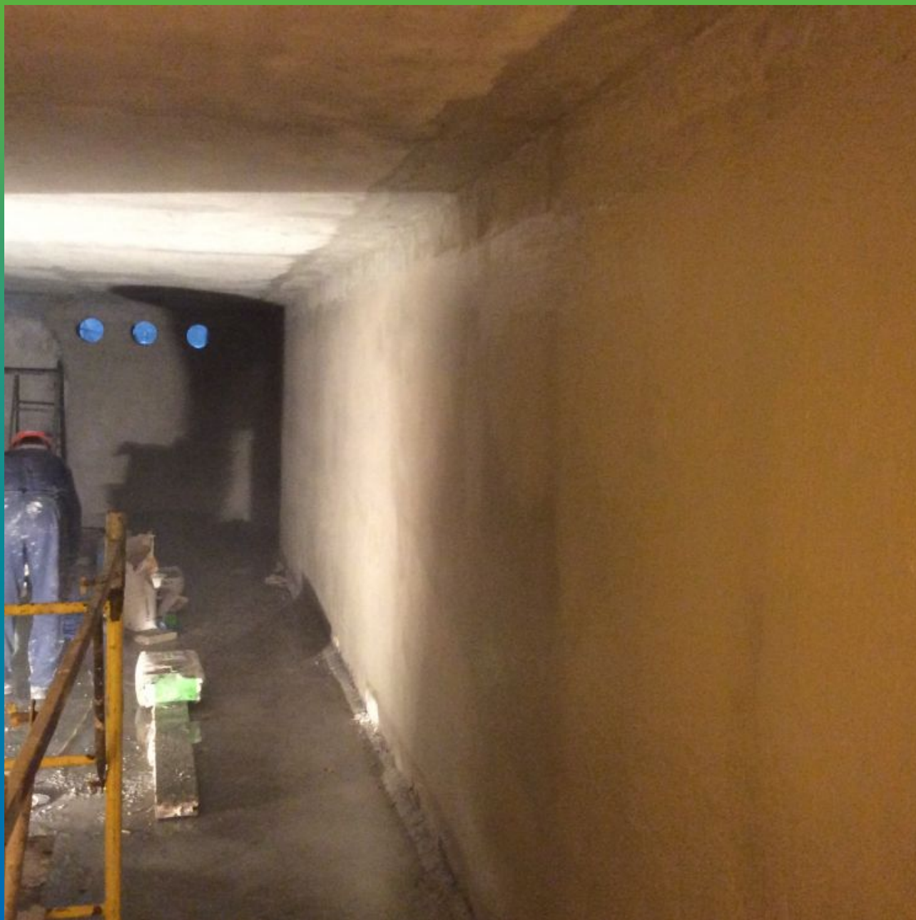
Финальный вид поверхности