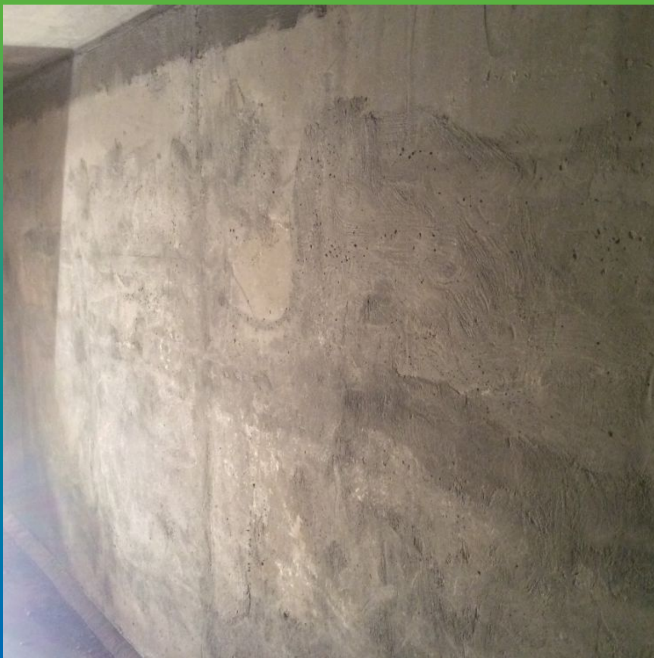
Вид подготовленной поверхности