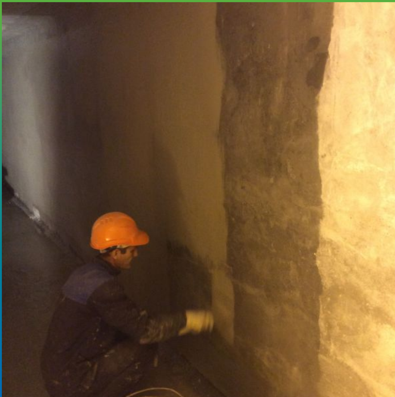
Нанесение основного слоя Стармекс Сил