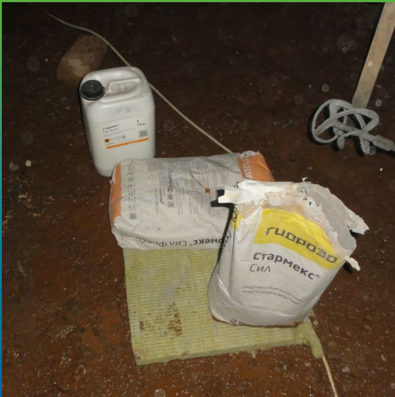
Материал на объекте: Стармекс Сил, Стармекс Сил Флекс