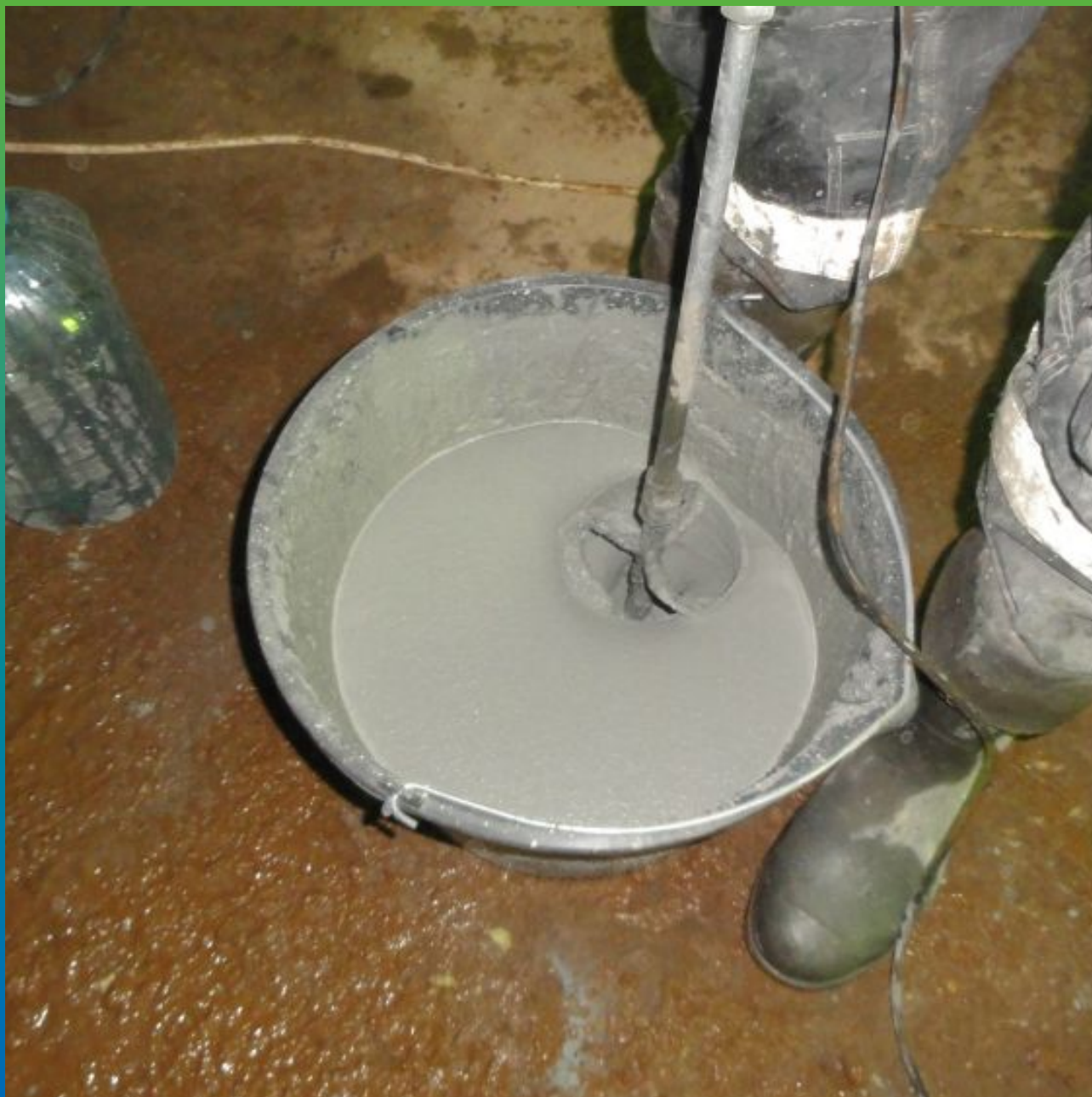
Затворение материала Стармекс Сил