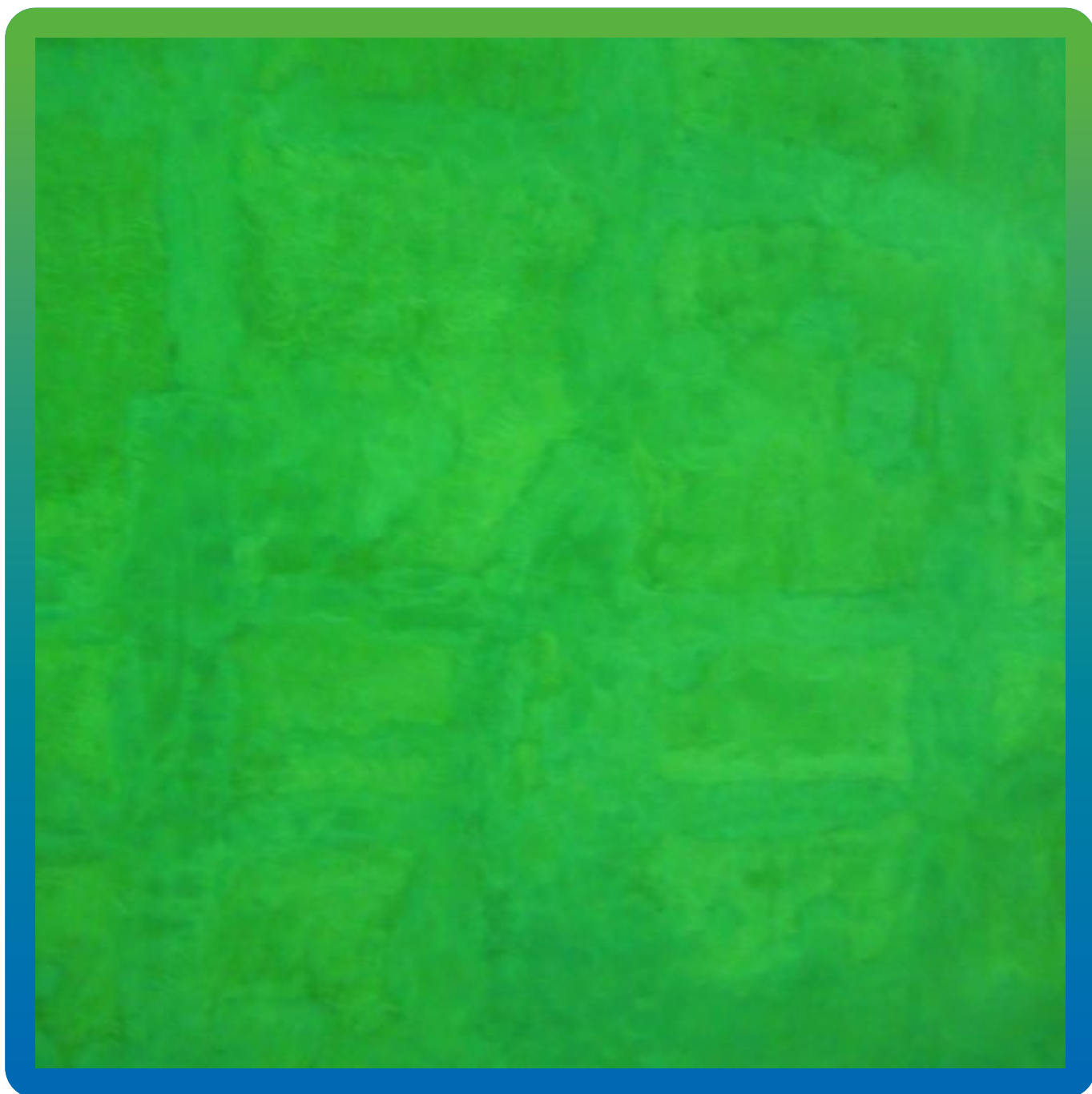
Вид подготовленной поверхности