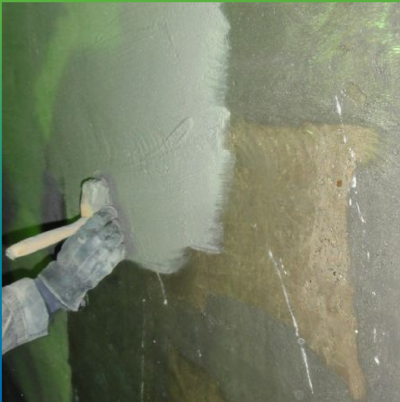
Нанесение материала Стармекс Сил