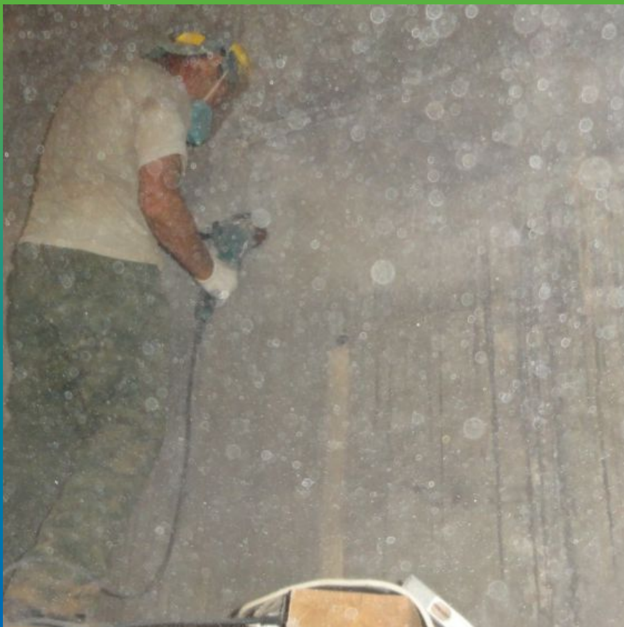
Подготовка - шлифовка поверхности