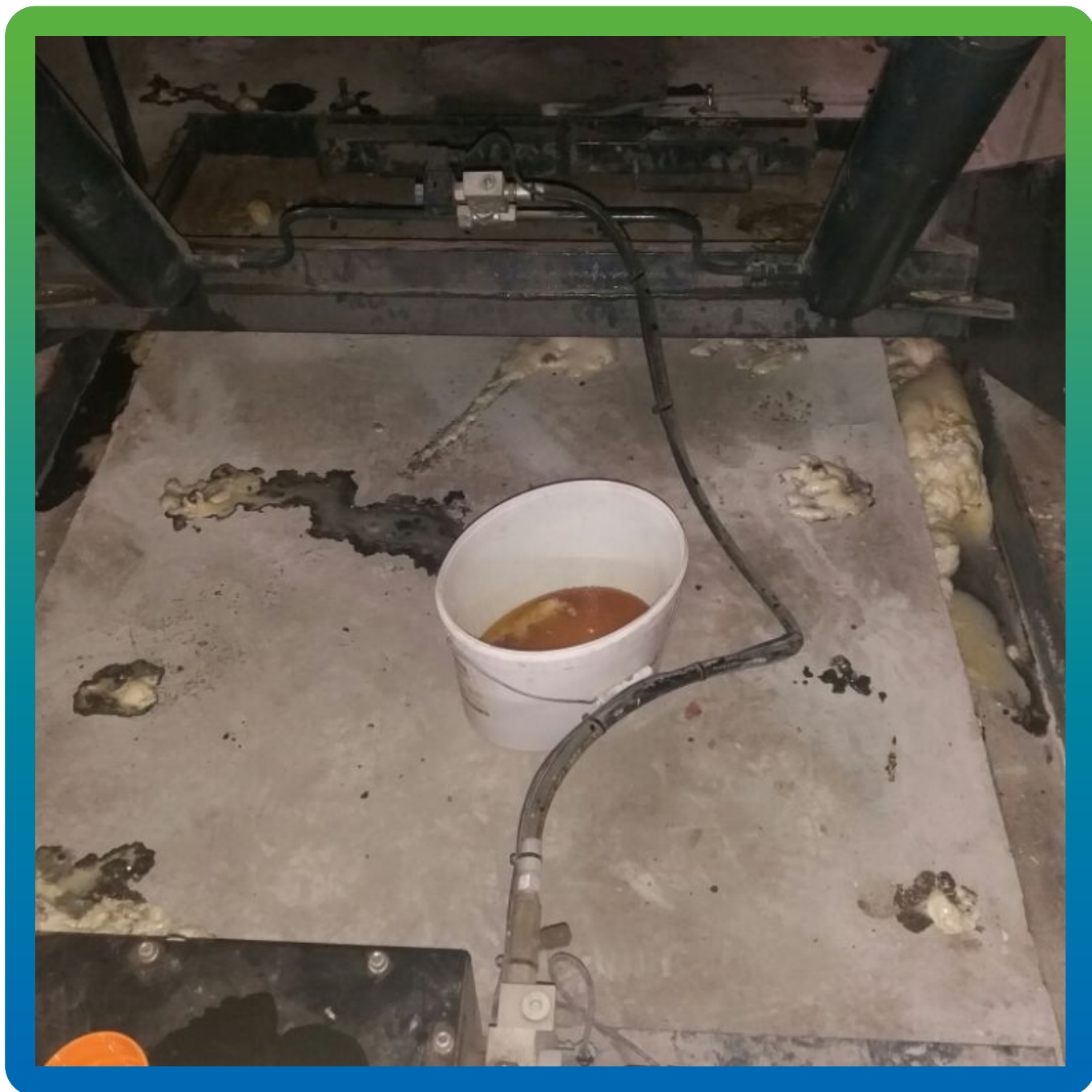
Докачка в те же пакеры эластичного, безусадочного ПУ Манопур 143