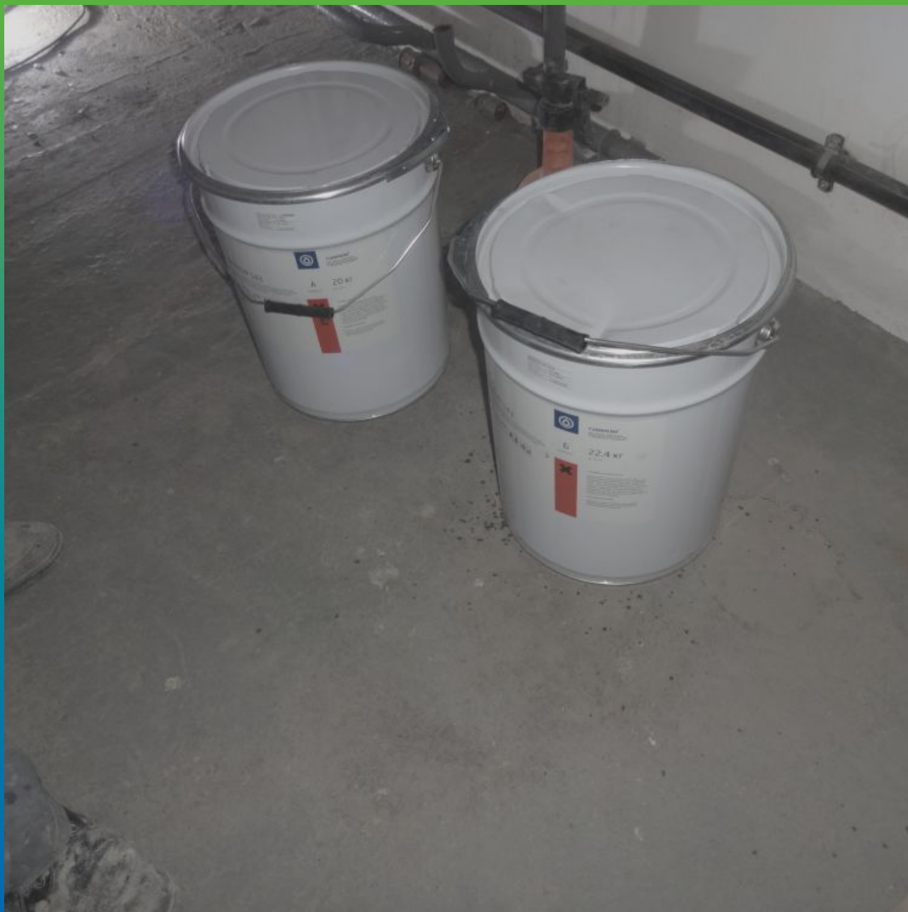
Материалы "Гидрозо" на объекте