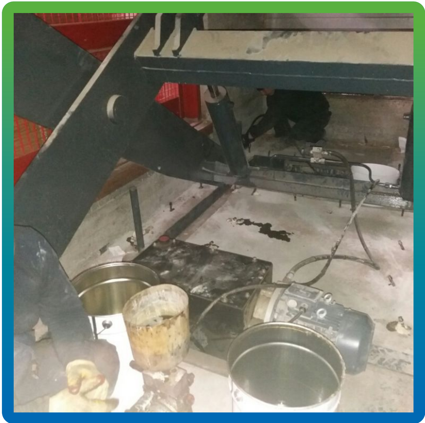
Устранение активных протечек гидроактивным ПУ Манопур 15