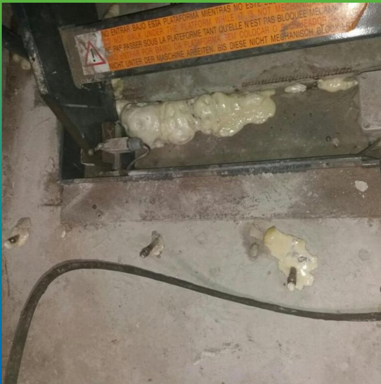
Устранение активных протечек гидроактивным ПУ Манопур 15