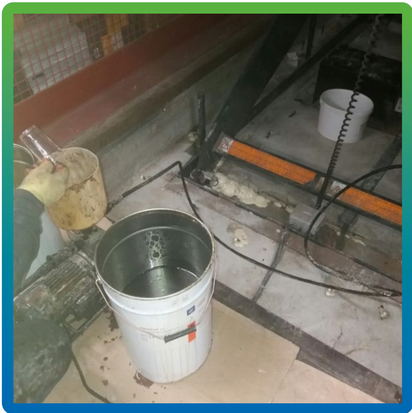
Затворение А+В гидроактивной пены Манопур 15