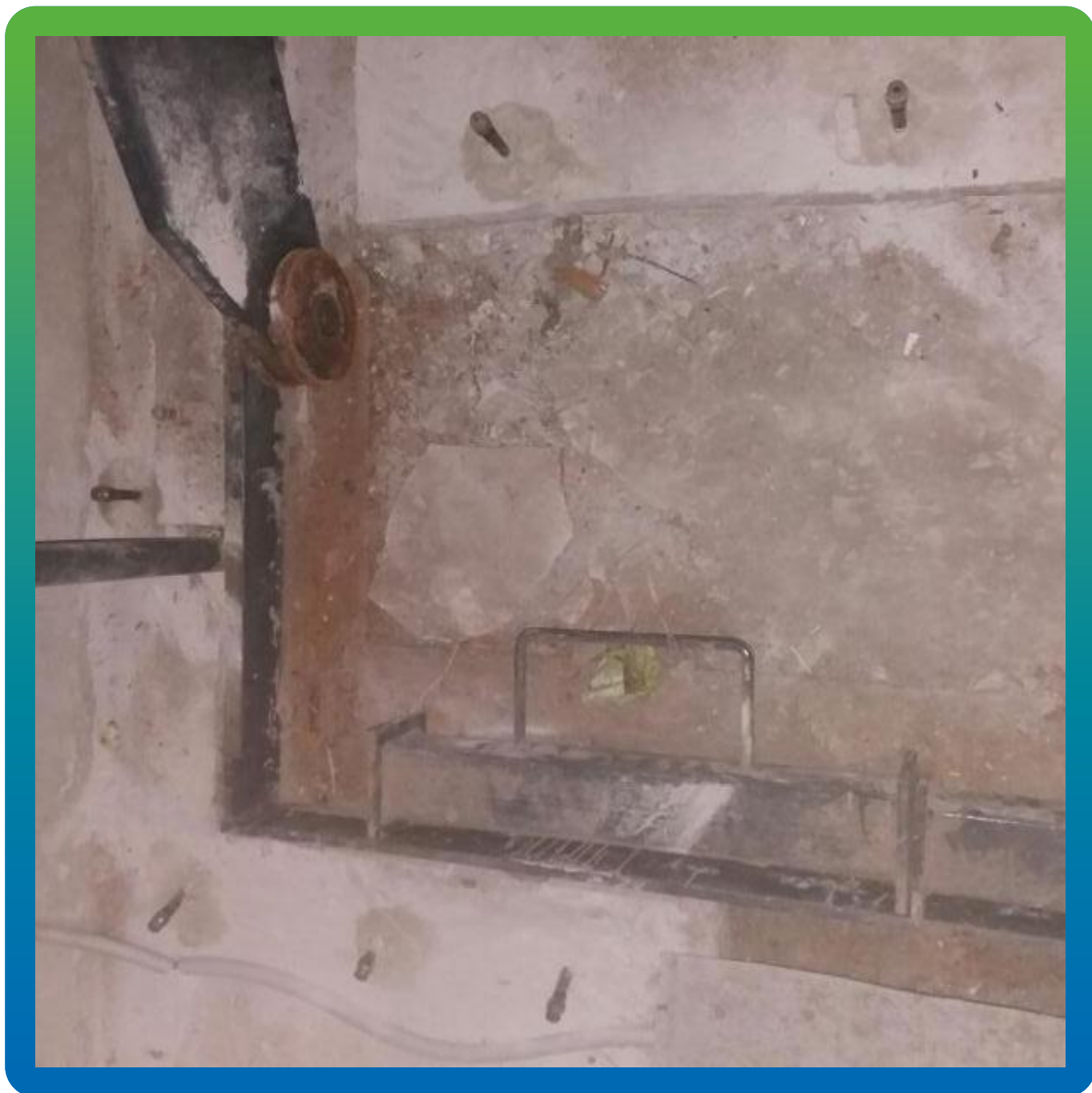
Устранение активных протечек гидроактивным ПУ Манопур 15