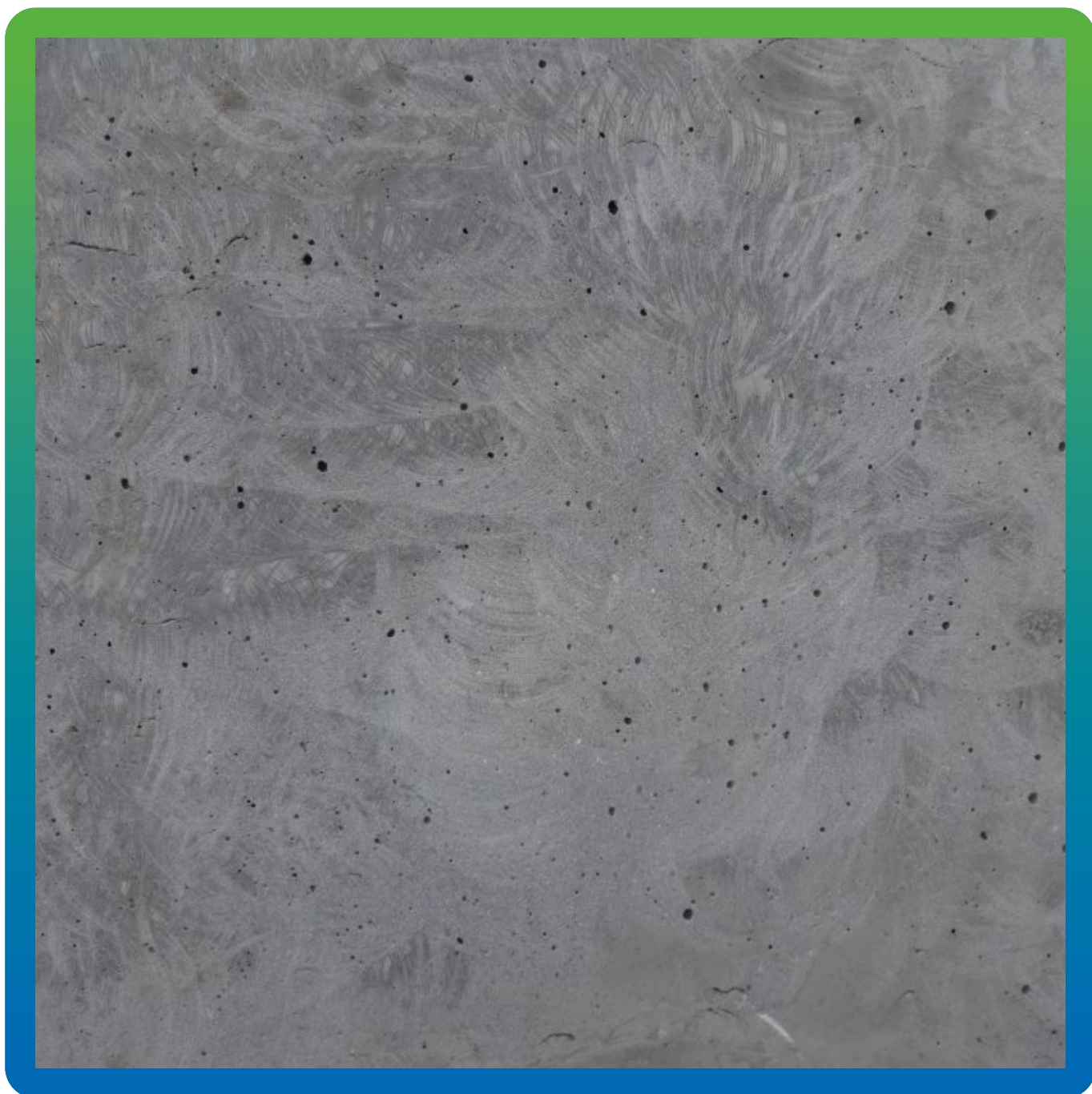
Подготовленная поверхность для нанесения Максил Флекс