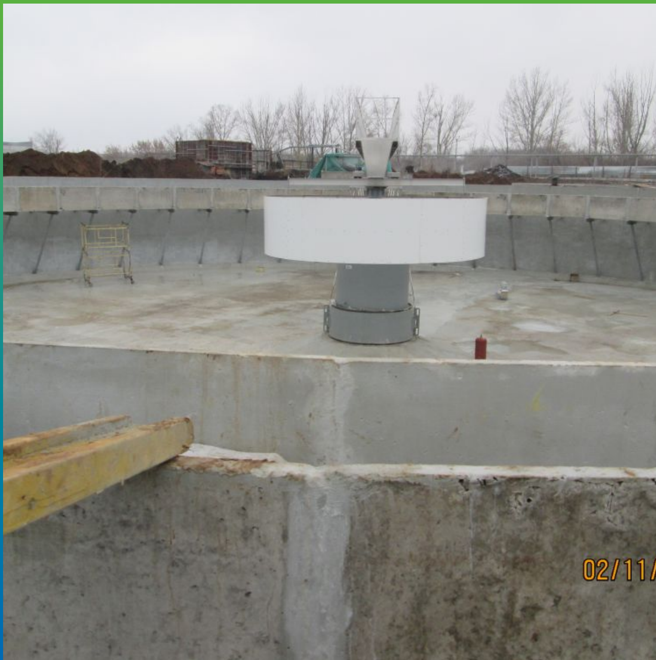
Резервуар с нанесенным на поверхность гидроизоляционным материалом Максил Флекс