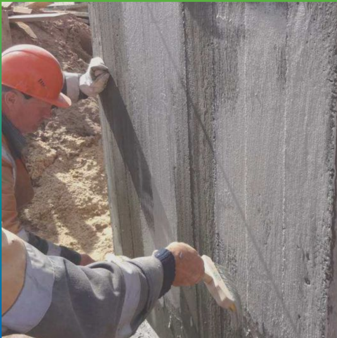
Нанесение Максил Флекс на подготовленную и увлажнённую поверхность