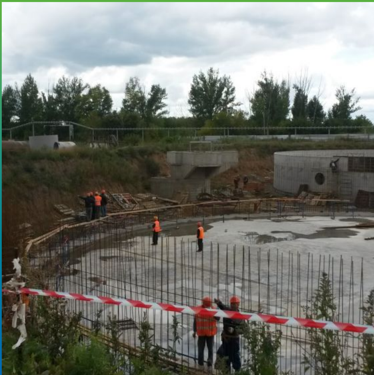
Процесс возведения конструкции