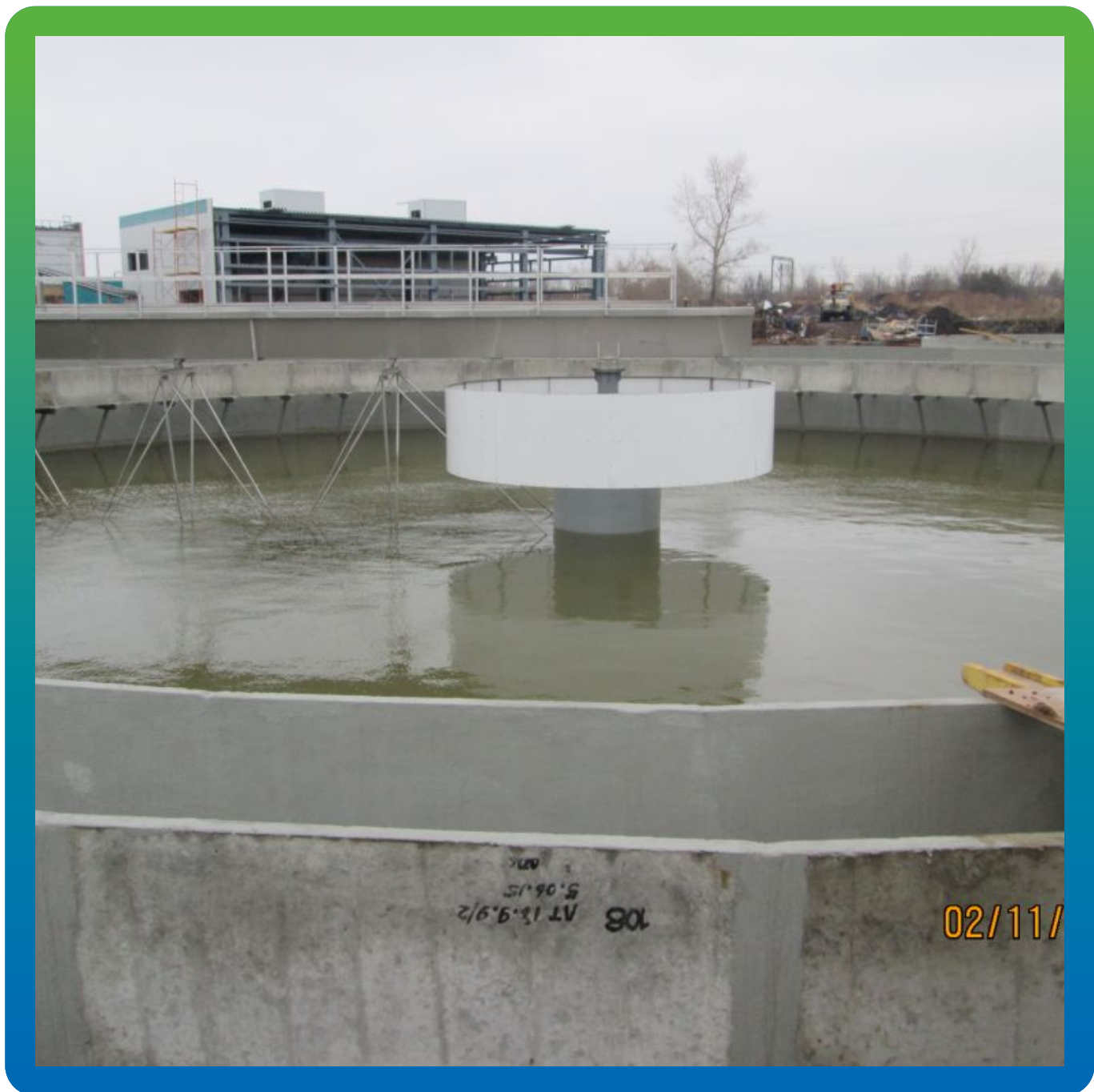
Успешно выполненные гидроиспытания на объекте