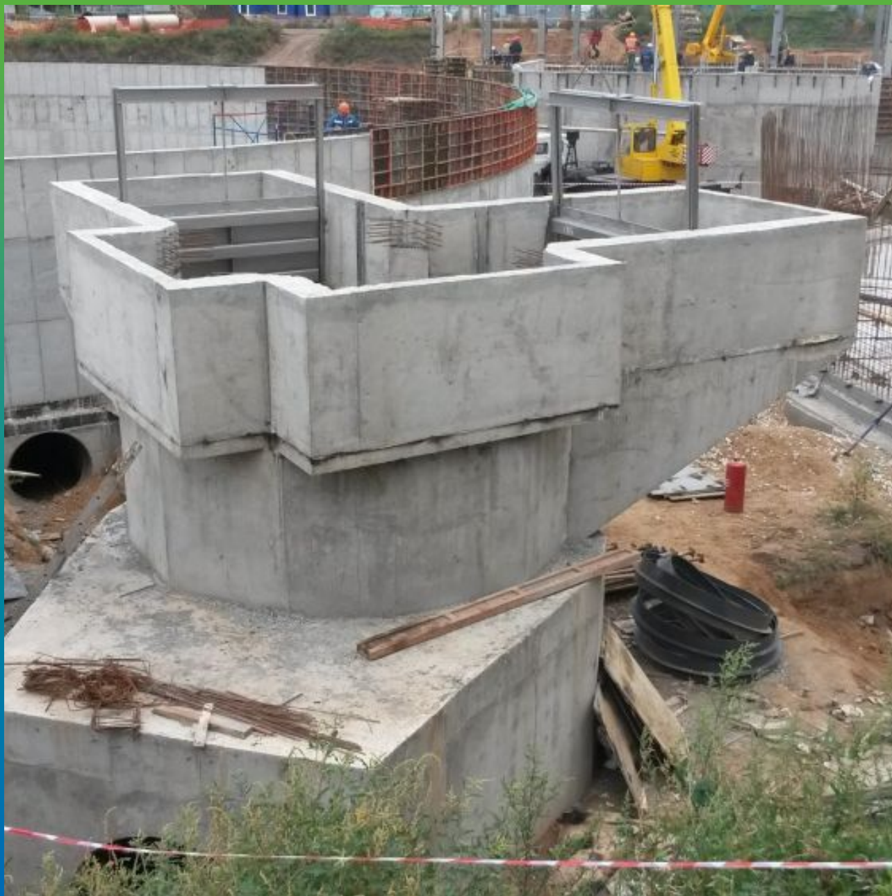
Процесс возведения конструкции