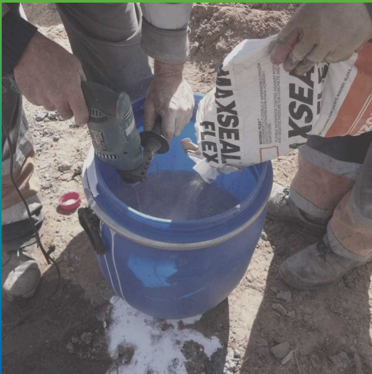
Затворение компонентов А+Б Макссил Флекс