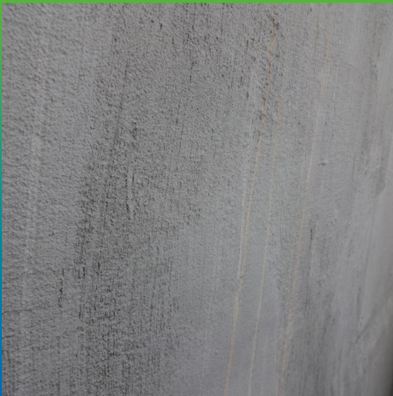
Резервуар с нанесенным на поверхность гидроизоляционным материалом Максил Флекс