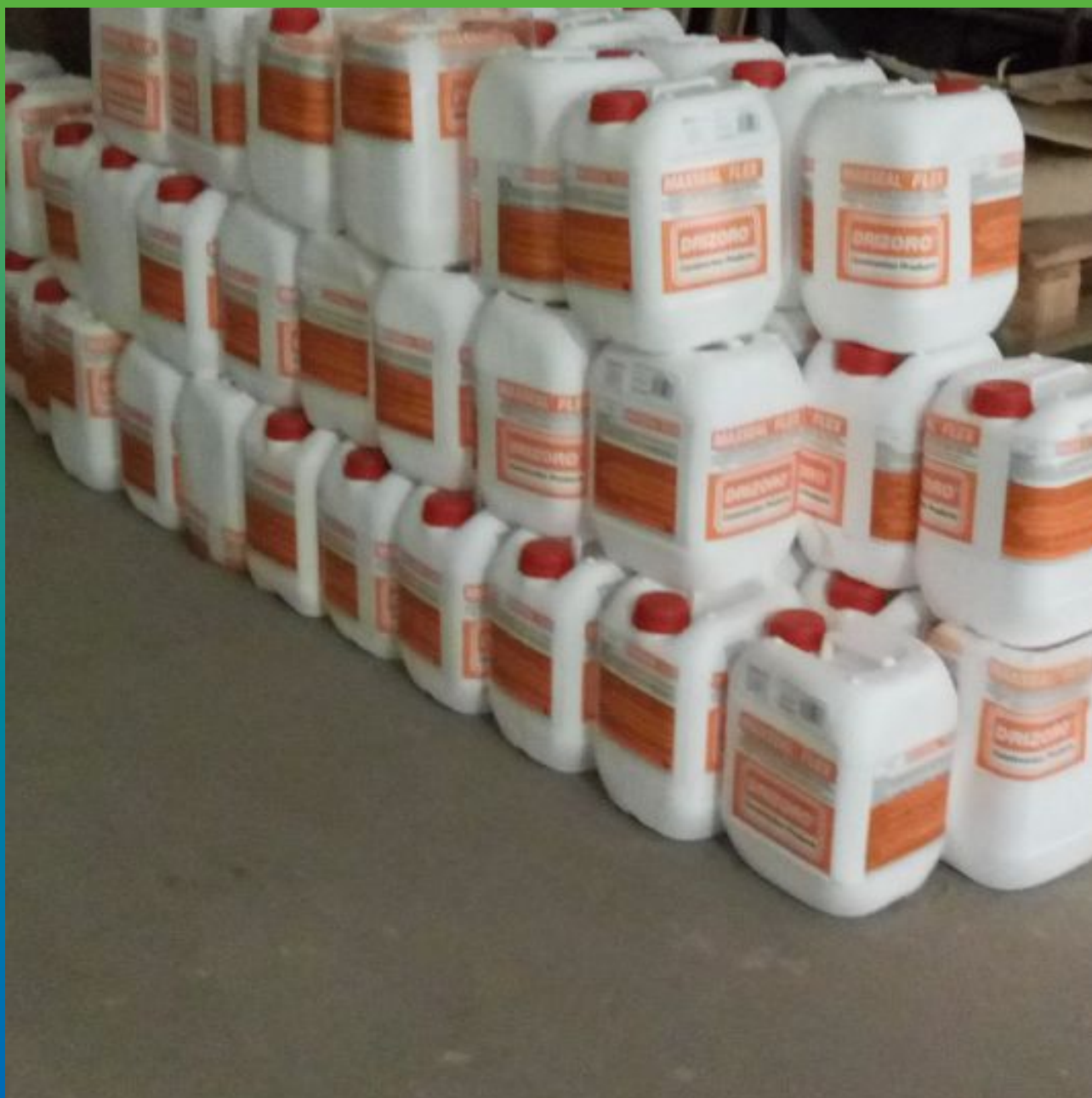
Материалы "Гидрозо" на объекте