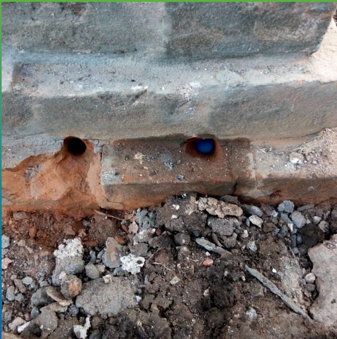
Заполнение шпуров материалом Максклир Инжекшн (Маноксан 150)