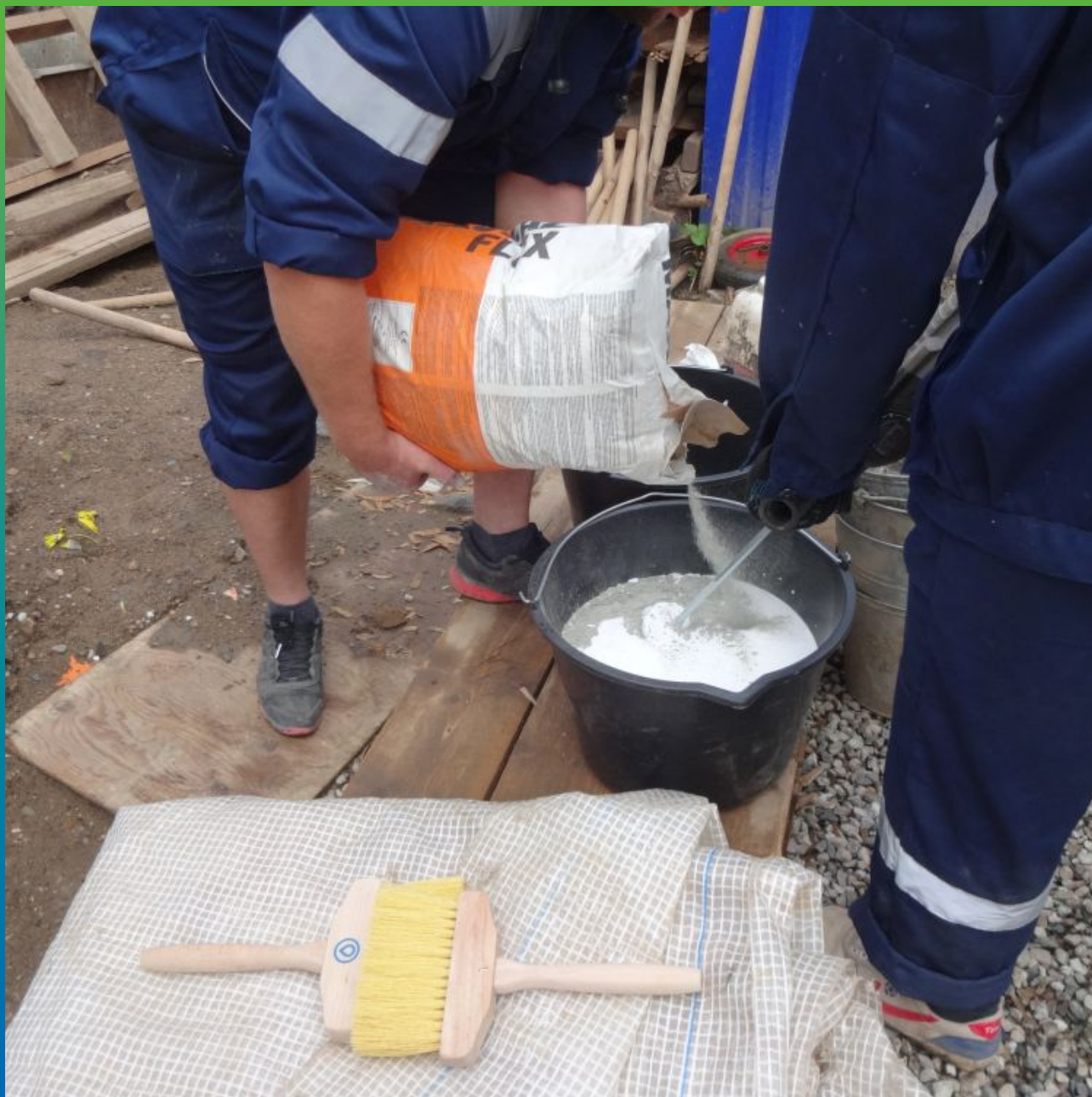
Затворение 2-х компонентов Максил Флекс на объекте