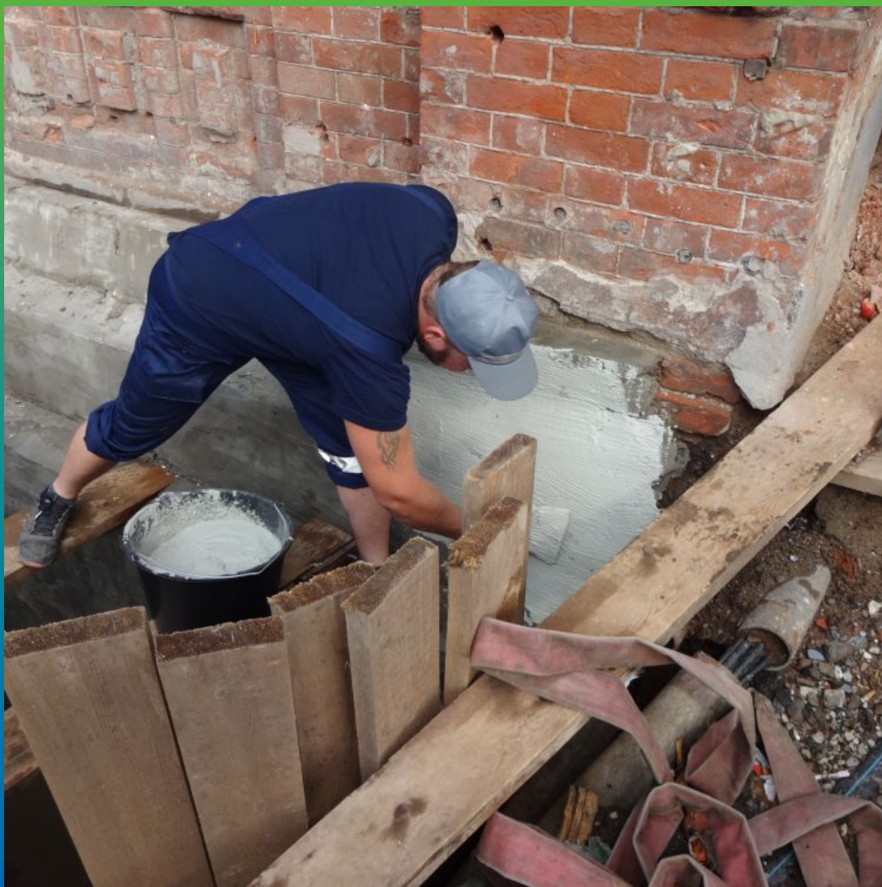
Нанесение Максил Флекс на поверхность