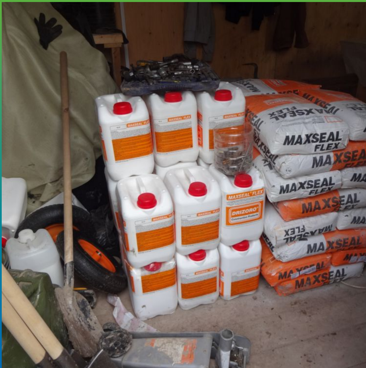
Материалы компании Гидрозо на объекте