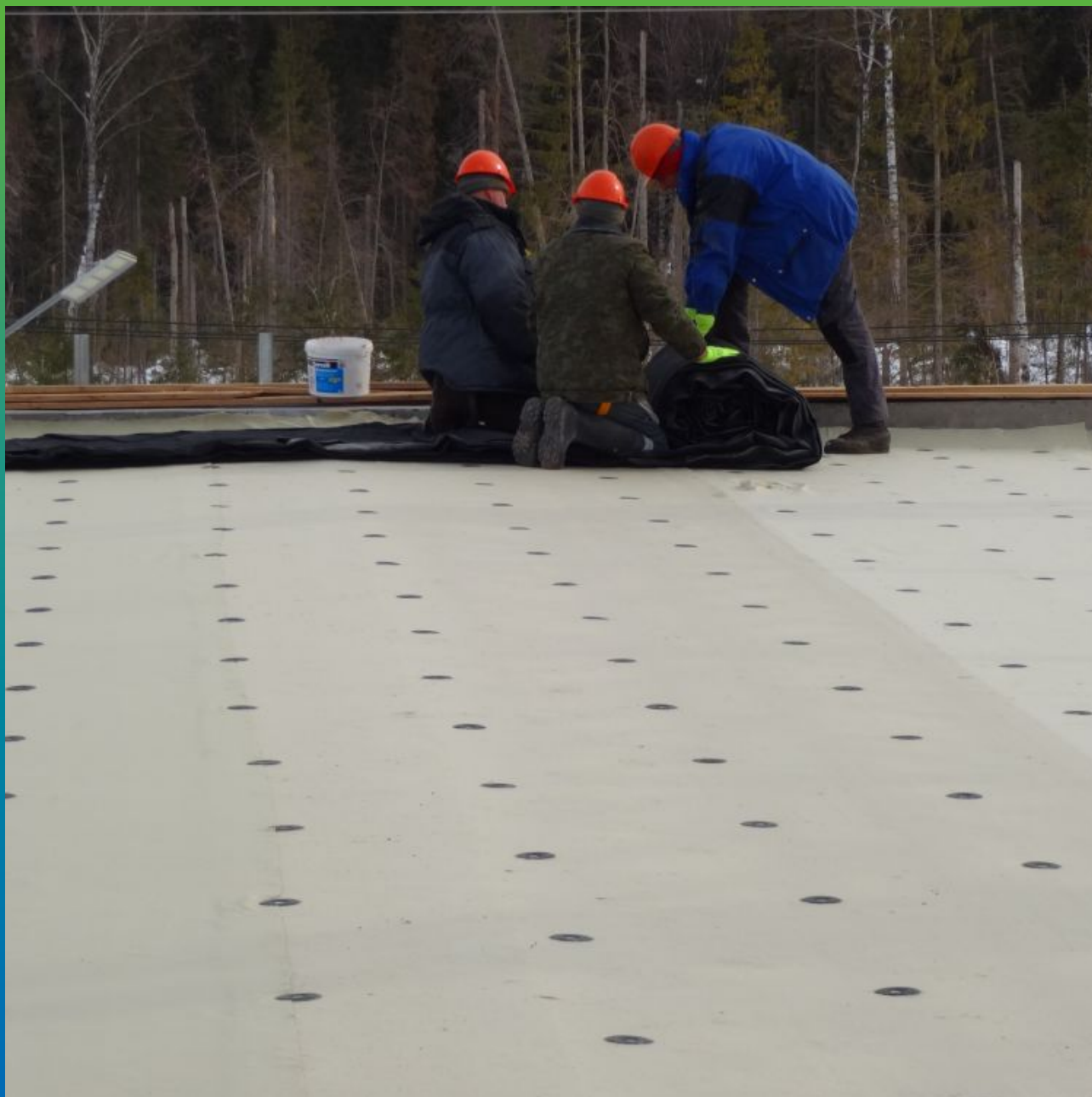
Увлажнение поверхности перед нанесением Максил Флекс