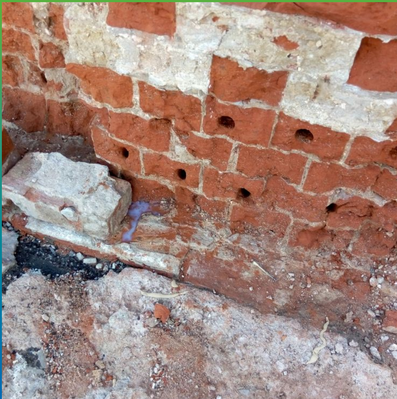
Заполнение шпуров материалом Максклир Инжекшн (Маноксан 150)