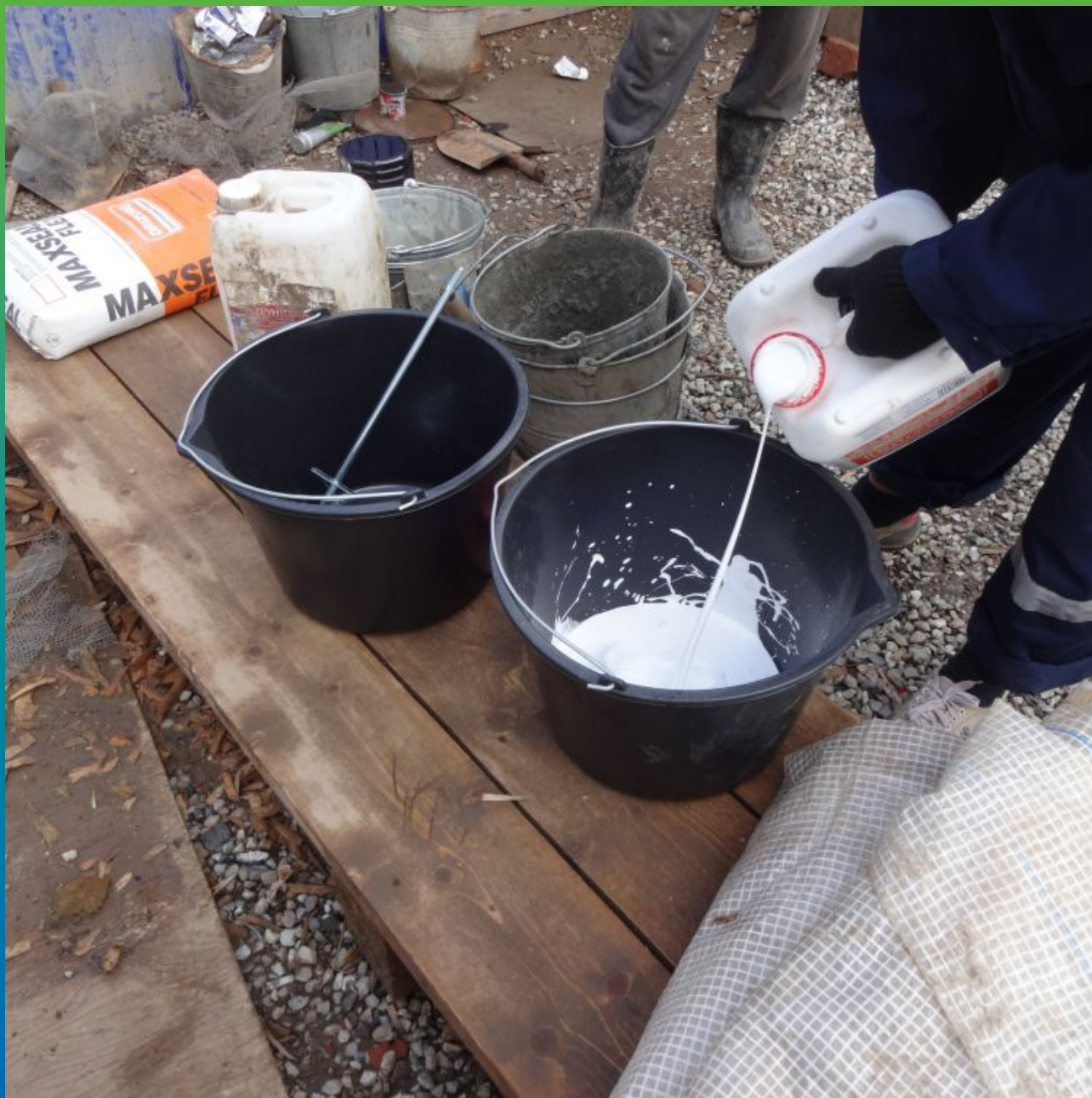
Затворение 2-х компонентов Макссил Флекс на объекте