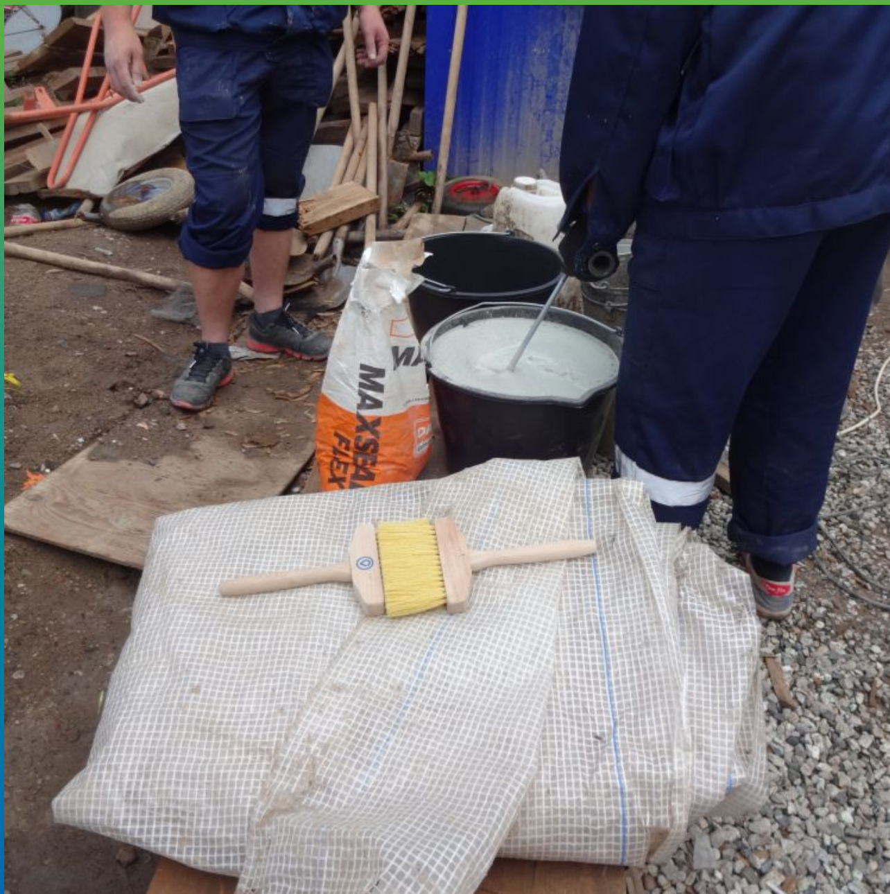
Затворение 2-х компонентов Макссил Флекс на объекте