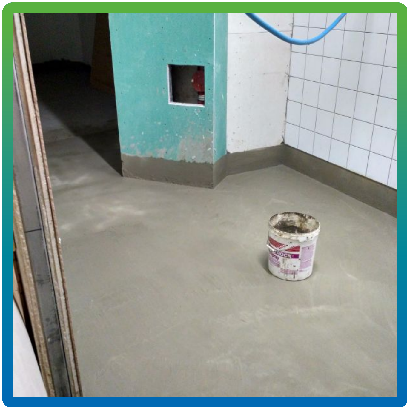
После нанесения Максил Супер