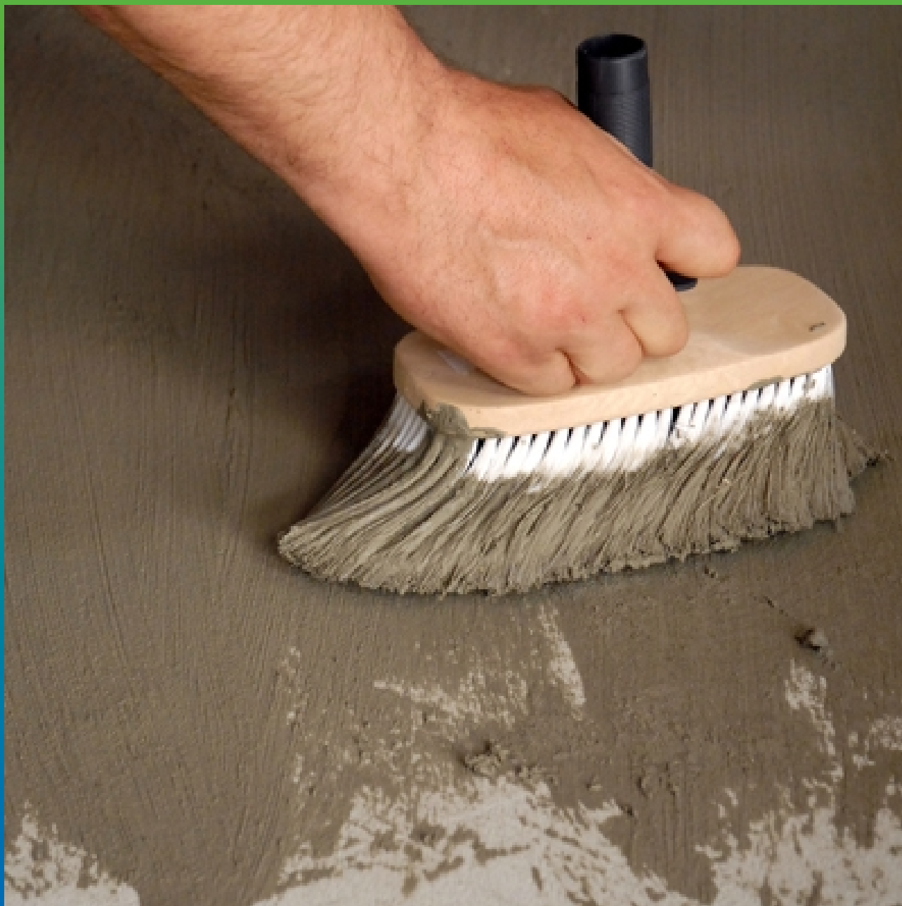
Нанесение Макссил Супер