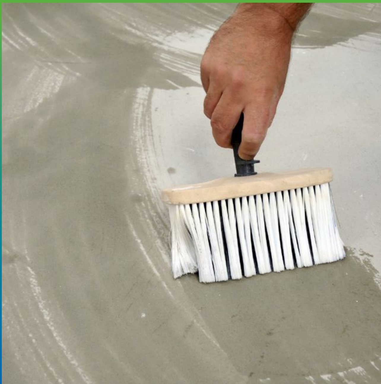
Увлажнение перед нанесением Максил Супер