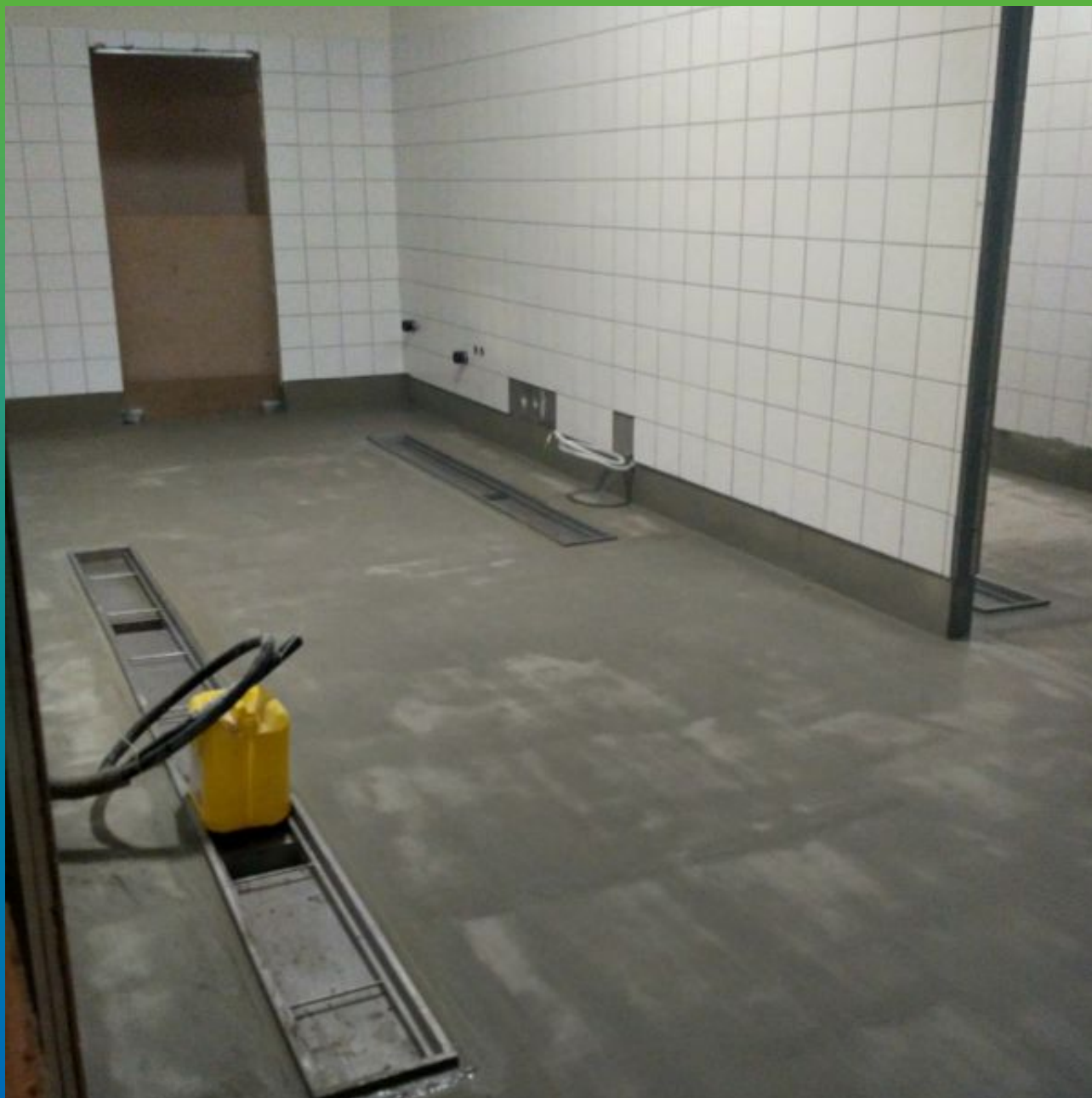
После нанесения Максил Супер