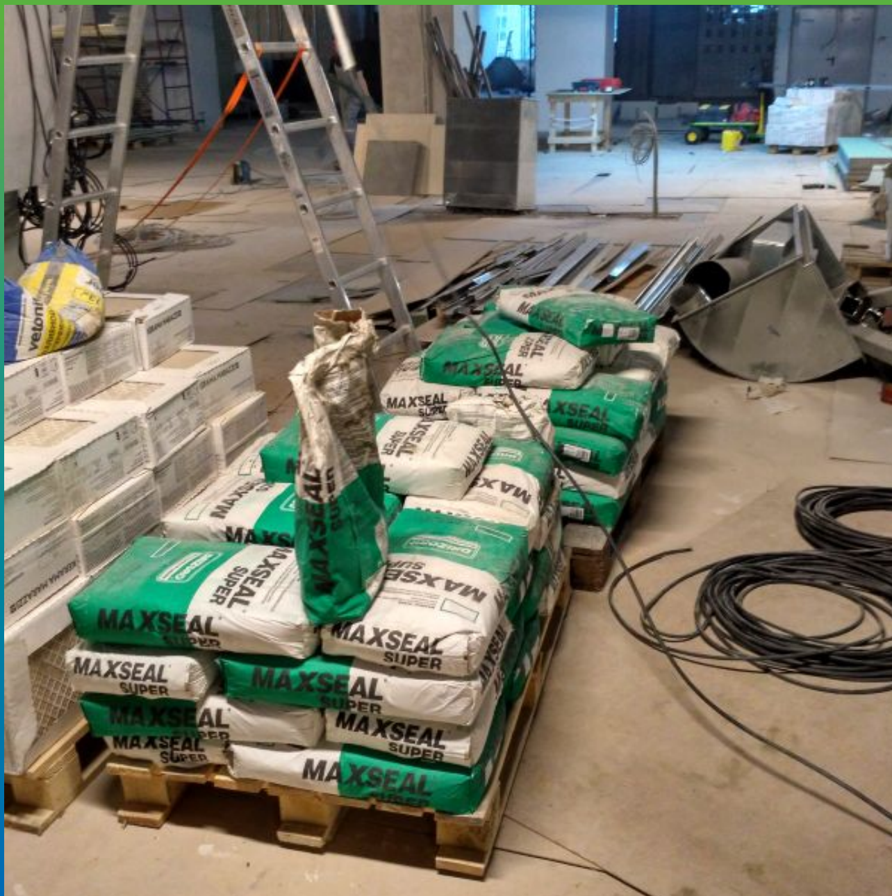
Хранение материала на объекте