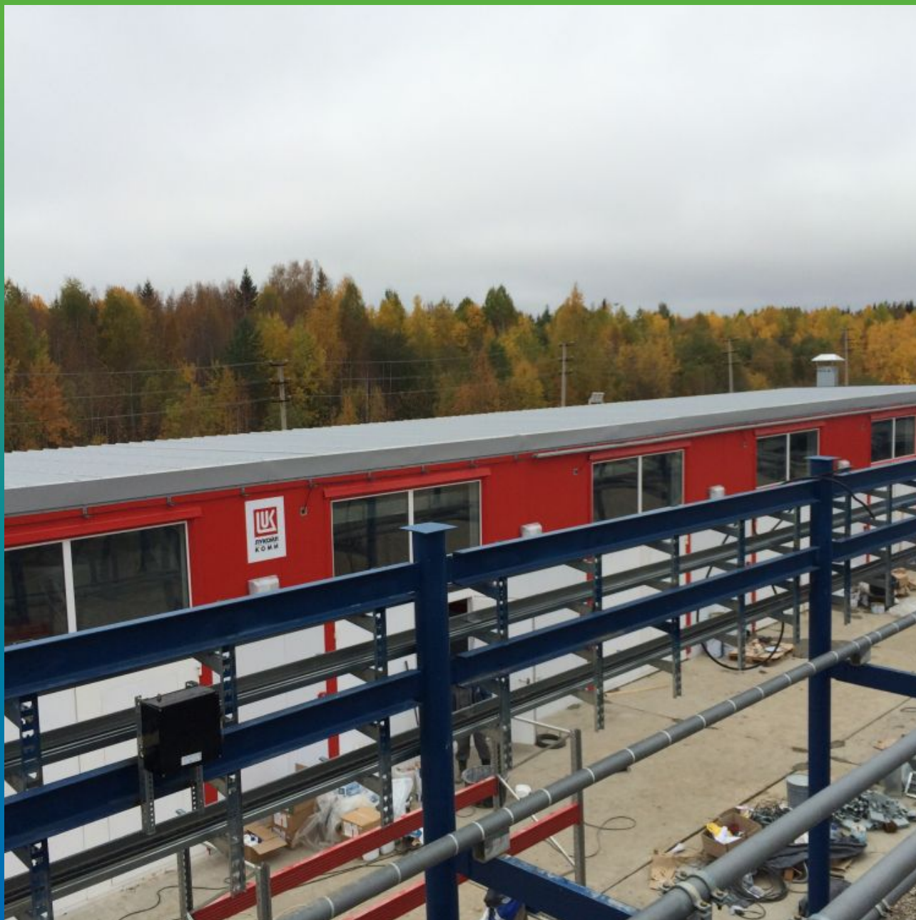
Общий вид теплого склада