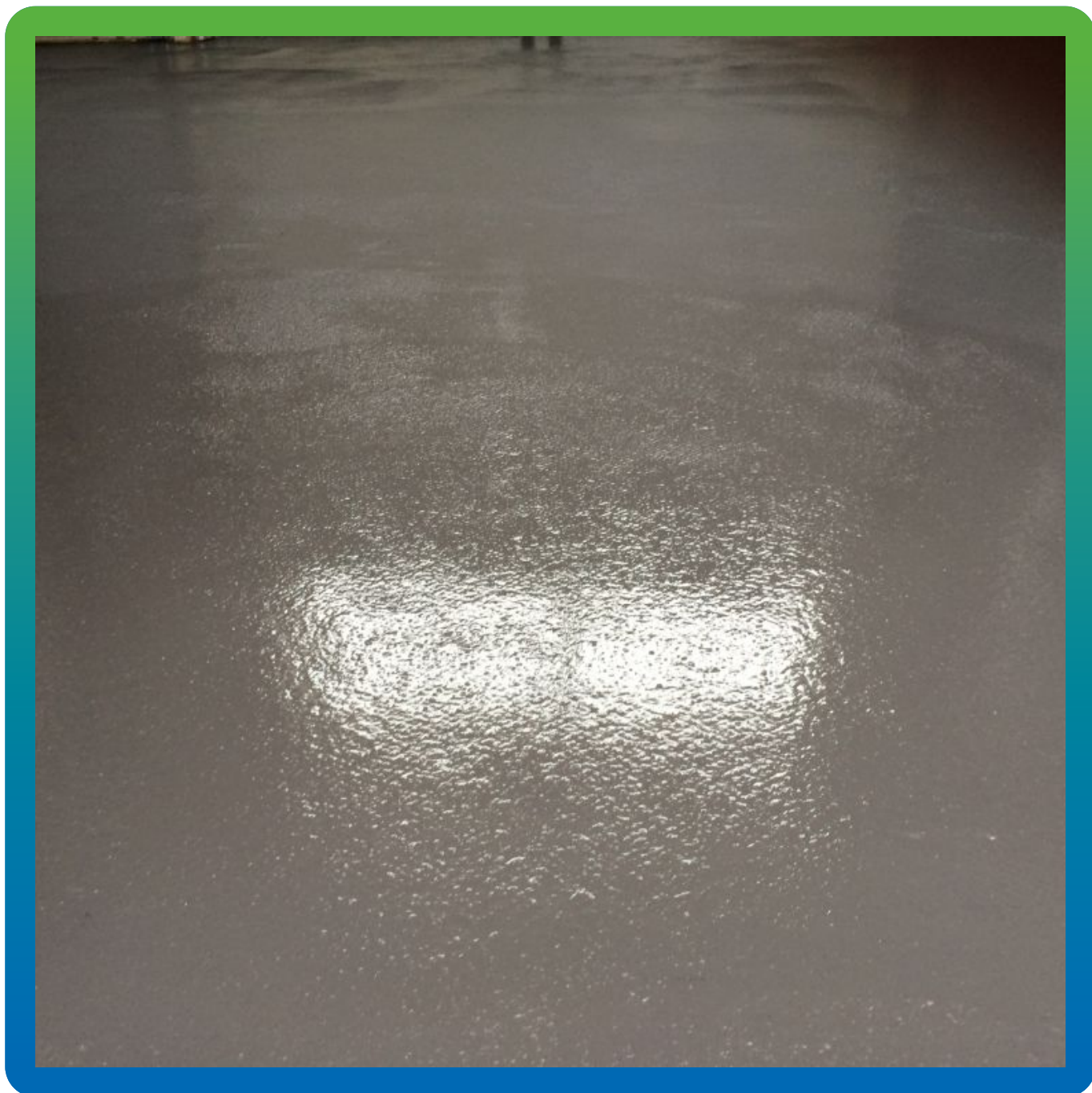
Вид свежеложенного материала Денстоп ПМ 605 Тровелл