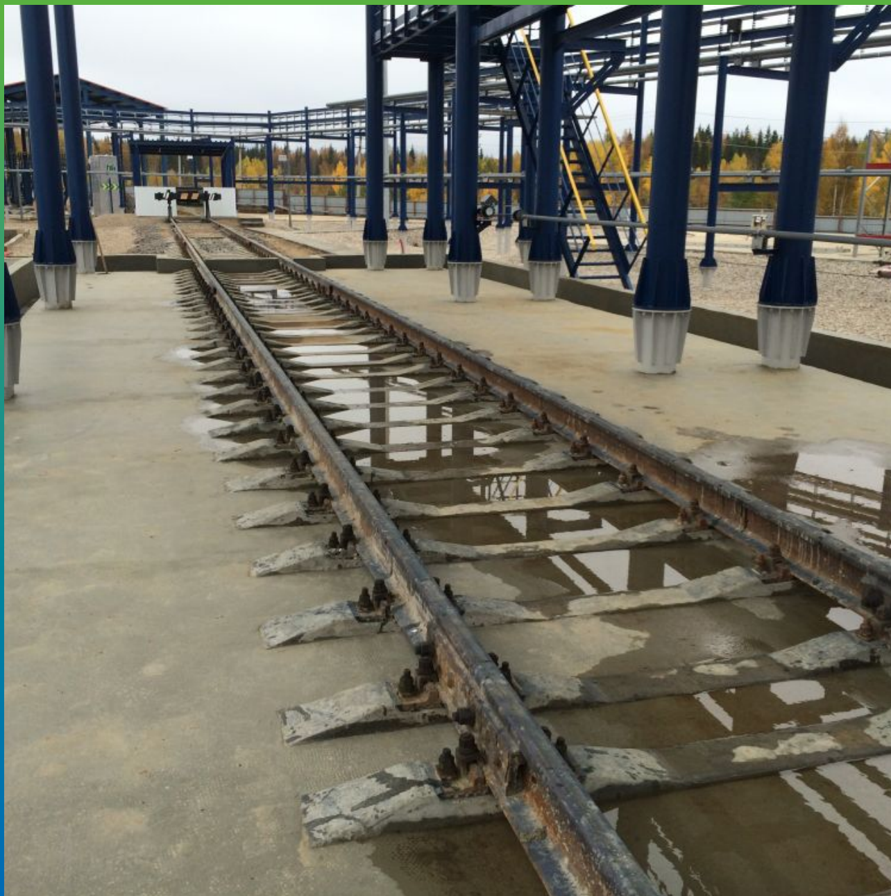
Финишный вид покрытия Денстоп ПМ 605 Тровел на сливной эстакаде