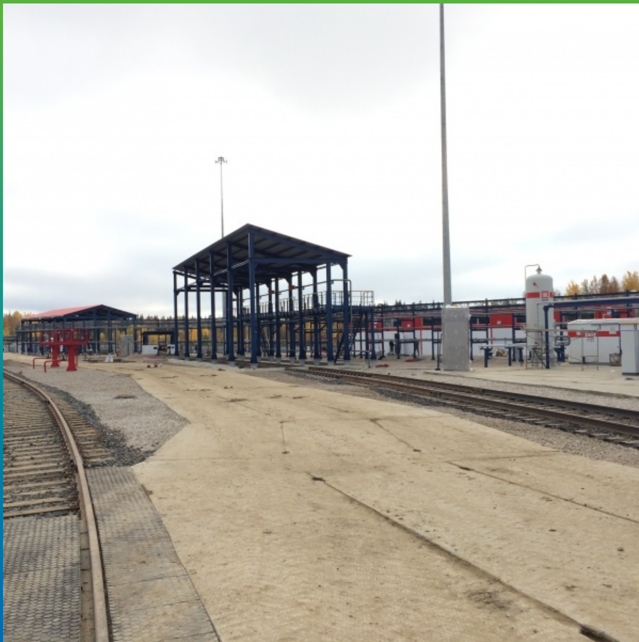
СЛИВНАЯ ЭСТАКАДА ХИМРЕАГЕНТОВ И ПЛОЩАДКА ХРАНЕНИЯ НА УПТК "ЛУКОЙЛ- КОМИ"