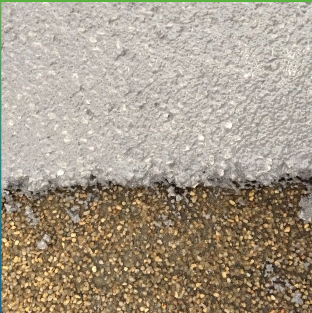
Укладка материала Денстоп ПМ 605 Тровелл слоем 6 мм