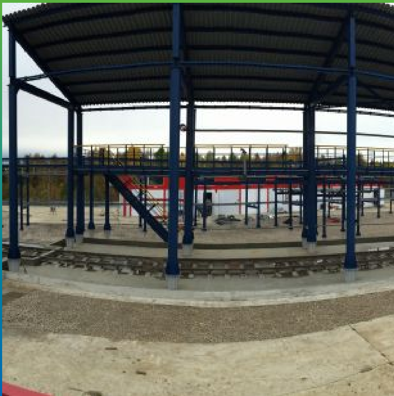
Завершенные сливная и розливная эстакады химреагентов