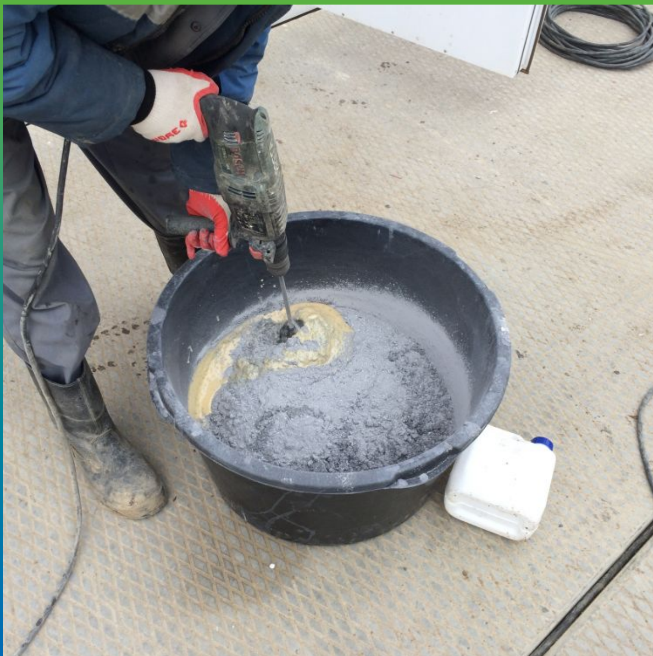
Приготовление цементно-полиуретанового покрытия Денстоп ПМ 605 Тровелл (введение сухой смеси)