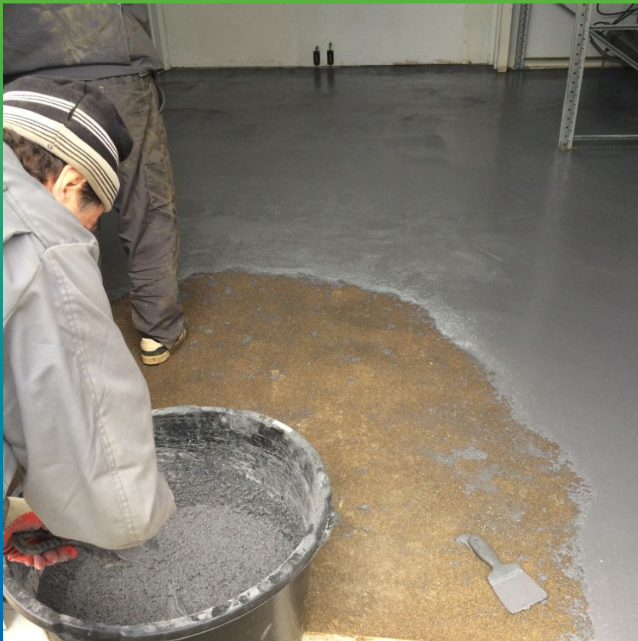
Укладка материала Денстоп ПМ 605 Тровелл в помещениях теплого склада