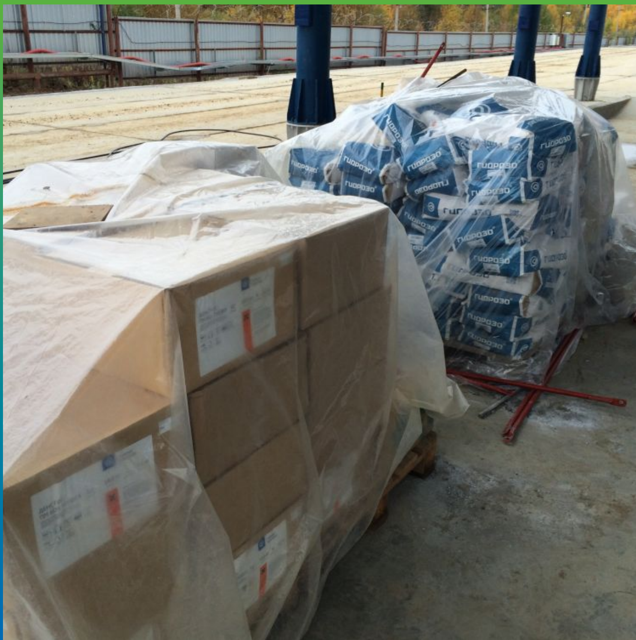
Материал Денстоп ПМ 605 Тровелл на объекте