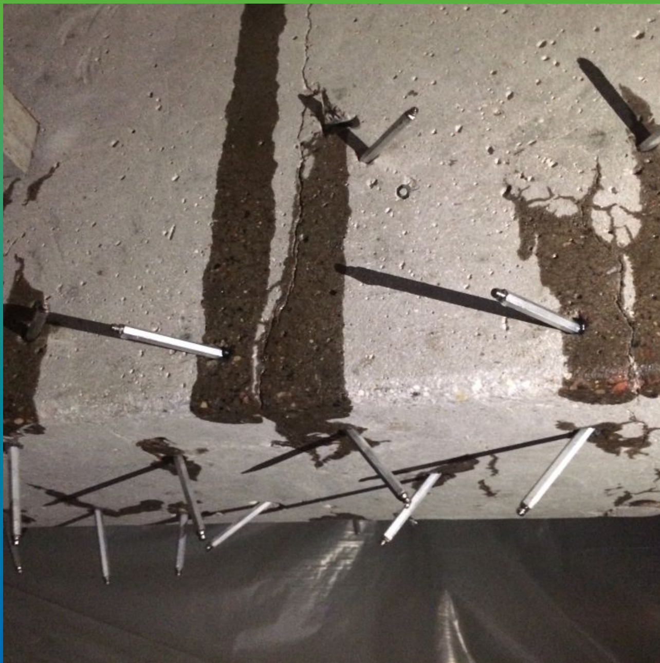
Инъектирование сухих трещин в балке эпоксидной смолой Манопокс 352 ЛВ