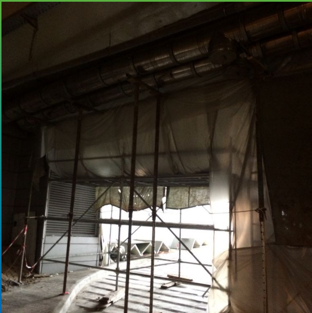
Общий вид балки во время проведения работ