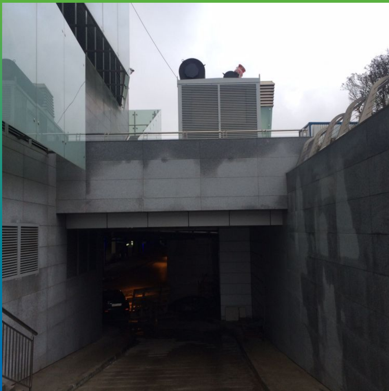
Вид объекта после выполнения всех работ по усилению