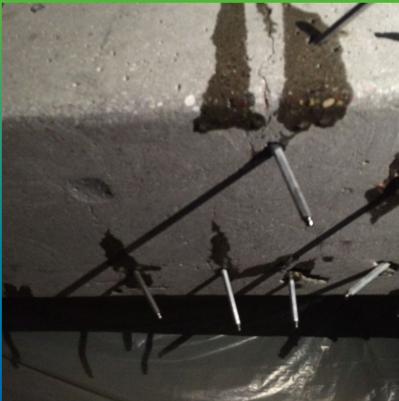
Инъектирование сухих трещин в балке эпоксидной смолой Манопокс 352 ЛВ