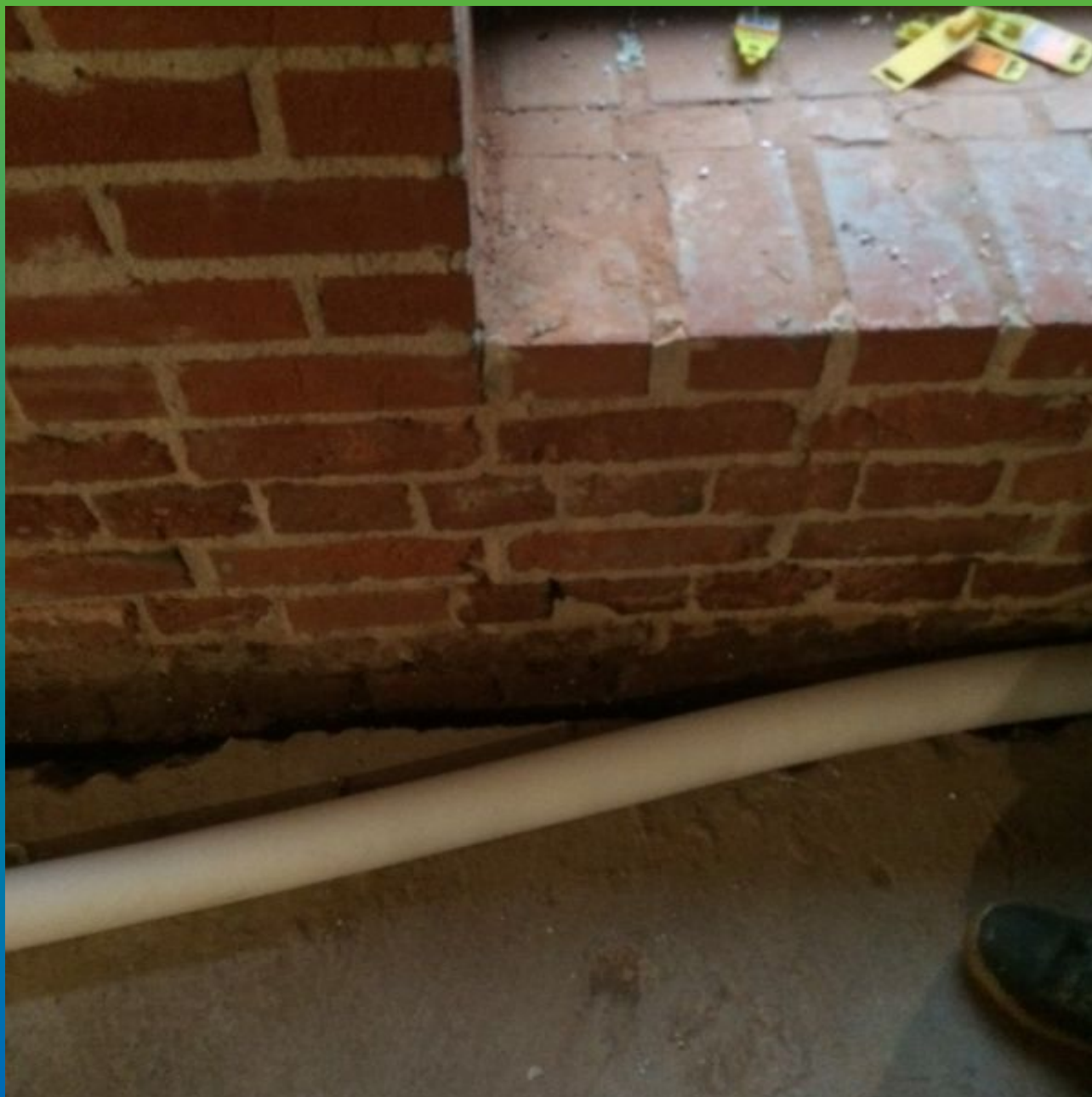
Устройство камеры в деформационном шве с помощью Вилатерма