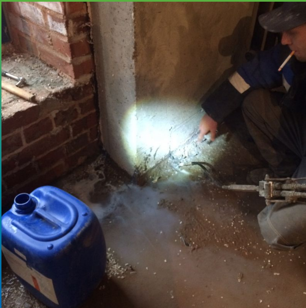
Инъектирование деформационного шва акрилатным гелем Манокрил гель В с пластификатором Манокрил Флекс