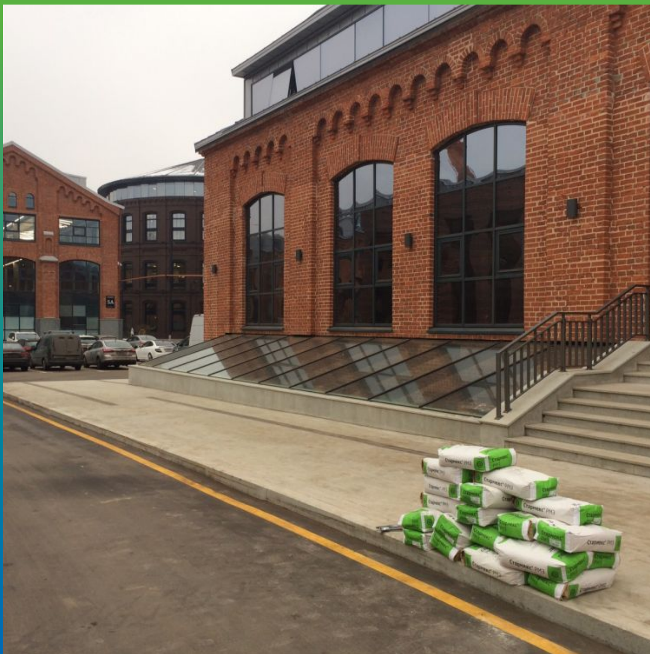
Ремонтный состав Стармекс PM3 на объекте