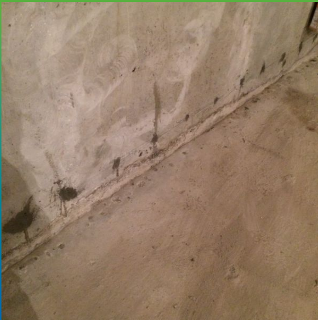
Вид сухого шва с заделанными отверстиями от шпуров