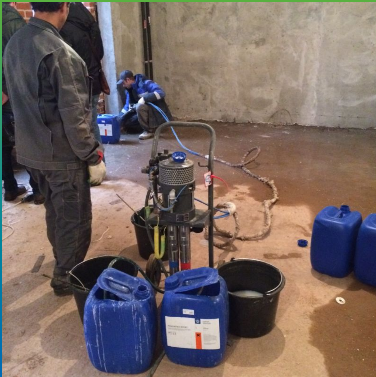
Инъектирование деформационного шва акрилатным гелем Манокрил гель В с пластификатором Манокрил Флекс