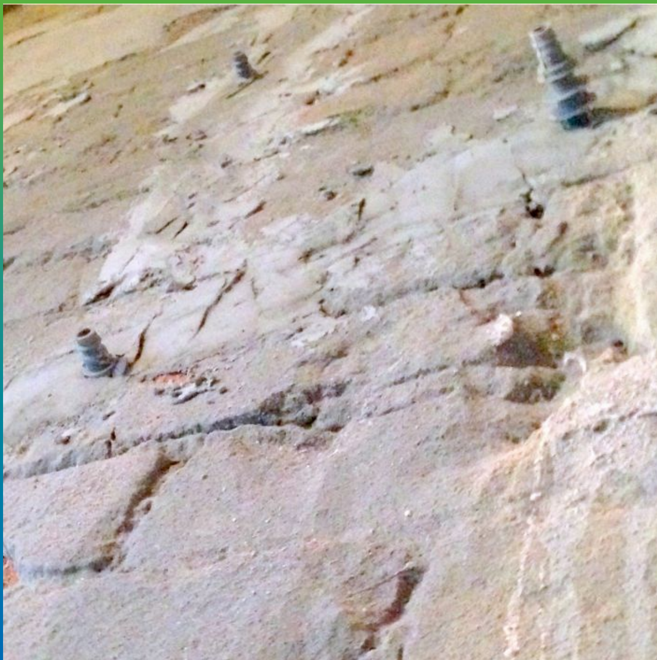
Установка инъекционных пакеров