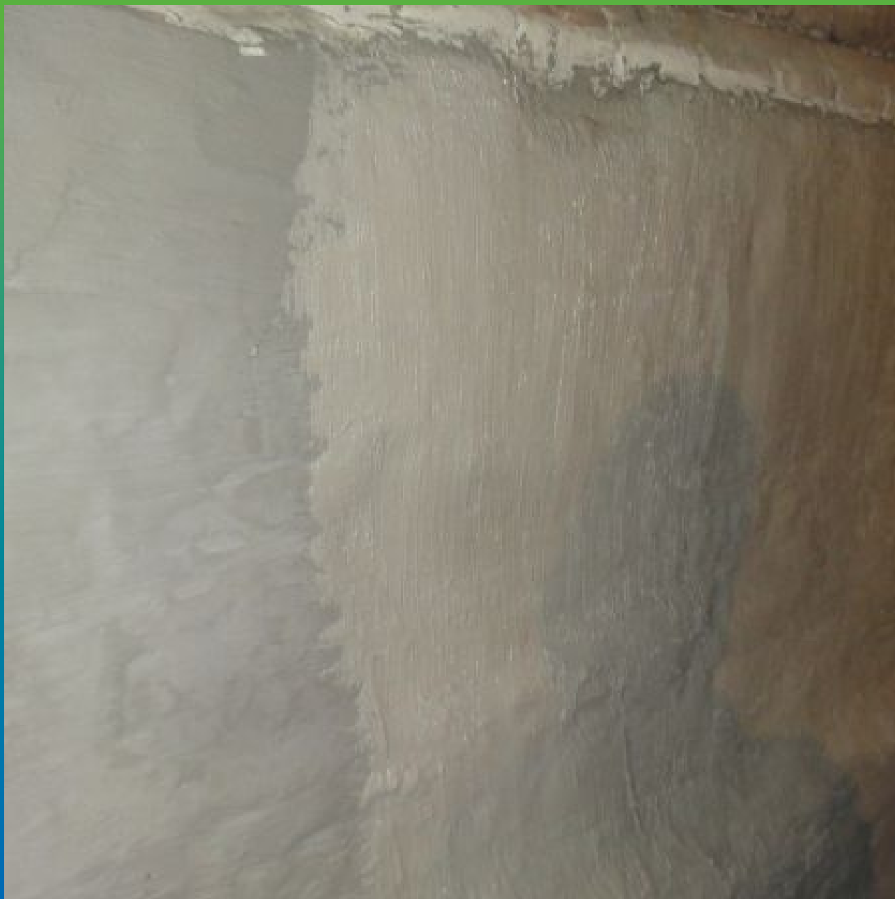
Нанесение эластичного гидроизоляционного покрытия Стармекс Сил Флекс