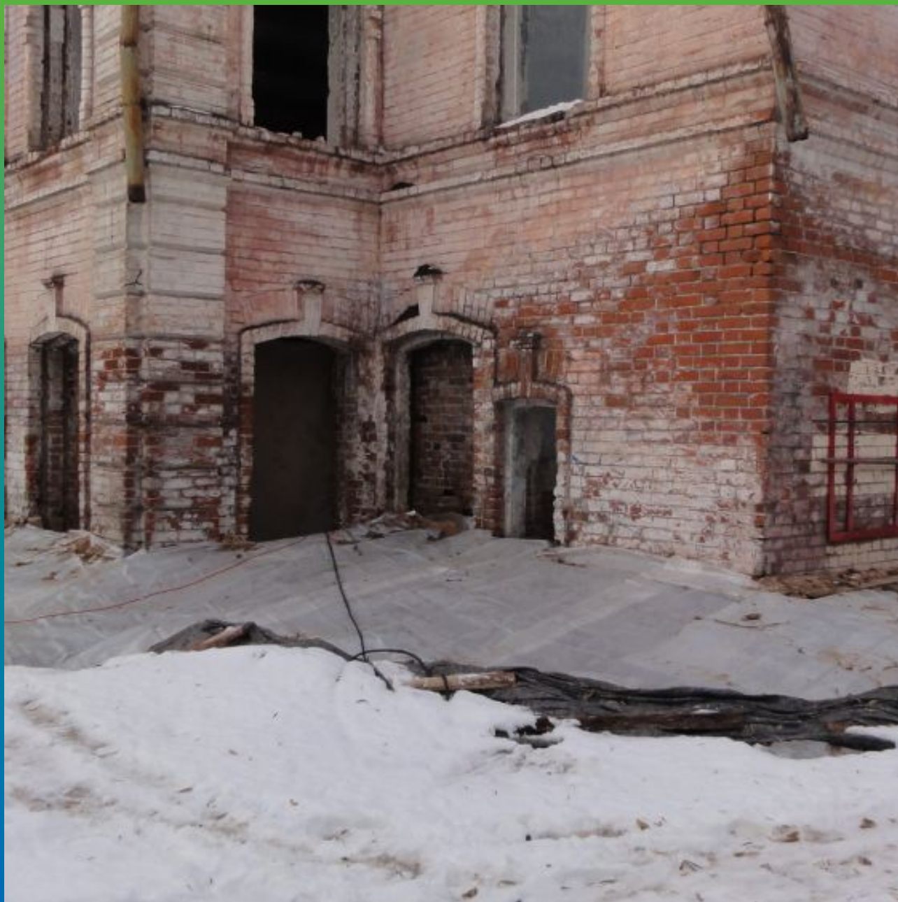
Вид смонтированного тепляка