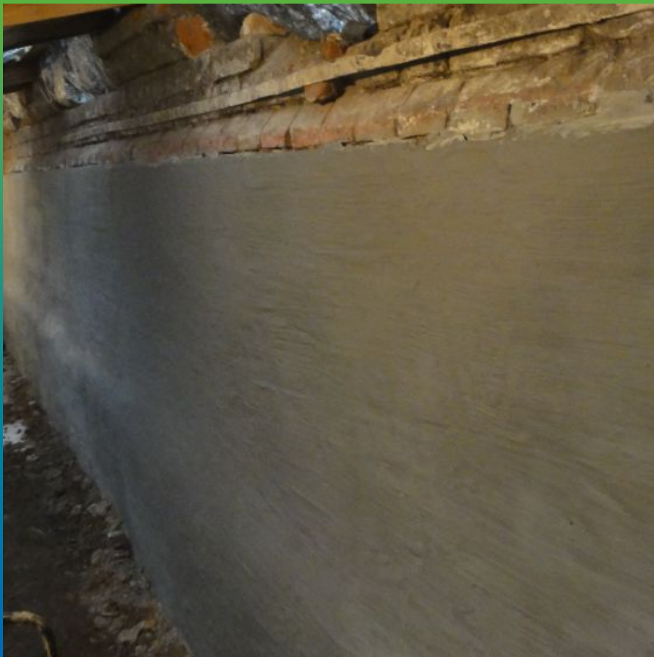
Финальный вид поверхности