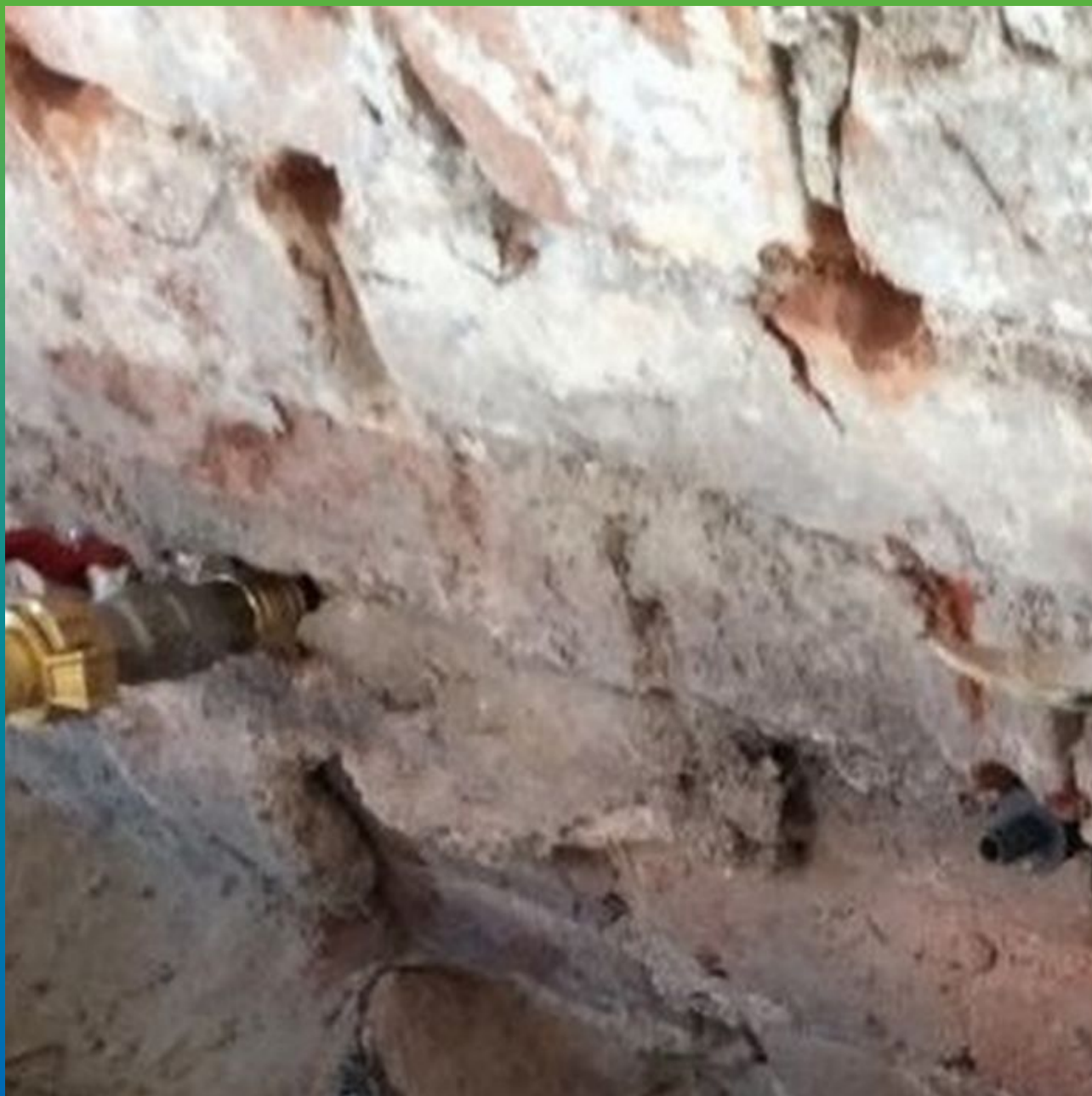
Инъектирование кирпичной кладки с помощью Маноцем Гроут