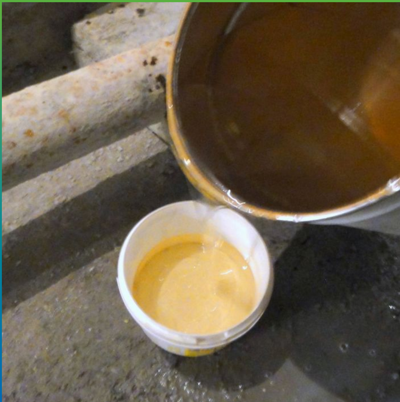
Подготовка состава Манопур С