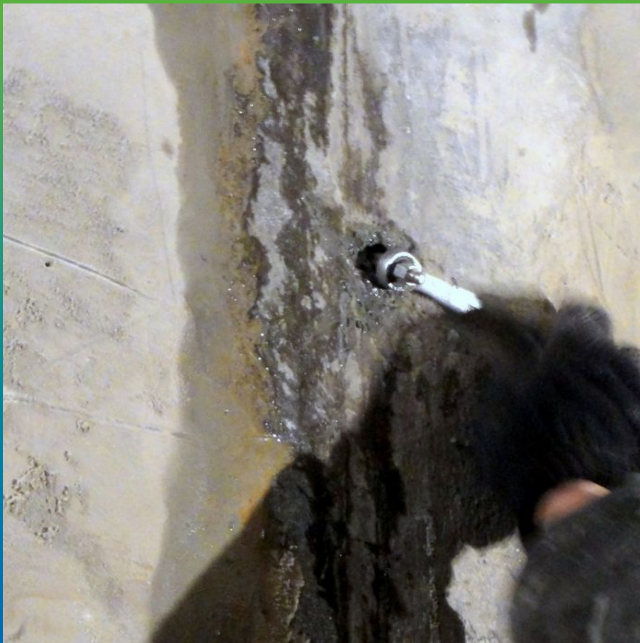
Установка пакеров БМ 1100