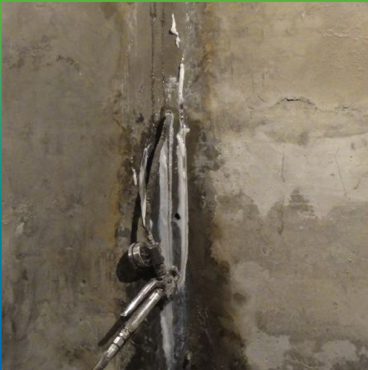
Инъектирование гидроактивным полиуретановым составом Манопур С