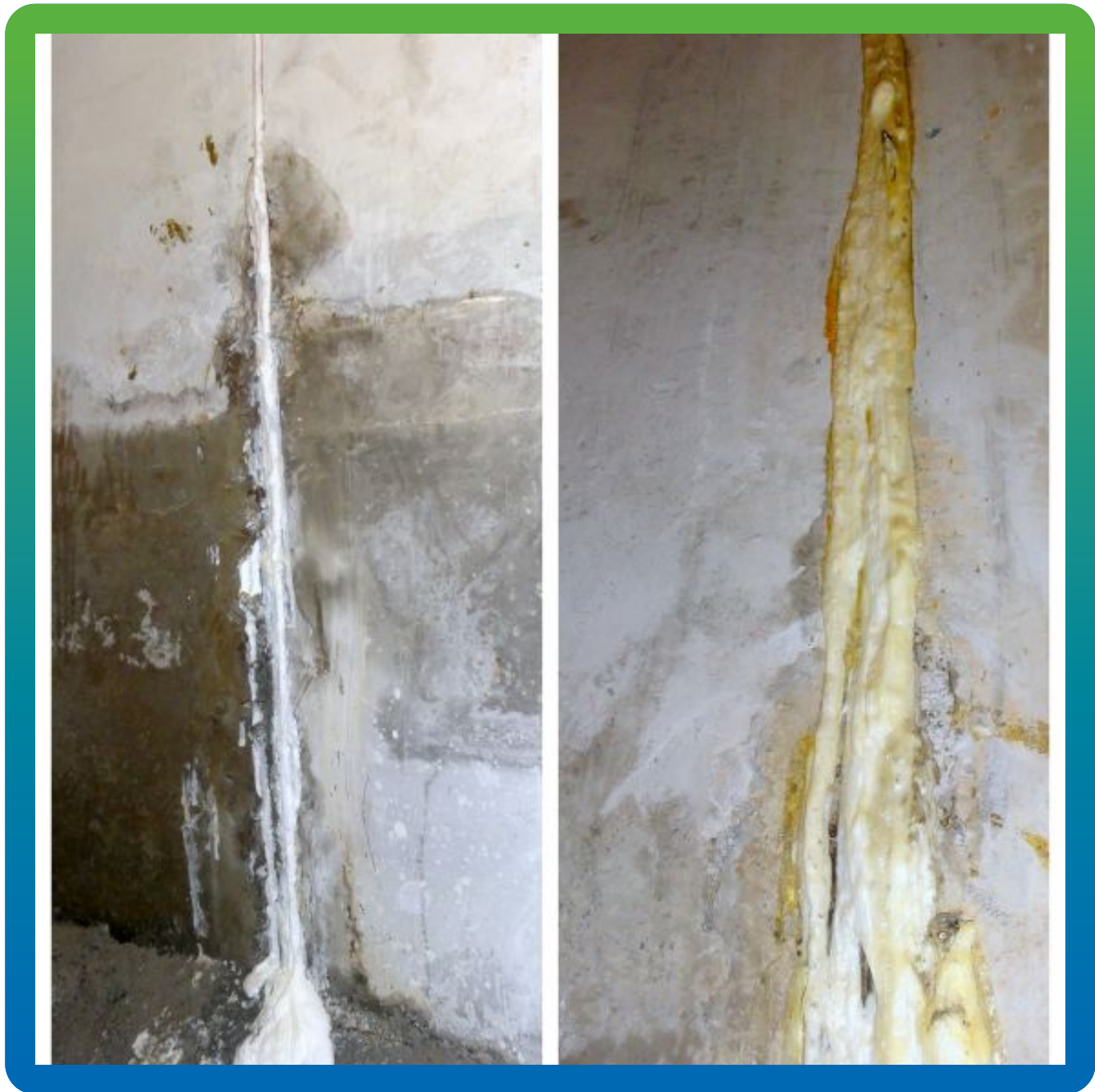
Вид прокачанных проблемных участков