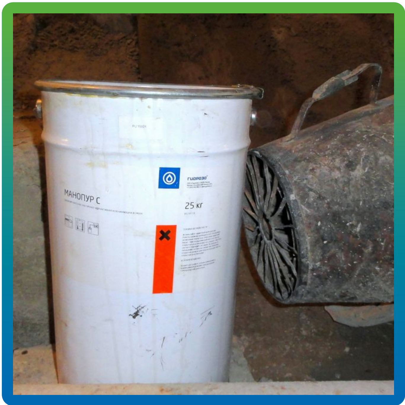
Подготовка состава Манопур С