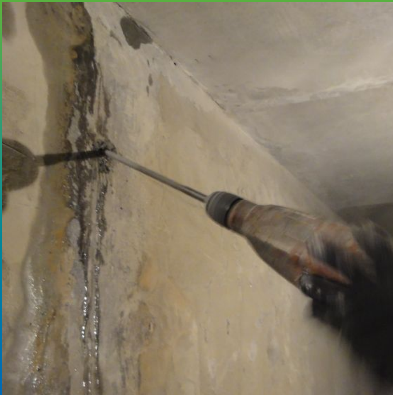
Устройство шпуров для инъектирования