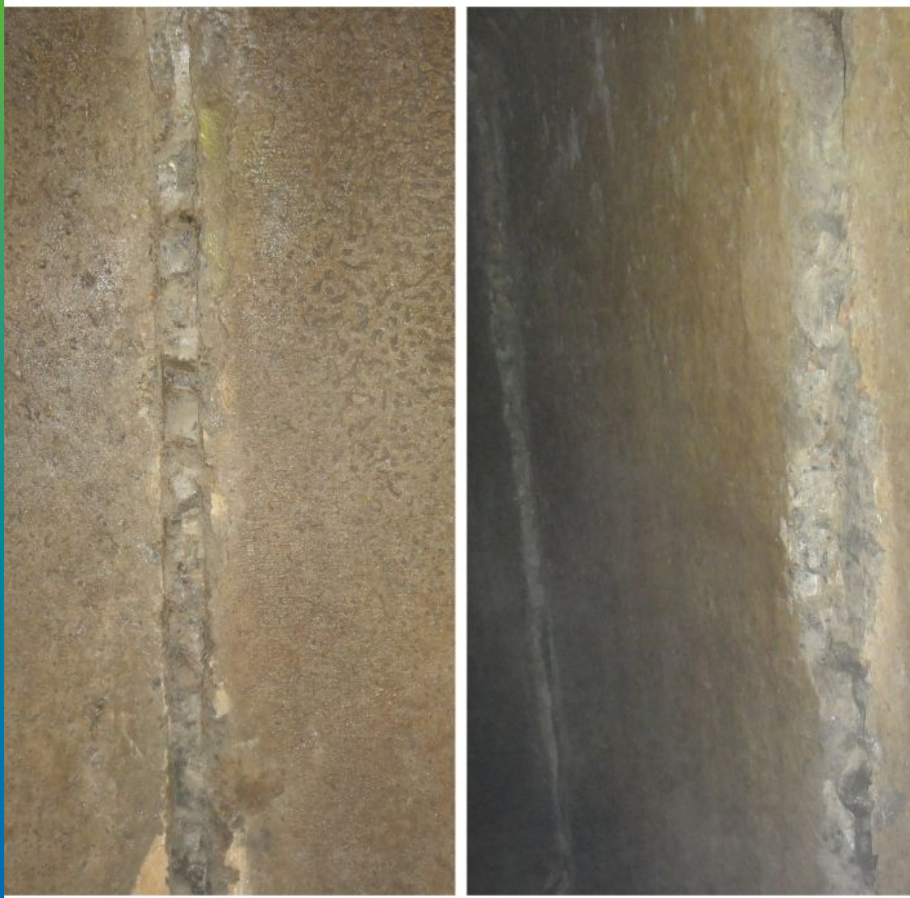
Вид расшитых, подготовленных к ремонту швов