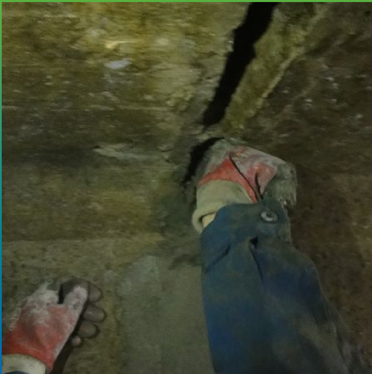
Заделка/чеканка швов с помощью Стармекс РМЗ