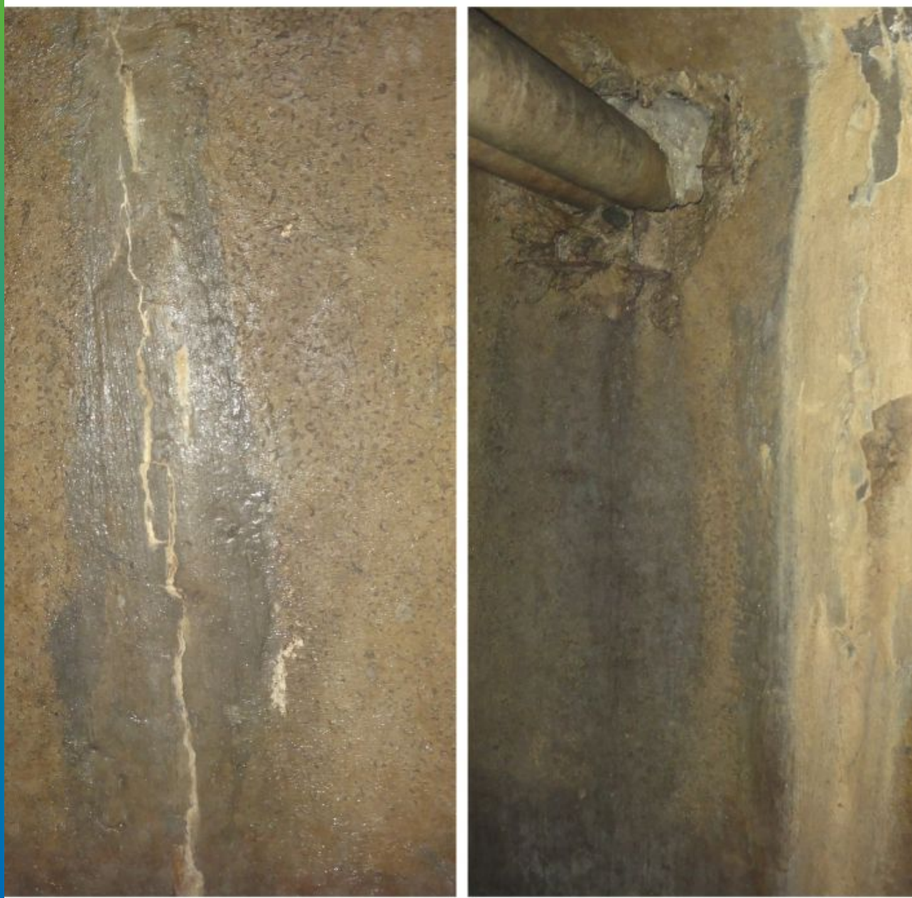
Первоначальный вид швов железобетонных тубингов