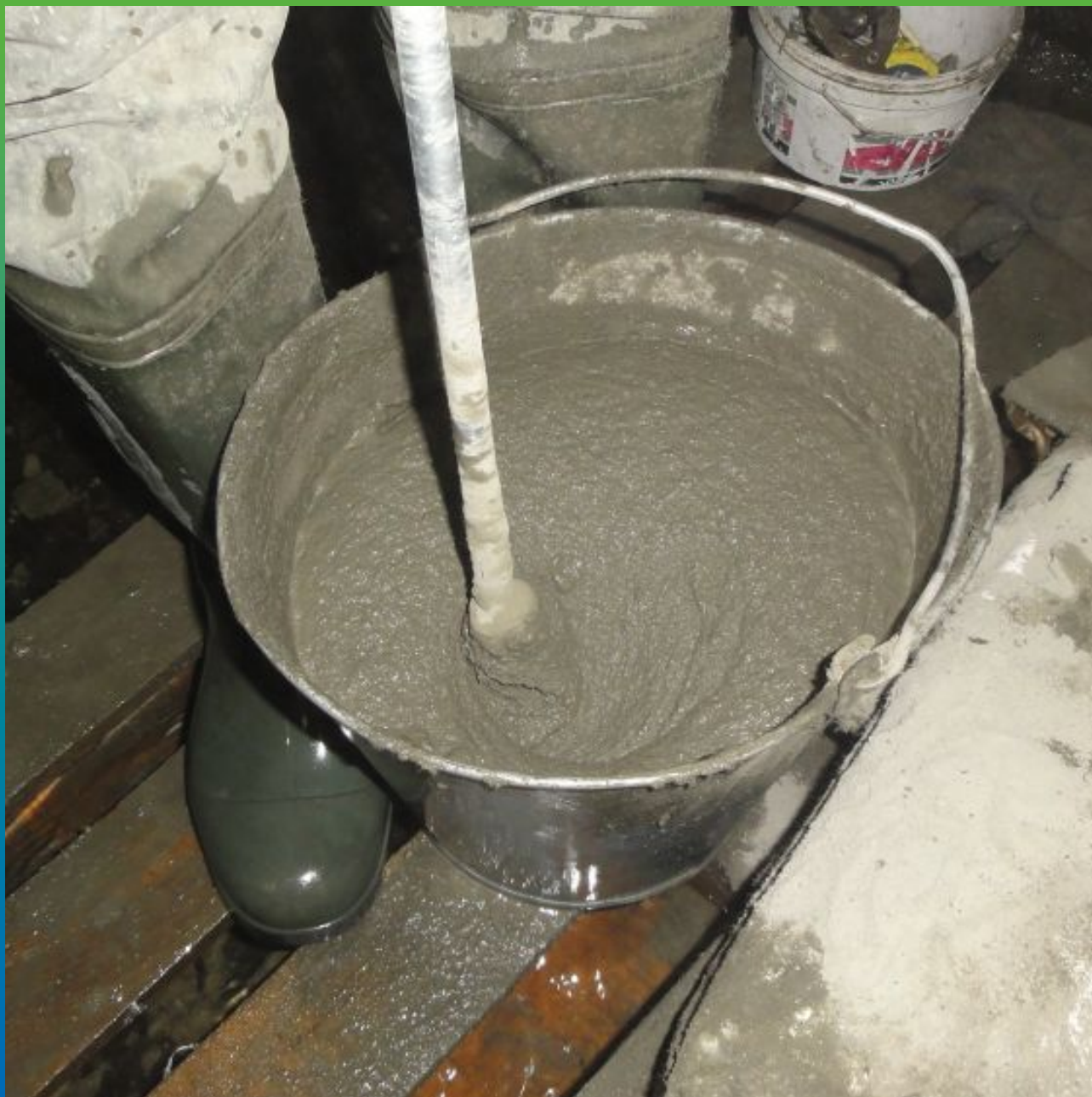
Затворение ремонтного состава Стармекс РМЗ