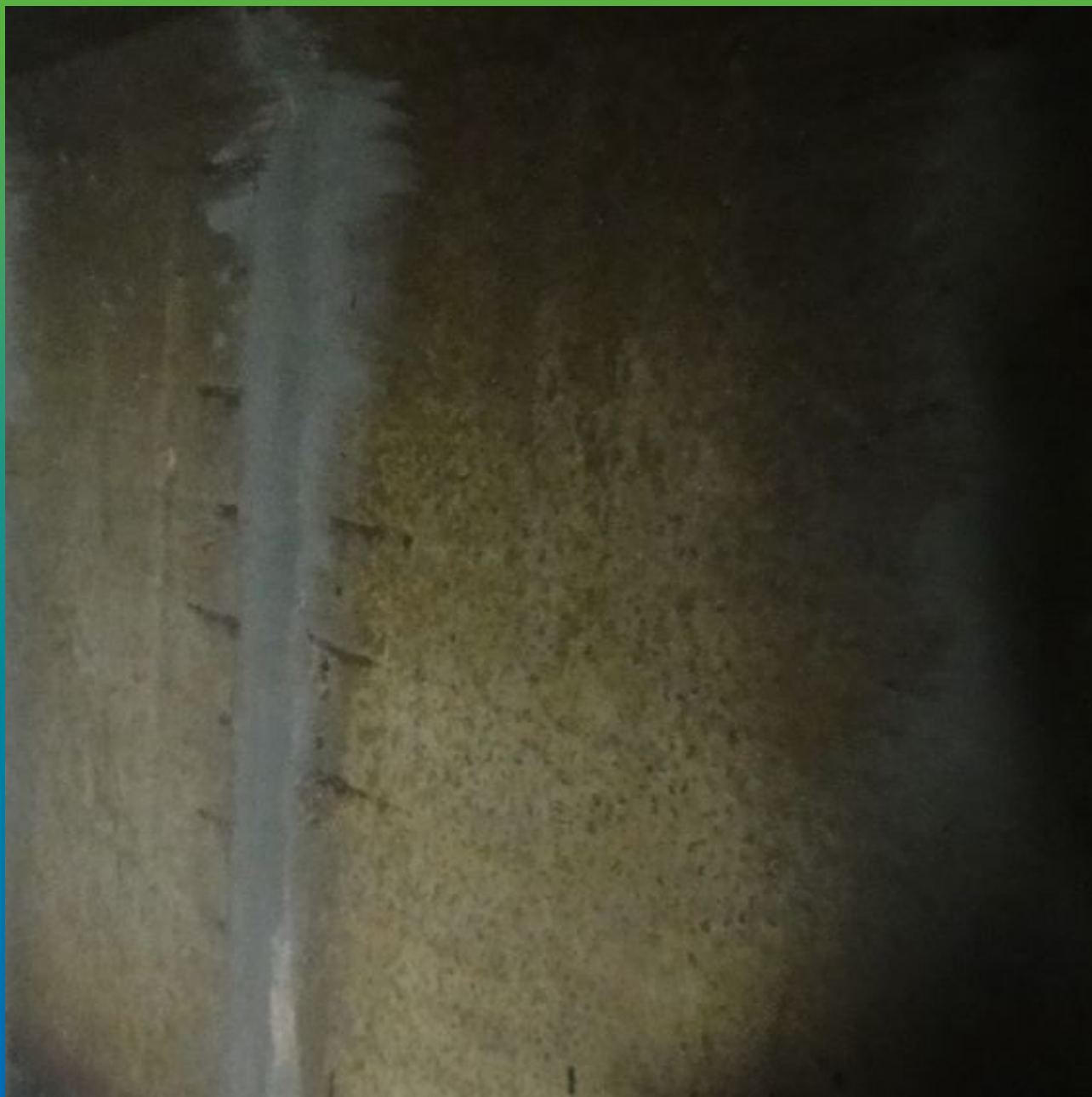
Вид отремонтированных швов