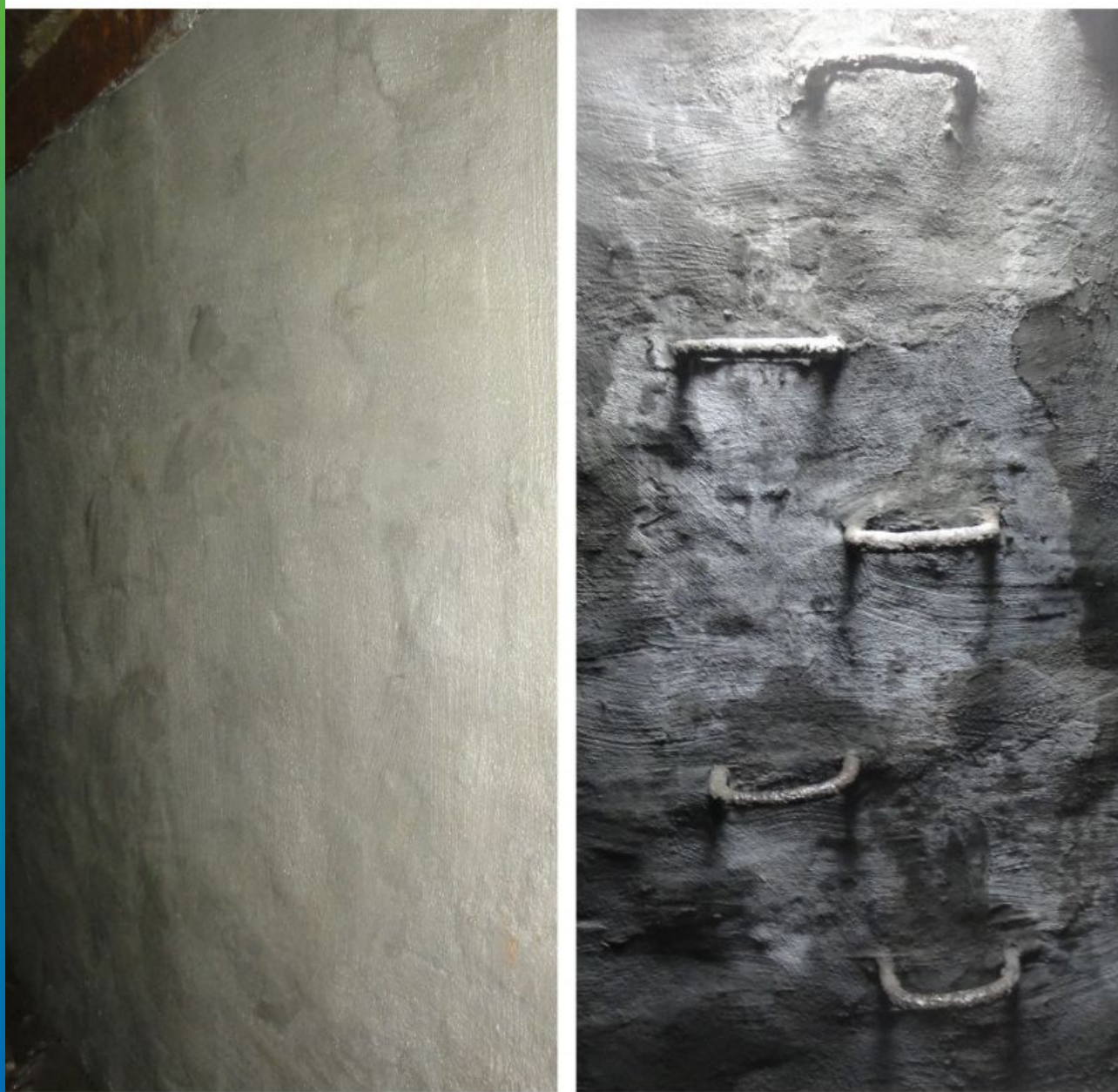
Финальный вид отремонтированной поверхности, финишный слой эластичная полимерцементная гидроизоляция Стармекс Сил Флекс