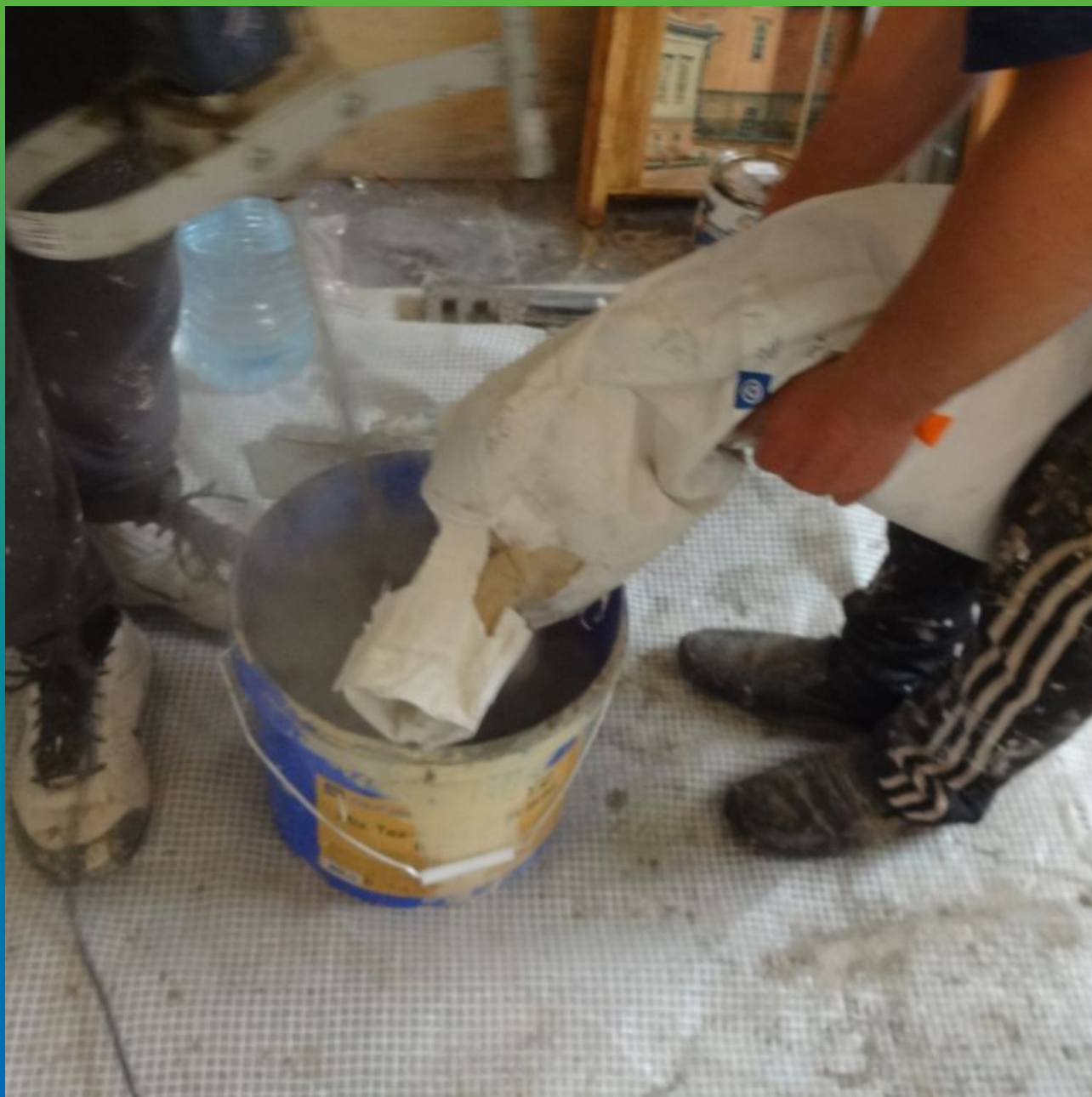
Затворение с водой инъекционного минерального состава Маноцем Фил