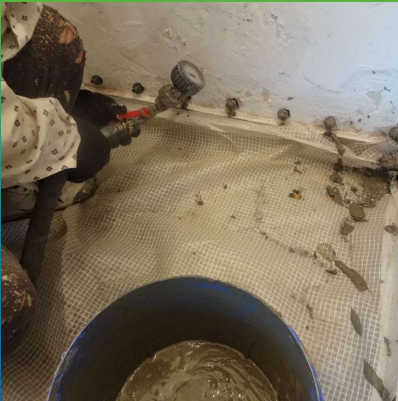
Инъектирование в кирпичную кладку Маноцем Фил