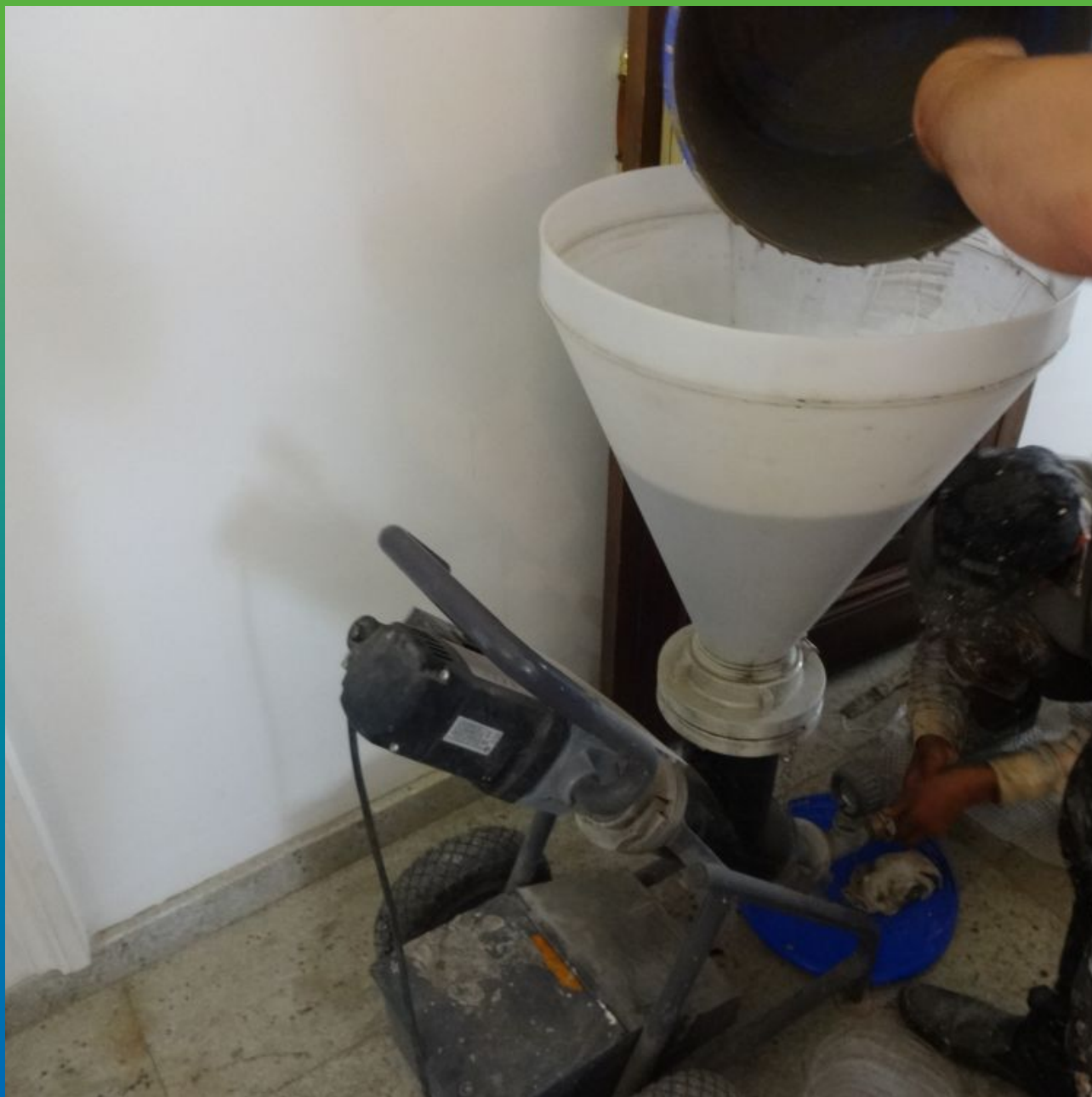
Заливка в бункер инъекционного насоса БМП-6 инъекционного состава Маноцем Фил