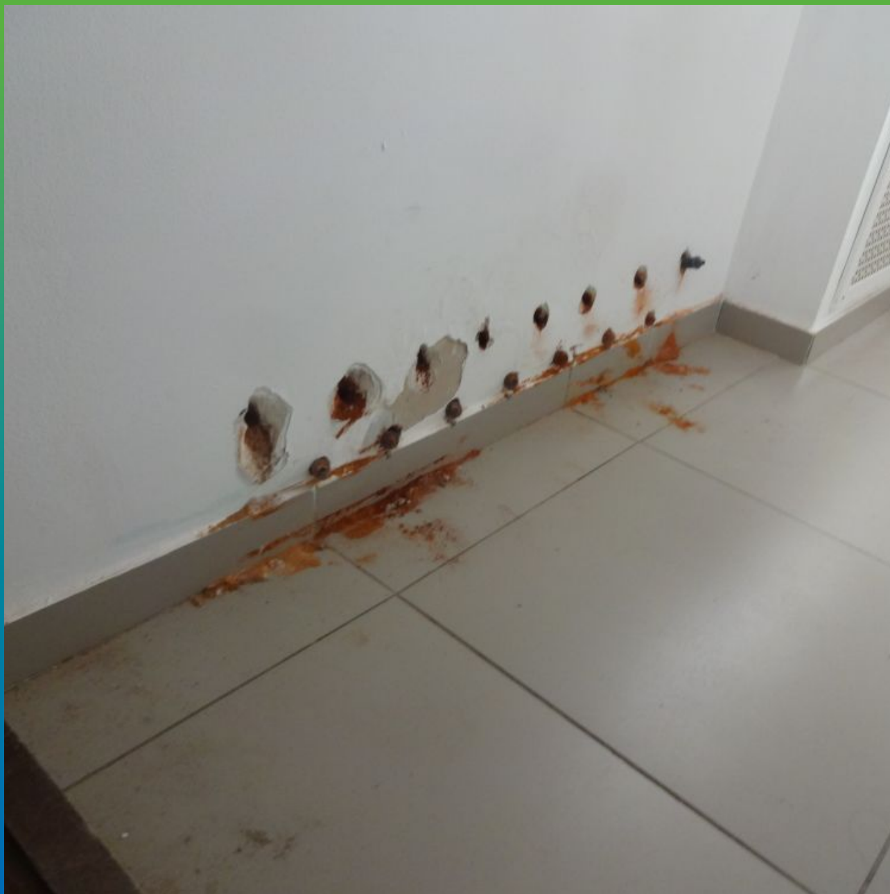
Установка пакеров БМ 2830 в пробуренные шпуры