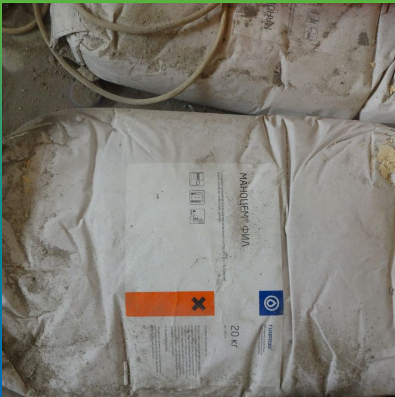
Материалы "Гидрозо" на объекте