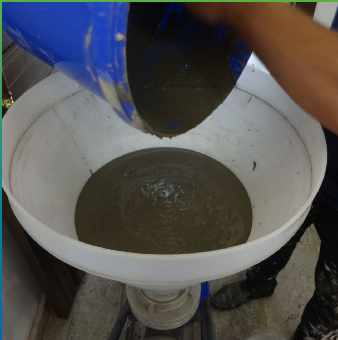
Заливка в бункер инъекционного насоса БМП-6 инъекционного состава Маноцем Фил