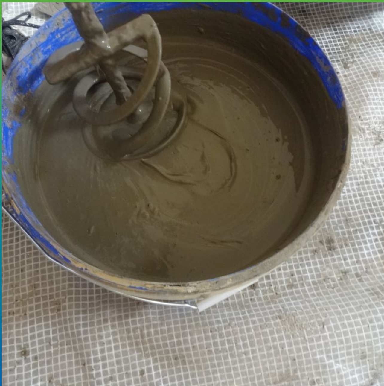
Готовый к применению инъекционный состав Маноцем Фил