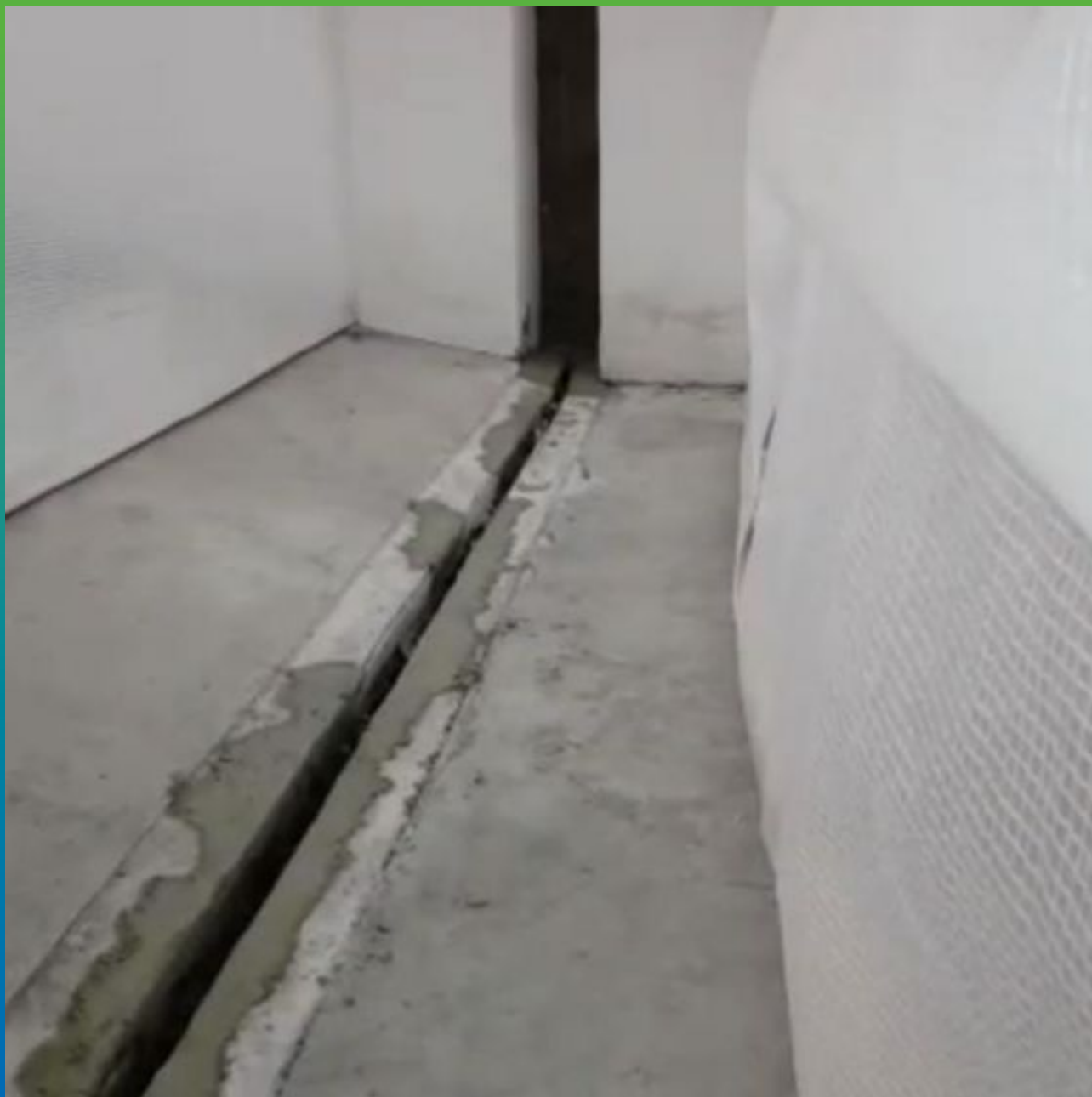
Отремонтированный шов ремонтным составом Стармекс РМЗ