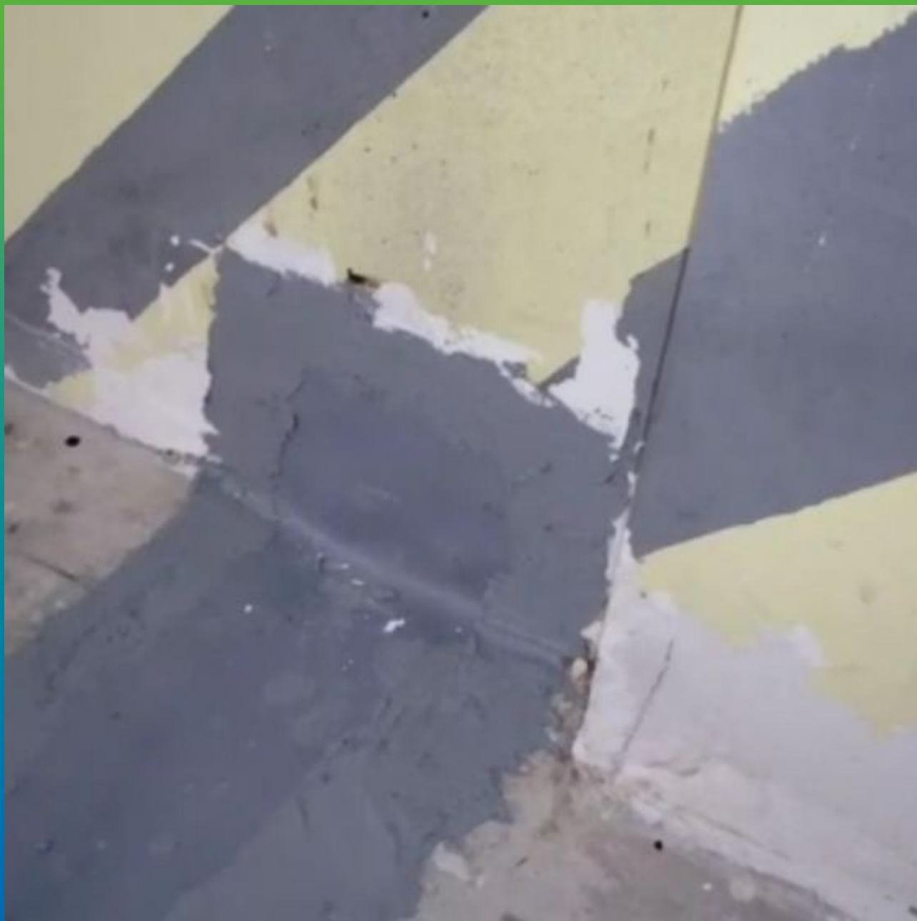
Вид шва после выполненных работ