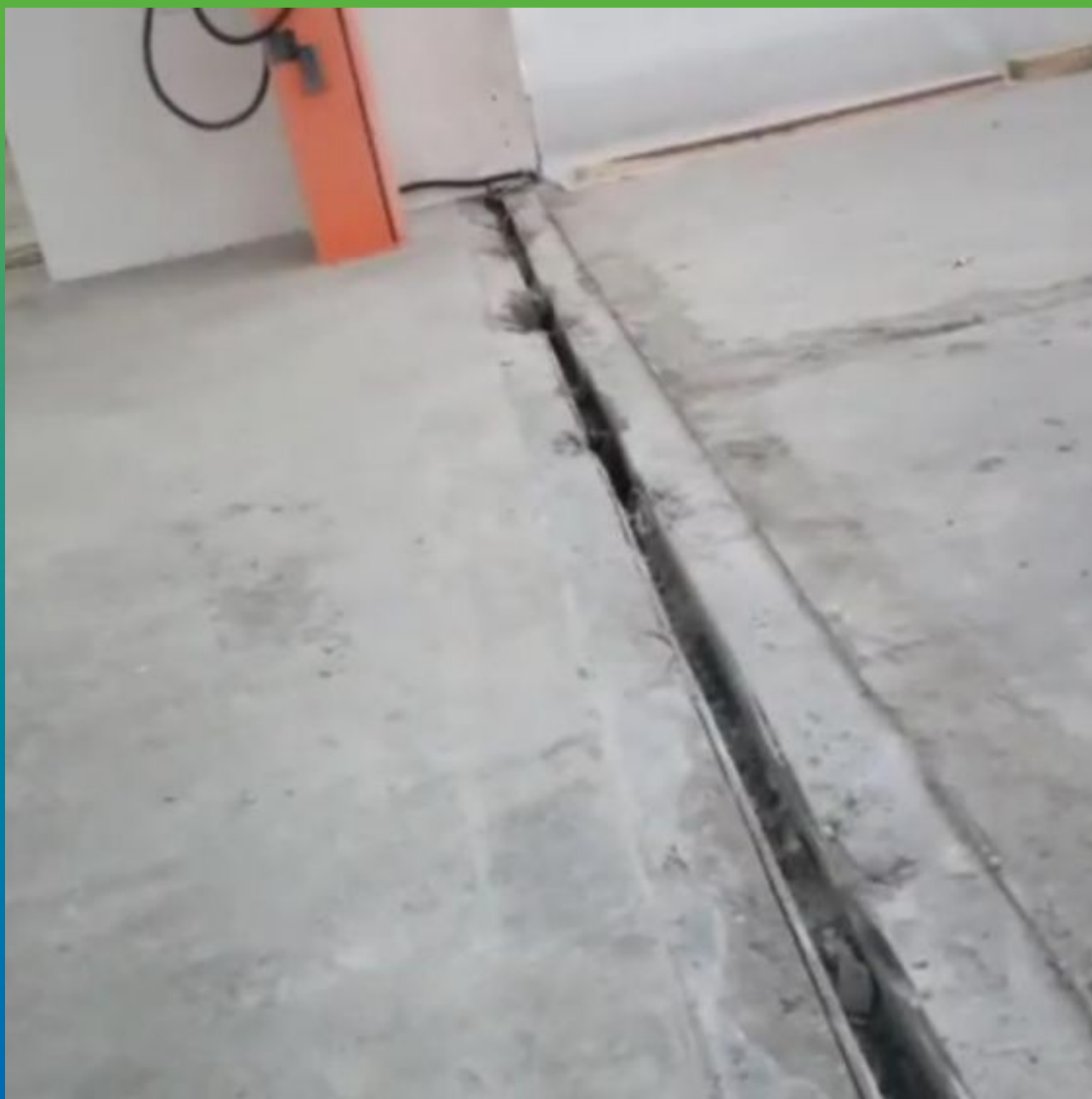
Первоначальный вид деформационного шва