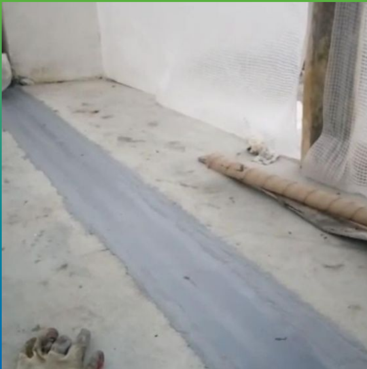
Приклейка ленты Манодил Про