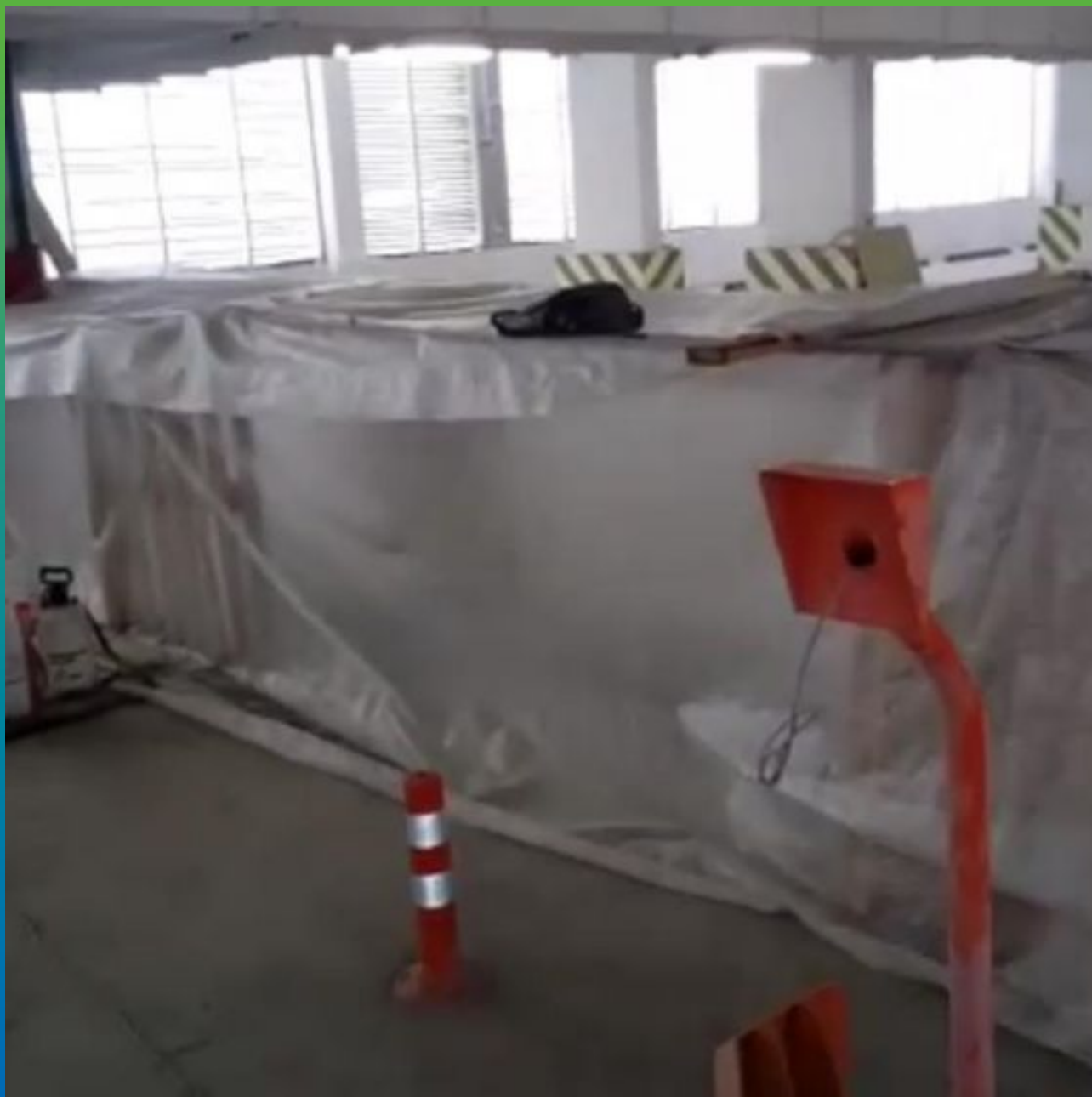
Устройство тепляка для работ