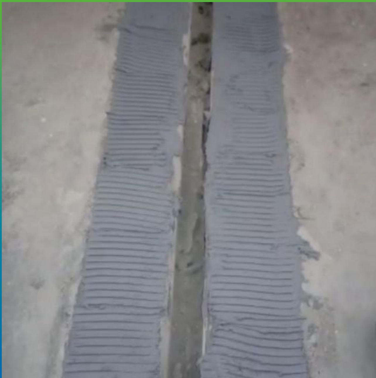
Деформационный шов с нанесенным клеем Манопокс 331 по краям перед приклейкой ленты Манодил Про