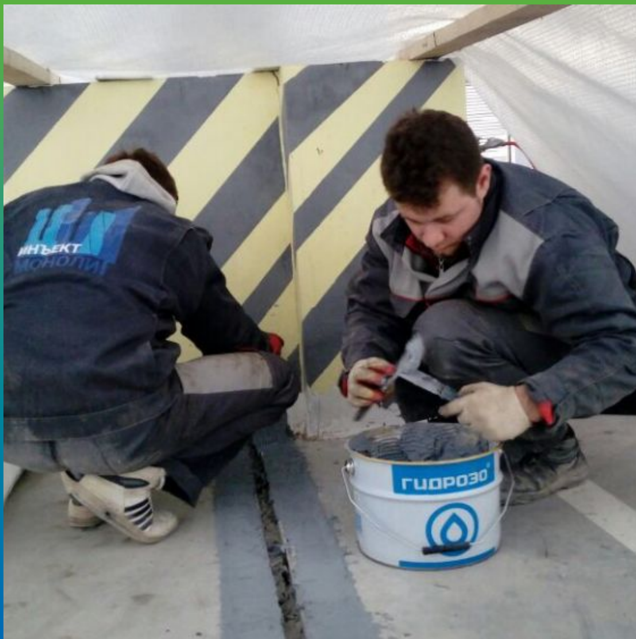
Приготовление клея Манопокс 331 и нанесение по краям шва