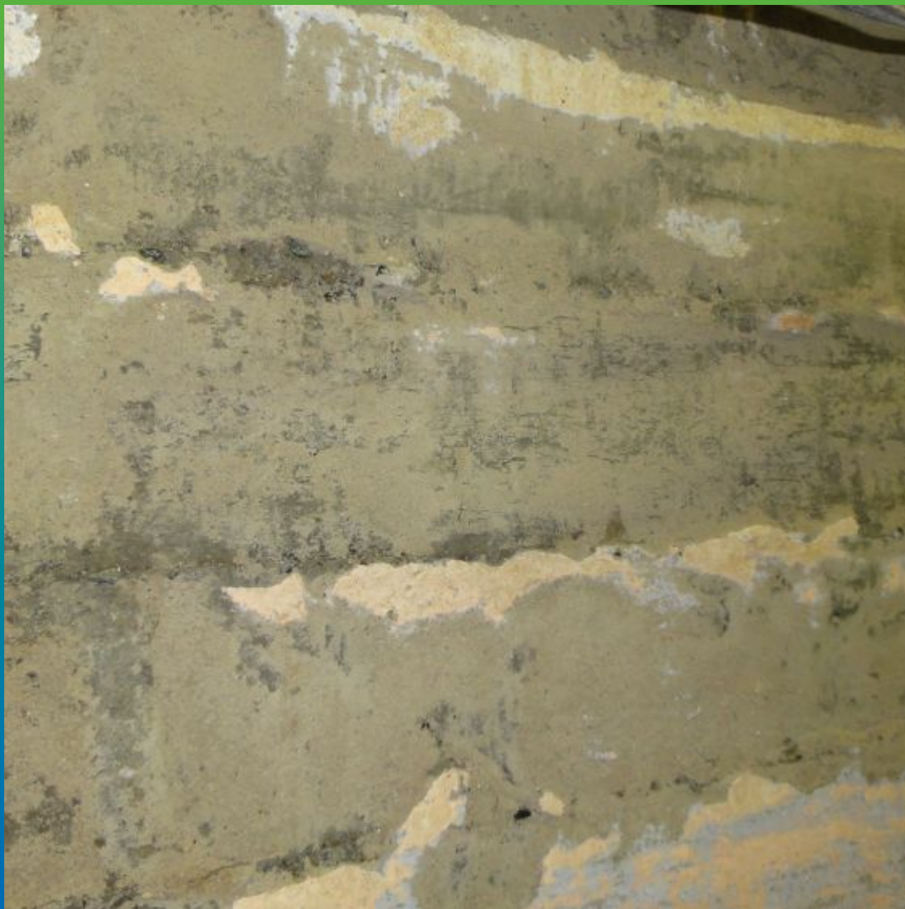
Первоначальный вид поверхности