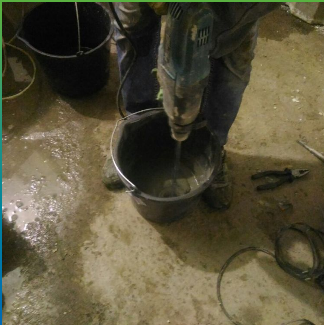
Затворение ремонтного состава Стармекс РМ 3