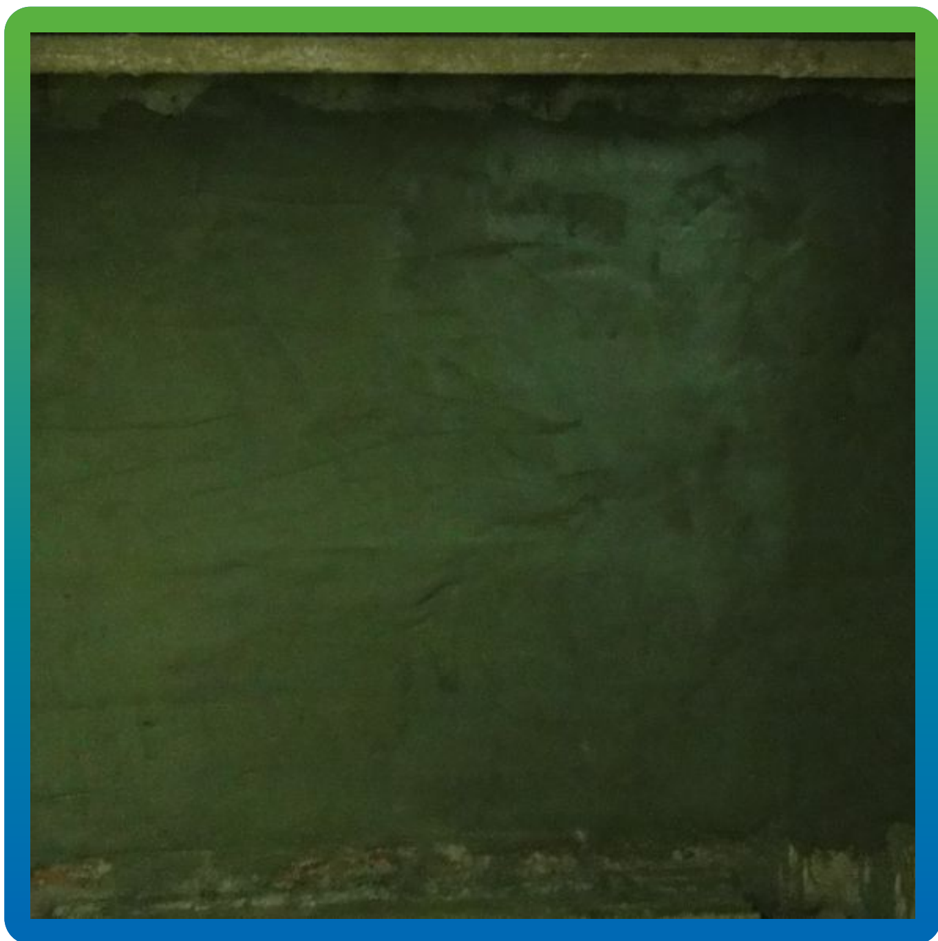
Финальный вид отремонтированной поверхности