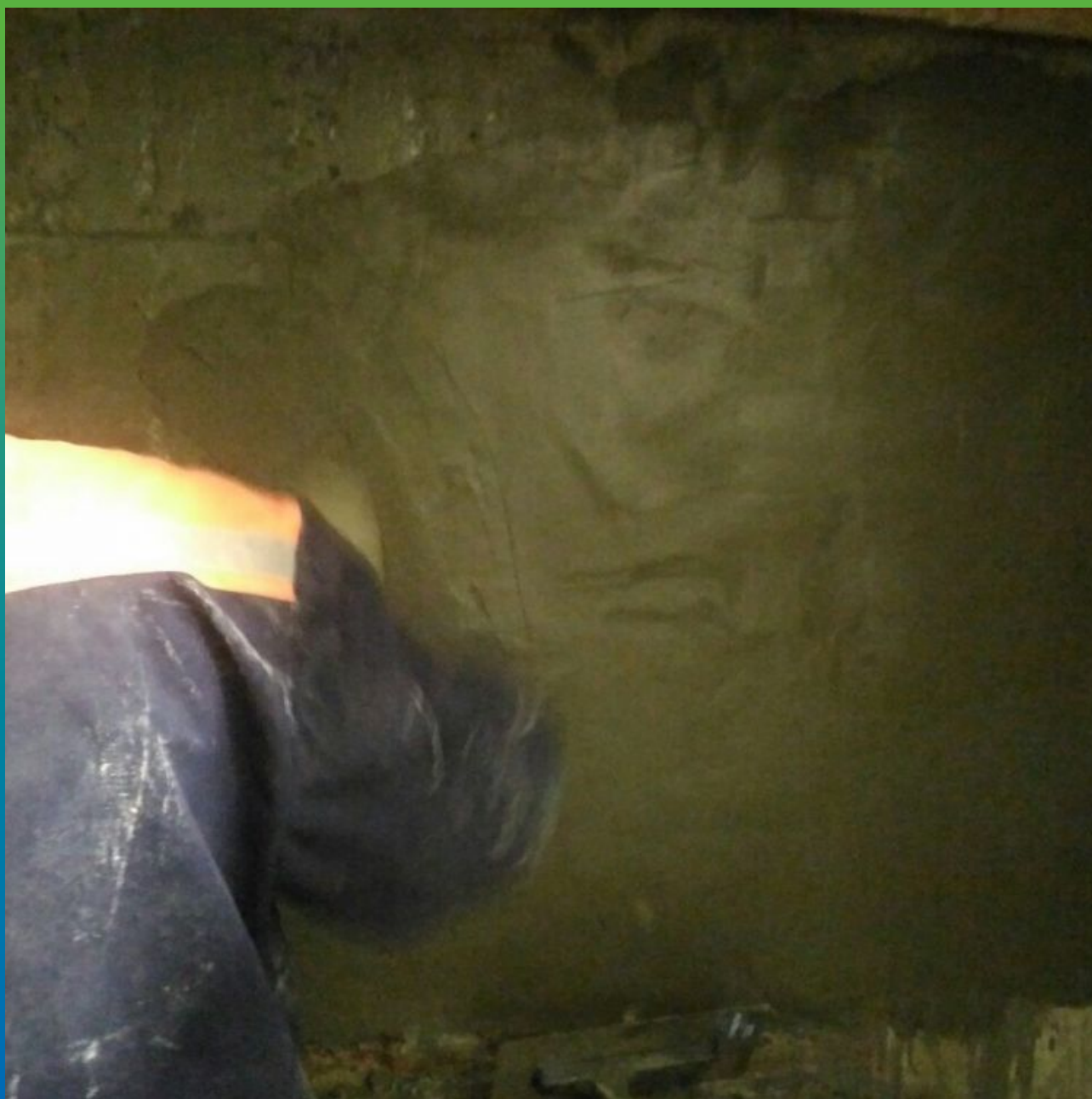
Нанесение ремонтного состава Стармекс РМ 3