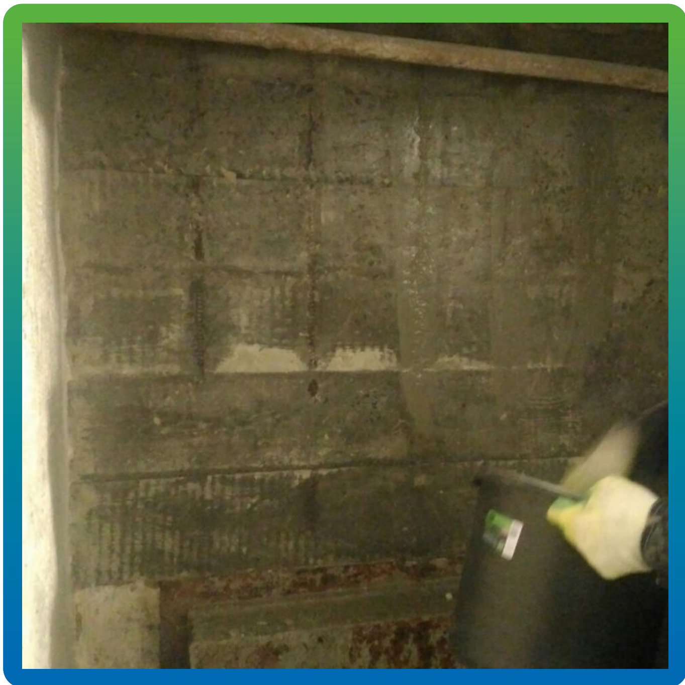
Нанесение грунтовочного состава с ингибиторами коррозии Стармекс МКП