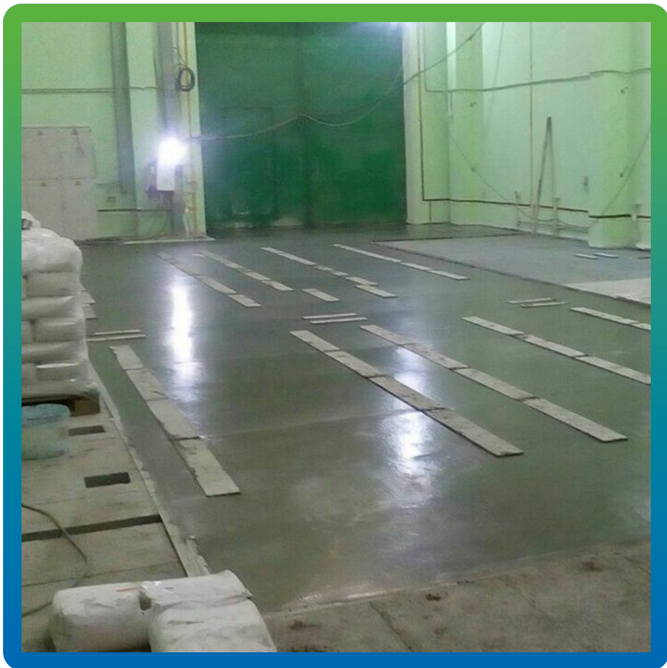
Объект после проведения работ по заливке высокопрочной стяжки