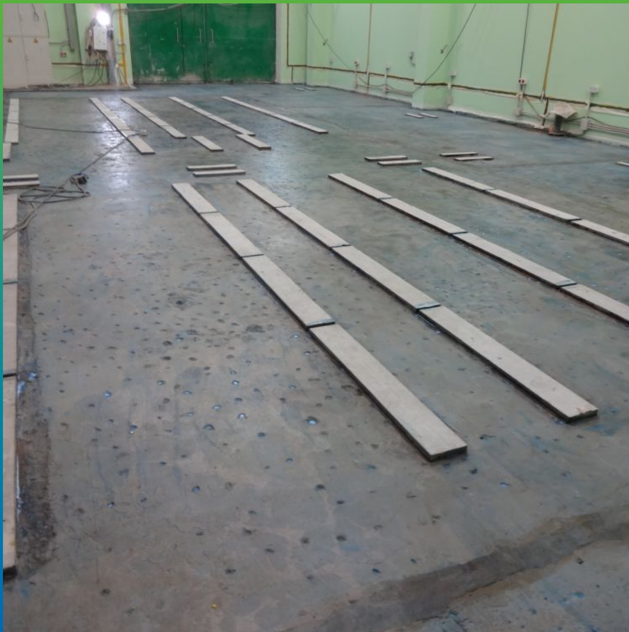
Грунтовка основания Манокрил Бонд на основе акриловых смол