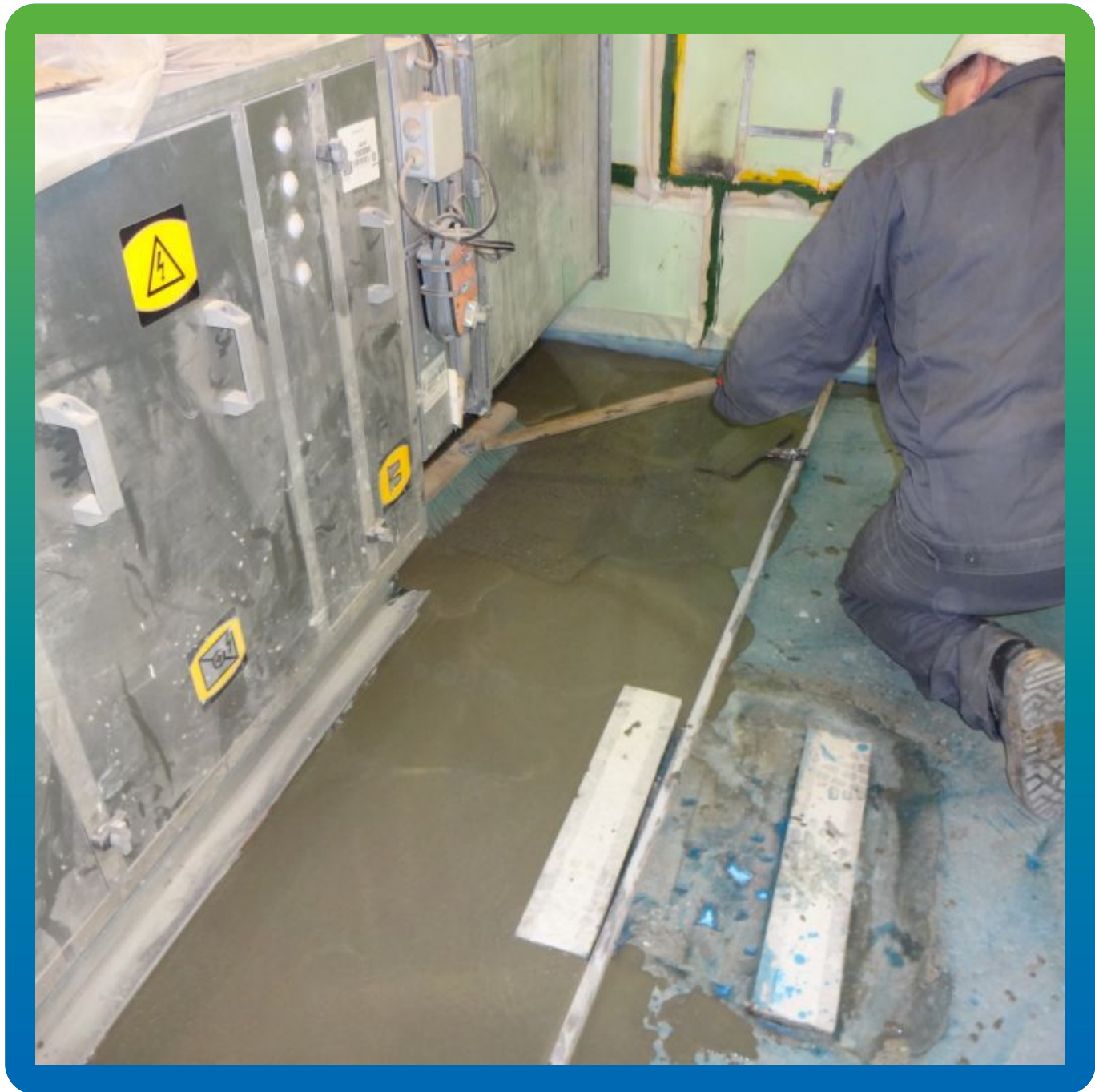
Монтаж высокопрочной стяжки