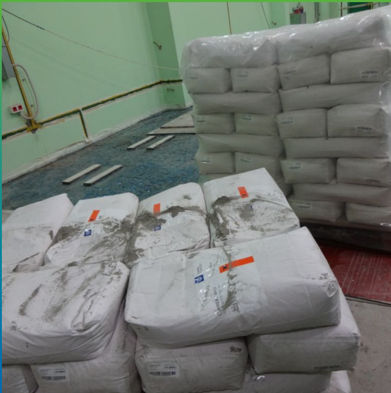
Материалы "Гидрозо" на объекте