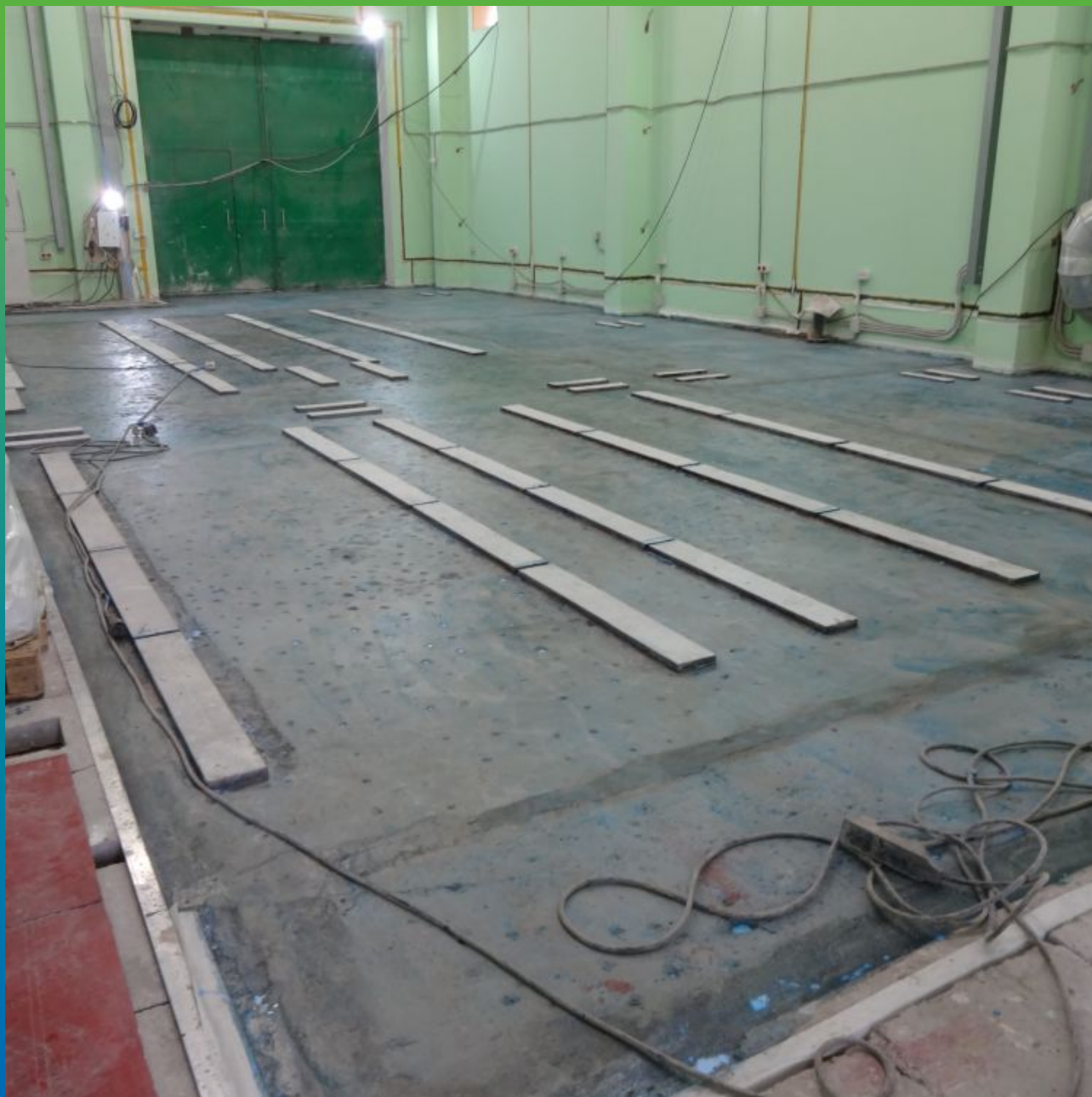
Грунтовка основания Манокрил Бонд на основе акриловых смол