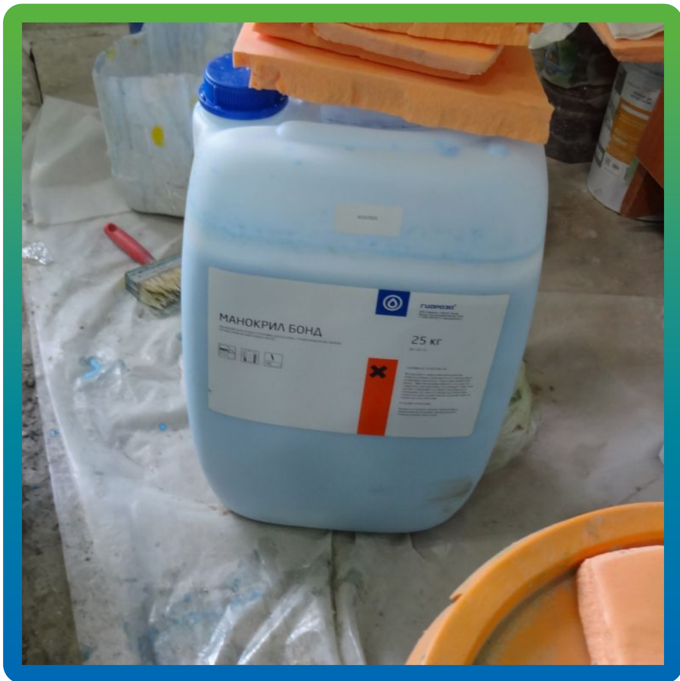
Материалы "Гидрозо" на объекте