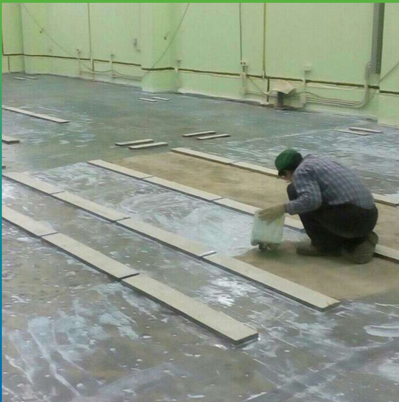
Грунтовка основания Манокрил Бонд на основе акриловых смол