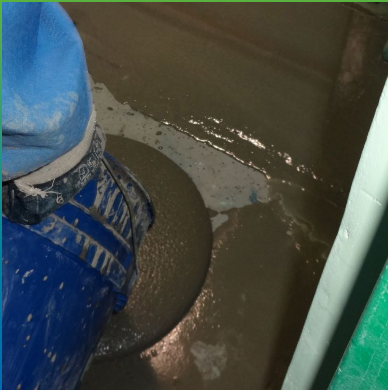
Монтаж высокопрочной стяжки