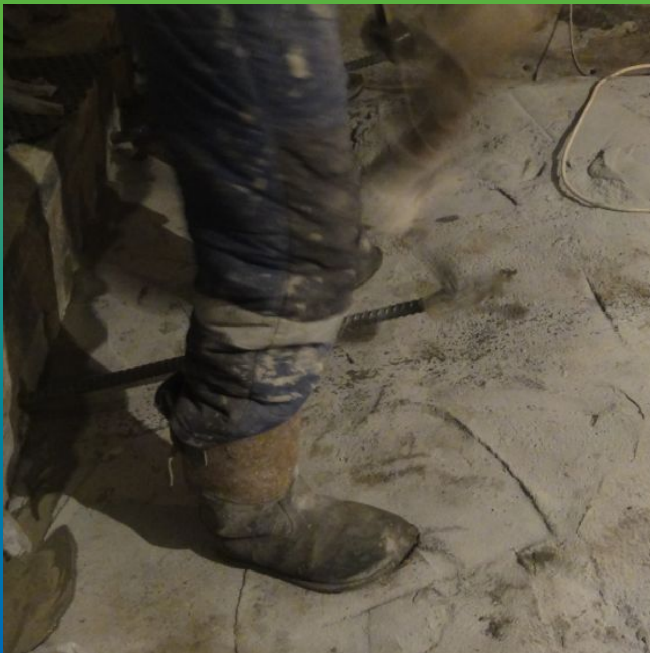
Установка анкеров в отверстия заполненные Маноцем Грут