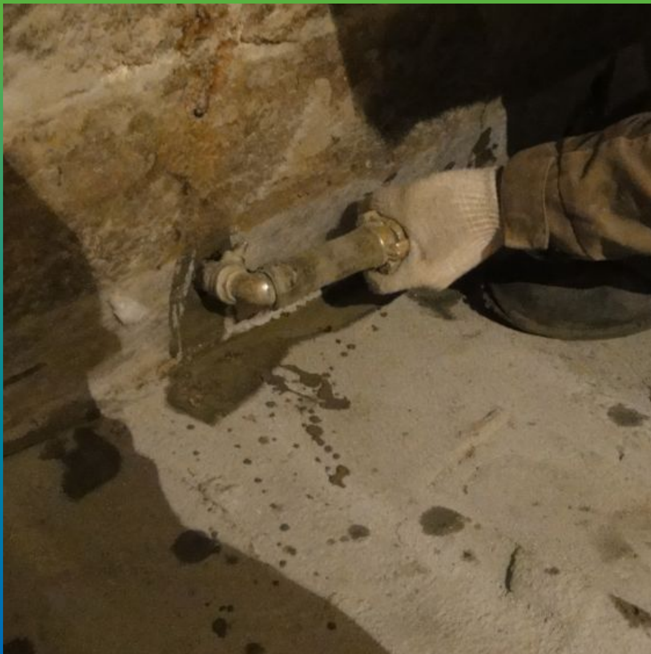
Инъектирование маночем грут в подготовленные шпурь