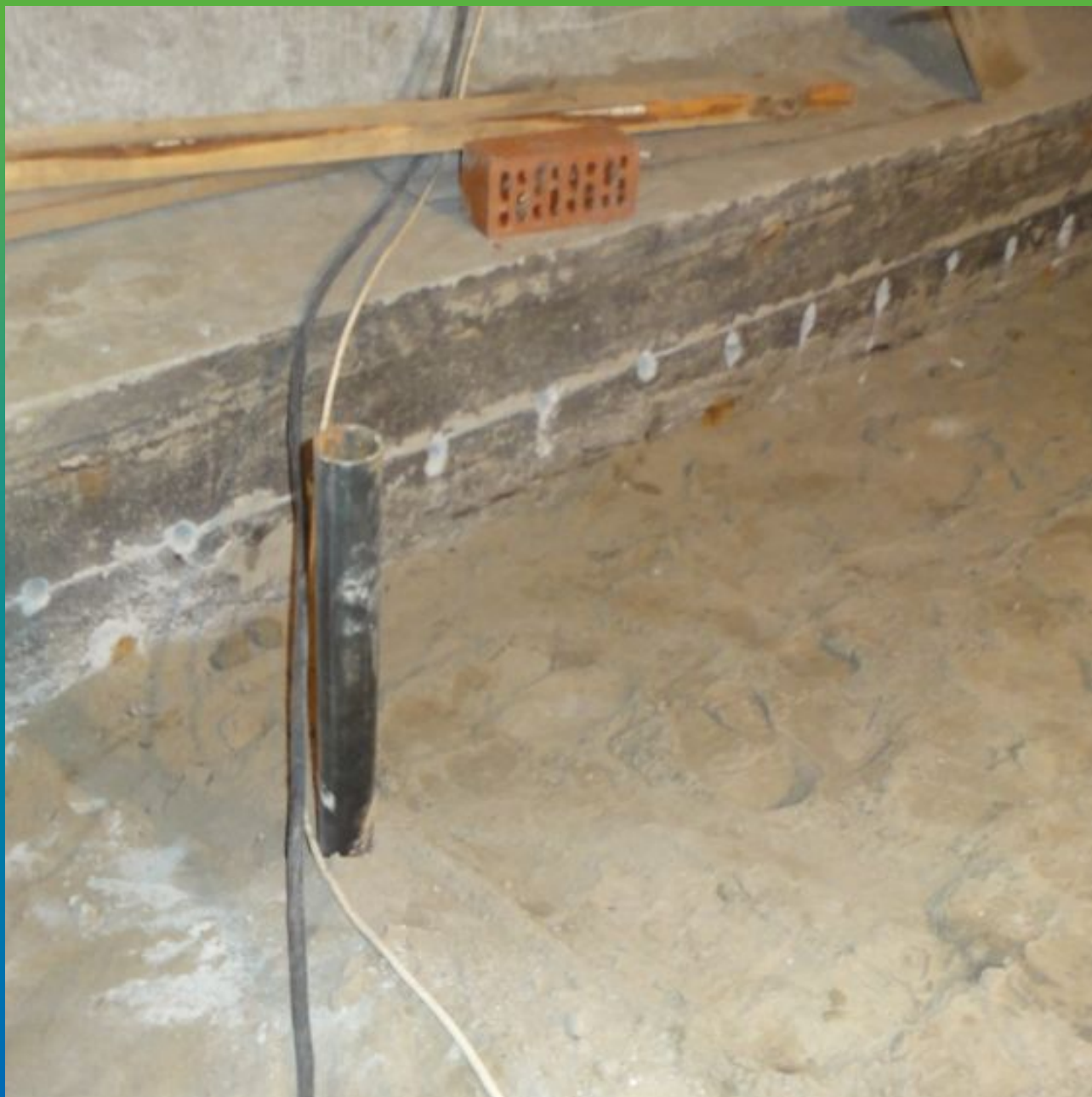
Устройство шпуров под анкера