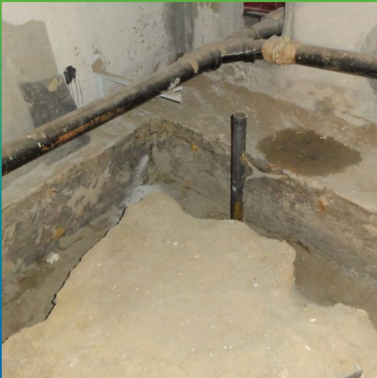
Первоначальный вид усиливаемого участка