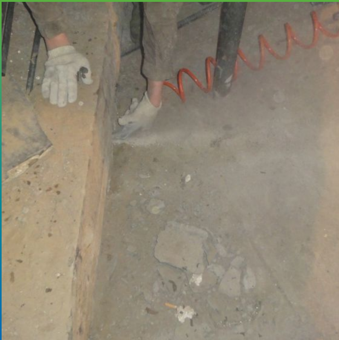
Продувка отверстий (шпуров) сжатым воздухом