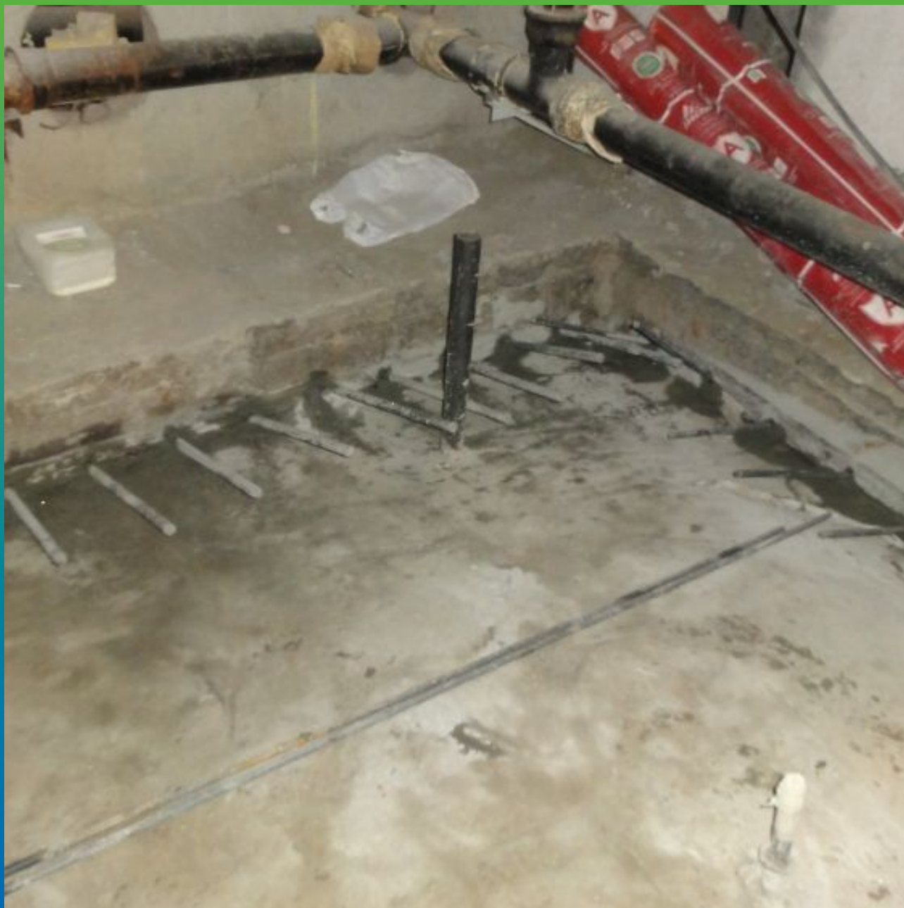
Финальный вид участка