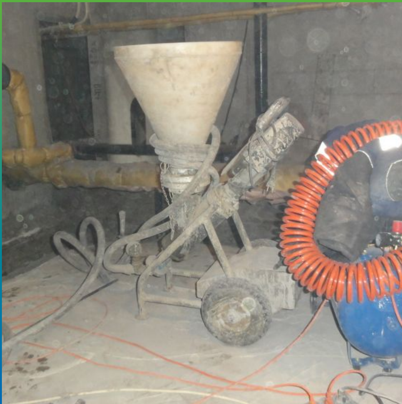
Оборудование - электрический шнековый насос БМП 6