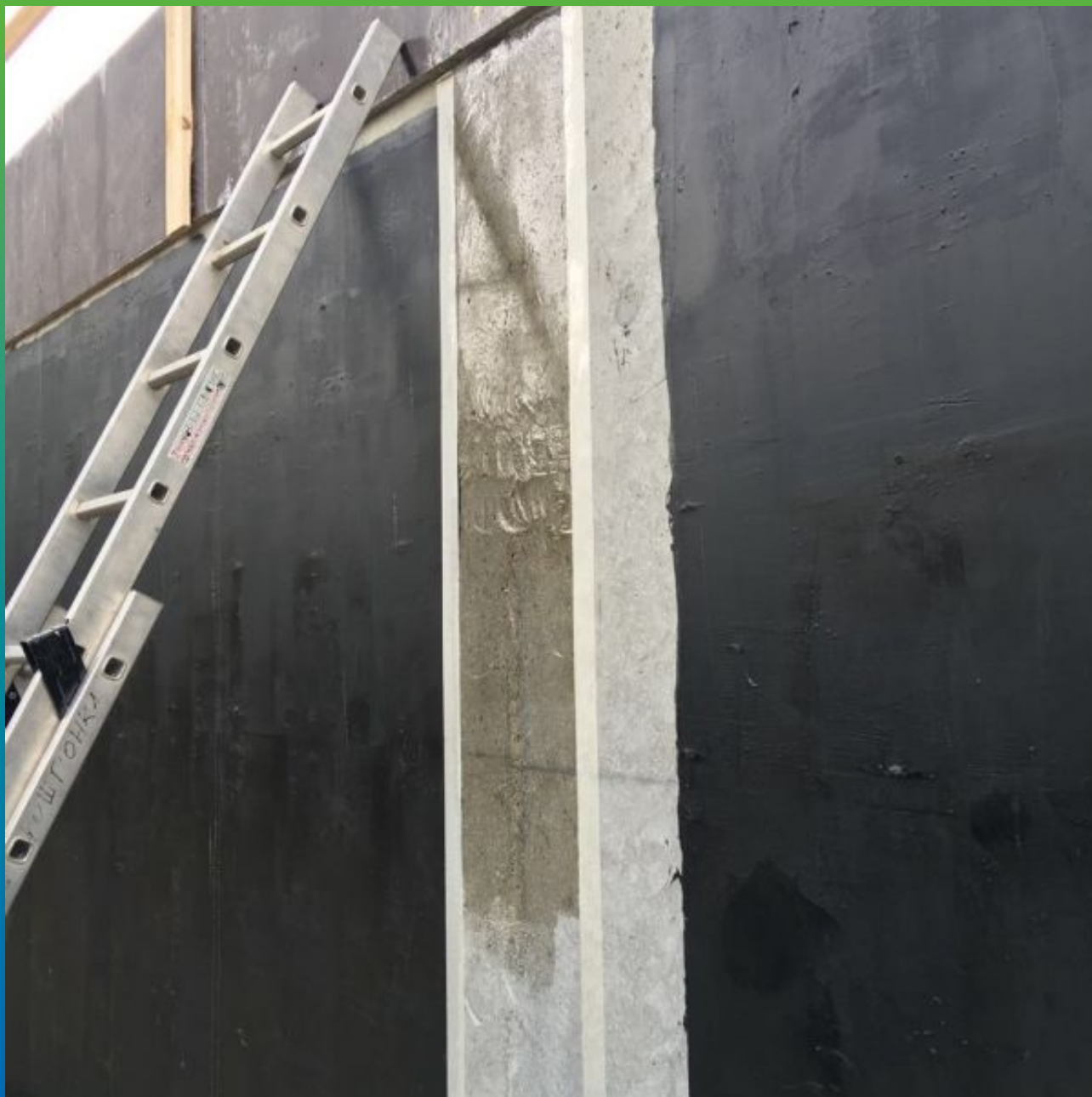
Нанесение грунтовочного слоя Денстоп "G 106 на предварительно отшлифованную поверхность