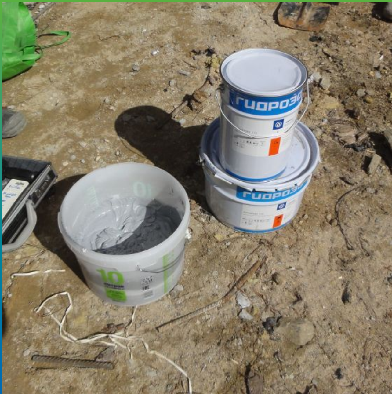
Вид затворенного состава