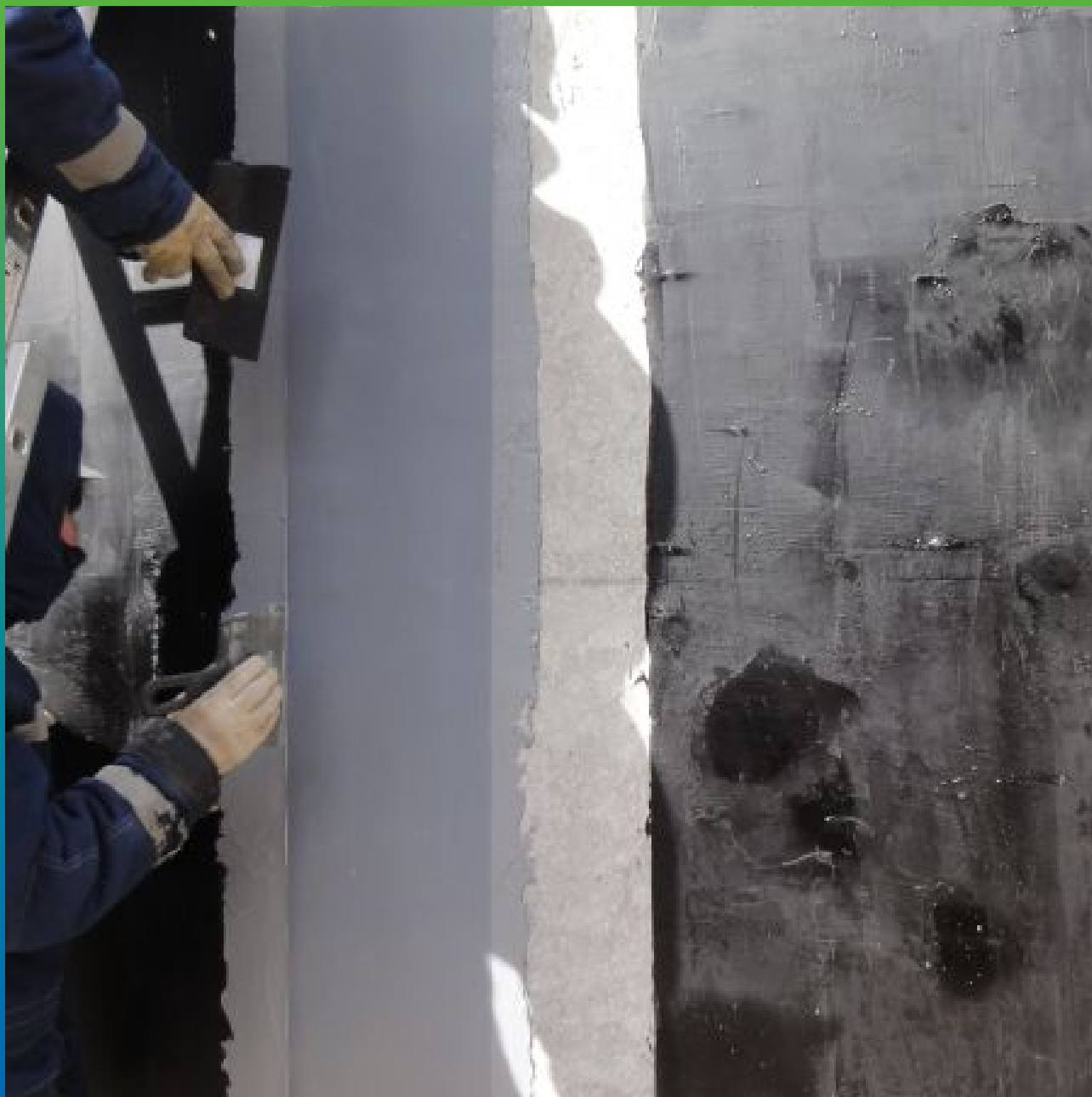
Приклеивание ленты Манодил Про на клей Манопокс 331