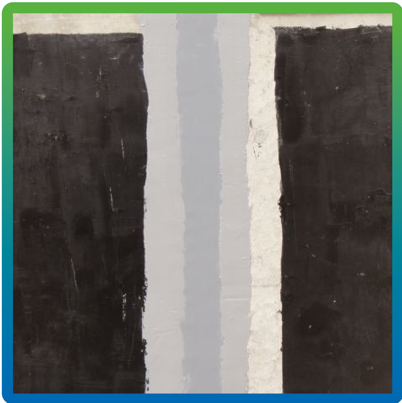
Финальный вид шва