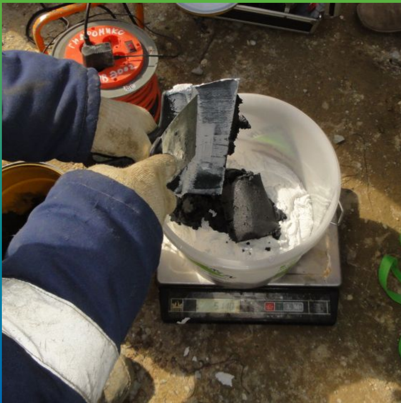
Затворение эпоксидного клея - Манопокс 331