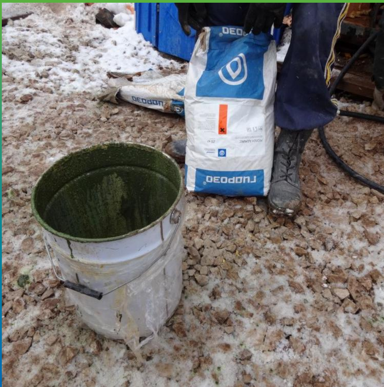
Приготовление раствора добавки Реолен Адмикс с водой