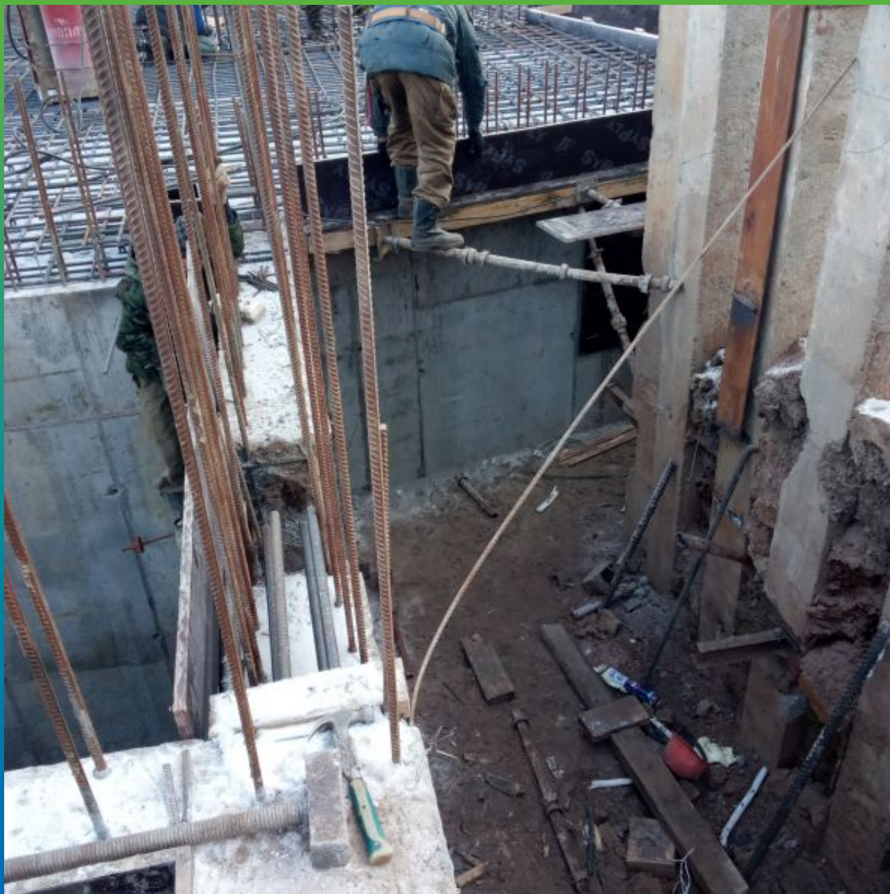
Подготовка основания под набухающий профиль Манодил Свелл