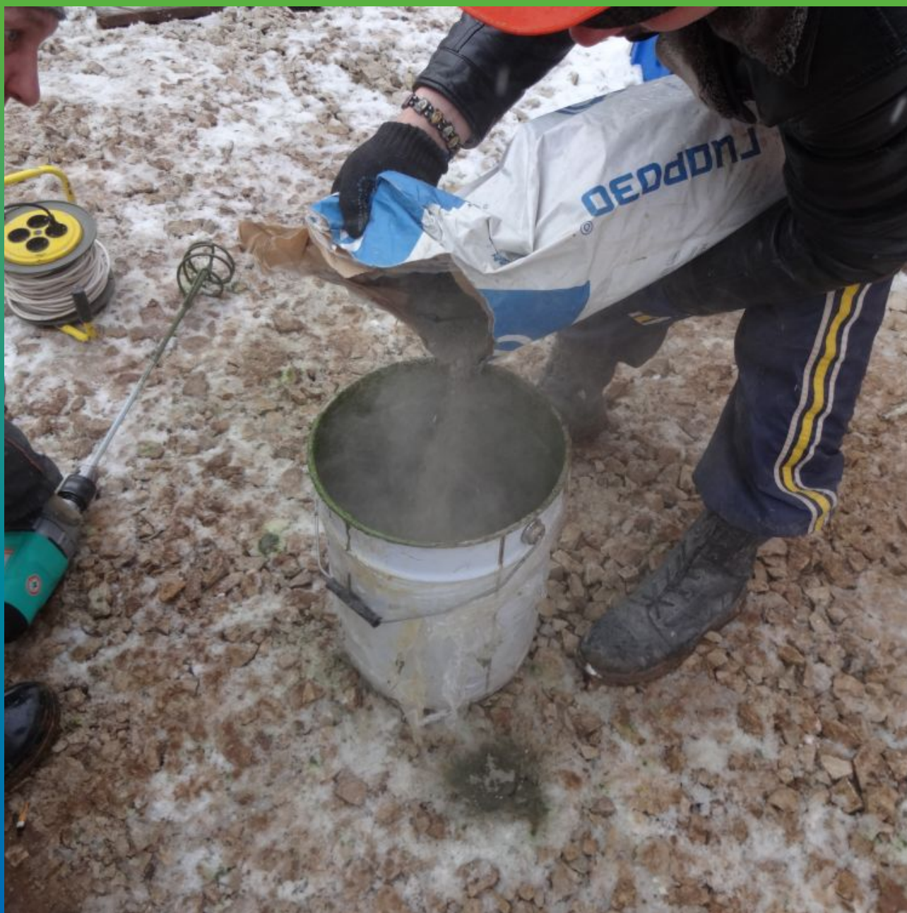
Приготовление раствора добавки Реолен Адмикс с водой