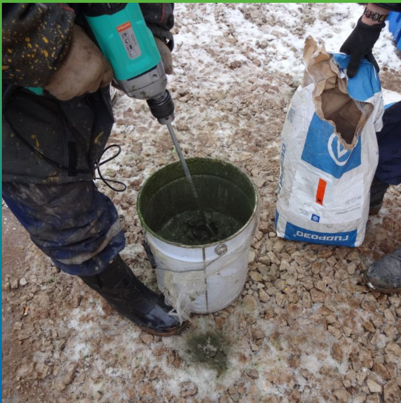
Приготовление раствора добавки Реолен Адмикс с водой