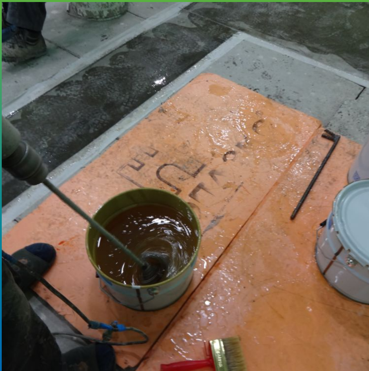
Перемешивание грунтовки ДенсТоп ЭП 106