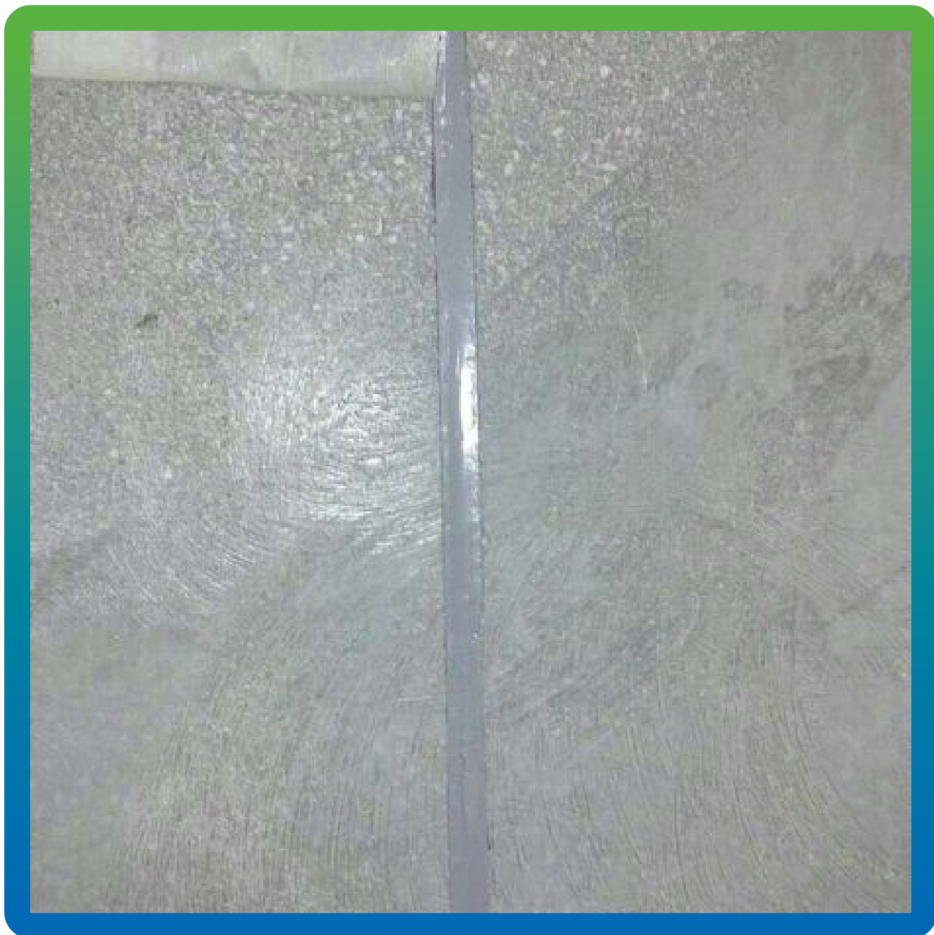
Заполнение швов герметиком Манодил ПУ 696