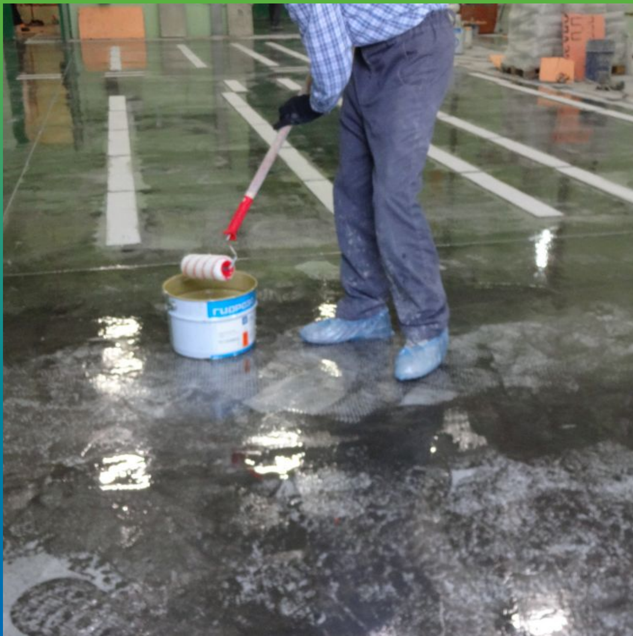
Нанесение грунтовки ДенТоп ЭП 106 на основание