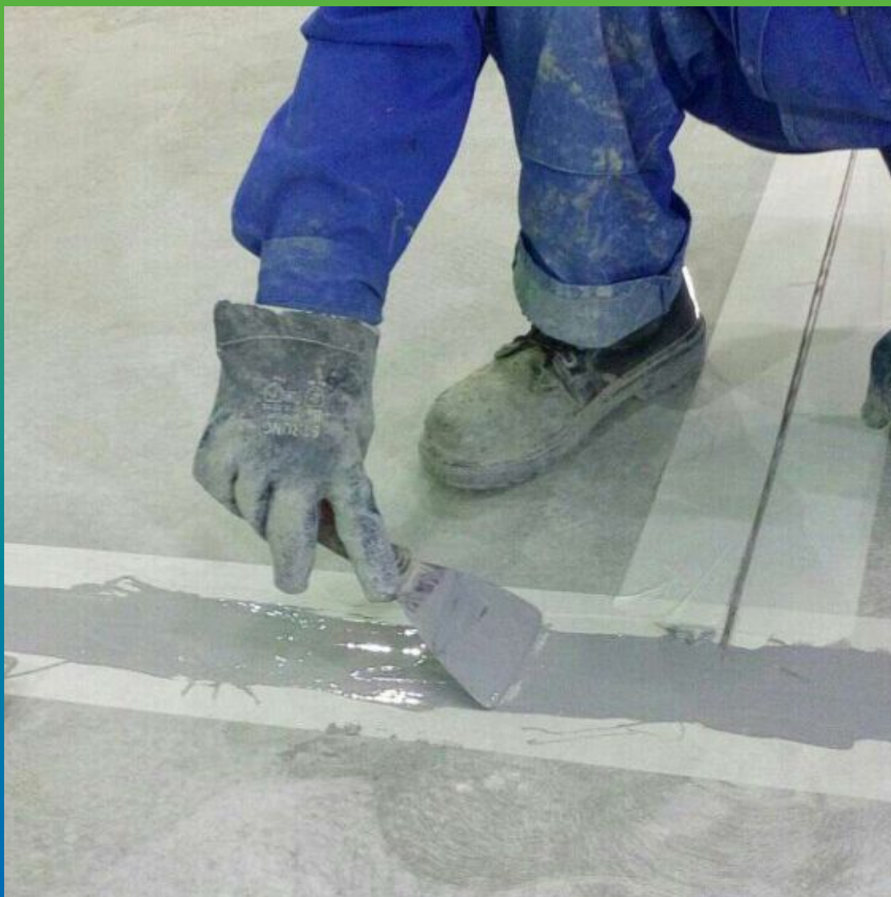
Заполнение швов герметиком Манодил ПУ 696