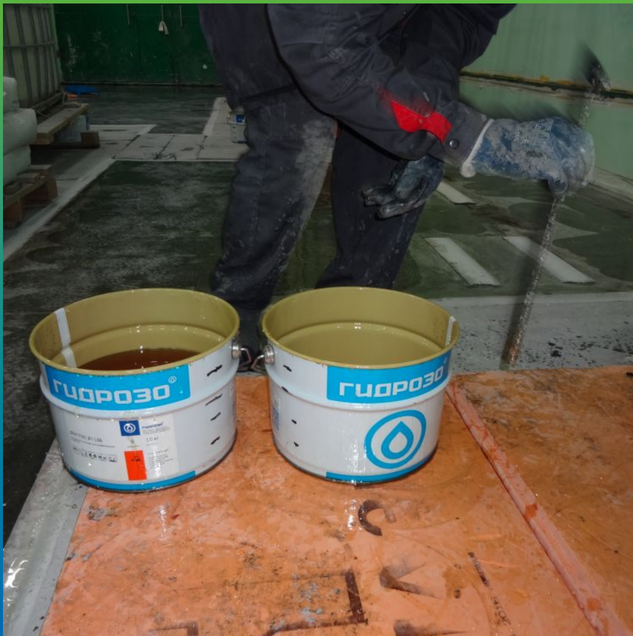
Затворение А+Б компонентов грунтовки для влажных оснований ДенСтол ЭП 106