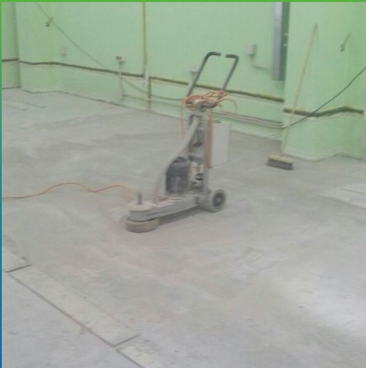
Подготовка основания под полимеры