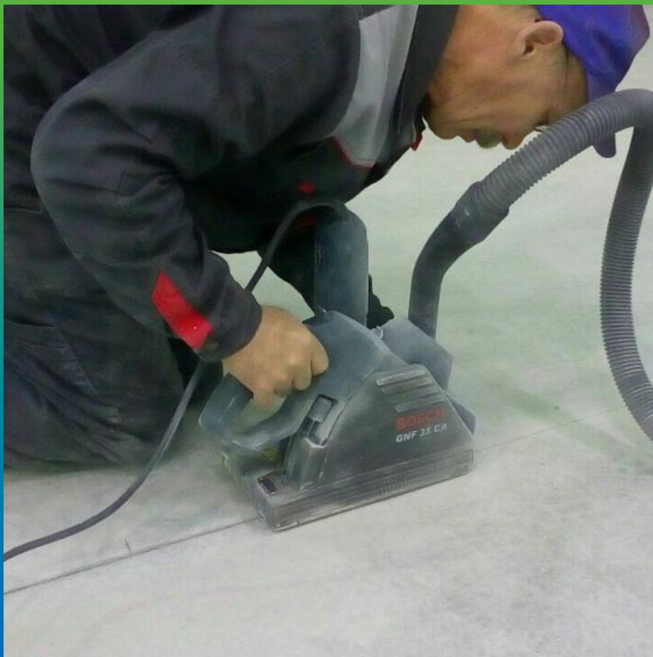
Нарезка температурных швов