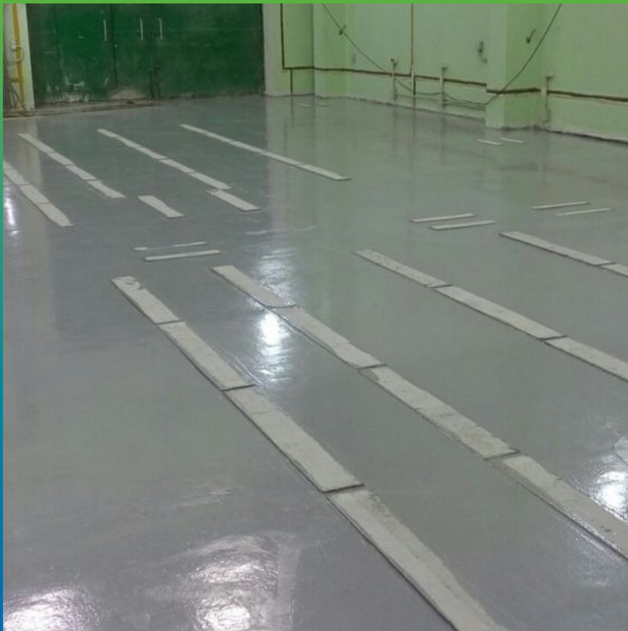
Финишное эпоксидное покрытие - ДенсТоп ЭП 201